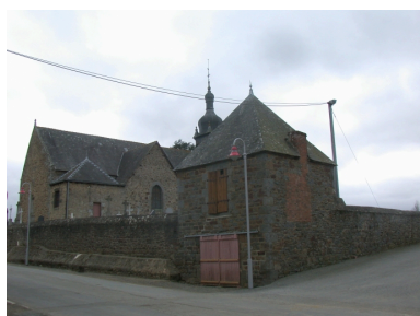
Pavillon Nord-Est, vue générale arrière IVR53_20063509580NUCA