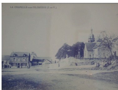
Carte postale du début du siècle, reproduction (dépôt, mairie) IVR53_20063509742NUCA