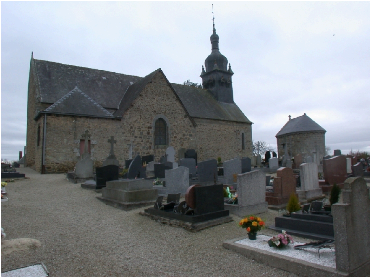
Façade Sud, vue actuelle