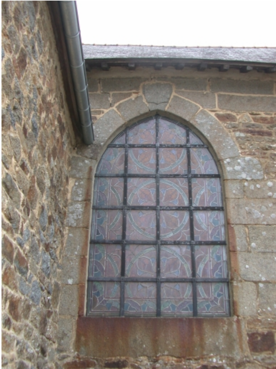
Façade Nord, baie et armoiries