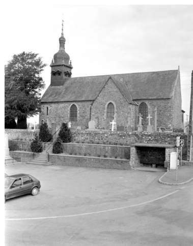
Élévation Sud : vue générale IVR53_19943500744X