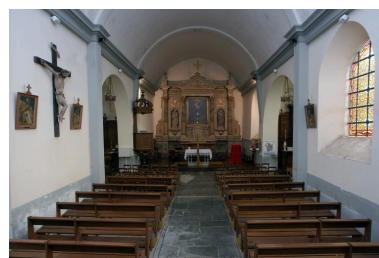
Vue intérieure prise de la nef vers le chœur IVR53_20063500699NUCA