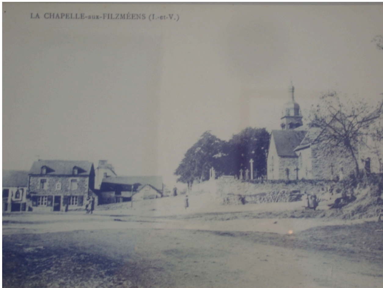
Carte postale du début du siècle, reproduction (dépôt, mairie)