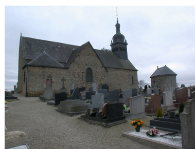
Façade Sud, vue actuelle