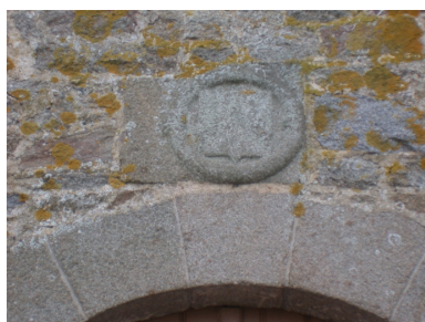
Façade Est, armoiries