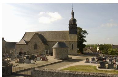
Façade Nord, vue générale actuelle