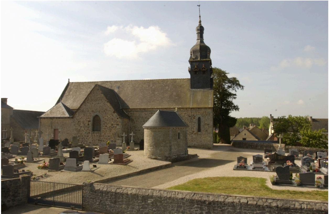
Façade Nord, vue générale actuelle