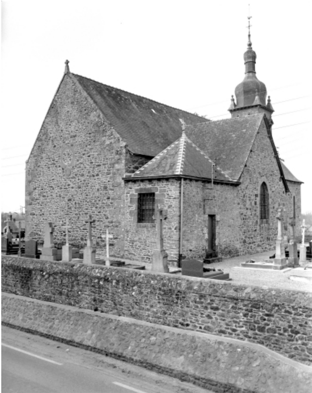
Elévation Est : vue générale