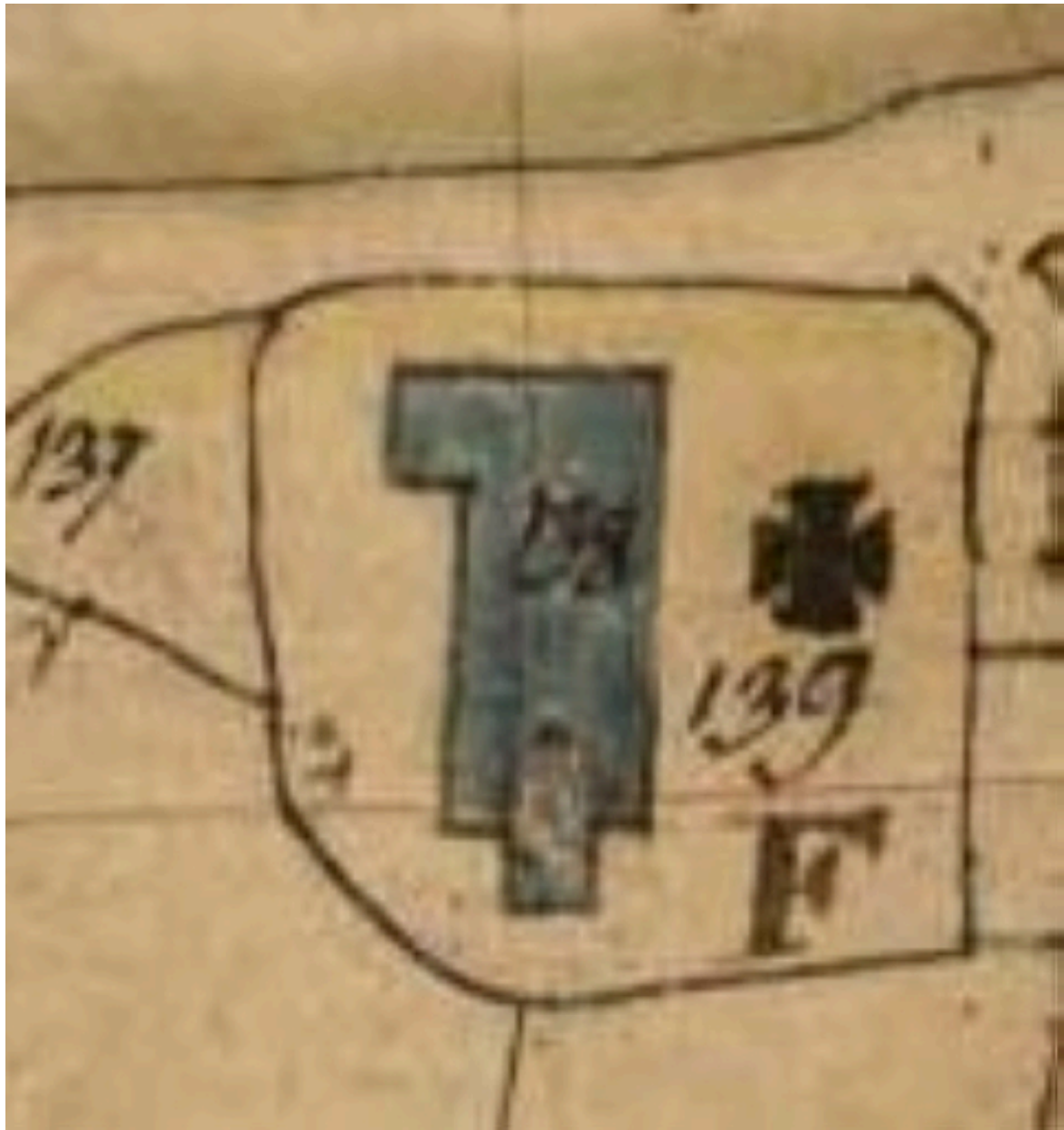
Extrait du cadastre de 1834