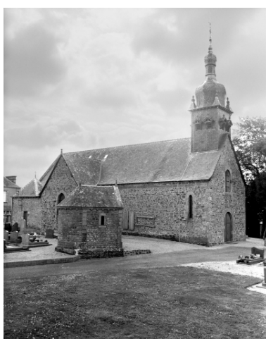
Élévation Nord-Ouest : vue générale, IVR53_19943500742X