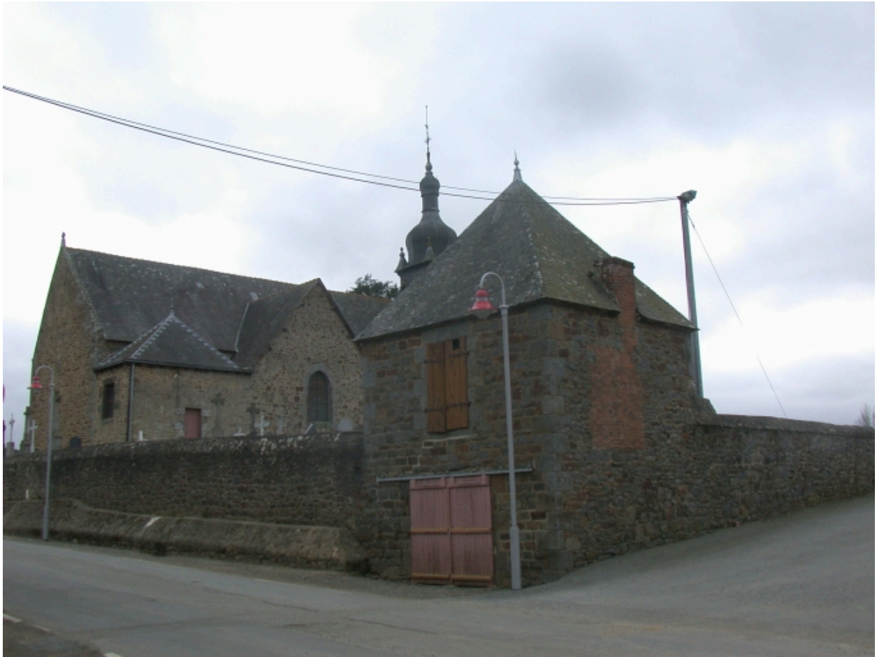
Pavillon Nord-Est, vue générale arrière