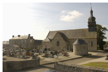
Façade Nord, vue générale actuelle IVR53_20063501062NUCA