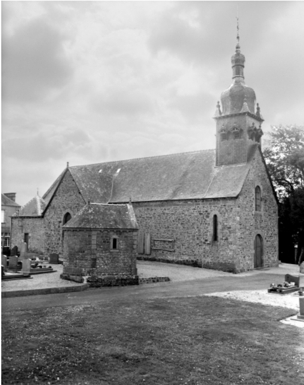
Elévation Nord-Ouest : vue générale