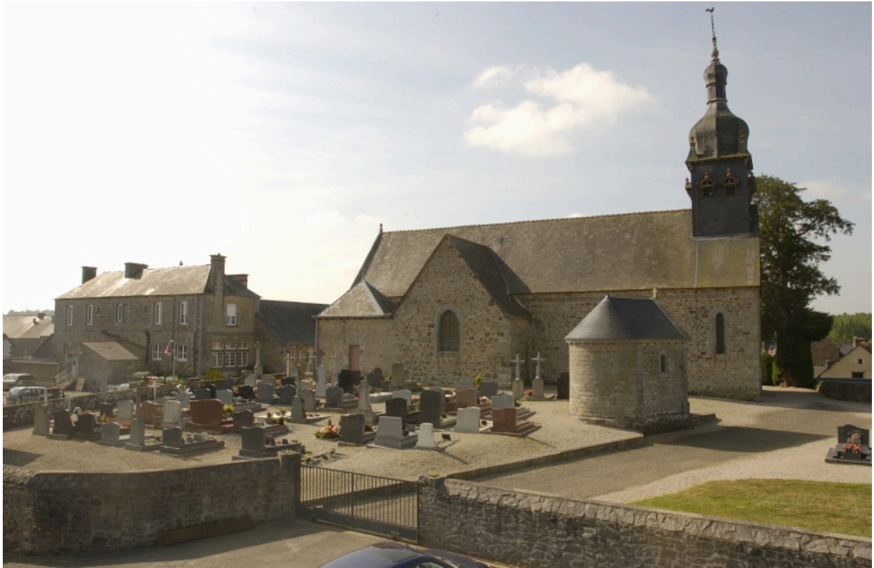
Façade Nord, vue générale actuelle