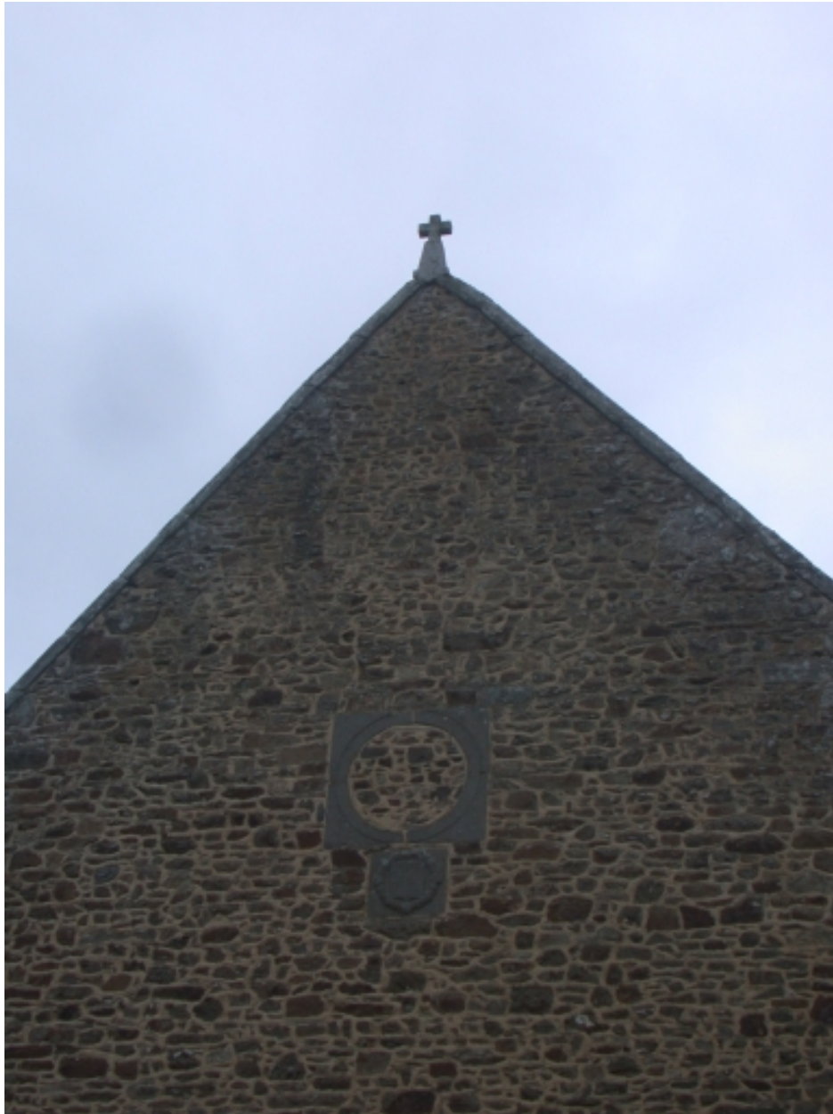
Façade Ouest, vue actuelle, détail pignon