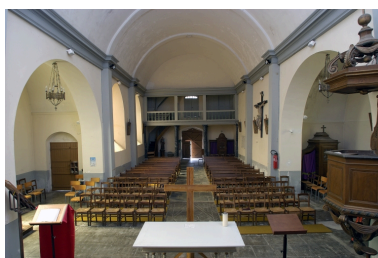
Vue intérieure prise du chœur vers la nef IVR53_20063500697NUCA