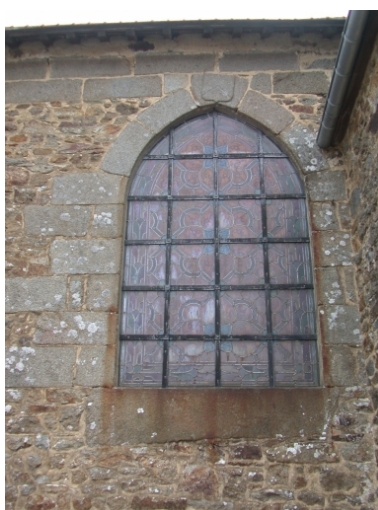
Façade Nord, baie et armoiries IVR53_20063509569NUCA