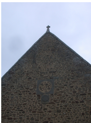
Façade Ouest, vue actuelle, détail pignon