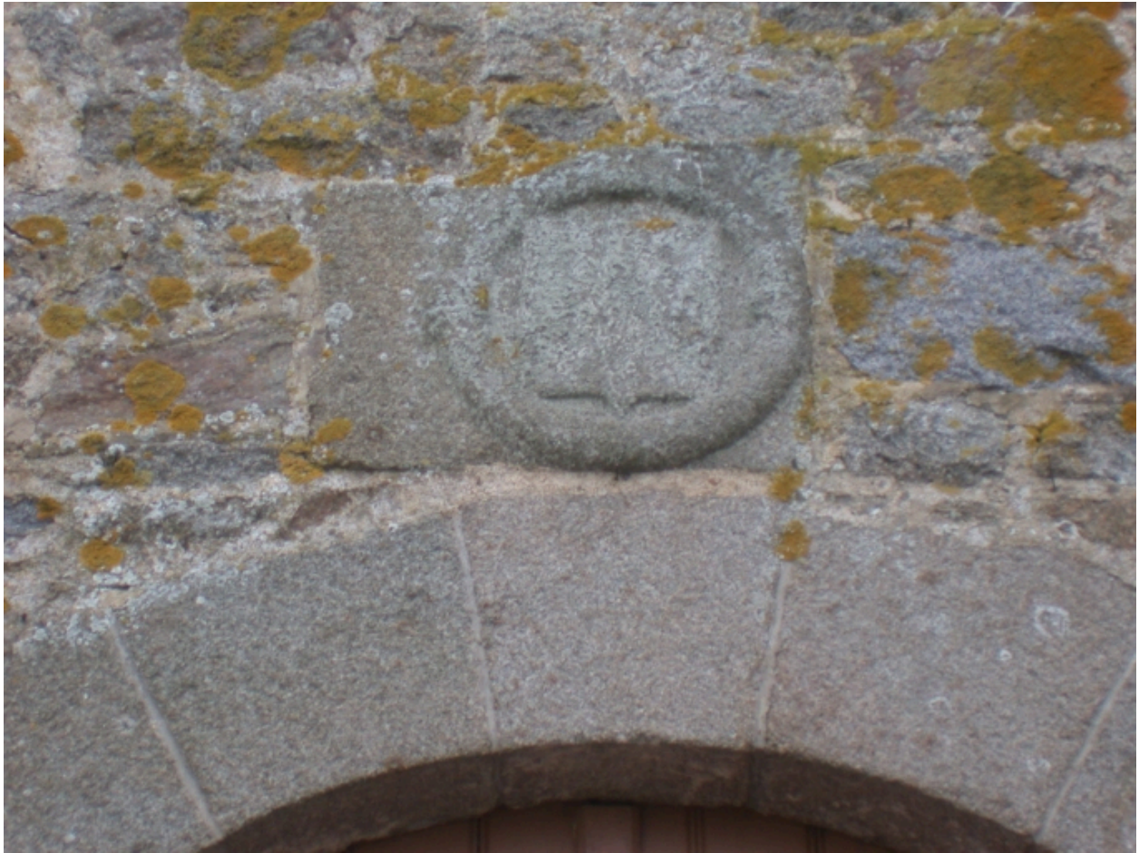
Façade Est, armoiries