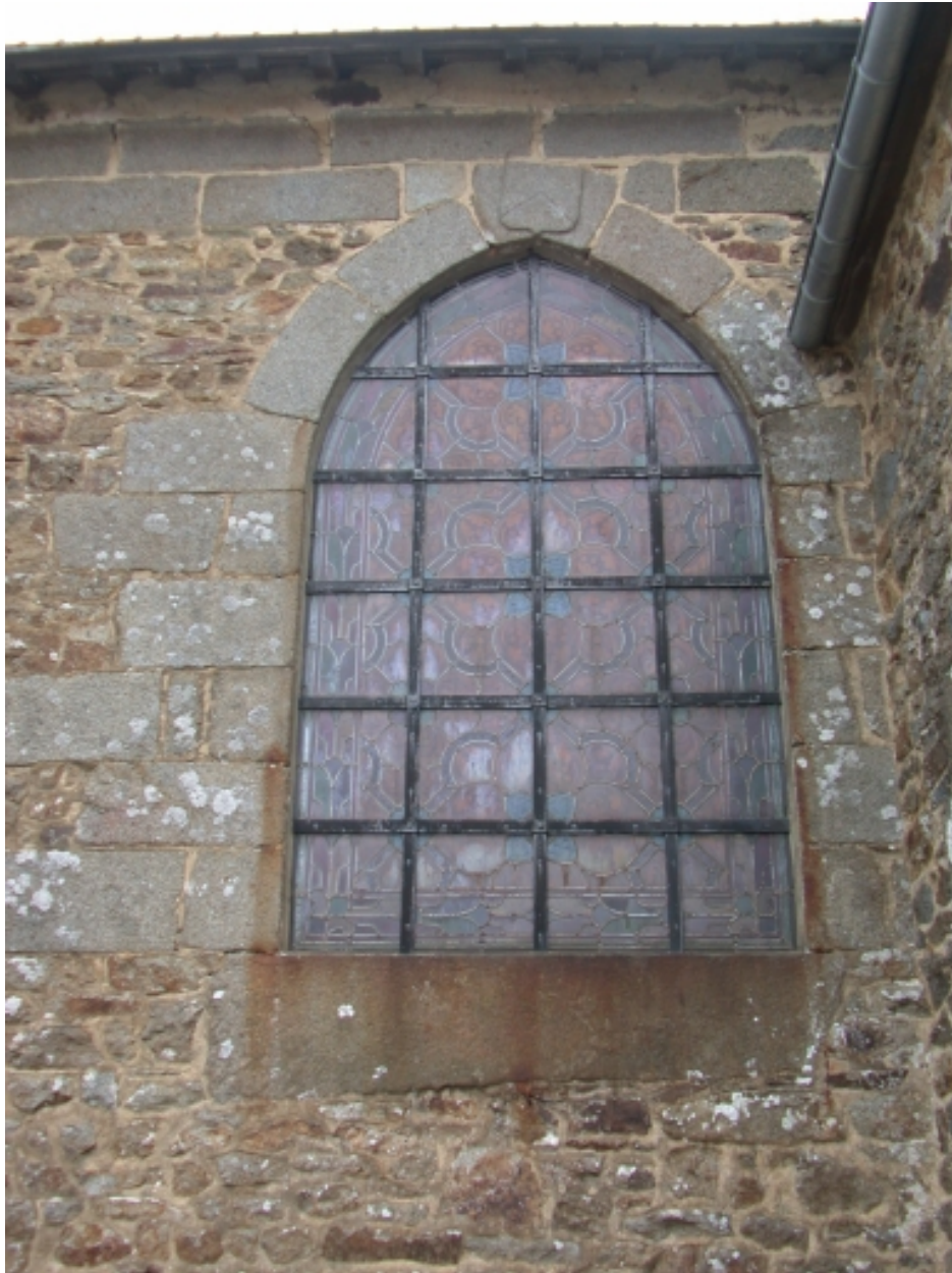
Façade Nord, baie et armoiries