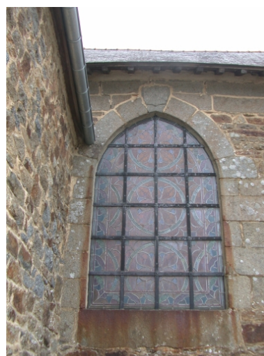
Façade Nord, baie et armoiries IVR53_20063509570NUCA