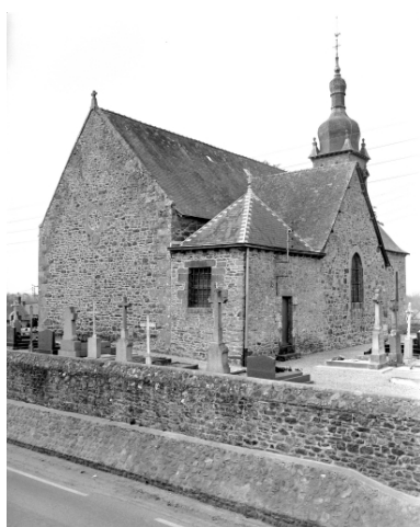
Élévation Est : vue générale