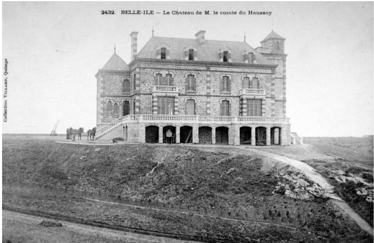
Élévation postérieure