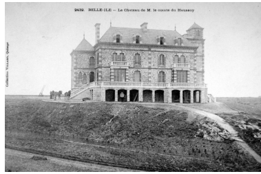
Elévation postérieure (Archives départementales d'Ille-et-Vilaine, 6 Fi Bangor) IVR53_20035604271NUCB