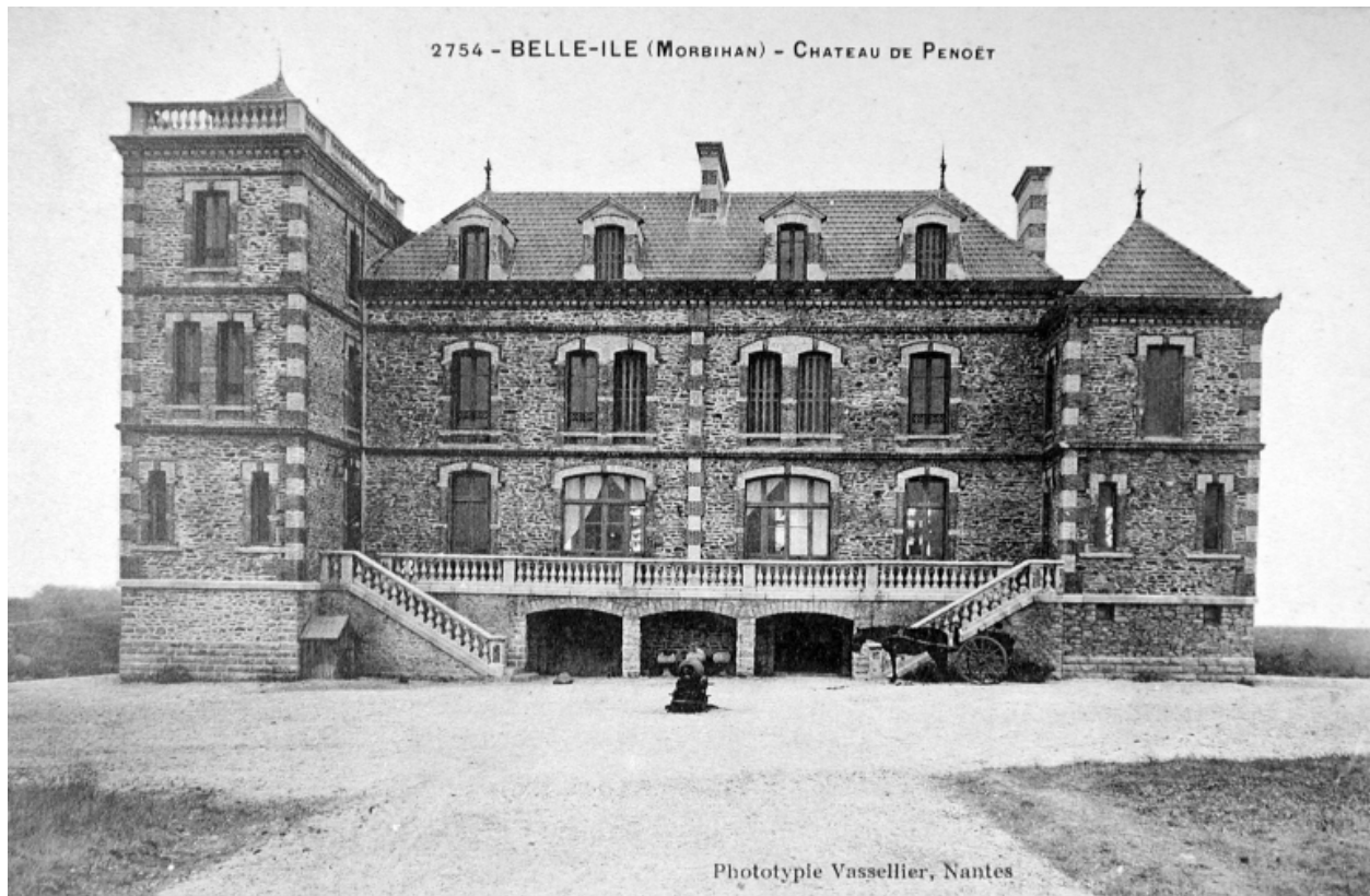
Elévation antérieure