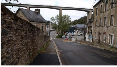
Vue depuis la rue du port Favigo vers le port IVR53_20262210328NUCA