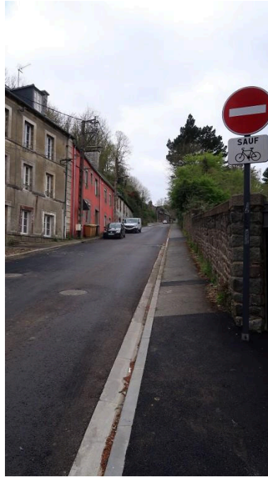
Rue du port Favigo IVR53_20262210327NUCA