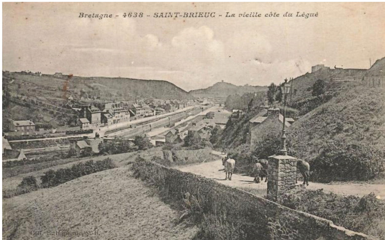
Carte postale, la vieille côte du Légué (rue du port Favigo au début du 20e siècle)