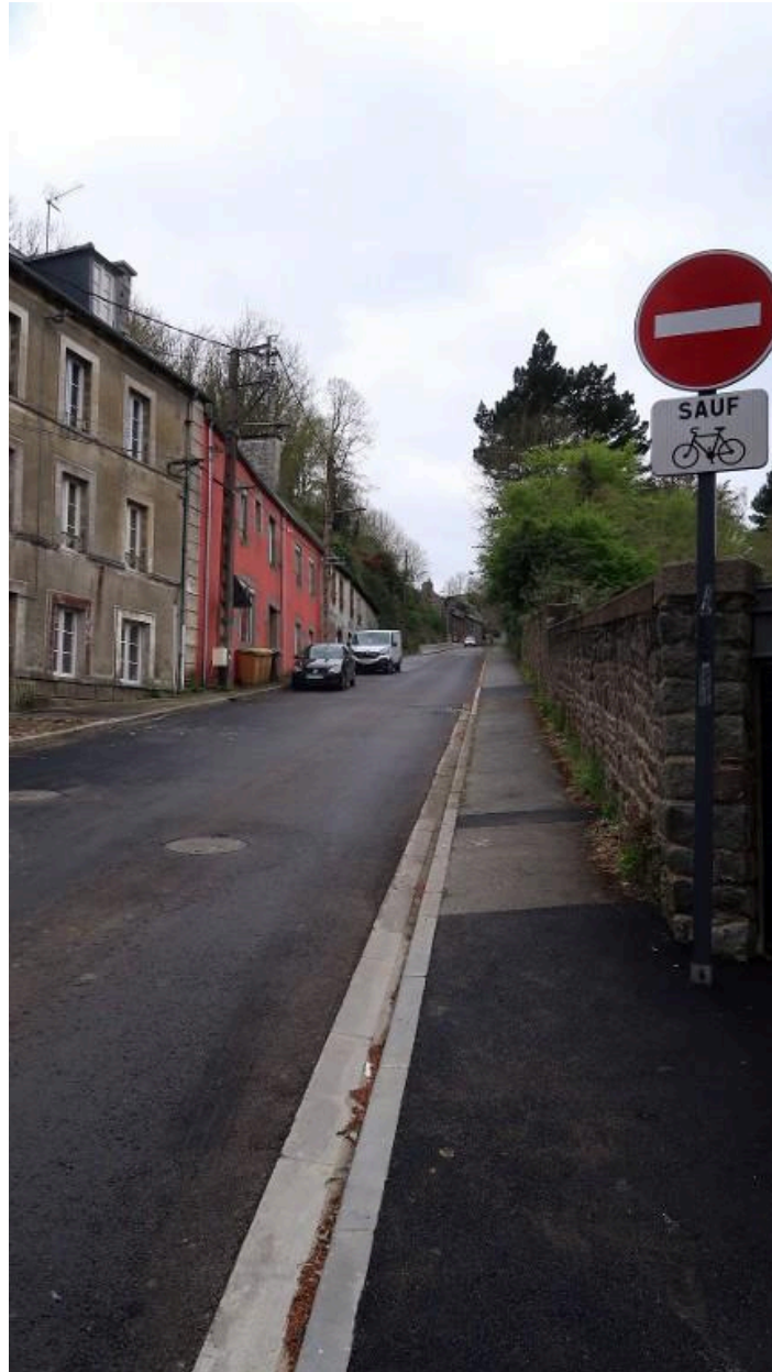
Rue du port Favigo