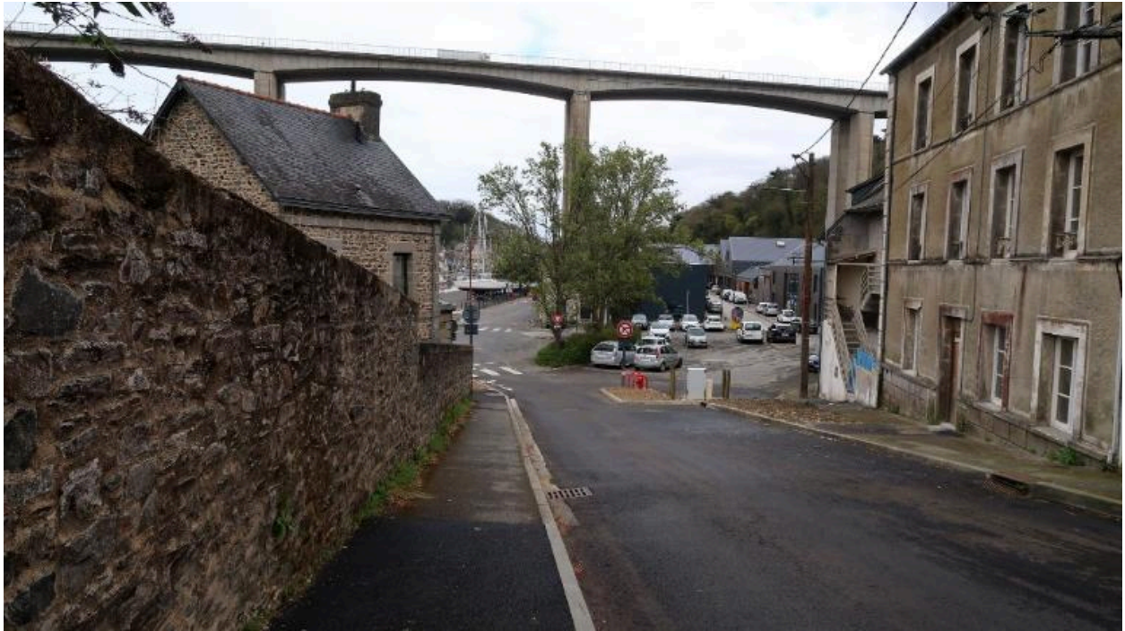
Vue depuis la rue du port Favigo vers le port