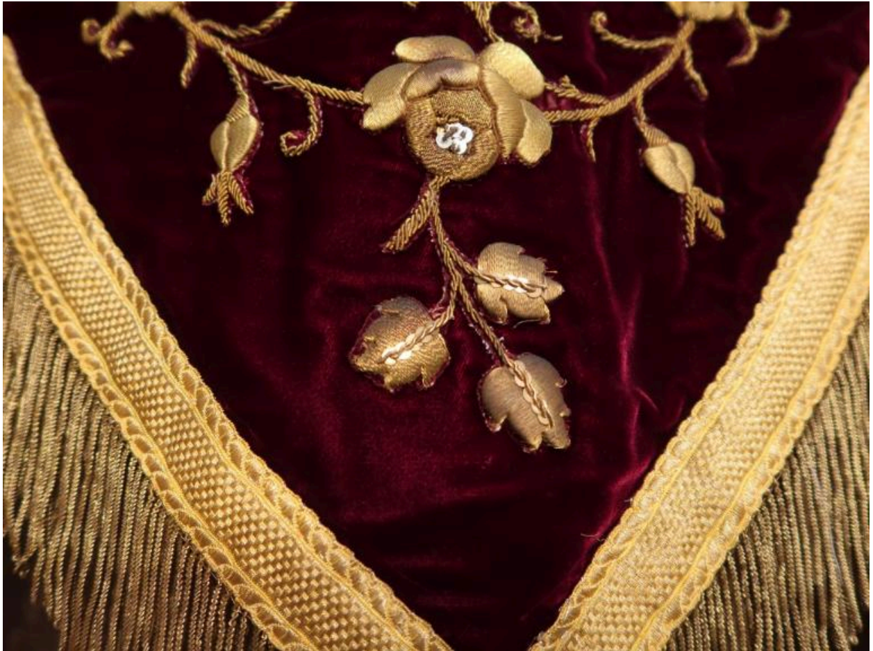
Détails de fleurs brodées au fil métallique doré