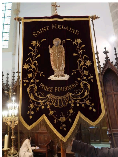
Face saint Melaine IVR53_20253530565NUCA