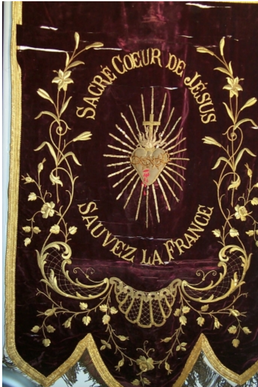
Face portant un coeur enflammé : vue générale