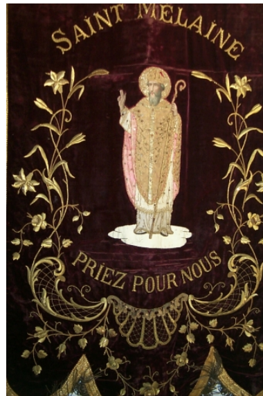
Face portant saint Melaine : vue générale IVR53_20013514956NUCA