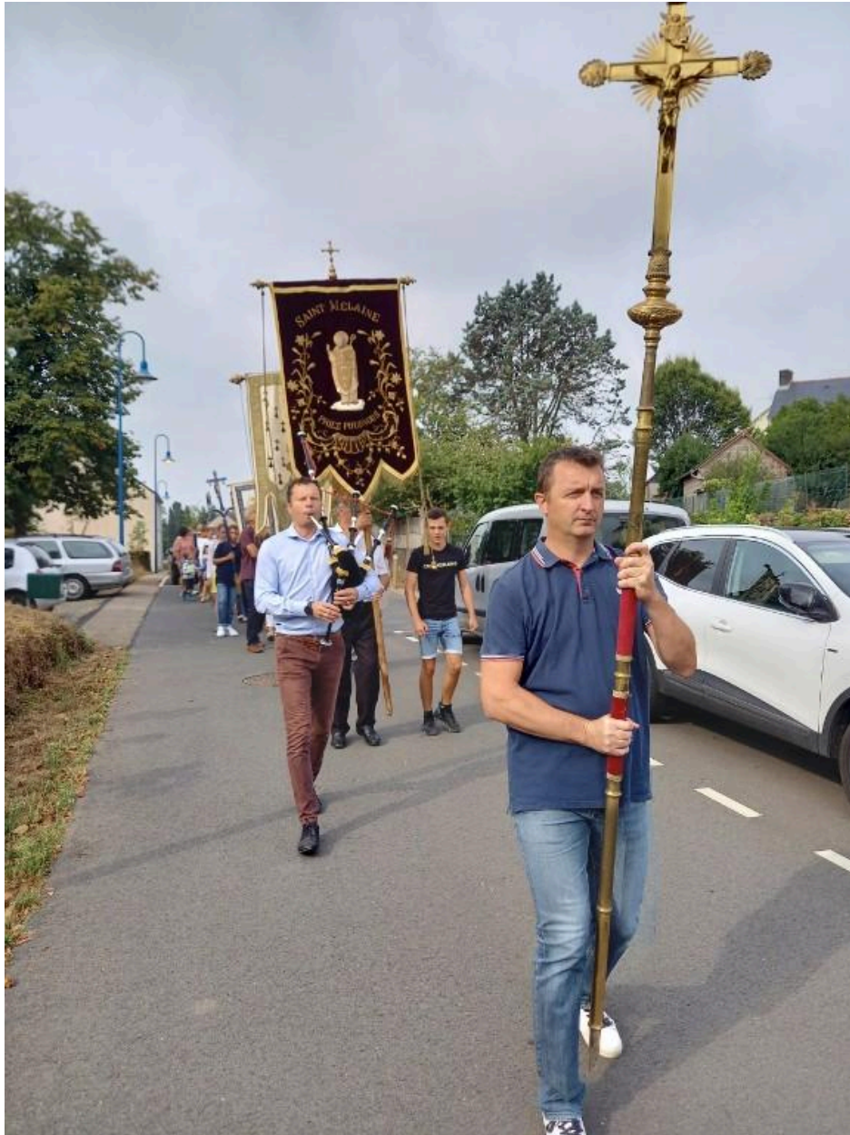
Fête de l'Assomption à la Chapelle-de-Brain (35)