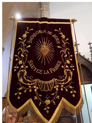
Face avec Sacré-Coeur du Christ IVR53_20253530567NUCA