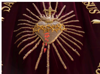
Détail du Sacré-Coeur du Christ IVR53_20253530568NUCA