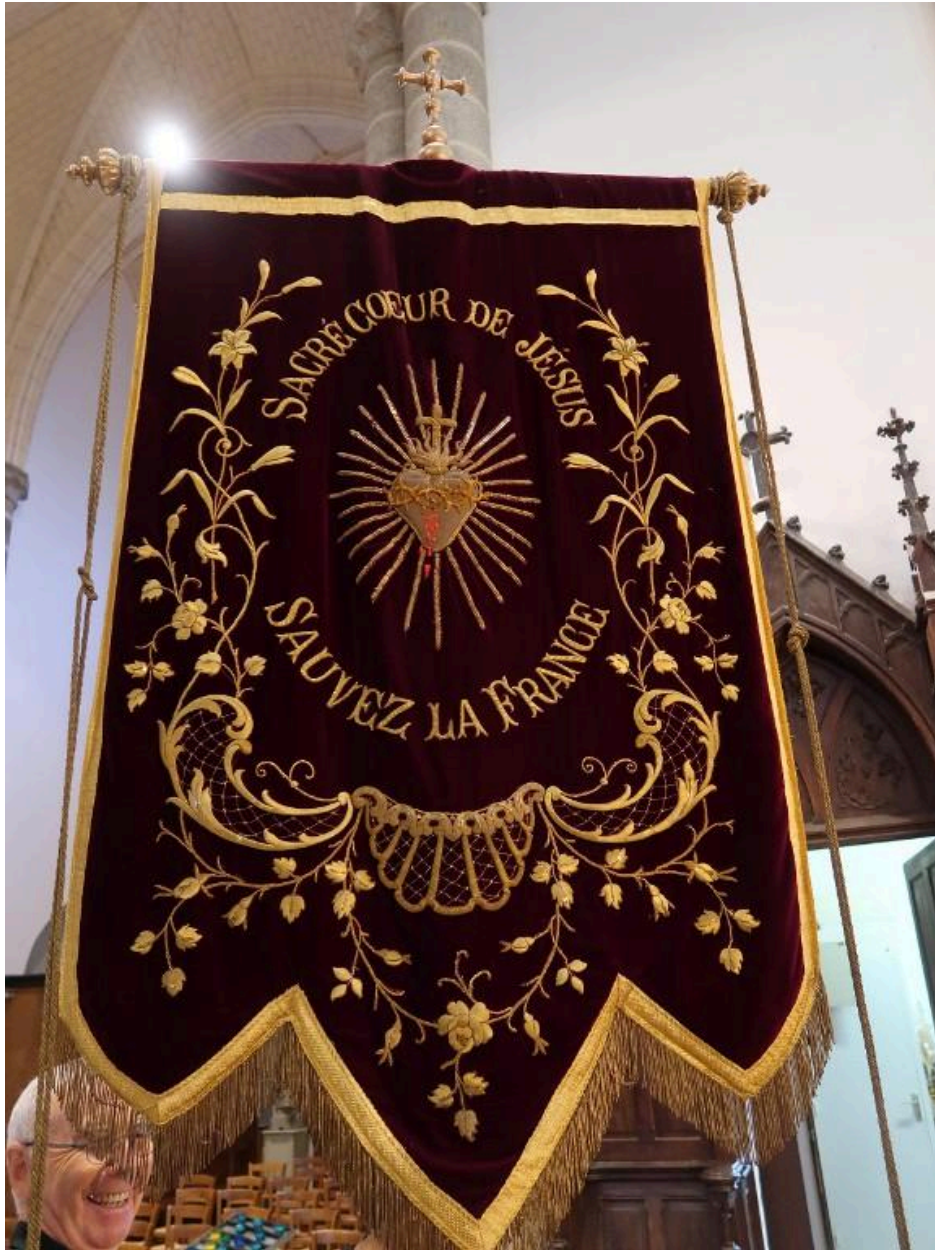
Face avec Sacré-Coeur du Christ