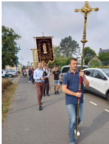
Fête de l'Assomption à la Chapelle-de-Brain (35)