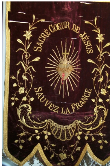
Face portant un coeur enflammé : vue générale IVR53_20013514957NUCA