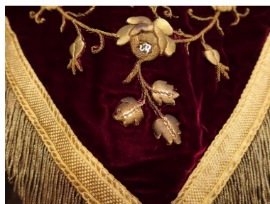
Détails de fleurs brodées au fil métallique doré