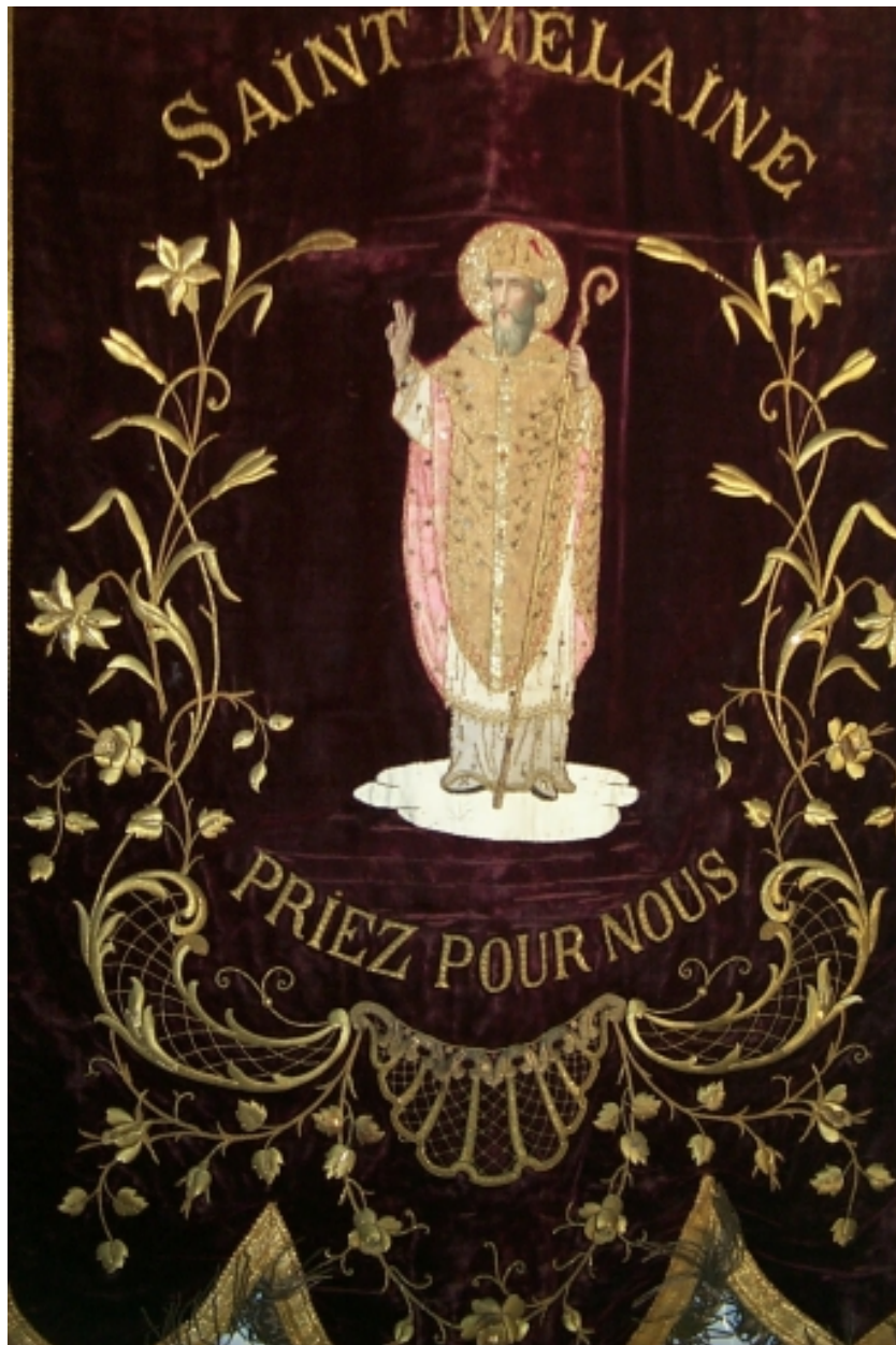
Face portant saint Melaine : vue générale