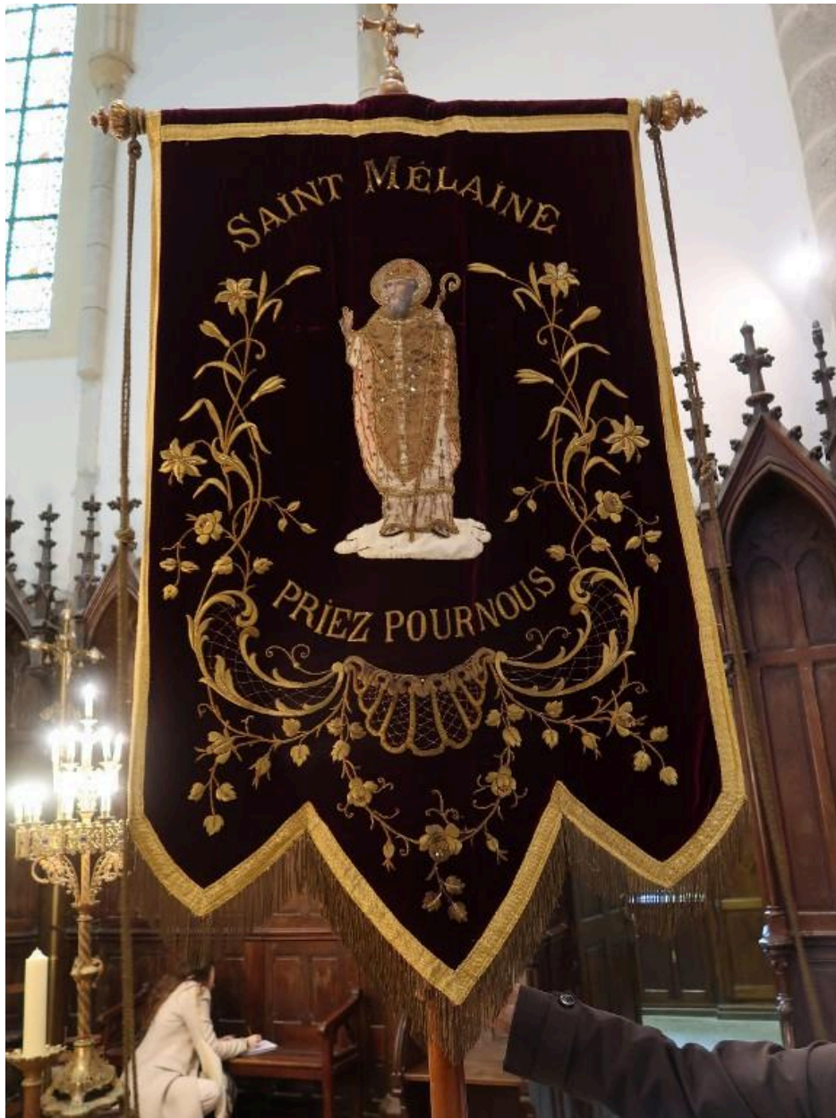
Face saint Melaine