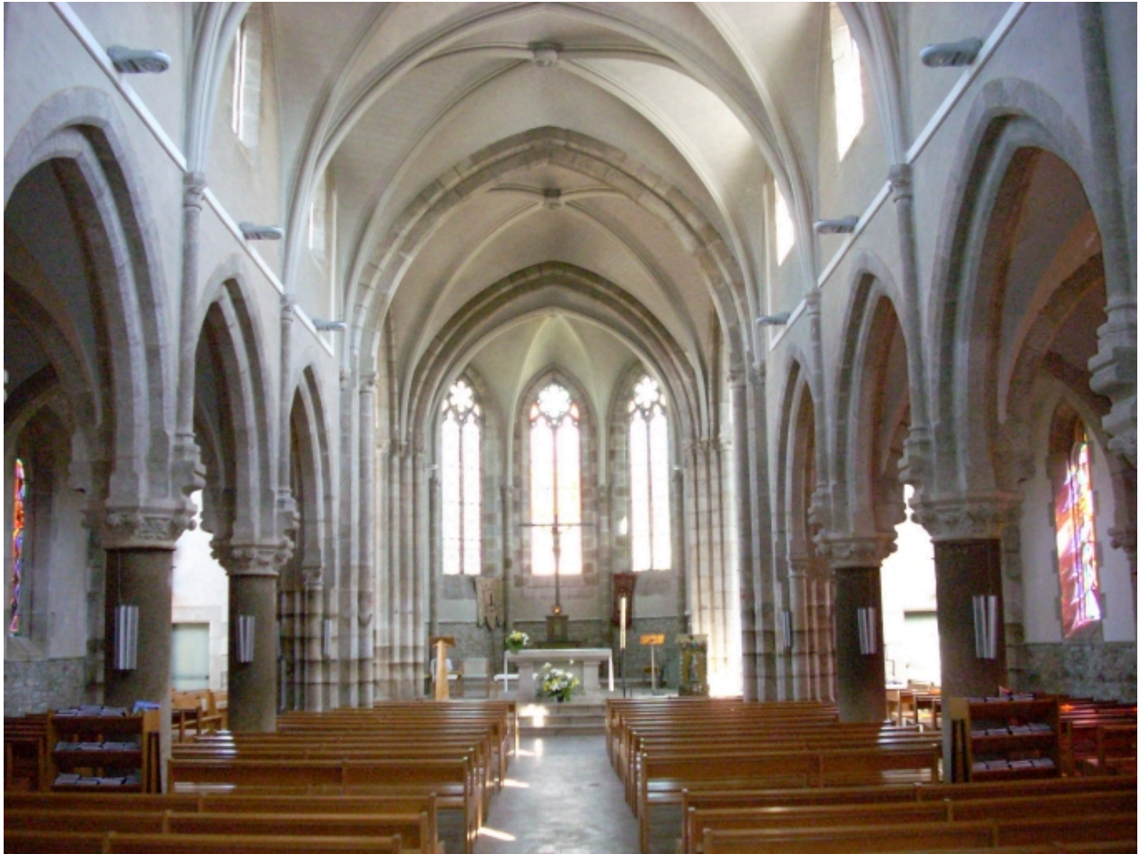
Névez, eglise paroissiale Sainte-Thumette : vue axiale est