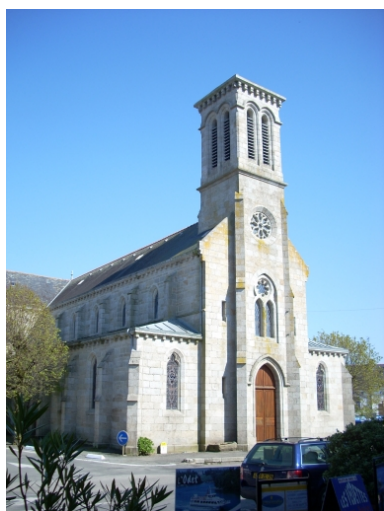
Névez, église paroissiale Sainte-Thumette : vue générale nord-ouest IVR53_20082905645NUCA