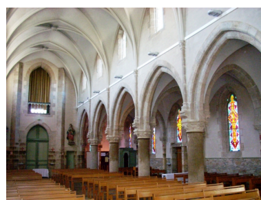
Névez, église paroissiale Sainte-Thumette : vue transversale nord-ouest de la nef