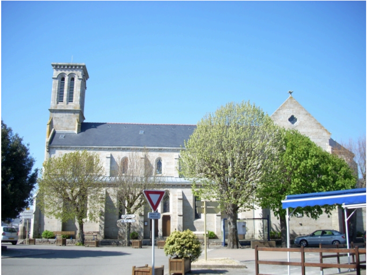
Névez, eglise paroissiale Sainte-Thumette : élévation sud