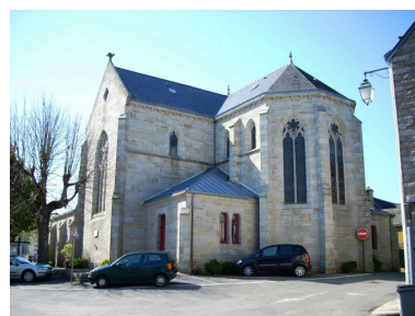
Névez, église paroissiale Sainte-Thumette : vue générale sud-est IVR53_20082905650NUCA