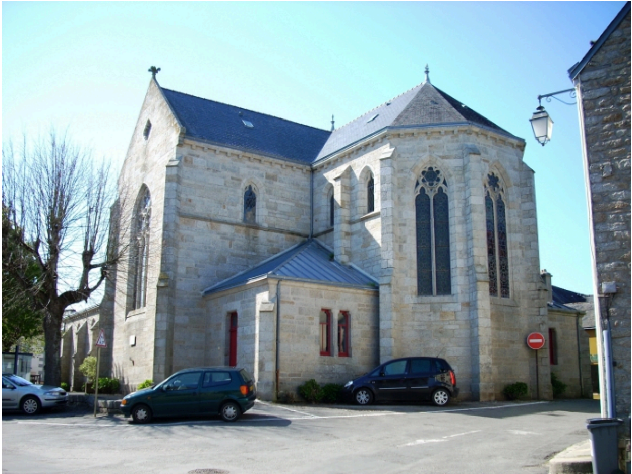
Névez, église paroissiale Sainte-Thumette : vue générale sud-est