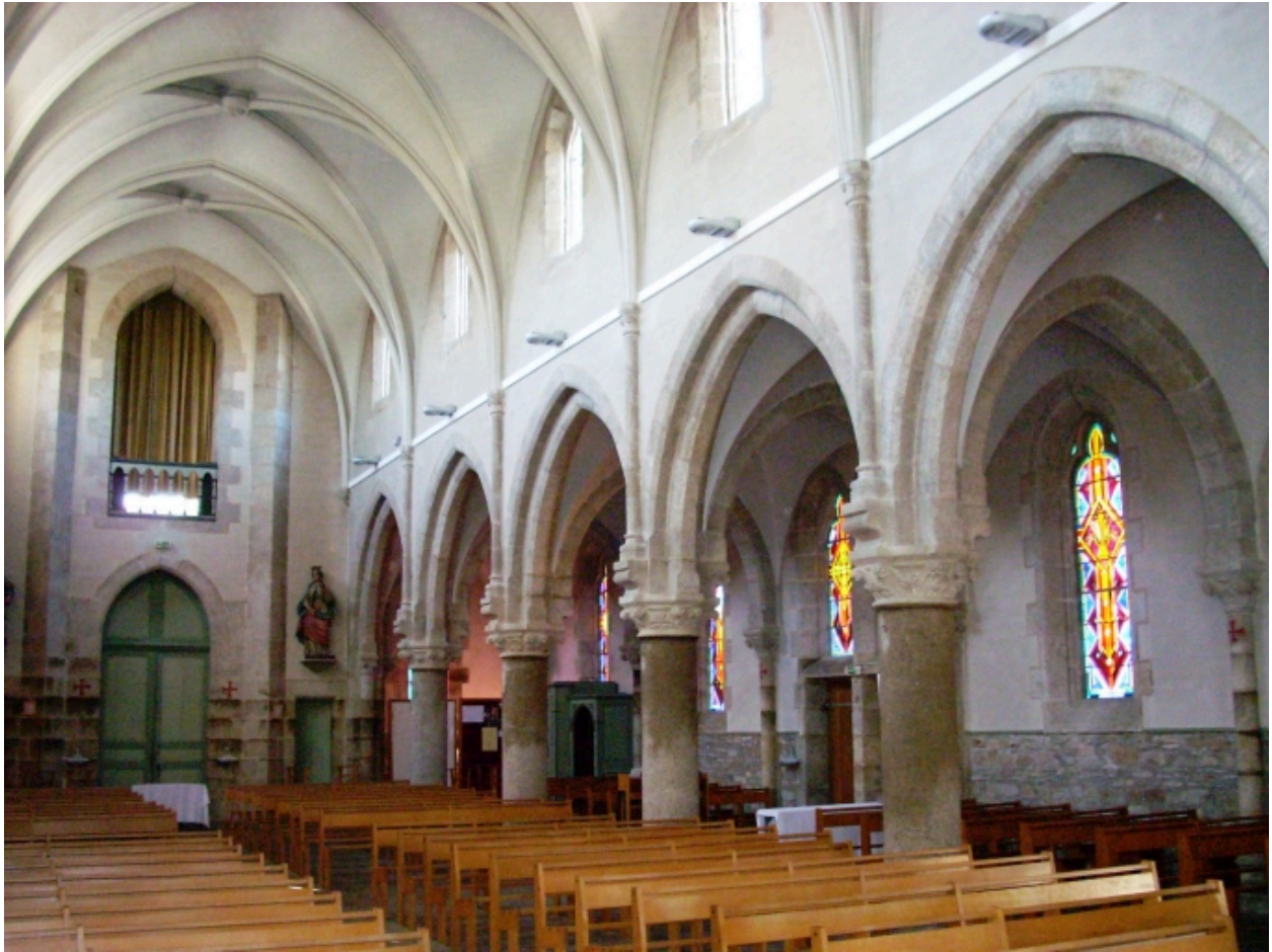
Névez, eglise paroissiale Sainte-Thumette : vue transversale nord-ouest de la nef