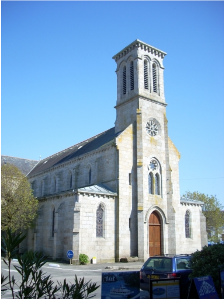
Névez, église paroissiale Sainte-Thumette : vue générale nord-ouest