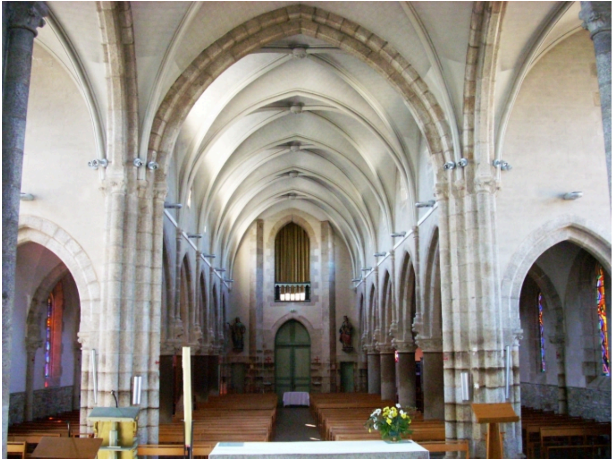
Névez, eglise paroissiale Sainte-Thumette : vue axiale ouest