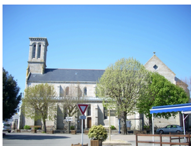
Névez, église paroissiale Sainte-Thumette : élévation sud