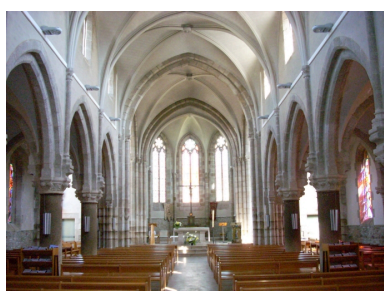
Névez, église paroissiale Sainte-Thumette : vue axiale est IVR53_20082905647NUCA