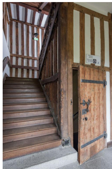
Intérieur, cage de l'escalier central en pan de bois IVR53_20213500282NUCA