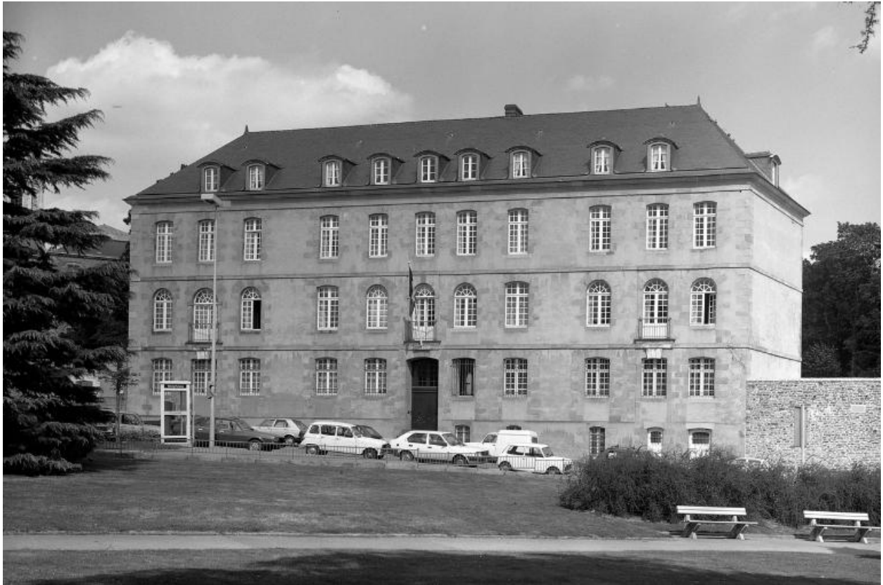
Vue générale prise du sud-ouest.