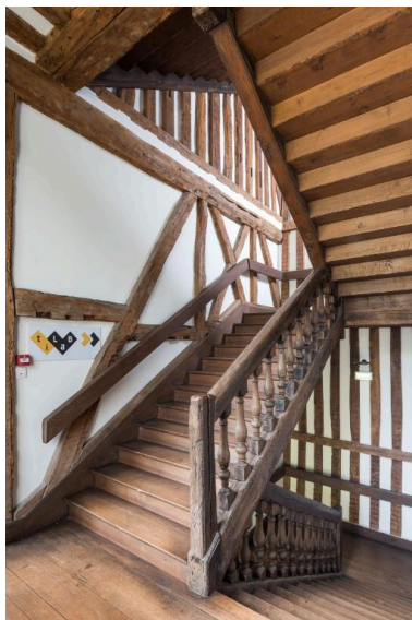
Intérieur, cage de l'escalier central en pan de bois IVR53_20213500284NUCA