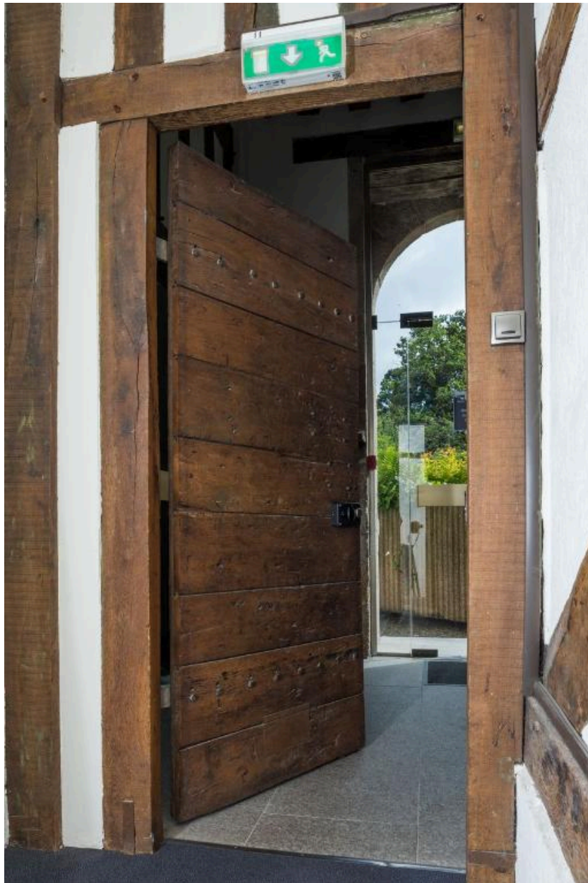
Intérieur, ancienne porte de la cage d'escalier