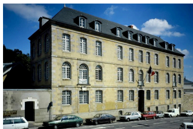
Vue générale prise du nord-ouest. IVR53_19863500769VA