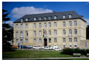
Vue générale prise du nord-ouest. IVR53_19863500771VA