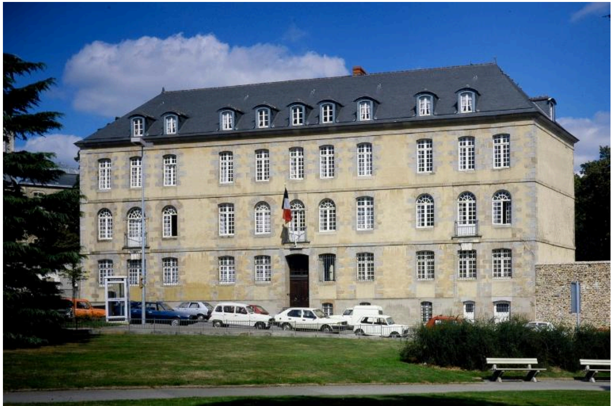
Vue générale prise du nord-ouest.