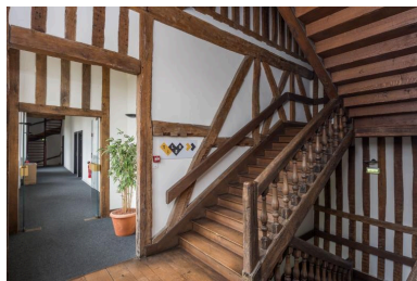
Intérieur, cage de l'escalier central en pan de bois IVR53_20213500283NUCA