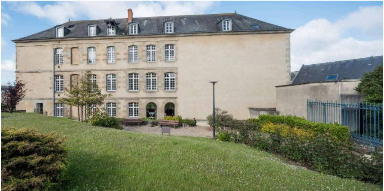
Vue générale façade est