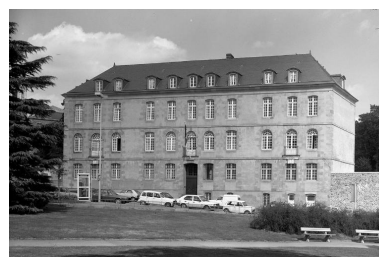
Vue générale prise du sud-ouest. IVR53_19863500770V