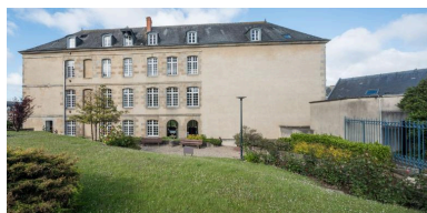
Vue générale façade est IVR53_20213500266NUCA