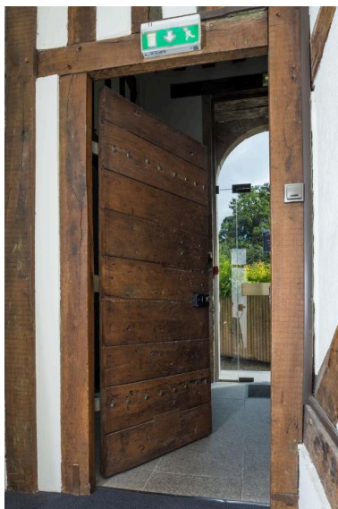
Intérieur, ancienne porte de la cage d'escalier IVR53_20213500281NUCA