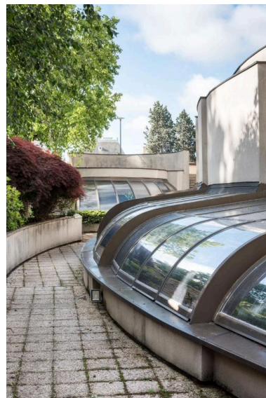
La verrière de la salle des assemblées de la Région depuis la cour du Bon Pasteur