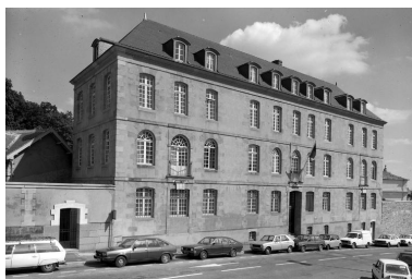
Vue générale prise du nord-ouest.