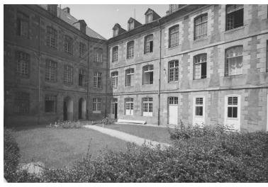
L'aile de droite a été détruite. Les arcs segmentaires de fenêtres sont des caractéristiques du 18ème siècle.