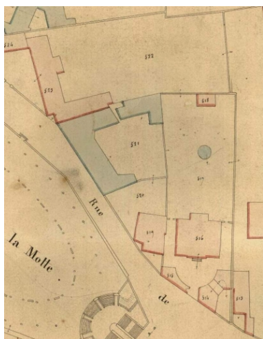
Extrait du cadastre de 1842 IVR53_20023516141NUCA