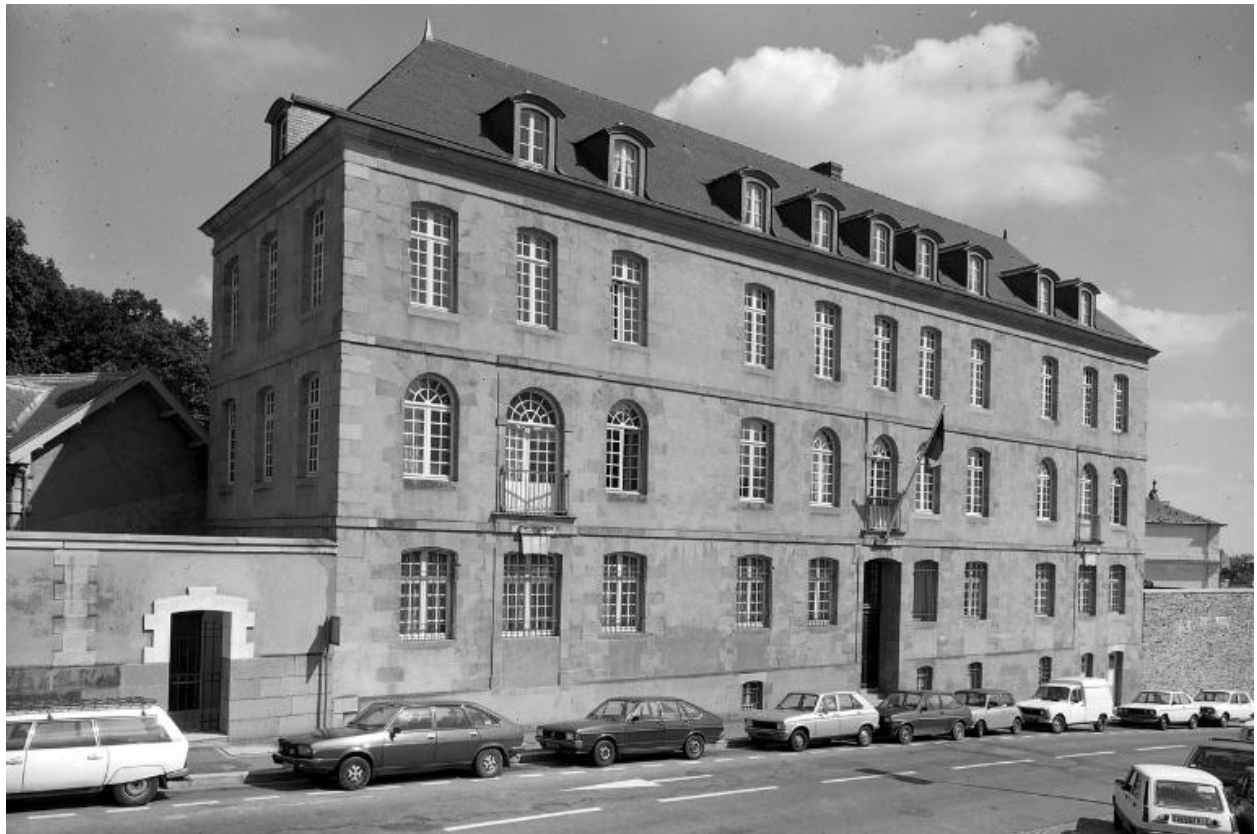
Vue générale prise du nord-ouest.