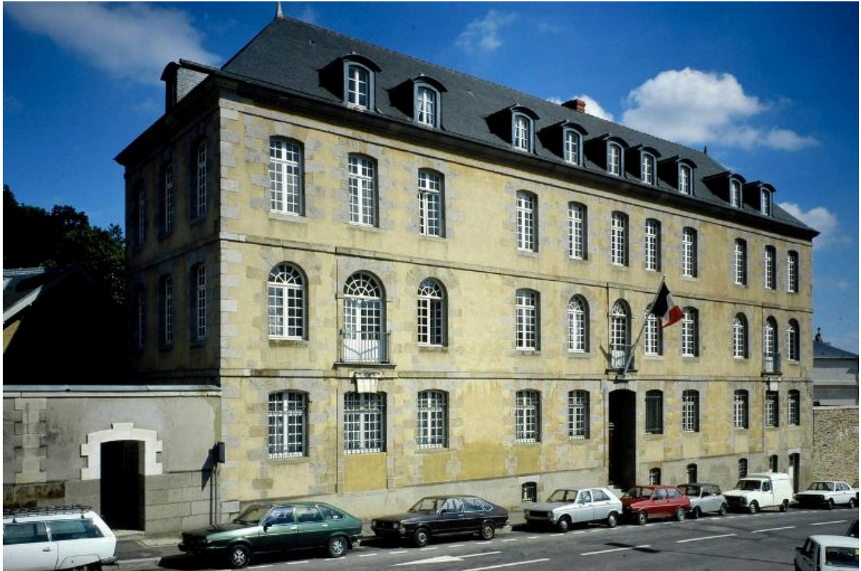
Vue générale prise du nord-ouest.