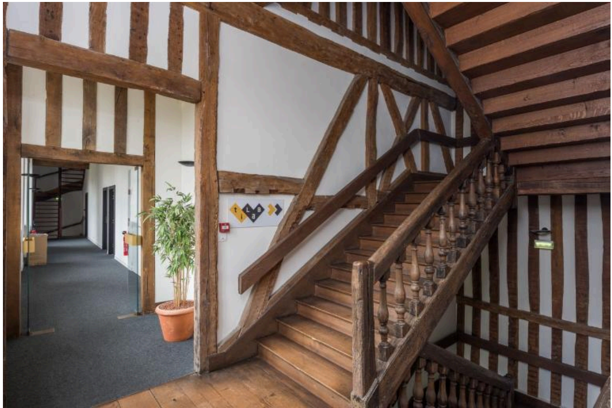
Intérieur, cage de l'escalier central en pan de bois