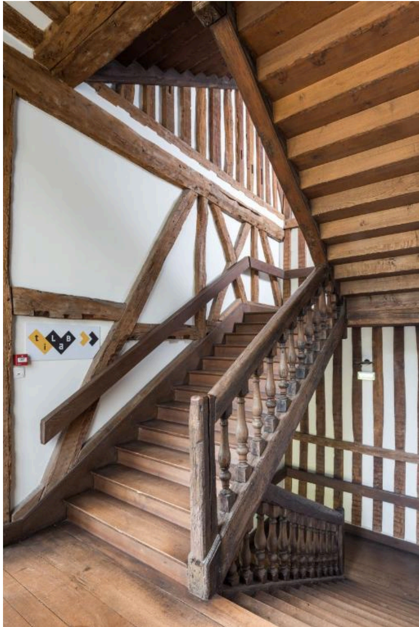
Intérieur, cage de l'escalier central en pan de bois