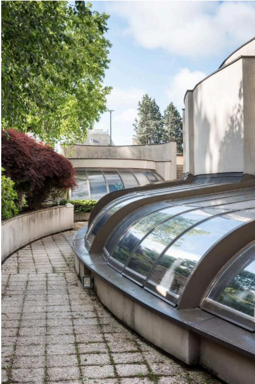
La verrière de la salle des assemblées de la Région depuis la cour du Bon Pasteur