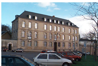
Vue générale IVR53_19983504548NUCA