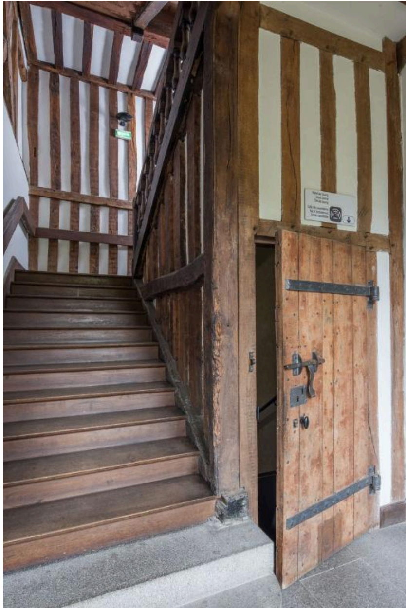
Intérieur, cage de l'escalier central en pan de bois