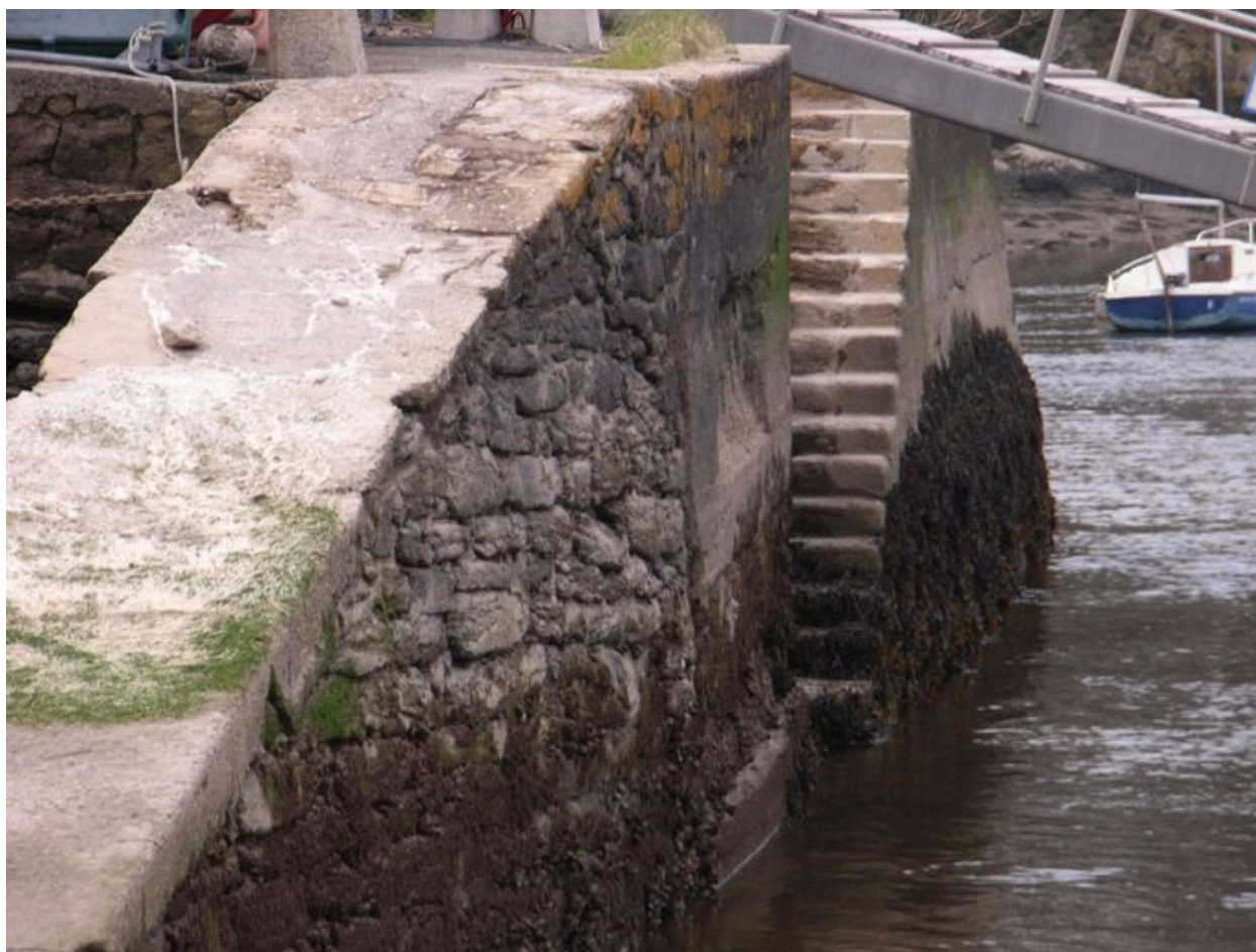
Rampe et escalier au bout du quai Polignac