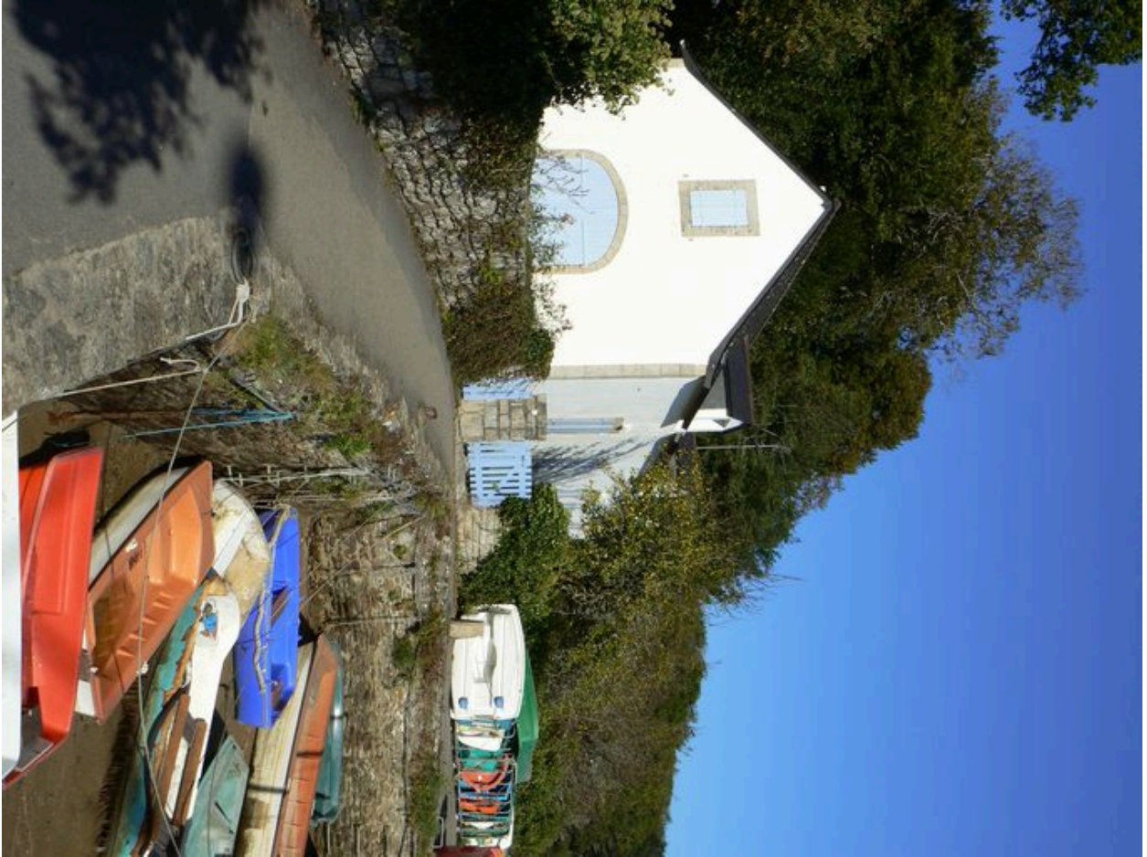
Quai irrégulier menant au quai Polignac