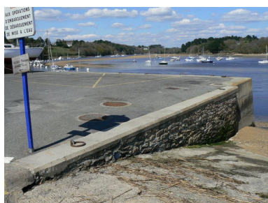
Quai en béton et haut de la petite cale