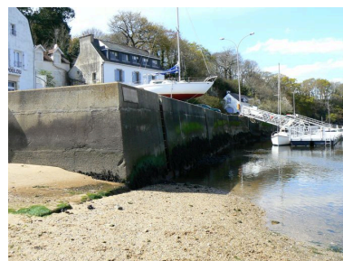
Quai en béton et extrémité inférieure de la petite cale IVR53_20082908650NUCA