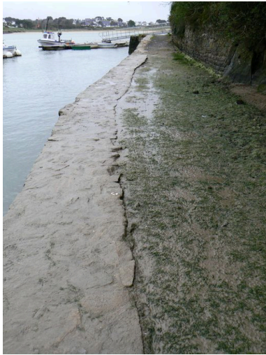
Chemin submersible IVR53_20082908658NUCA