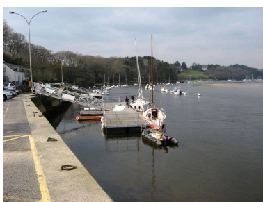
Quai en béton IVR53_20072909092NUCA