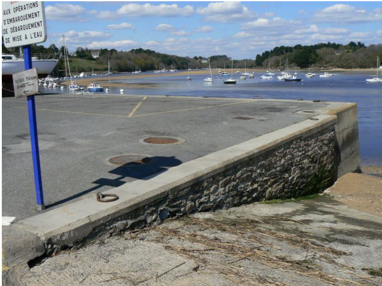
Quai en béton et haut de la petite cale