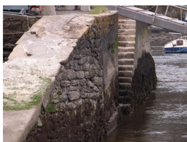
Rampe et escalier au bout du quai Polignac IVR53_20072909094NUCA