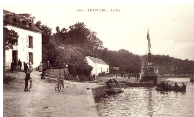
Quais et cales du port du Pouldu au début du 20e siècle