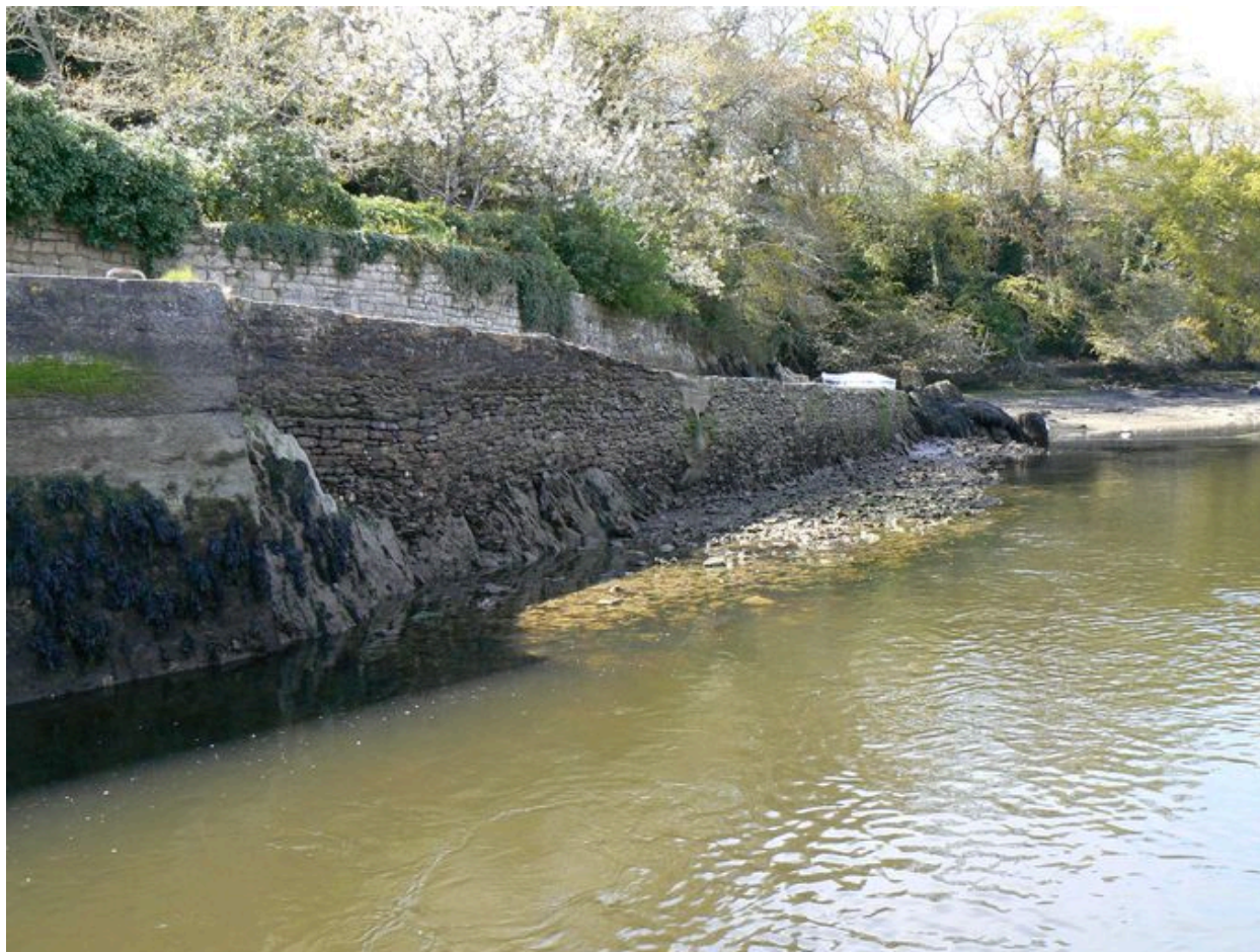
Chemin submersible après le quai Polignac