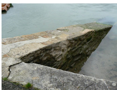
Rampe au bout du quai Polignac IVR53_20082908656NUCA