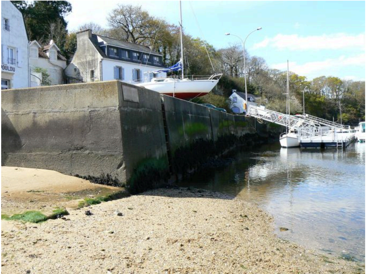
Quai en béton et extrémité inférieure de la petite cale