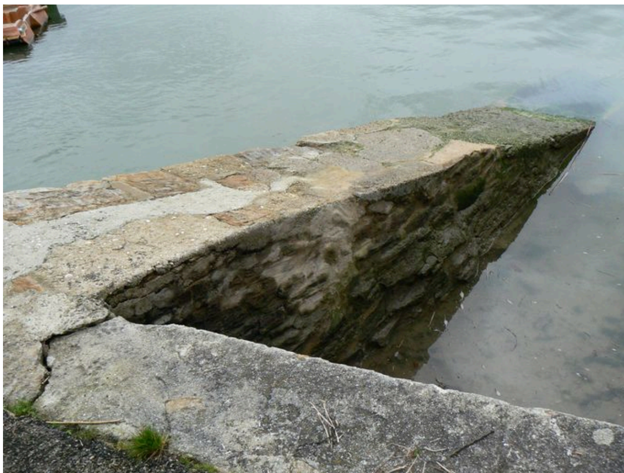
Rampe au bout du quai Polignac