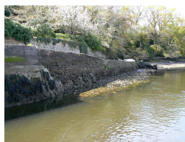
Chemin submersible après le quai Polignac IVR53_20082908657NUCA