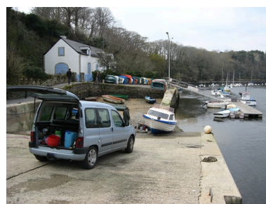
Cale et quai Polignac au second plan IVR53_20072909093NUCA