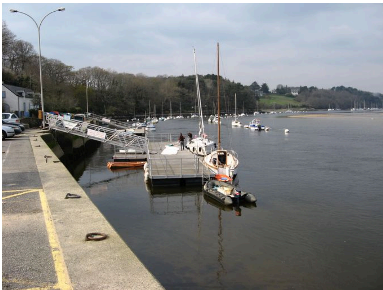
Quai en béton