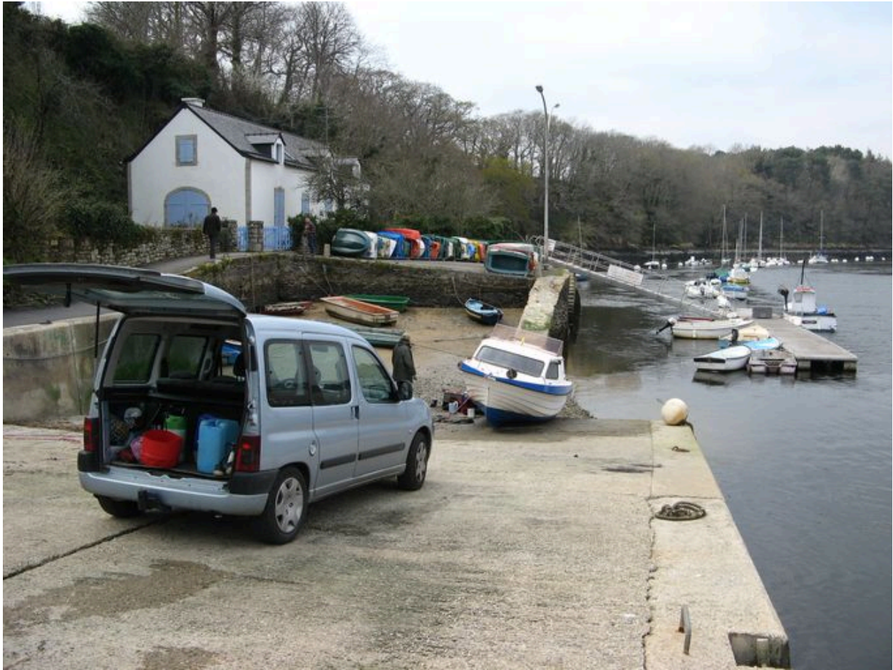
Cale et quai Polignac au second plan