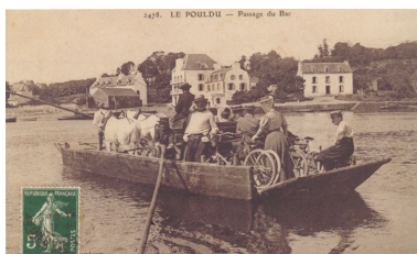
Passage du bac au port du Pouldu au début du 20e siècle