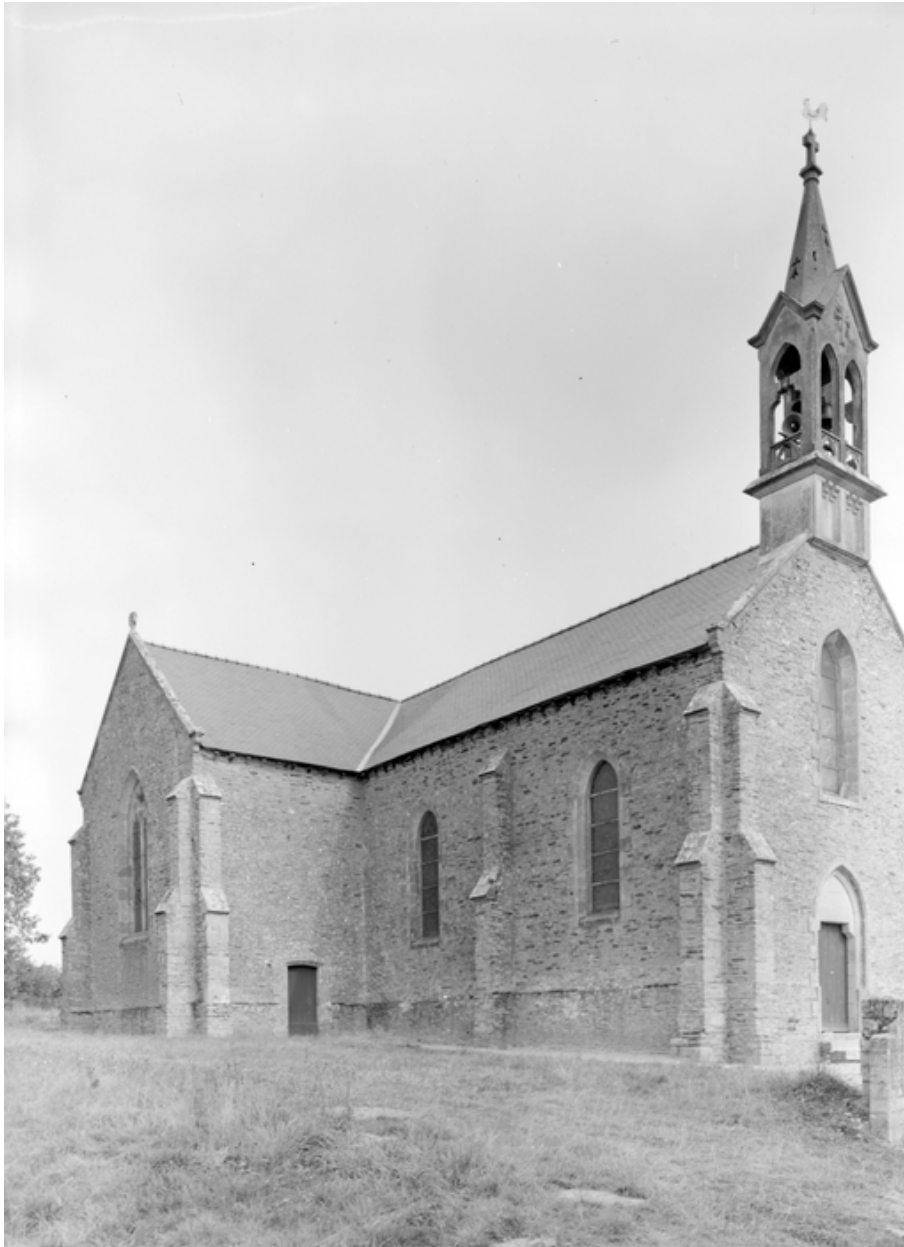
Chapelle vue du nord-ouest (état en 1984)