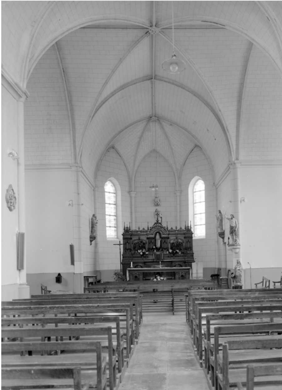
Chapelle : vue générale de la nef (état en 1984)