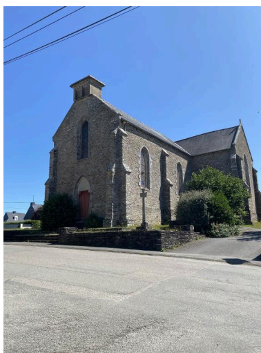
Vue sud-ouest