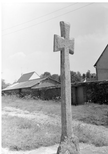
Chapelle : la croix de l'enclos (état en 1984) IVR53_19845601845X