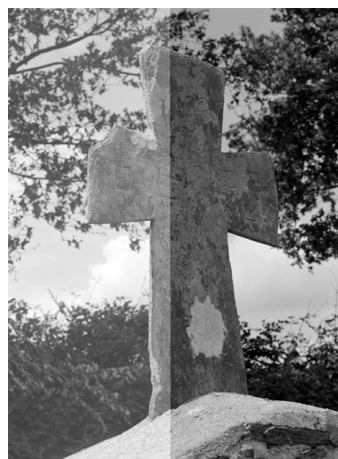
Chapelle : la croix de la fontaine (état en 1985)