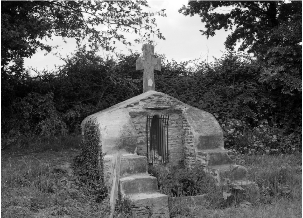
Chapelle : la fontaine (état en 1985)