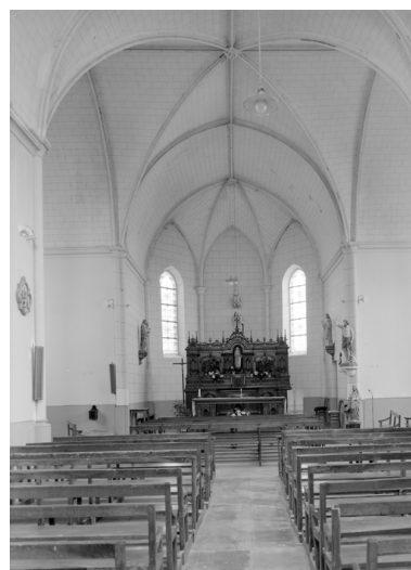
Chapelle : vue générale de la nef (état en 1984) IVR53_19845601665V