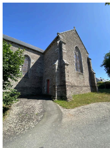
Vue sud