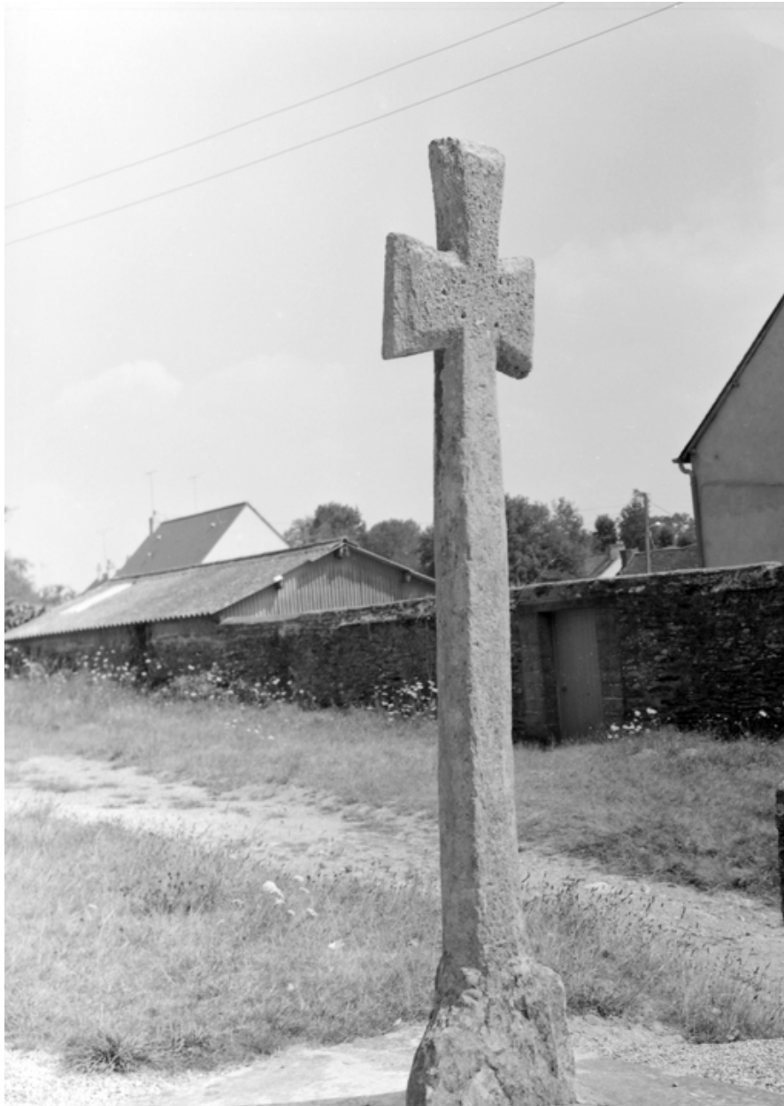
Chapelle : la croix de l'enclos (état en 1984)