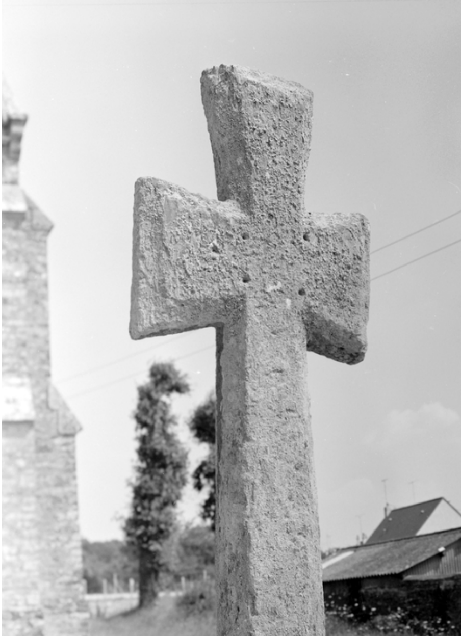
Chapelle : partie supérieure de la croix de l'enclos (état en 1984)