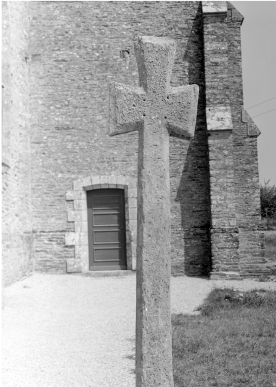
Chapelle : la croix de l'enclos (état en 1984)