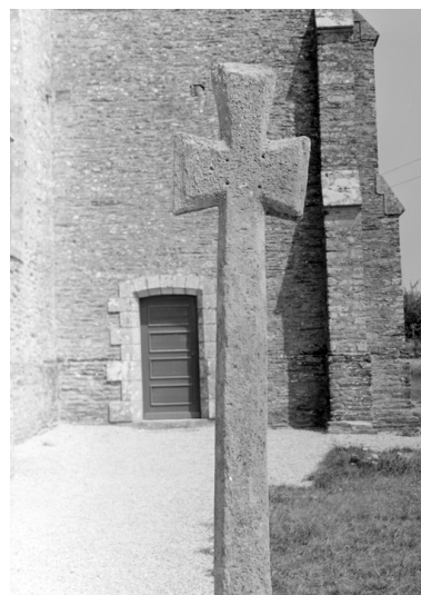
Chapelle : la croix de l'enclos (état en 1984)