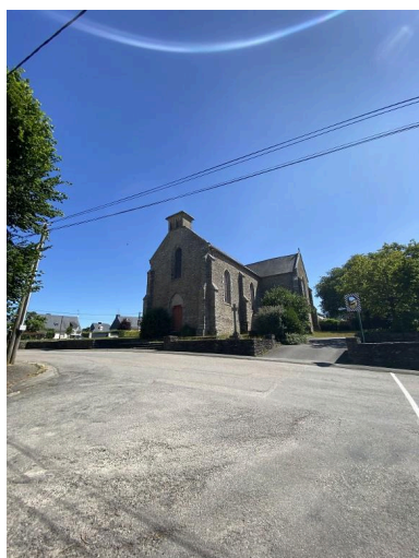
Vue sud-ouest