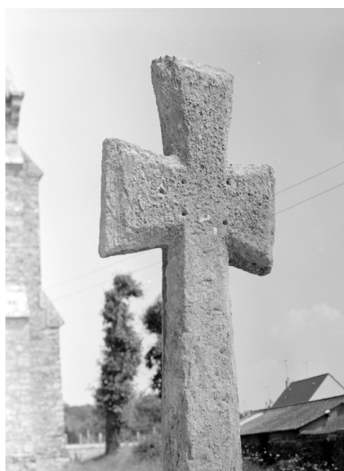
Chapelle : partie supérieure de la croix de l'enclos (état en 1984) IVR53_19845601847X