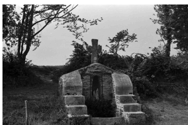
Vue générale IVR53_19765606220Z