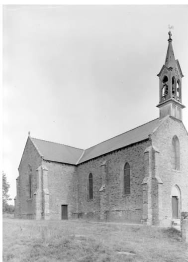
Chapelle vue du nord-ouest (état en 1984)