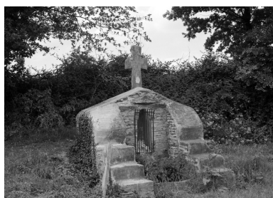
Chapelle : la fontaine (état en 1985) IVR53_19855600725X