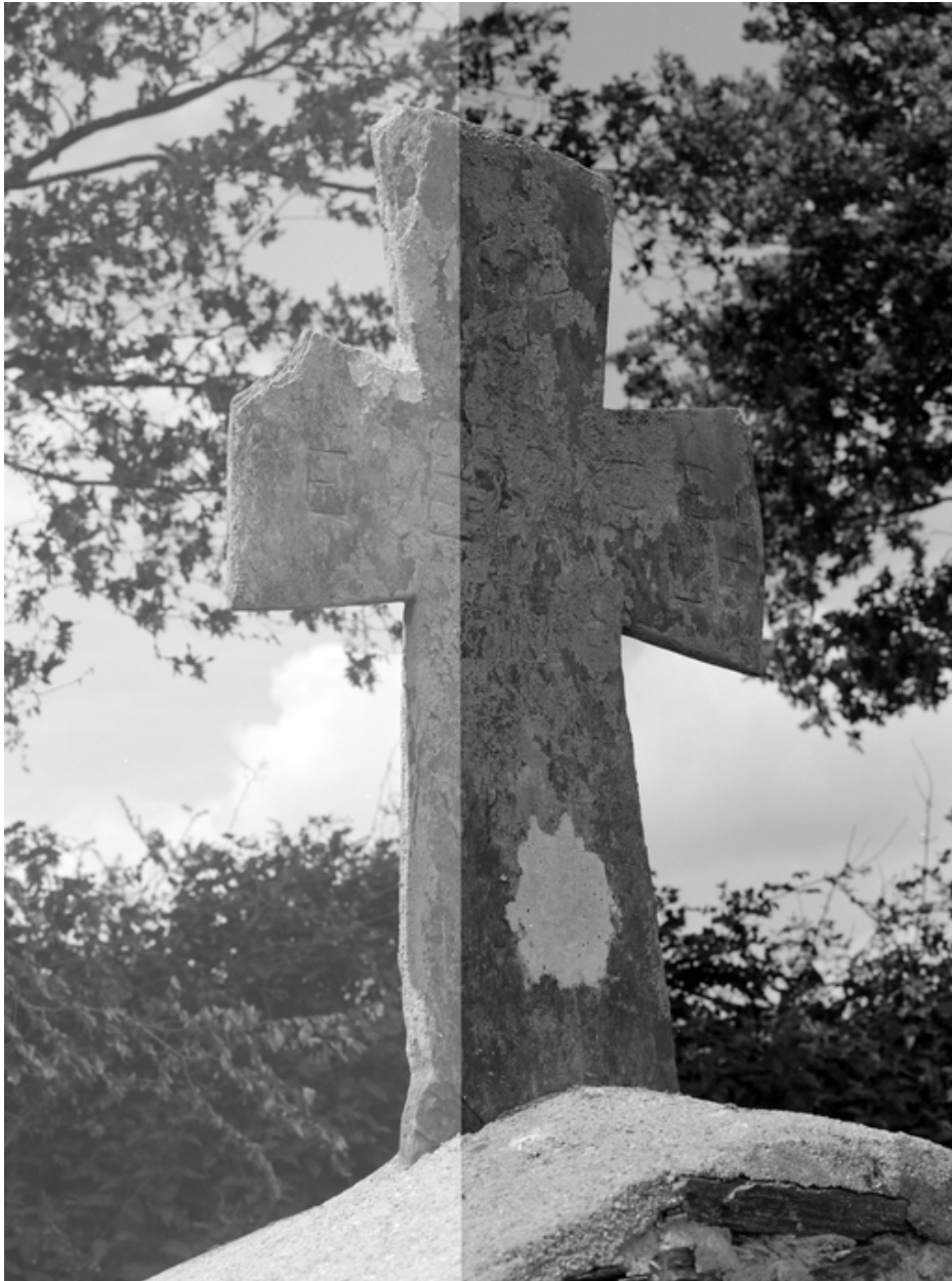
Chapelle : la croix de la fontaine (état en 1985)