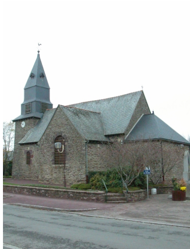
Vue générale sud est IVR53_20033514801NUCA