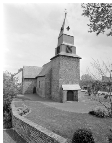
Vue générale ouest IVR53_19943500849X