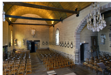
Vue intérieure prise du chœur vers la nef IVR53_20043501516NUCA