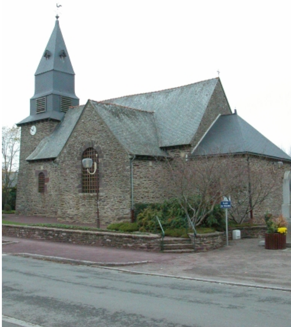
Vue générale sud est