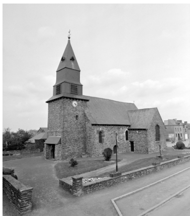
Vue générale sud ouest