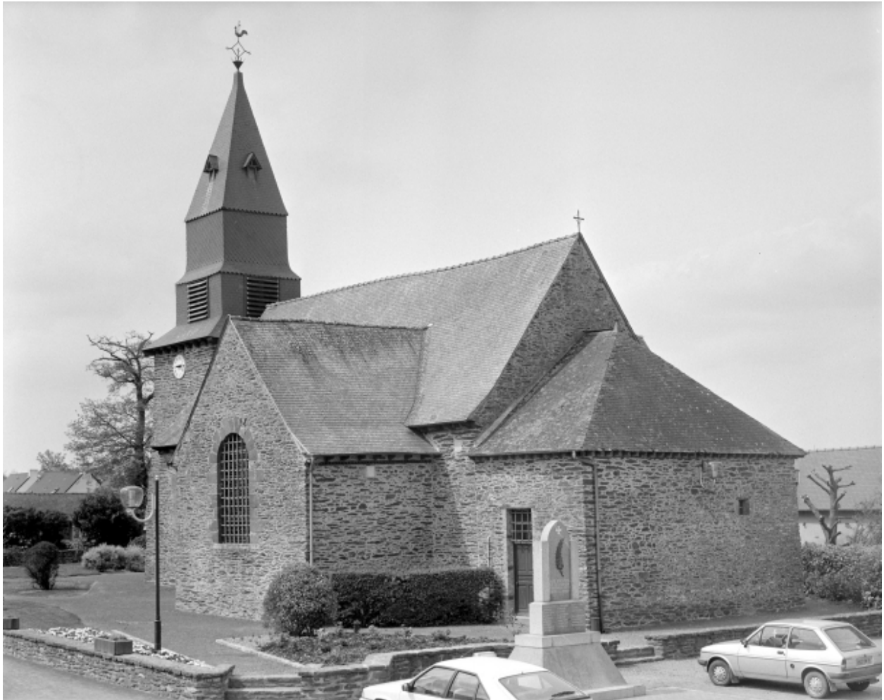
Vue générale sud est