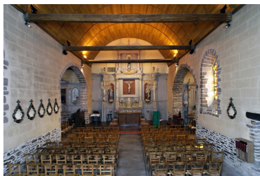
Vue intérieure prise de la nef vers le chœur IVR53_20043501515NUCA