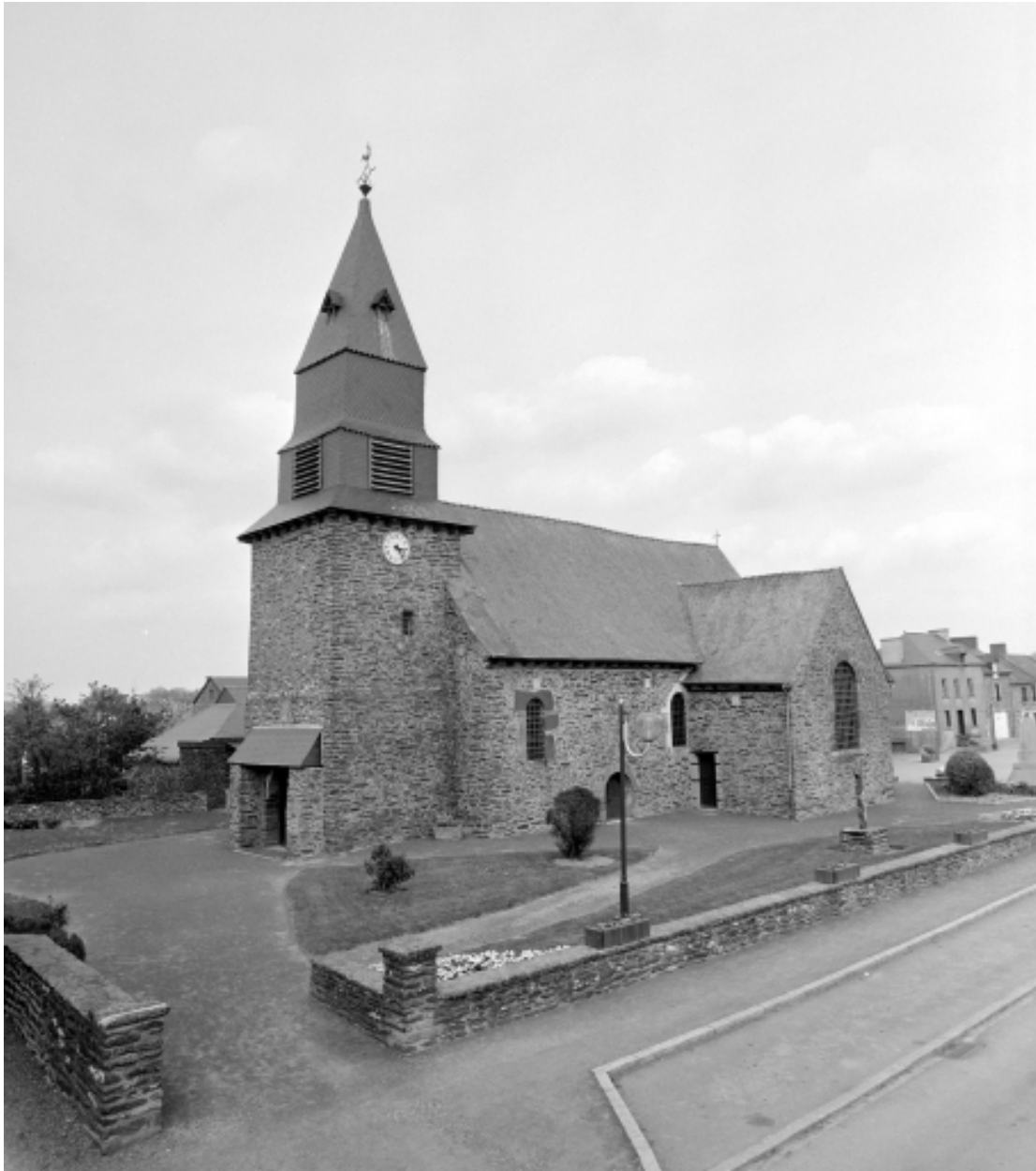
Vue générale sud ouest