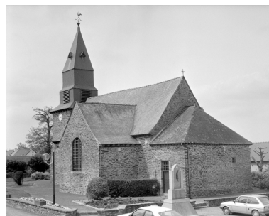
Vue générale sud est IVR53_19943500823X