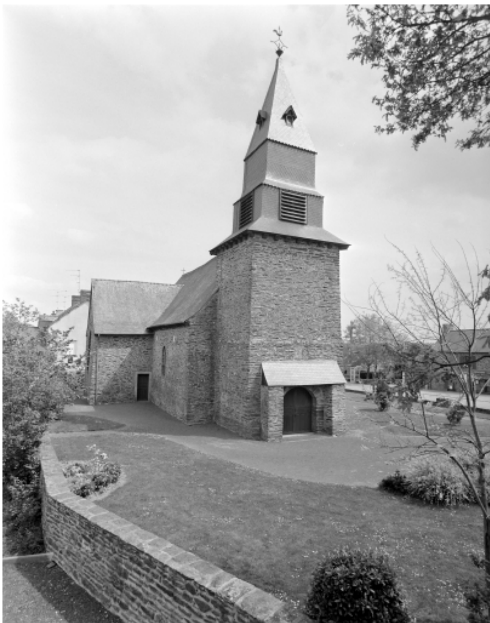
Vue générale ouest