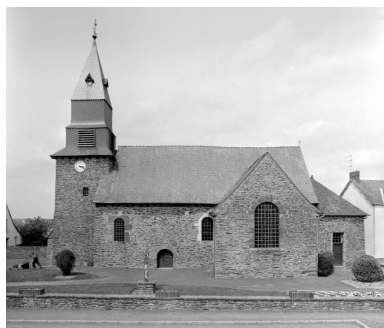
Vue générale sud IVR53_19943500824X