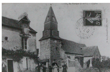
Carte postale IVR53_20033514772NUC