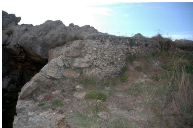
Vue de détail de la dalle de couverture des deux niches à munitions pour projectiles de 95 mm