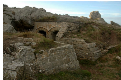
Vue des deux niches à munitions pour projectiles de 95 mm IVR53_20062903130NUCA