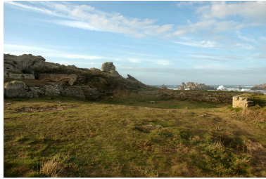
Vue générale IVR53_20062903129NUCA