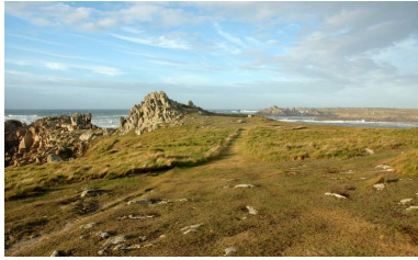
Vue de situation IVR53_20062903128NUCA