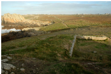
Vue générale : parapet en terre avec mur de genouillère en maçonnerie IVR53_20062903132NUCA