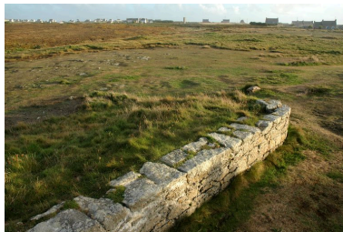
Vue de détail du mur de genouillère en maçonnerie du parapet IVR53_20062903133NUCA