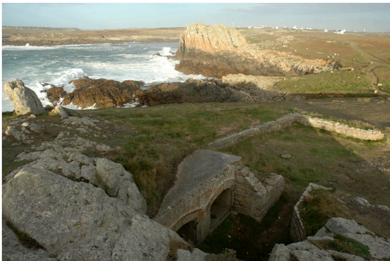
Vue générale. Au premier plan, niches à munitions pour projectiles de 95 mm