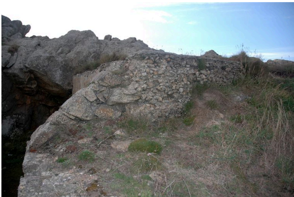
Vue de détail de la dalle de couverture des deux niches à munitions pour projectiles de 95 mm