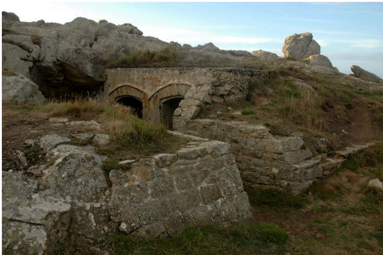
Vue des deux niches à munitions pour projectiles de 95 mm