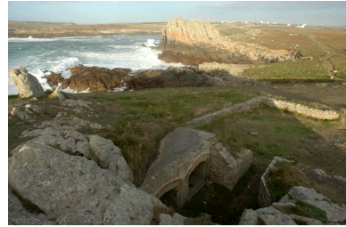
Vue générale. Au premier plan, niches à munitions pour projectiles de 95 mm IVR53_20062903131NUCA