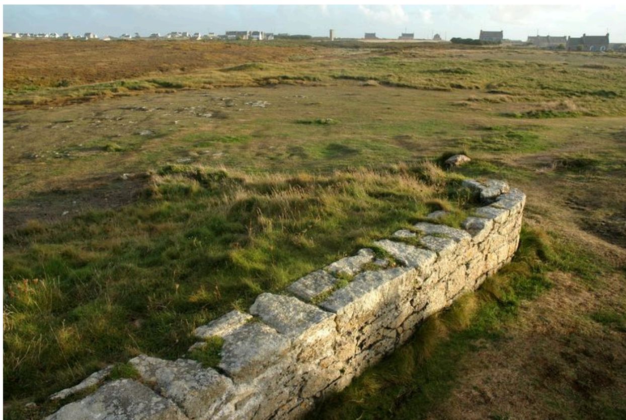
Vue de détail du mur de genouillère en maçonnerie du parapet