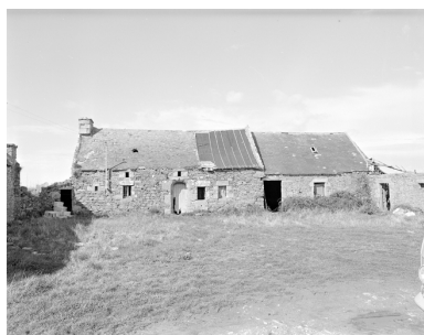
Vue générale antérieure sud. (1979) IVR53_19792900244X