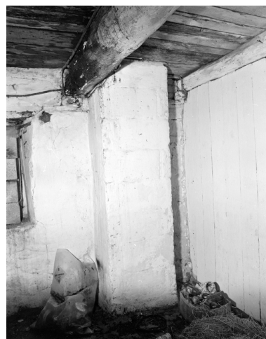
Pièce est, puits, vue intérieure. (1979) IVR53_19792900246X