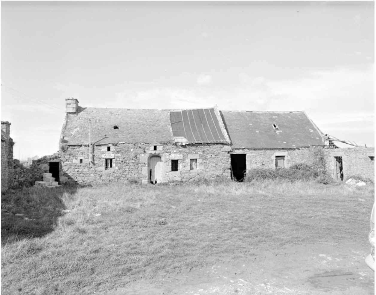
Vue générale antérieure sud. (1979)