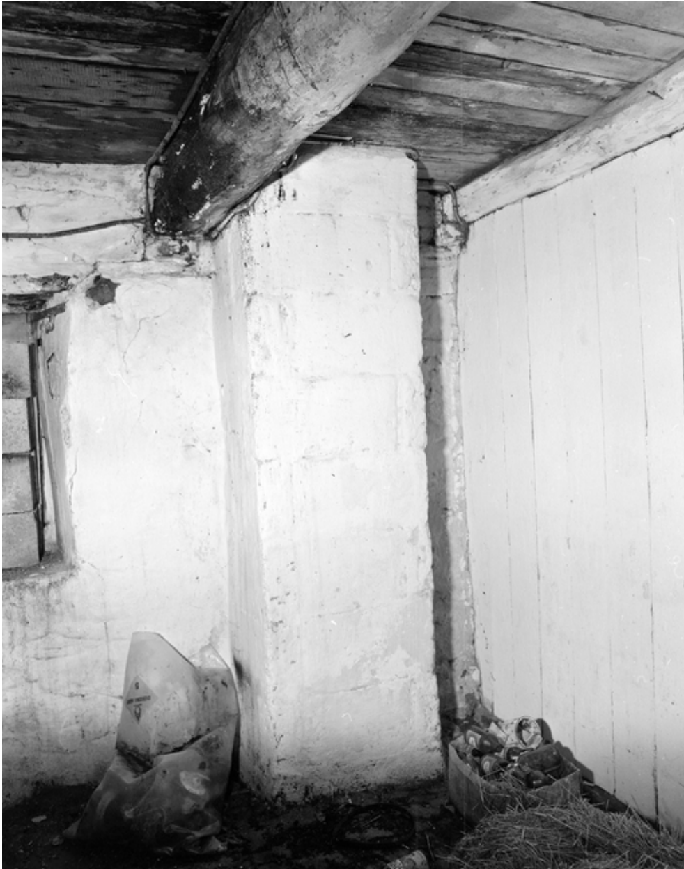
Pièce est, puits, vue intérieure. (1979)