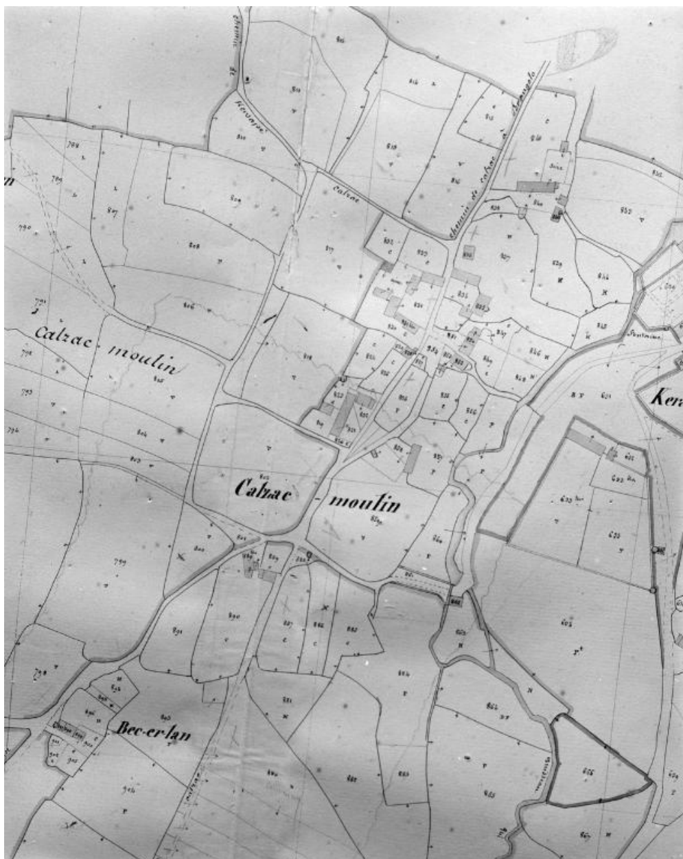
Extrait cadastral 1844, section D3