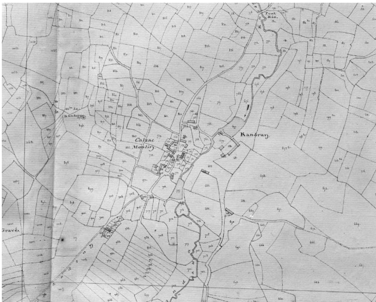
Extrait cadastral 1810, section D