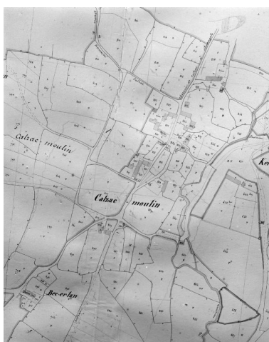
Extrait cadastral 1844, section D3 IVR53_19915601270X