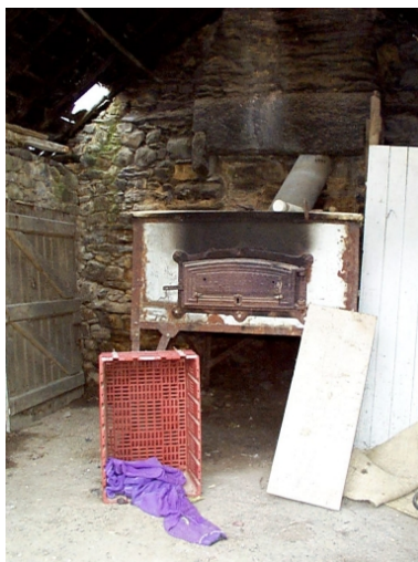
Four en fonte produit en série dans l'ancienne métairie du château : vue générale IVR53_19983503599NUCA