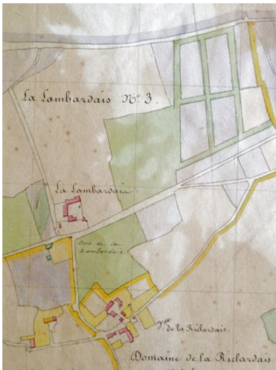
Lambardais(la) : l'ancien château sur le tableau d'assemblage du cadastre de 1830