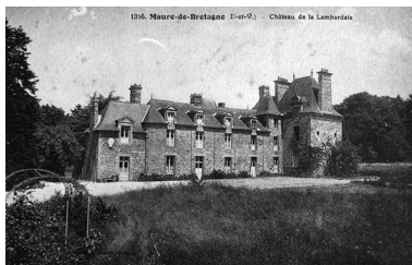
Le château (façade principale), sur une carte postale, après les agrandissements du début du 20e siècle : vue générale sud-ouest IVR53_19883500370XB