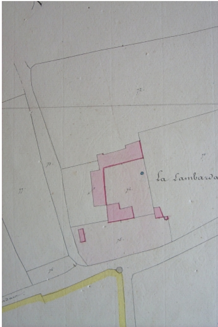
L'ancien château sur le cadastre de 1830