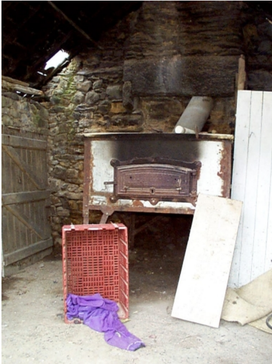
Four en fonte produit en série dans l'ancienne métairie du château : vue générale