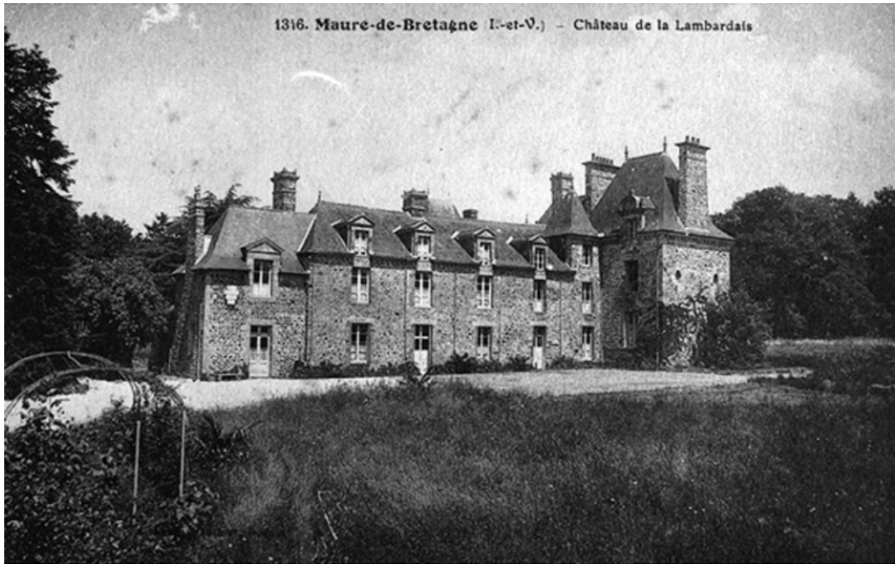
Le château (façade principale), sur une carte postale, après les agrandissements du début du 20e siècle : vue générale sud-ouest