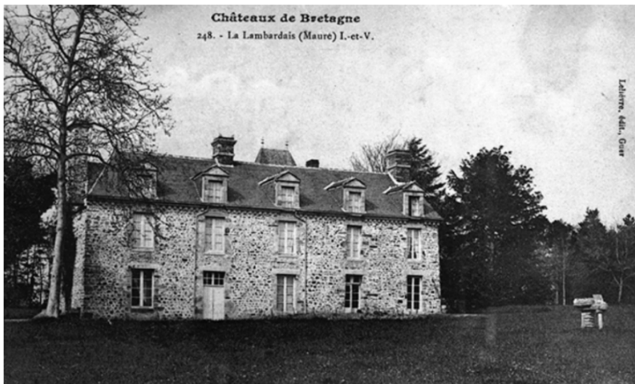
L'ancien manoir (façade principale), carte postale du début du 20e siècle : vue générale sud-ouest