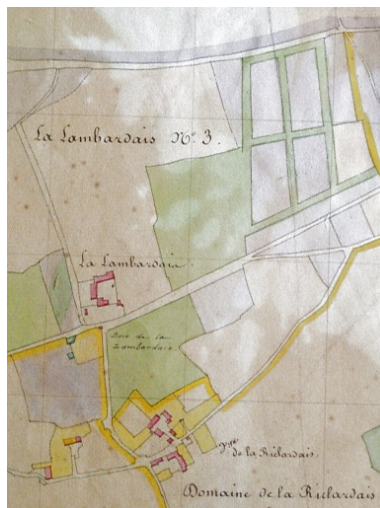
Lambardais(la) : l'ancien château sur le tableau d'assemblage du cadastre de 1830 IVR53_19983503757NUC