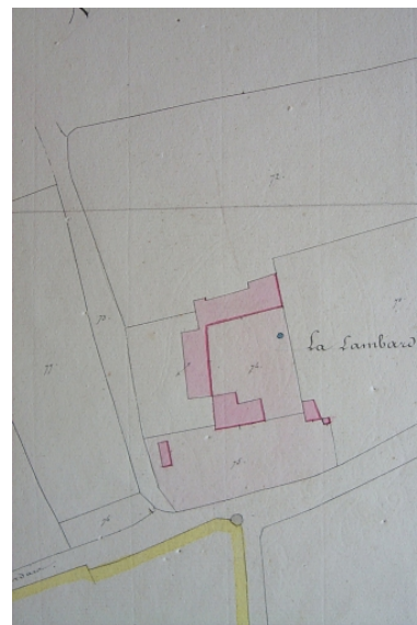
L'ancien château sur le cadastre de 1830 IVR53_19993504858NUC