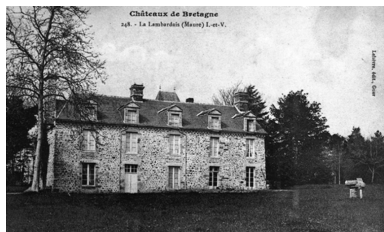
L'ancien manoir (façade principale), carte postale du début du 20e siècle : vue générale sud-ouest