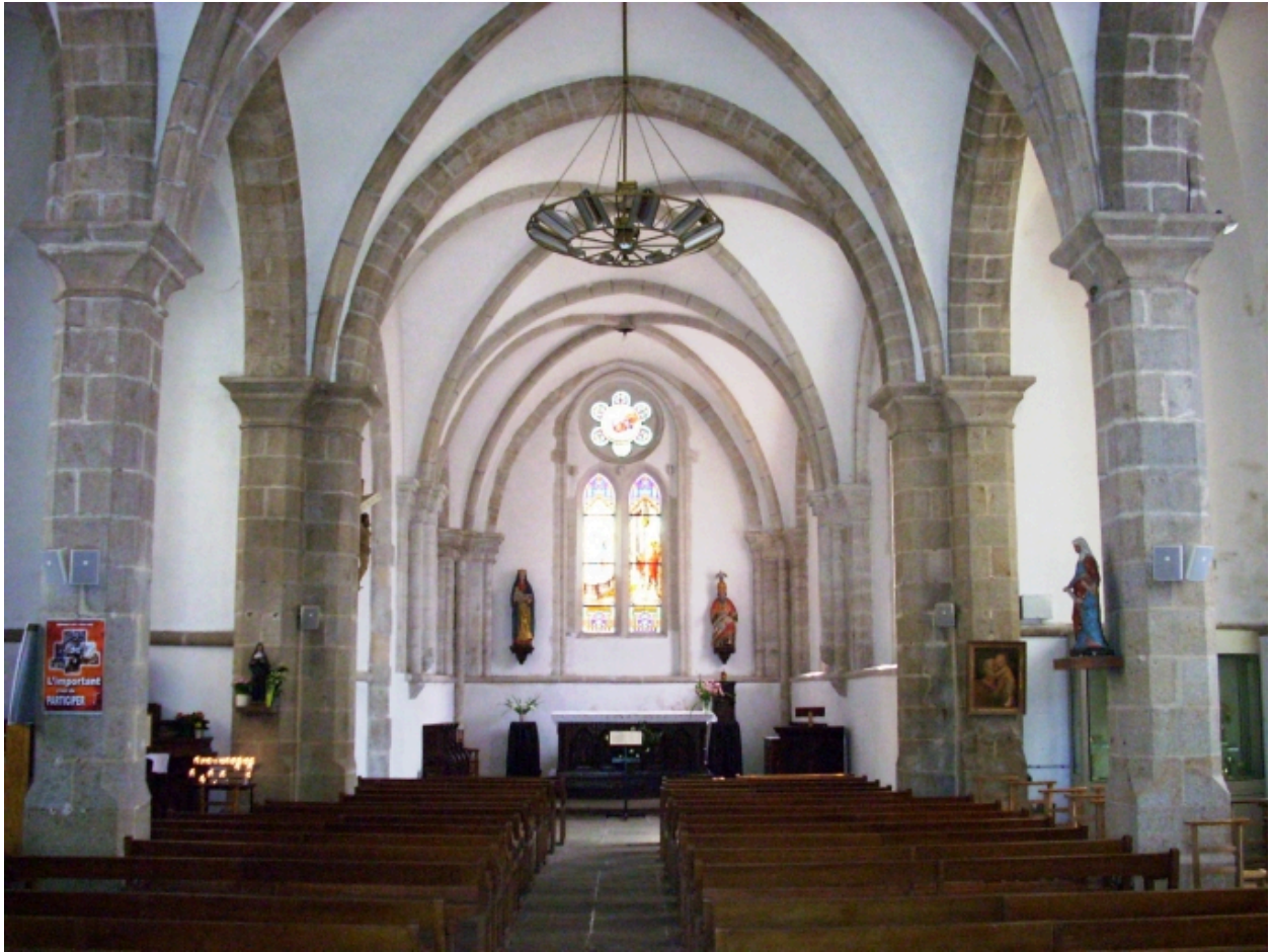
Bénodet, église paroissiale Saint-Thomas : vue axiale est