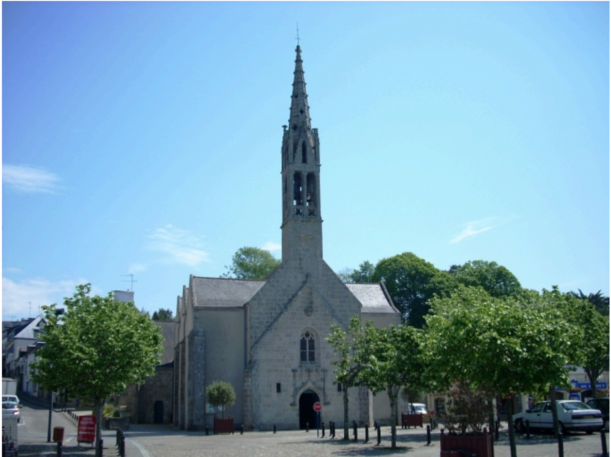
Bénodet, église paroissiale Saint-Thomas : vue générale ouest