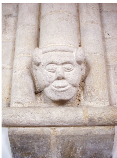
Bénodet, église paroissiale Saint-Thomas : détail sculpture dans le chœur IVR53_20082905942NUCA