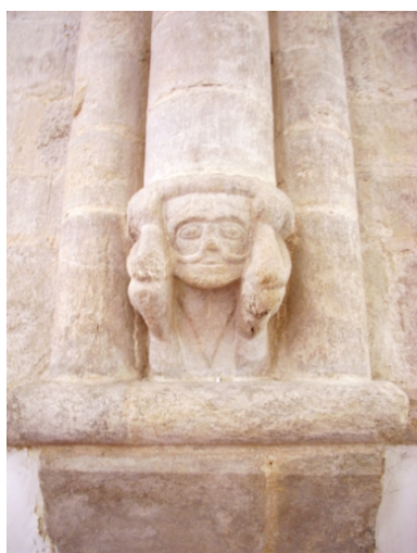
Bénodet, église paroissiale Saint-Thomas : détail sculpture dans le chœur IVR53_20082905941NUCA