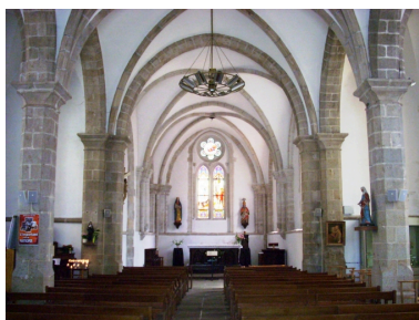
Bénodet, église paroissiale Saint-Thomas : vue axiale est