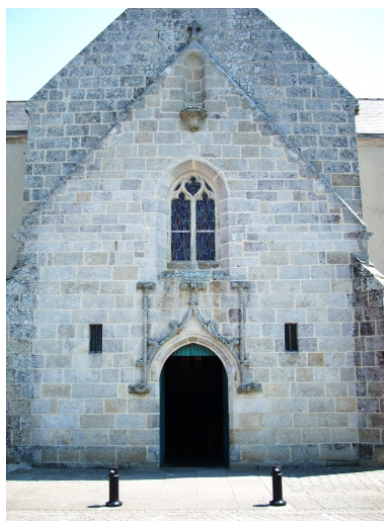
Bénodet, église paroissiale Saint-Thomas : massif occidental