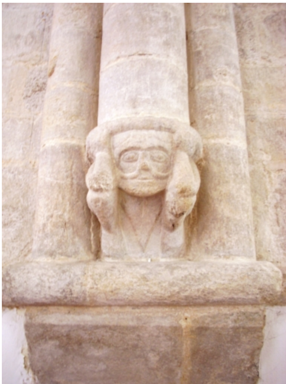
Bénodet, église paroissiale Saint-Thomas : détail sculpture dans le chœur