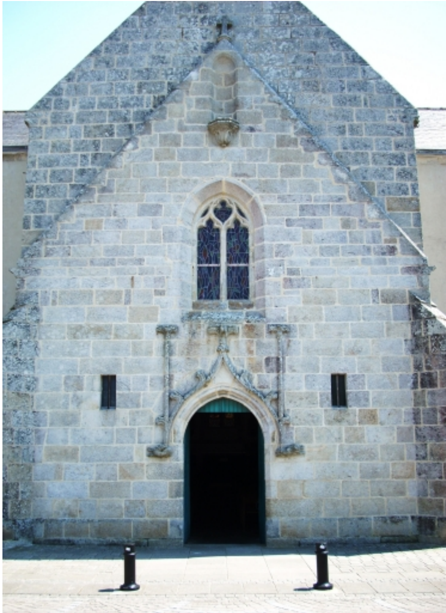
Bénodet, église paroissiale Saint-Thomas : massif occidental