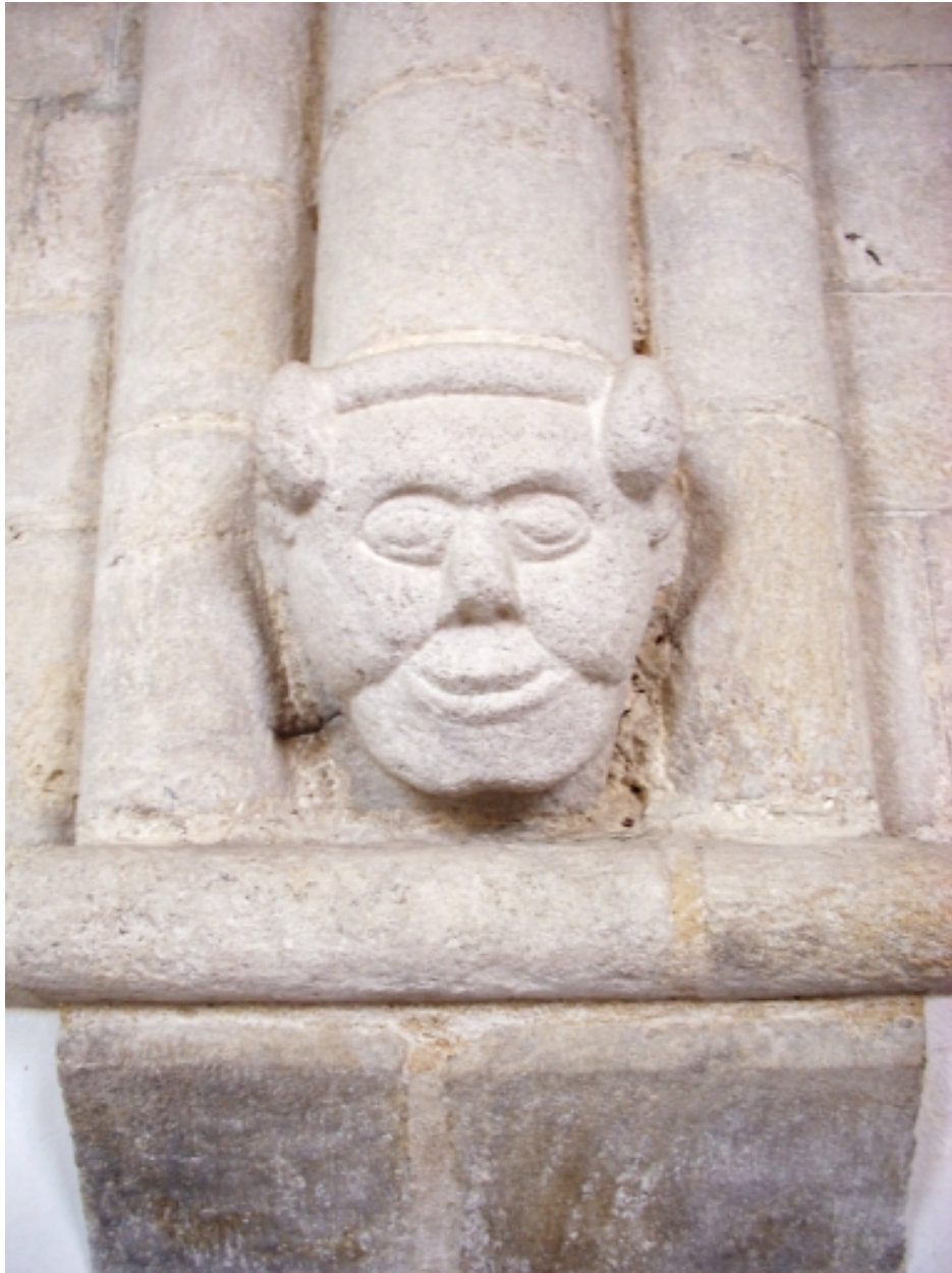
Bénodet, église paroissiale Saint-Thomas : détail sculpture dans le chœur