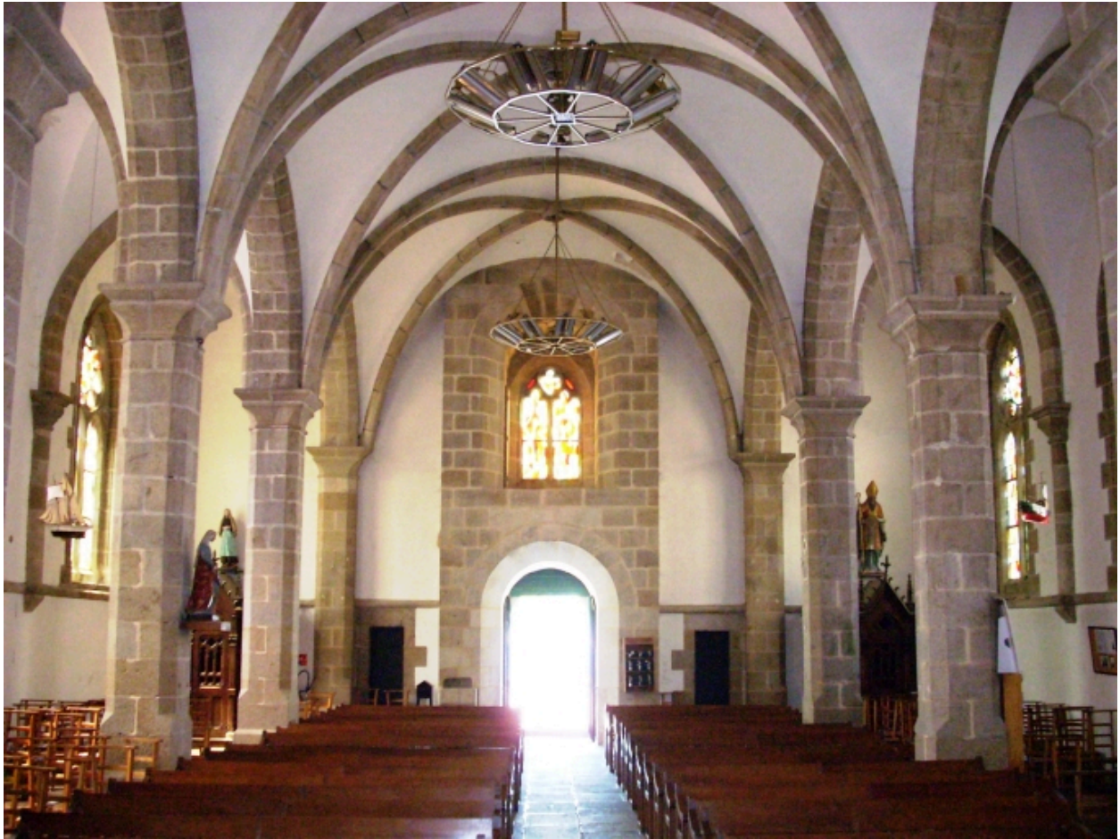
Bénodet, église paroissiale Saint-Thomas : vue axiale ouest