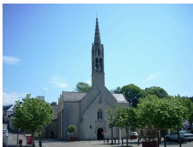
Bénodet, église paroissiale Saint-Thomas : vue générale ouest IVR53_20082905936NUCA