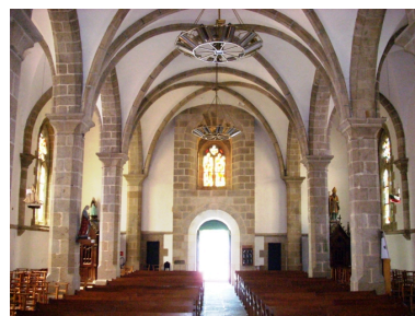
Bénodet, église paroissiale Saint-Thomas : vue axiale ouest