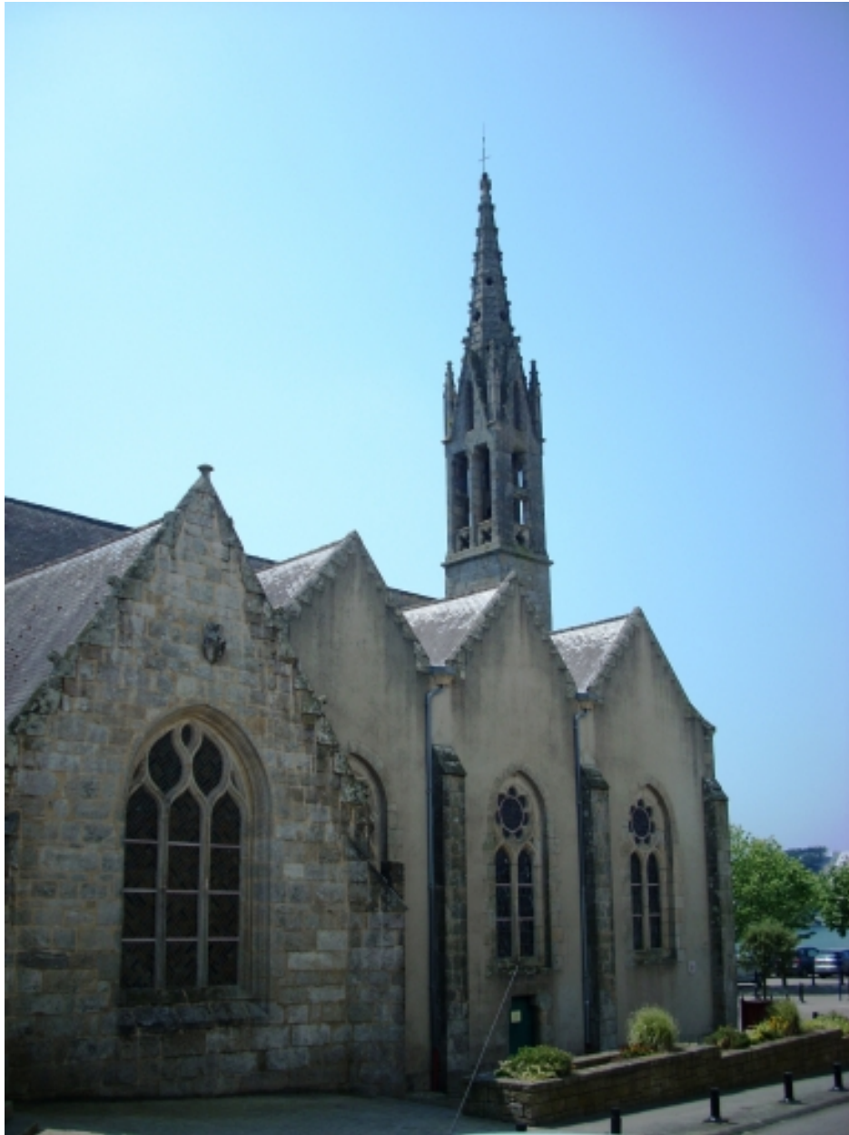
Bénodet, église paroissiale Saint-Thomas : vue générale nord-est