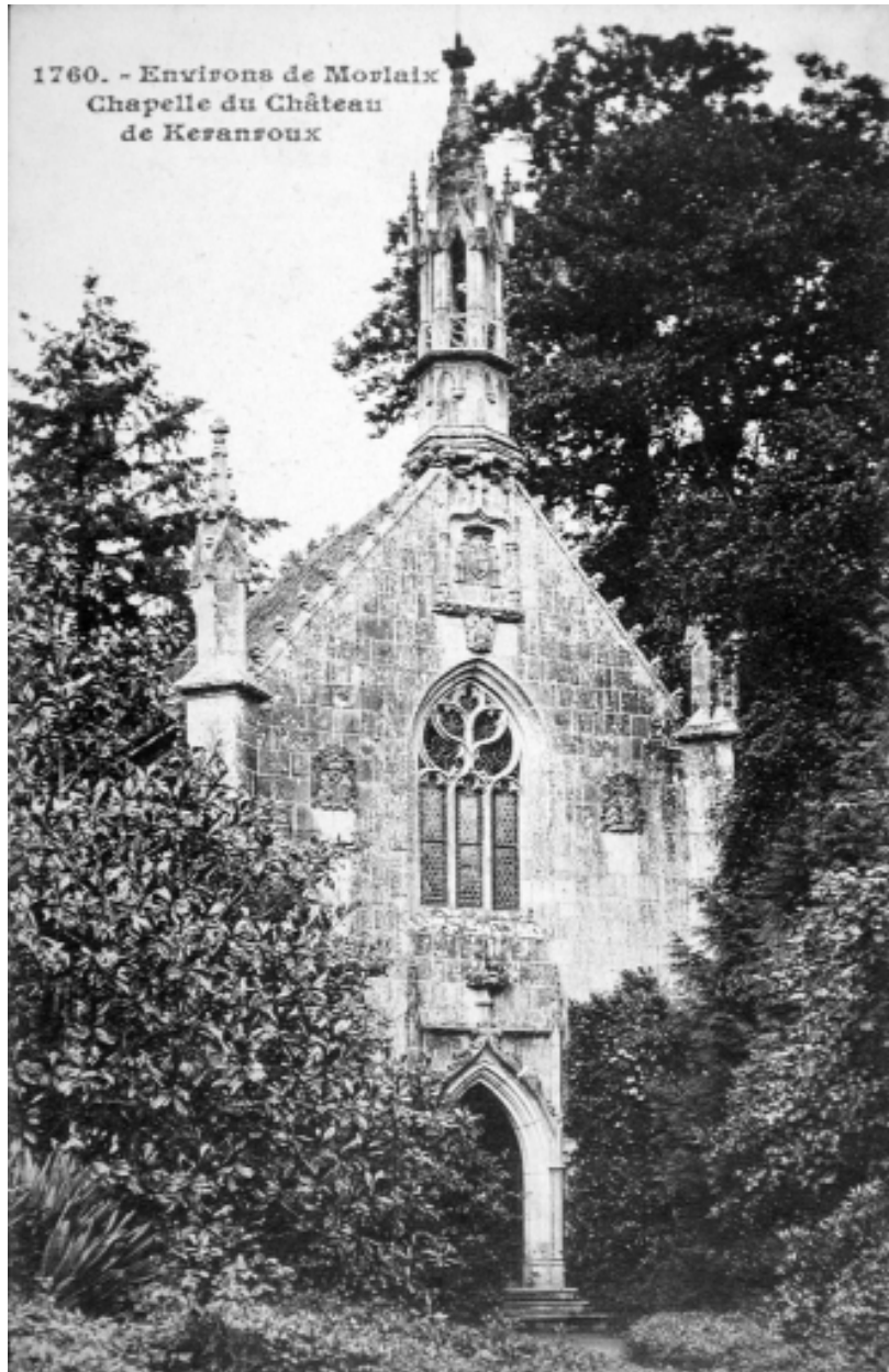
1760. - Environs de Morlaix Chapelle du Château de Keranroux