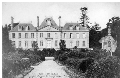
Vue générale IVR53_20042905485NUCB