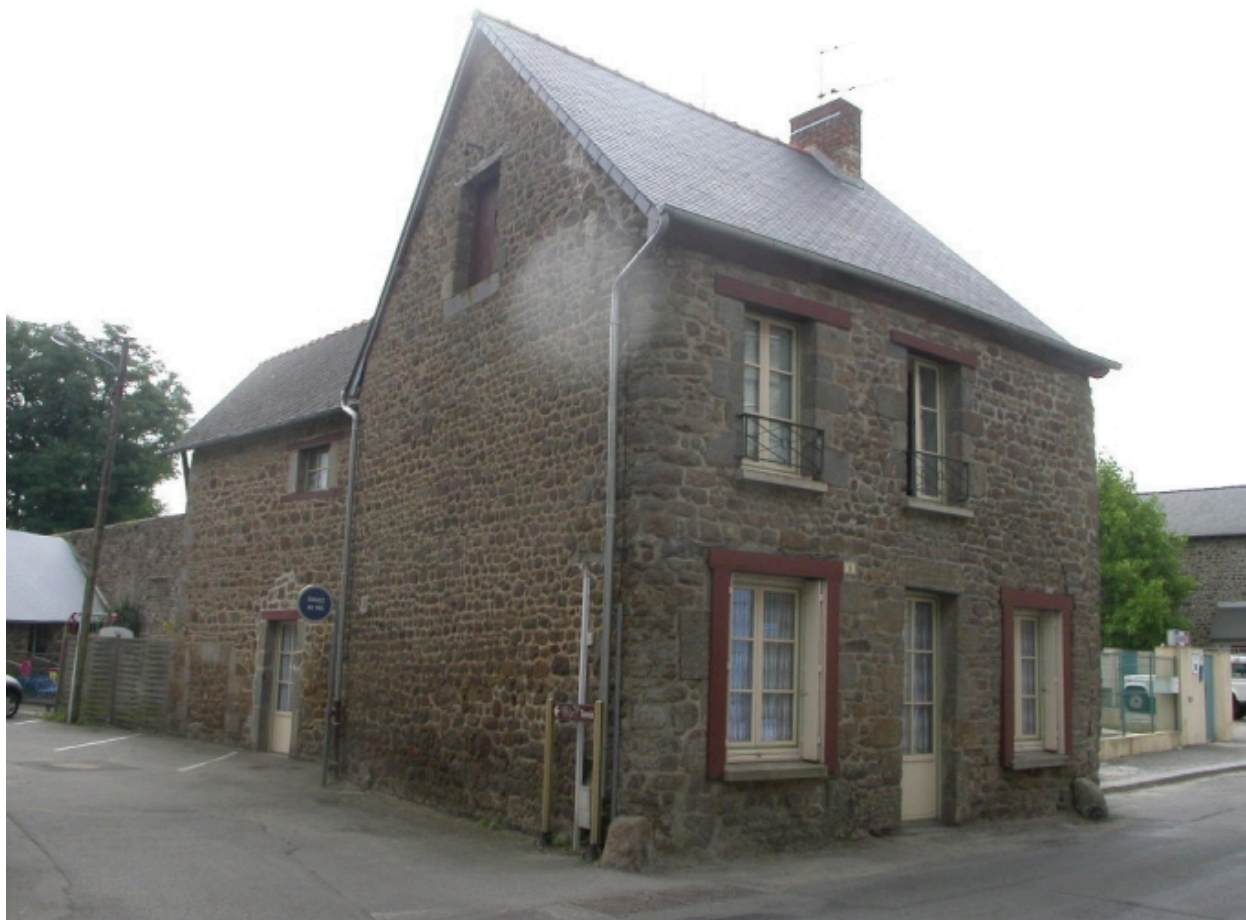
Vue générale nord-ouest