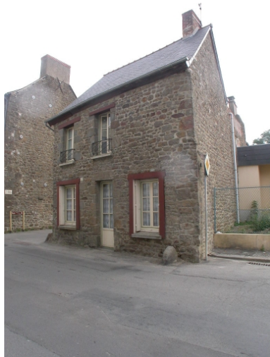
Vue sud-ouest IVR53_20053518424NUCA