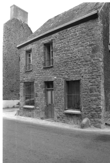
Vue sud-ouest