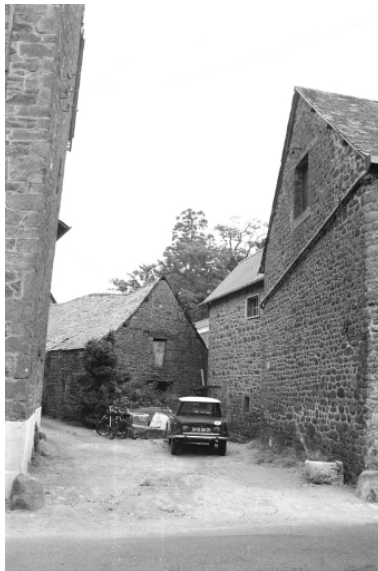
Pignon nord IVR53_19753501077Z