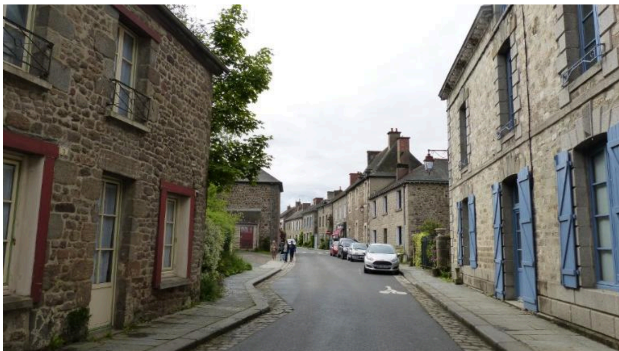
Vue générale de la rue