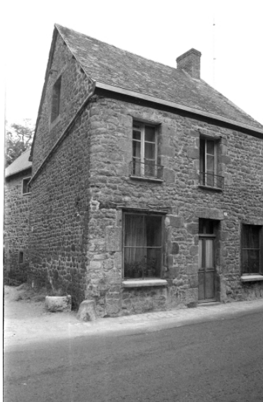
Vue nord-ouest