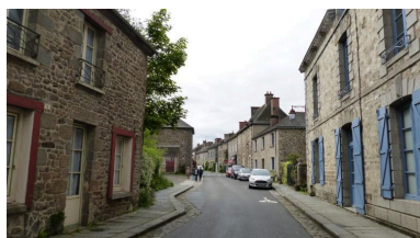
Vue générale de la rue IVR53_20253510307NUCA