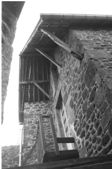
Mur postérieur IVR53_19753501080Z