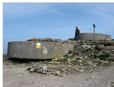
Poste de tir à l'ouest du cap de la Chèvre