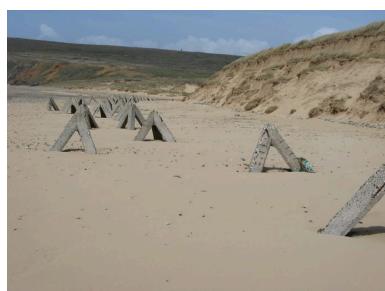
Obstacles de la plage de la Palue IVR53_20082908317NUCA