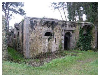
Réduit de type n°2 de la batterie basse du Kador IVR53_20072908876NUCA