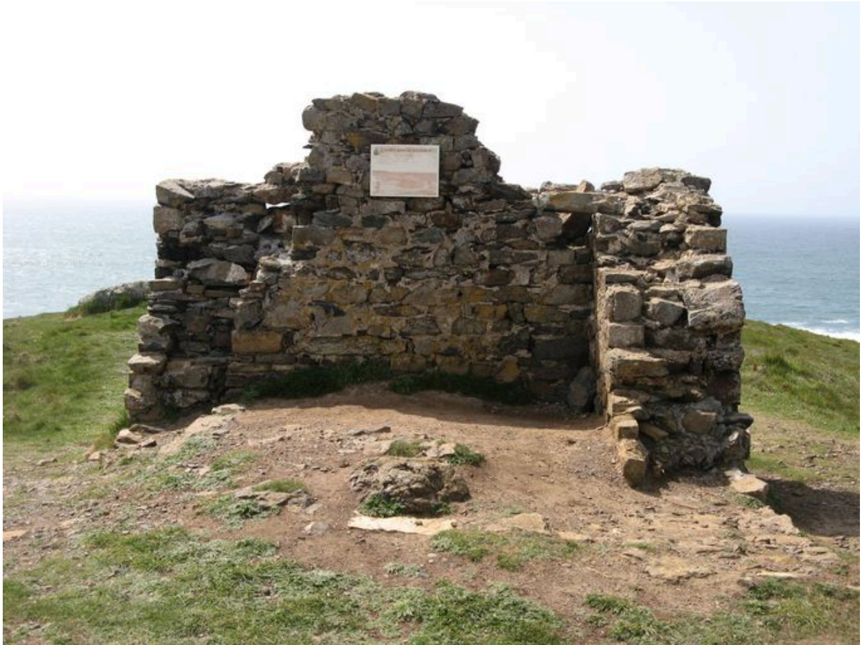
Corps de garde de Lostmarc'h