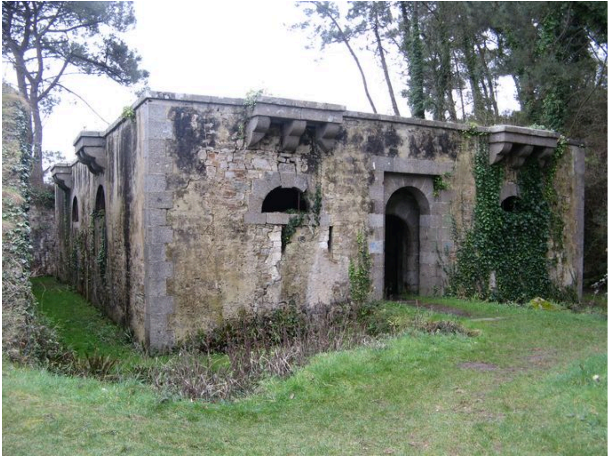
Réduit de type n°2 de la batterie basse du Kador