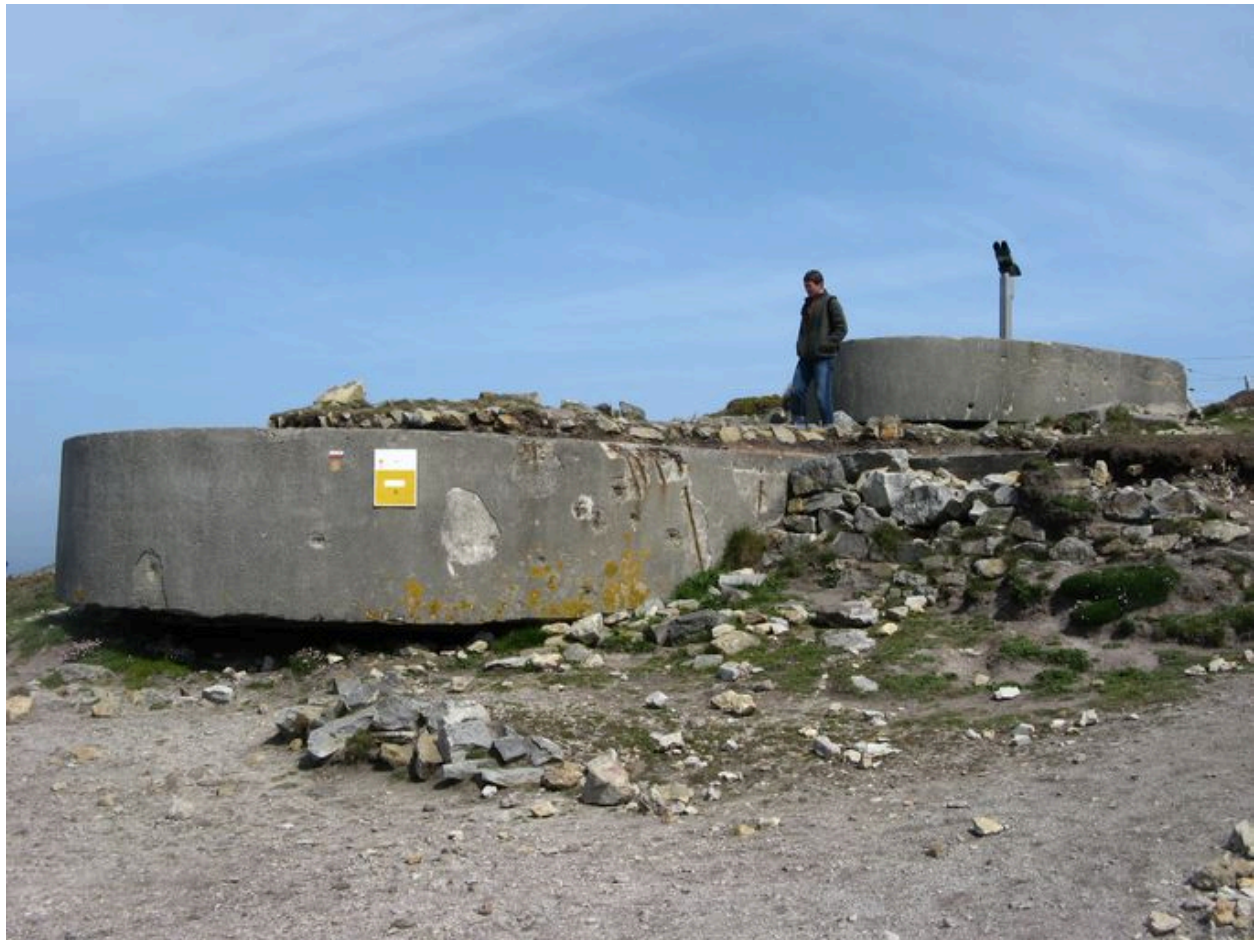
Poste de tir à l'ouest du cap de la Chèvre