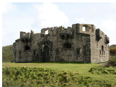
Fort de l'Aber