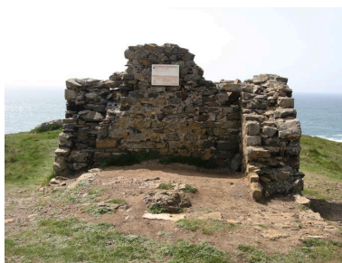
Corps de garde de Lostmarc'h IVR53_20082908321NUCA