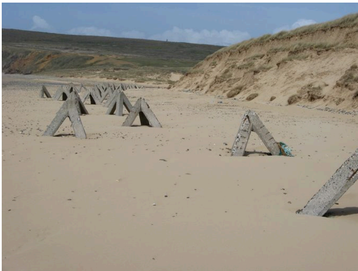
Obstacles de la plage de la Palue