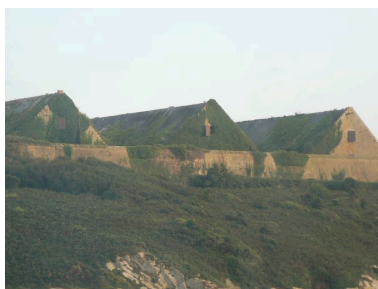
Trois poudrières de l'île des Morts