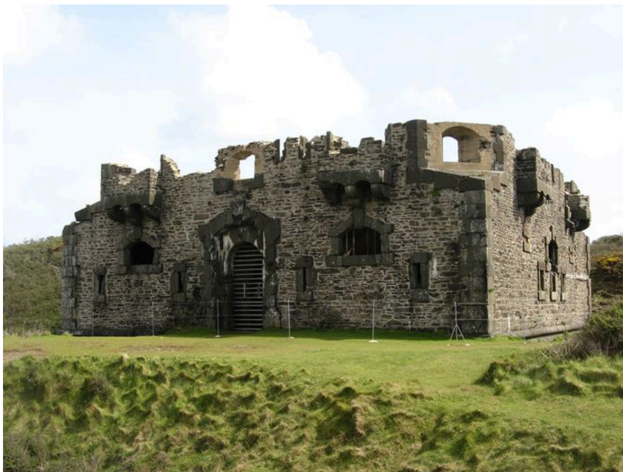
Fort de l'Aber