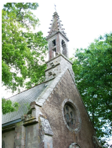
Quimper, chapelle de Cuzon : vue axiale est IVR53_20082906399NUCA