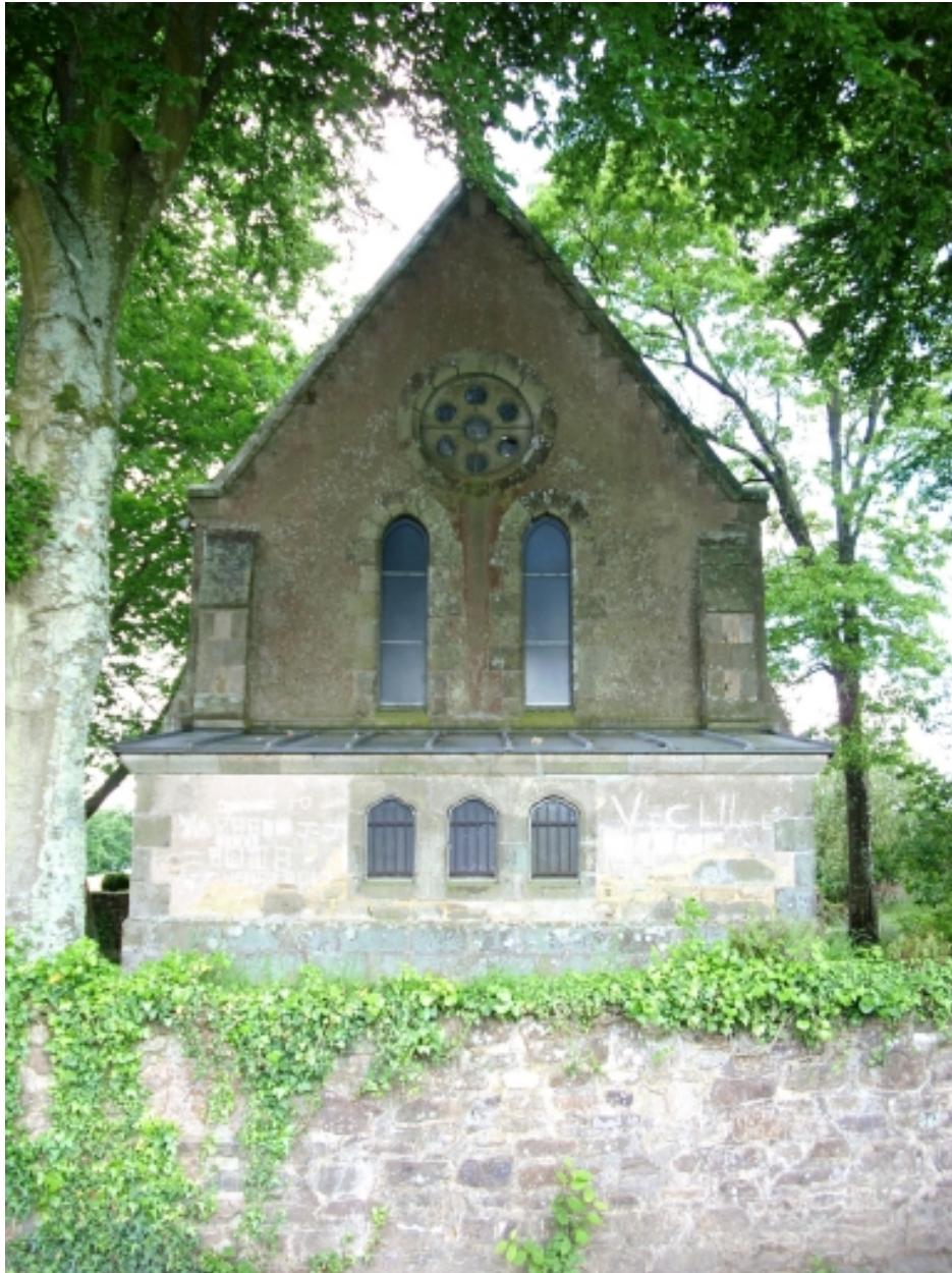
Quimper, chapelle de Cuzon : élévation est