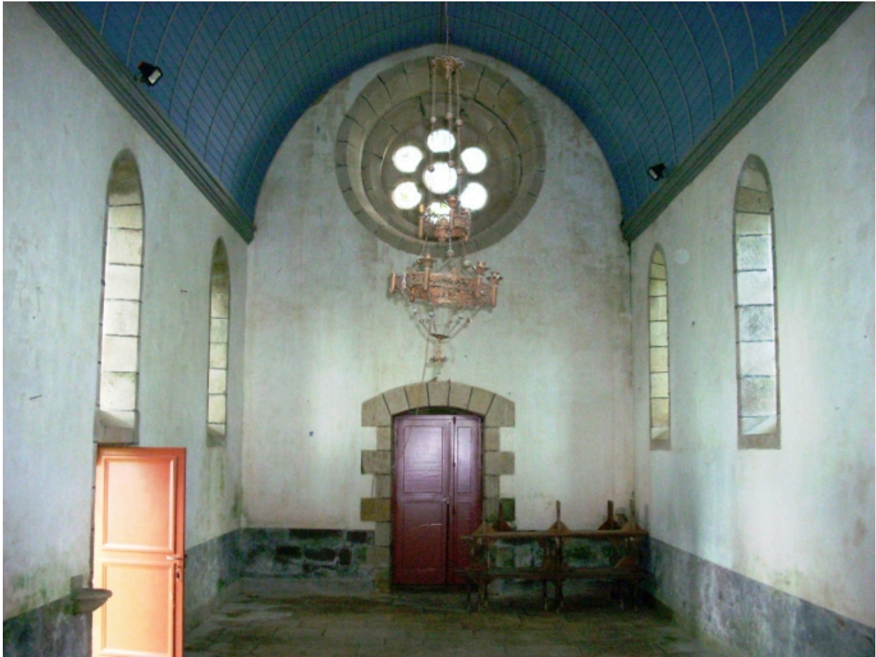
Quimper, chapelle de Cuzon : vue axiale ouest