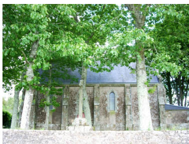
Quimper, chapelle de Cuzon : élévation sud