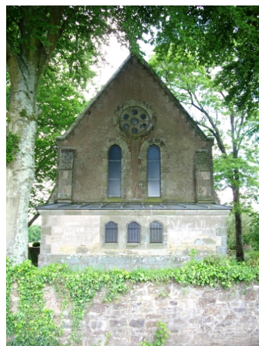
Quimper, chapelle de Cuzon : élévation est IVR53_20082906397NUCA