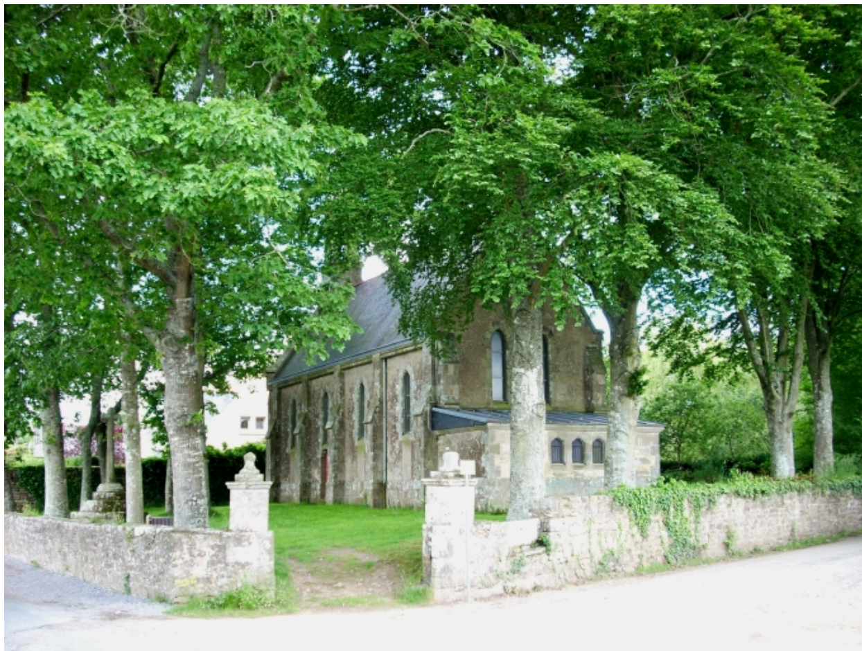
Quimper, chapelle de Cuzon : vue générale sud-est