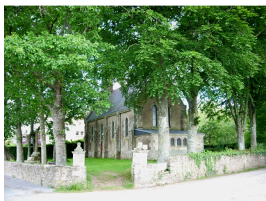
Quimper, chapelle de Cuzon : vue générale sud-est