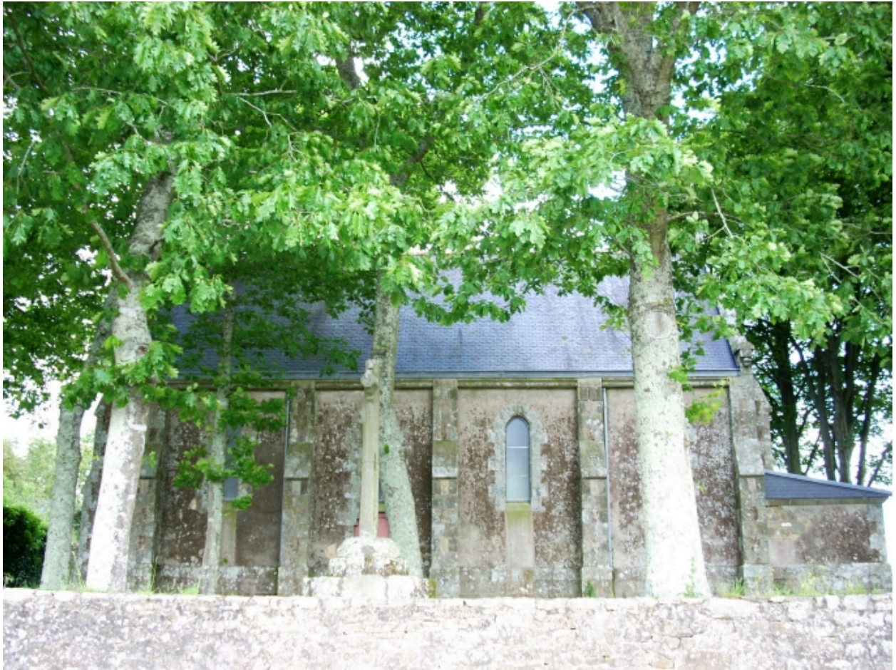
Quimper, chapelle de Cuzon : élévation sud