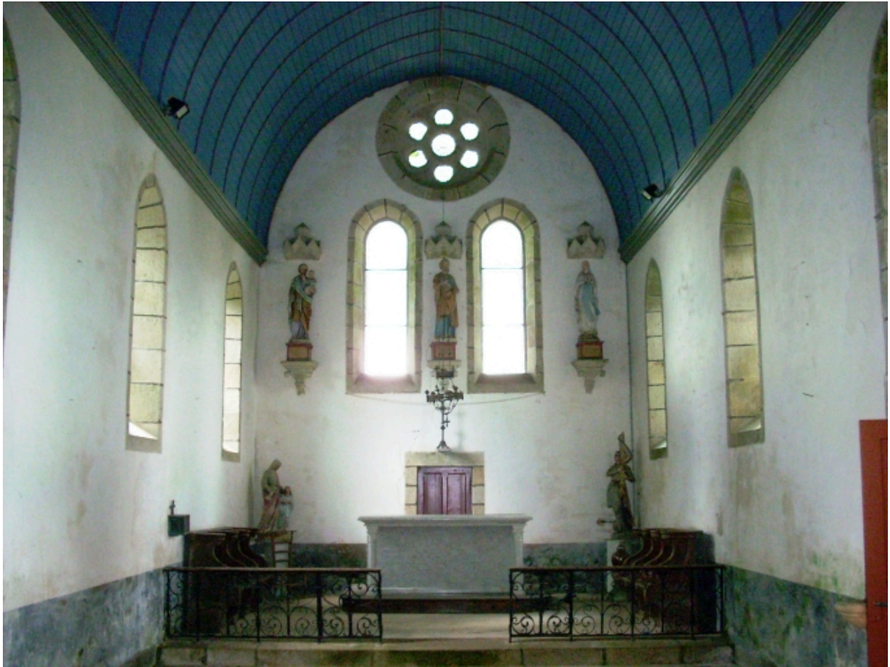
Quimper, chapelle de Cuzon : vue axiale est