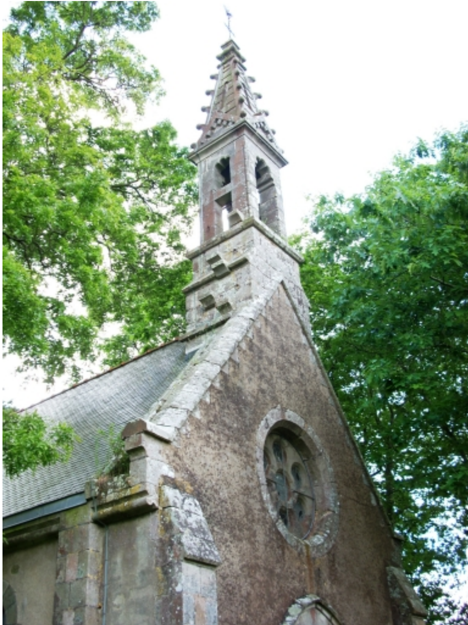
Quimper, chapelle de Cuzon : détail clocher depuis le nord-ouest