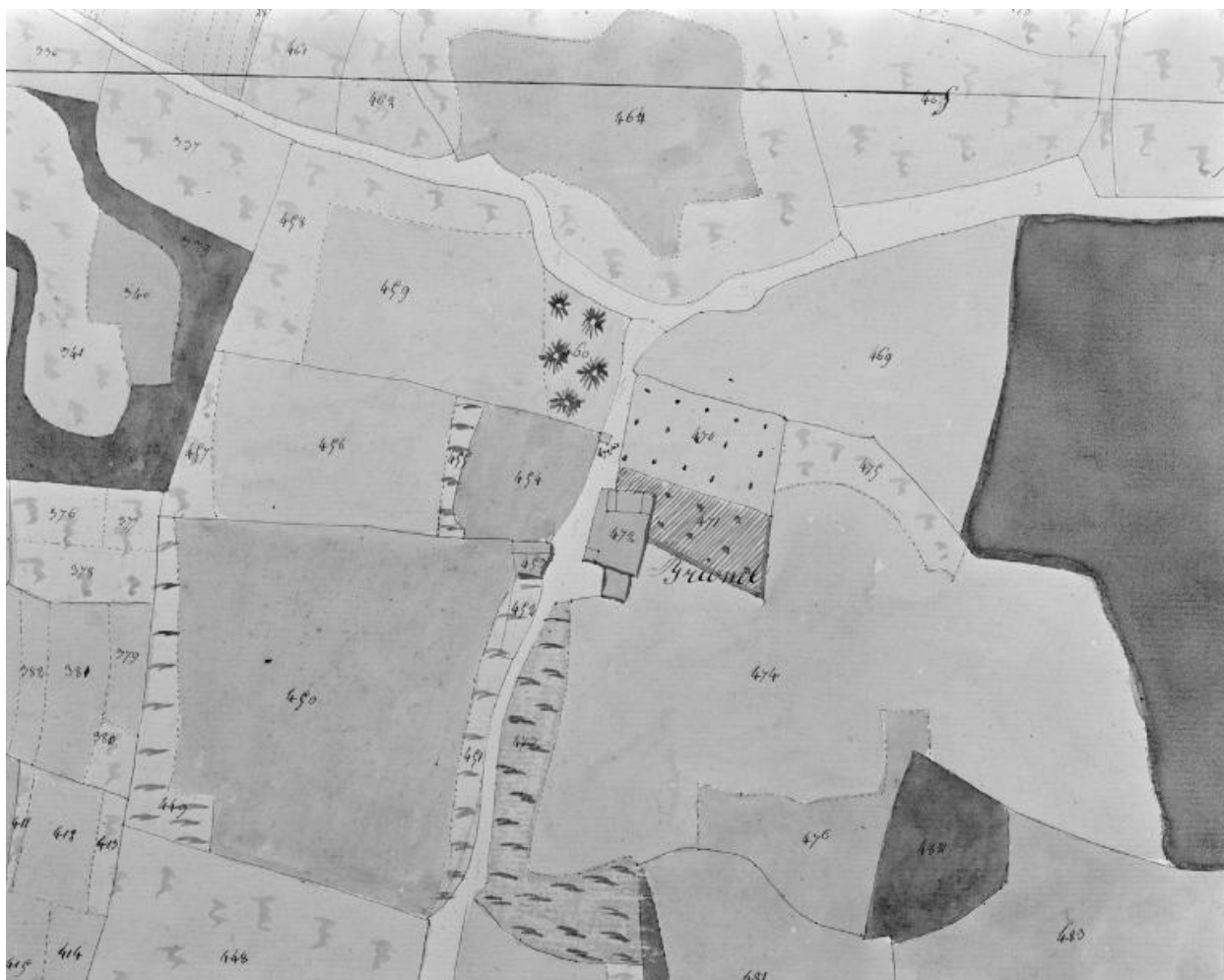
Extrait cadastral 1810, section B.