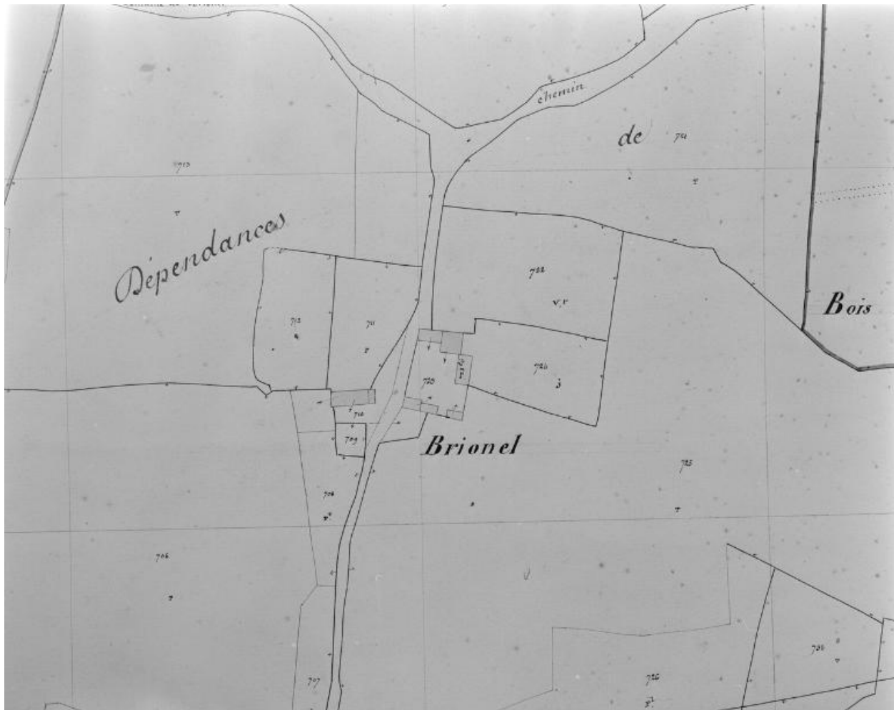
Extrait cadastral 1840, section B4.