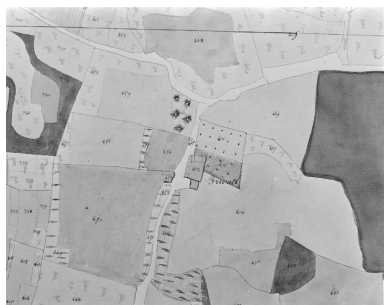
Extrait cadastral 1810, section B. IVR53_19935600312X