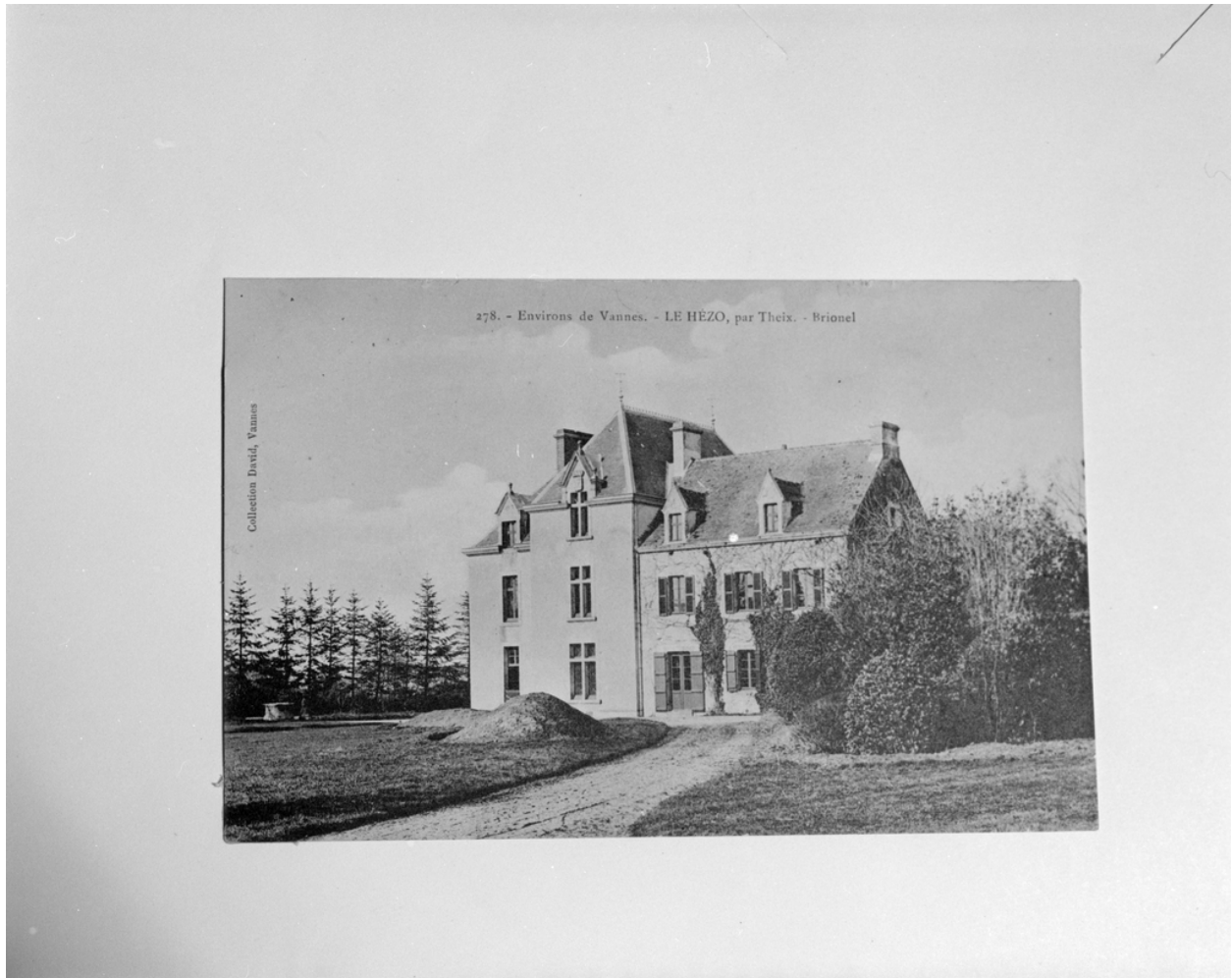
Vue générale sud. Carte postale ancienne.