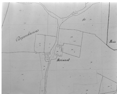
Extrait cadastral 1840, section B4. IVR53_19935600310X