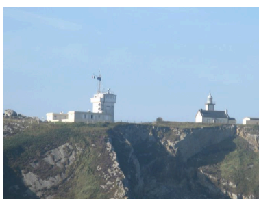
Vue d'ensemble : le sémaphore et le phare du Toulinguet IVR53_20082908291NUCA