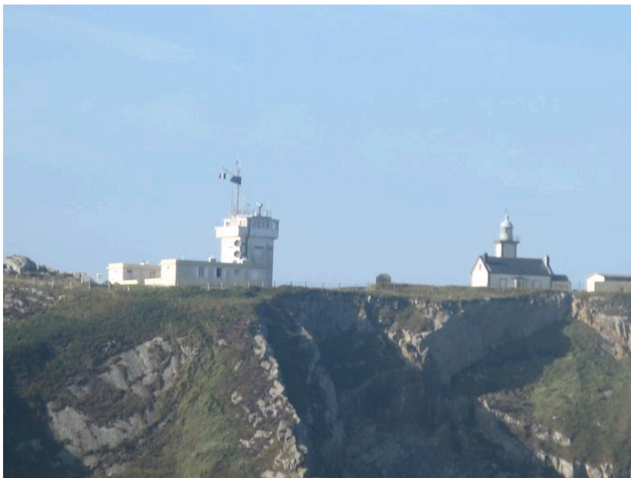
Vue d'ensemble : le sémaphore et le phare du Toulinguet