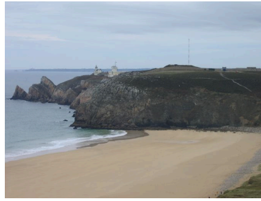
Vue générale : phare, sémaphore et enceinte fortifiée IVR53_20062908307NUCA