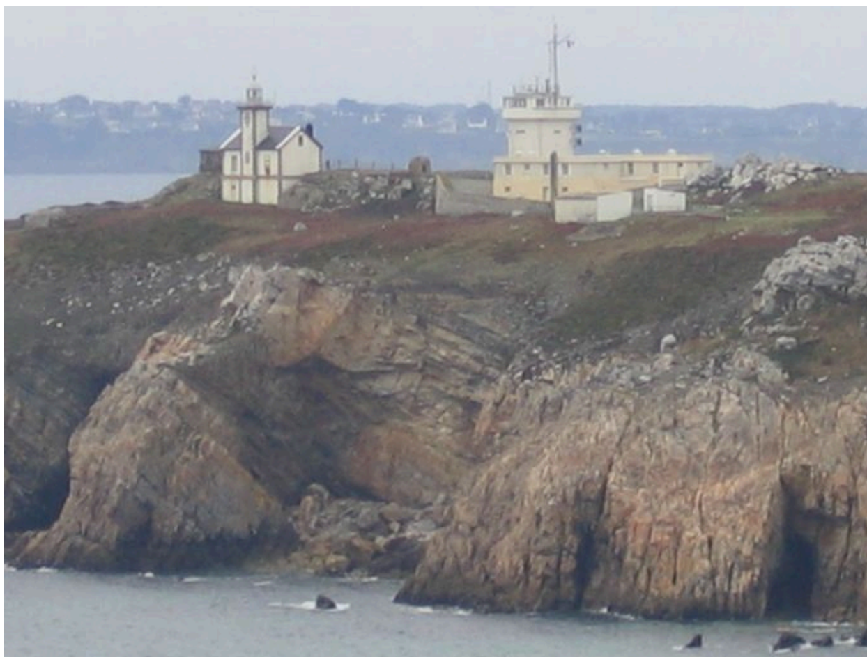
Vue d'ensemble : le phare et le sémaphore du Toulinguet