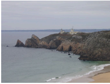
Vue générale : pointe du Toulinguet IVR53_20062908306NUCA