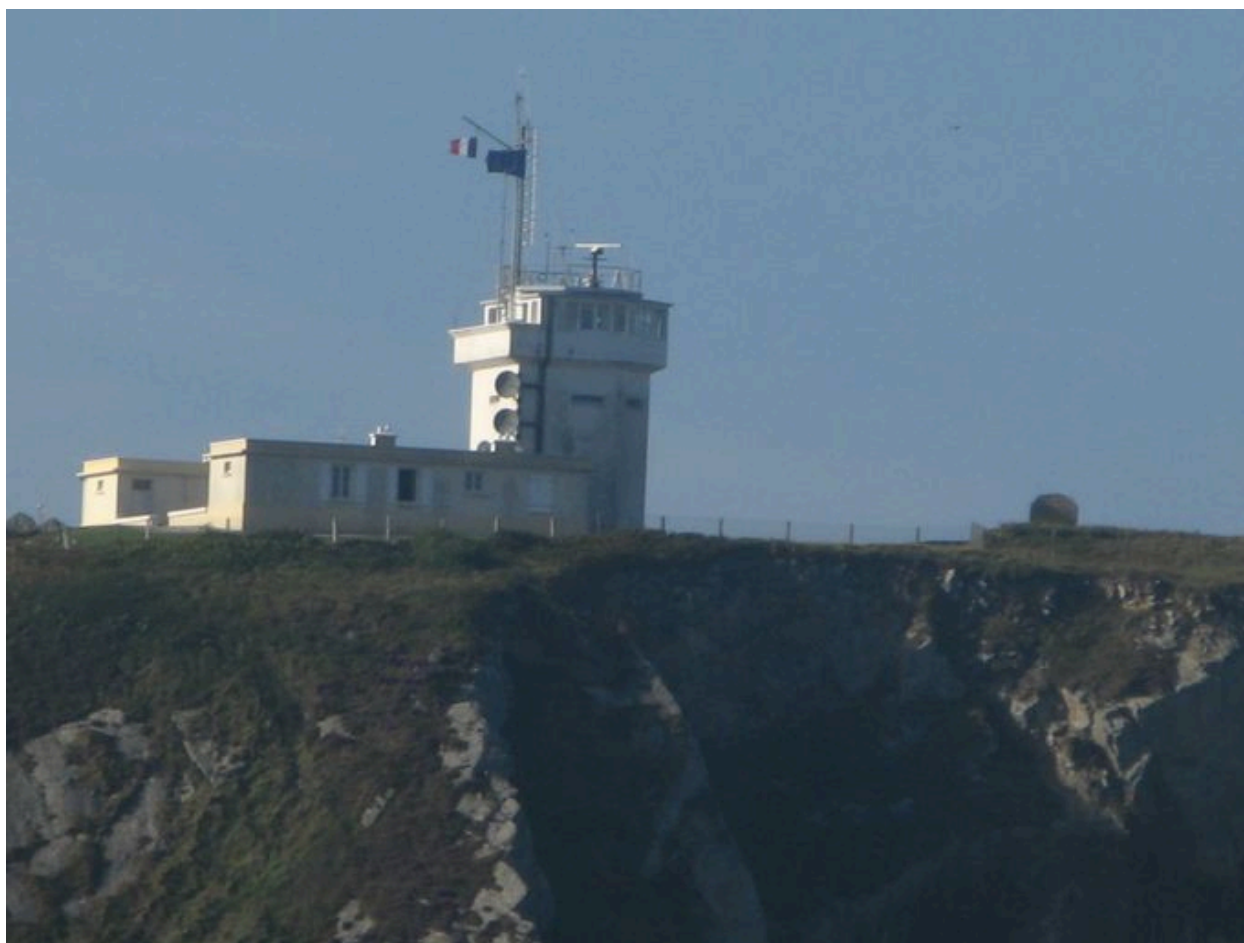
Vue générale du sémaphore du Toulinguet