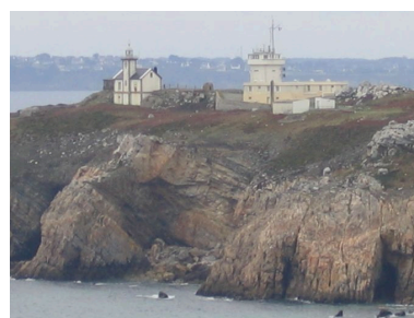
Vue d'ensemble : le phare et le sémaphore du Toulinguet