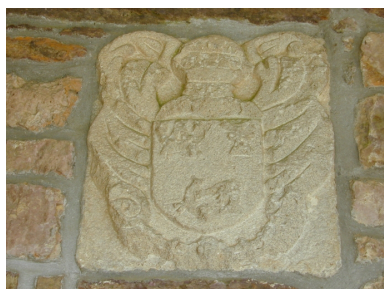
Détail : face sud, blason ouest sous le porche