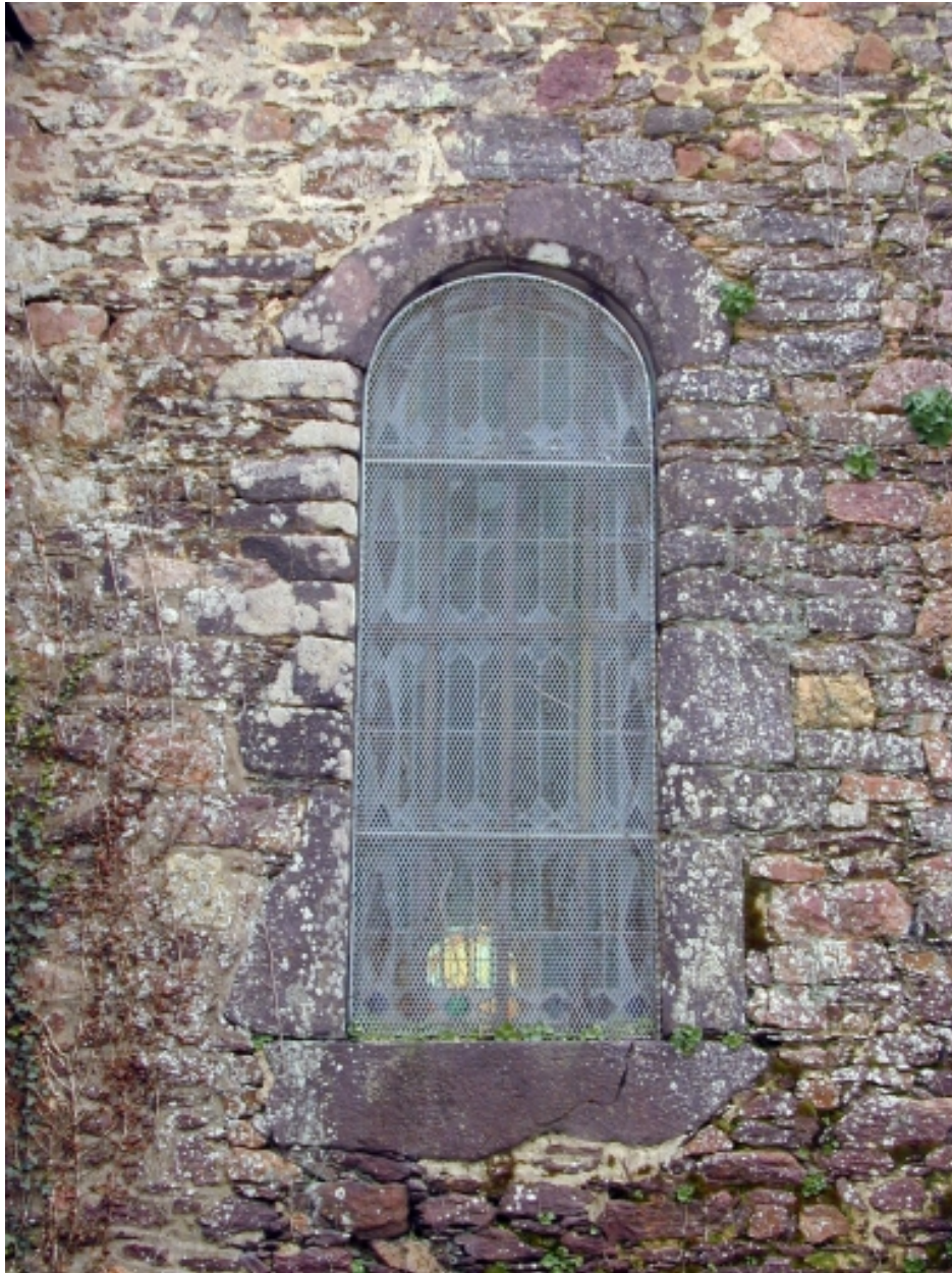
Détail : face sud, fenêtre datée 1736