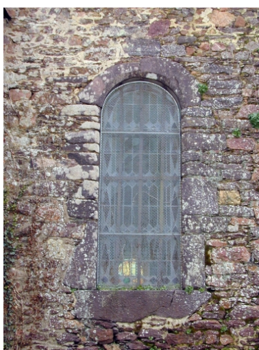
Détail : face sud, fenêtre datée 1736 IVR53_20023509849NUCA