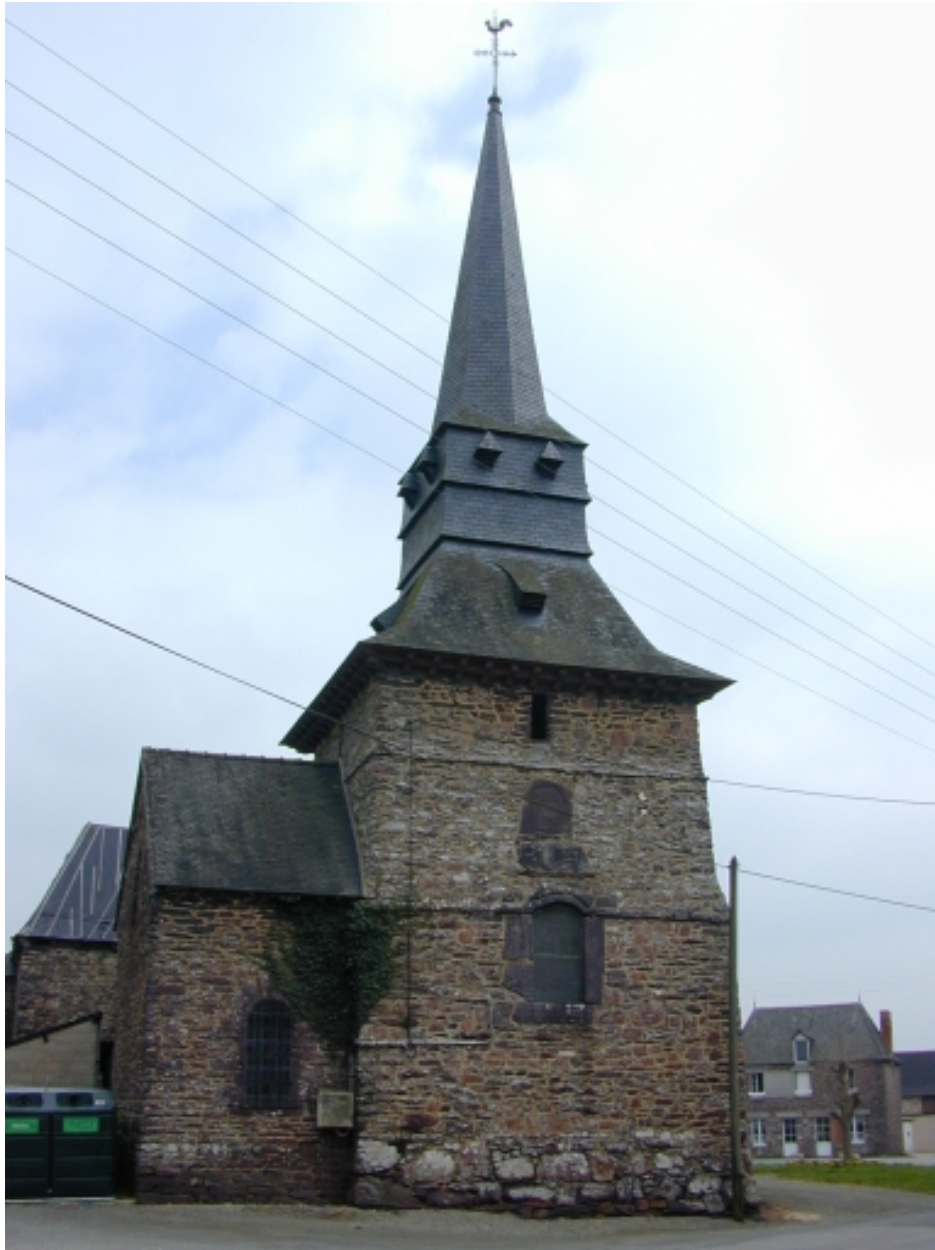
Détail : face ouest, la tour