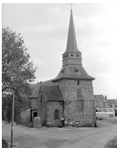
Détail : face ouest, la tour IVR53_19943500822X