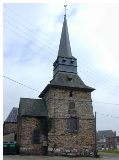
Détail : face ouest, la tour IVR53_20023509846NUCA