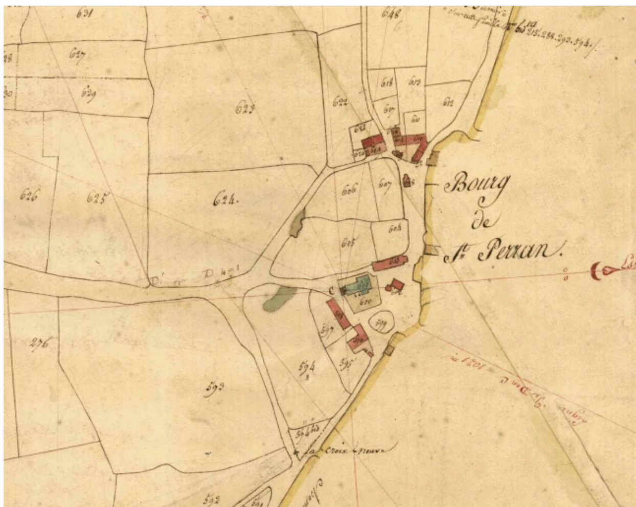
L'église et son enclos sur le cadastre de 1823