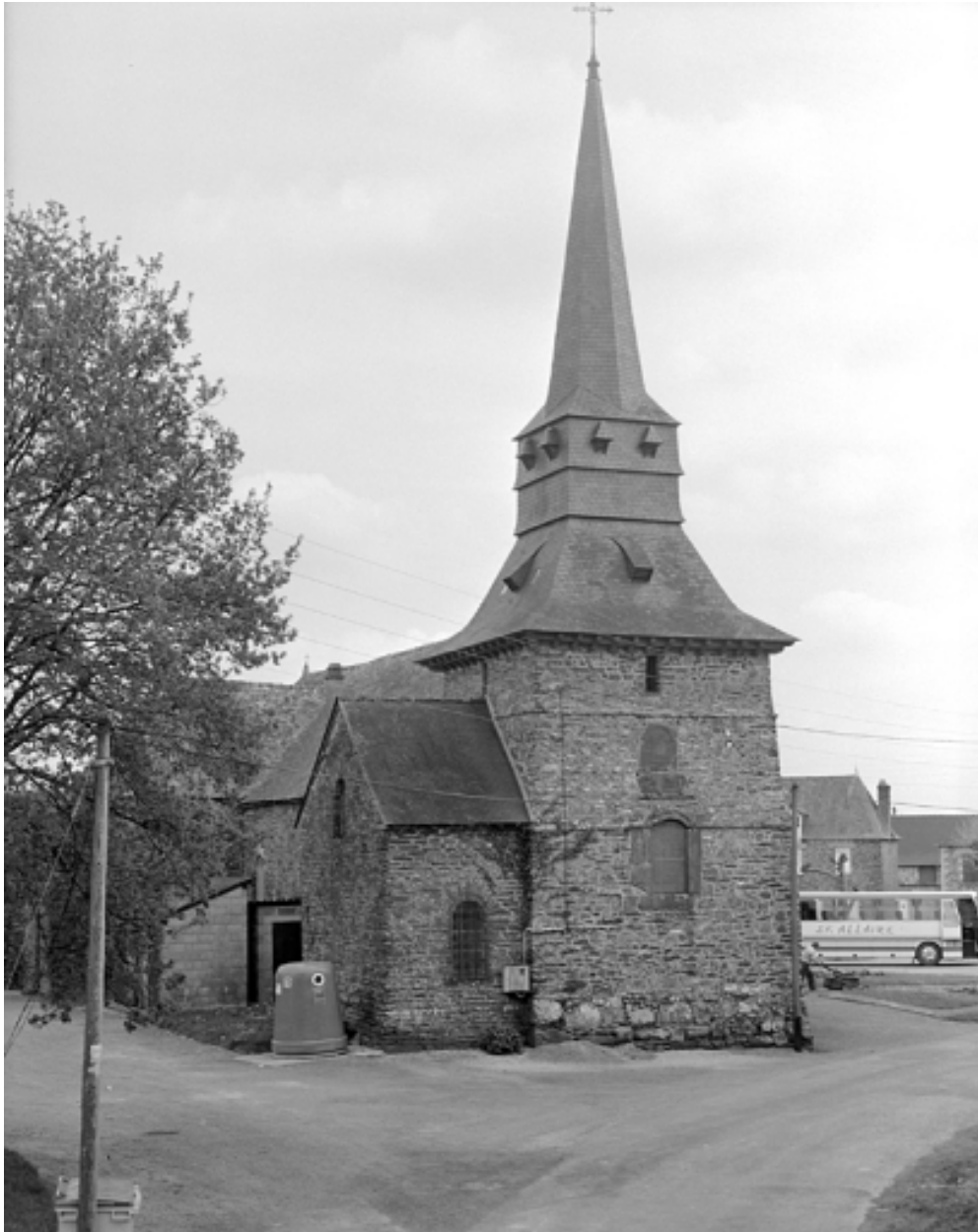
Détail : face ouest, la tour