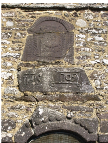
Détail : face ouest, les décors de la tour