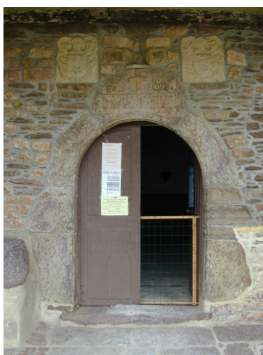
Détail : face sud, la porte datée 1592, remploi de l'ancienne église