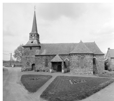
Vue générale sud IVR53_19943500819X