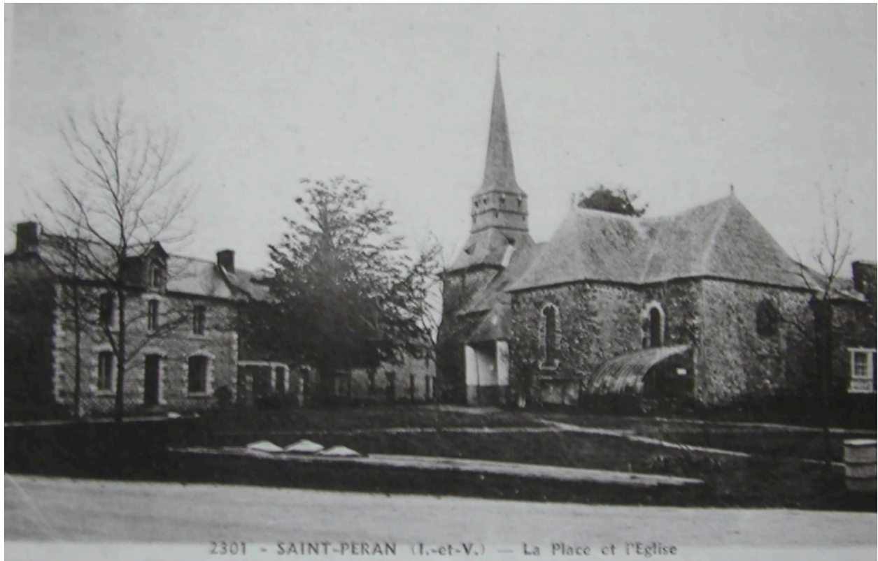
L'église paroissiale au début du 20e siècle