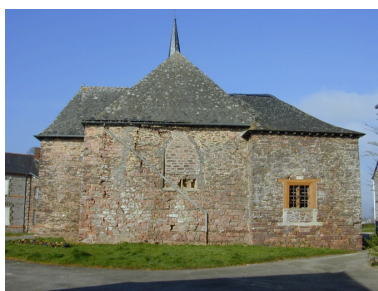
Vue générale est : le chevet et la sacristie édifée en 1832 IVR53_20023509848NUCA