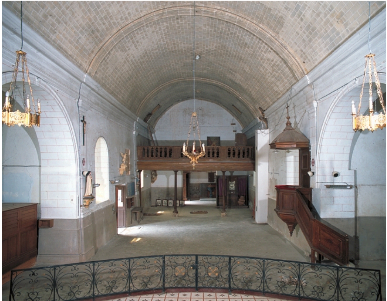
Vue intérieure prise du chœur vers la nef