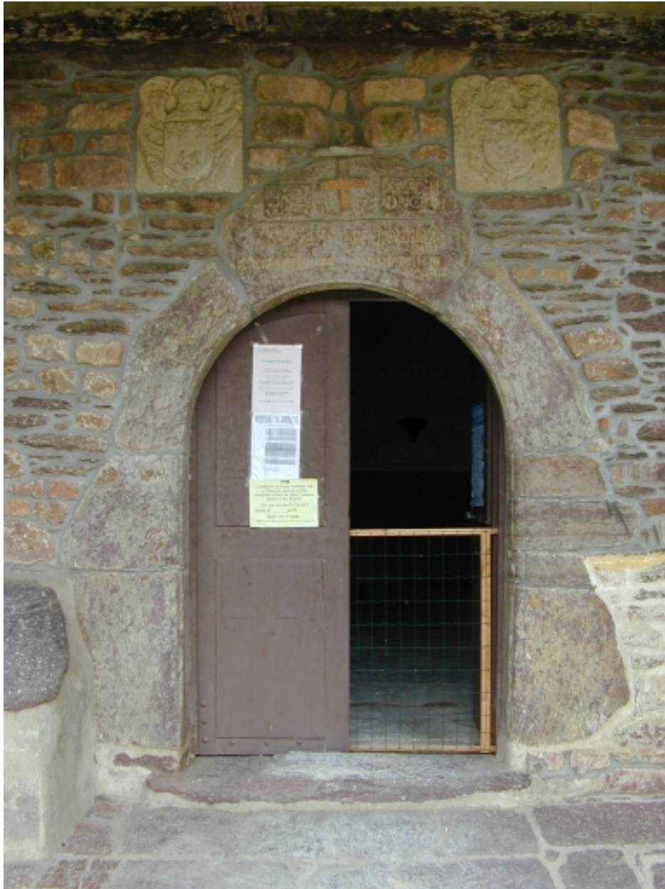
Détail : face sud, la porte datée 1592, remploi de l'ancienne église