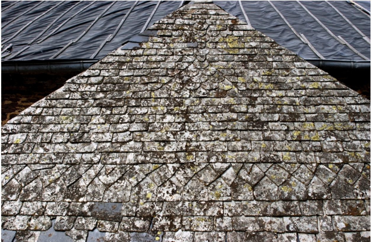
Détail : face sud, couverture du porche