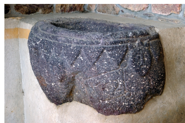
Détail : face sud, bénitier (16e siècle ?) portant une date gravée 1702, vue générale IVR53_20023502835NUCA