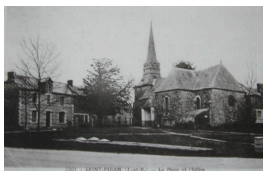
L'église paroissiale au début du 20e siècle