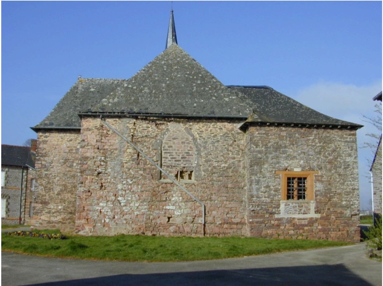
Vue générale est : le chevet et la sacristie édifiée en 1832