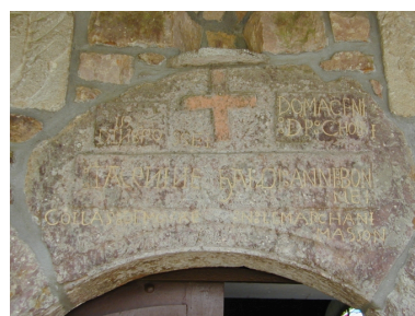
Détail : face sud, inscriptions de la porte datée 1592 IVR53_20023509902NUCA