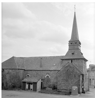
Vue générale nord IVR53_19943500821X