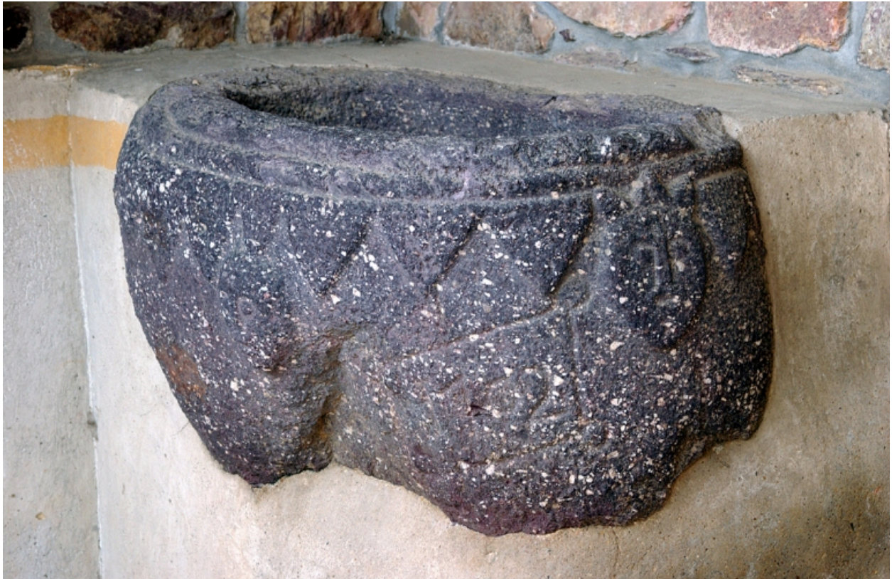
Détail : face sud, bénitier (16e siècle ?) portant une date gravée 1702, vue générale