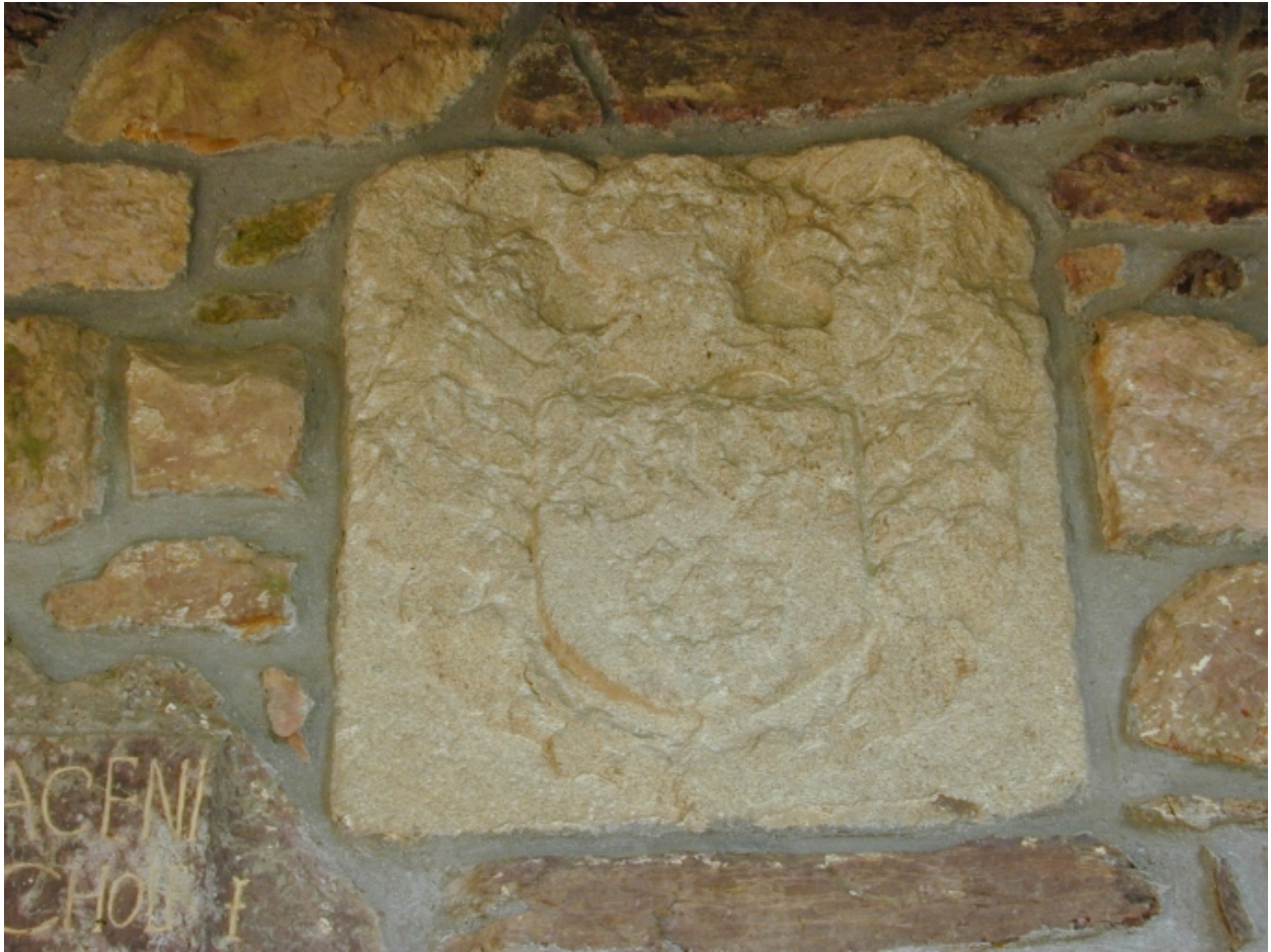
Détail : face sud, blason est sous le porche