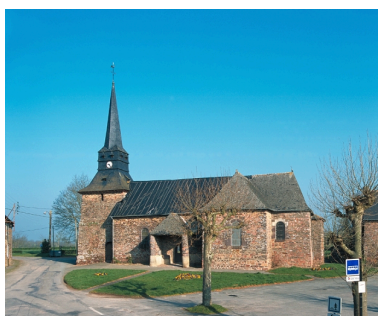
Vue générale sud IVR53_20023500884XA