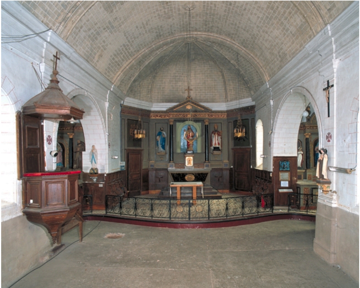
Vue intérieure prise de la nef vers le chœur