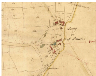
L'église et son enclos sur le cadastre de 1823 IVR53_20023509793NUC