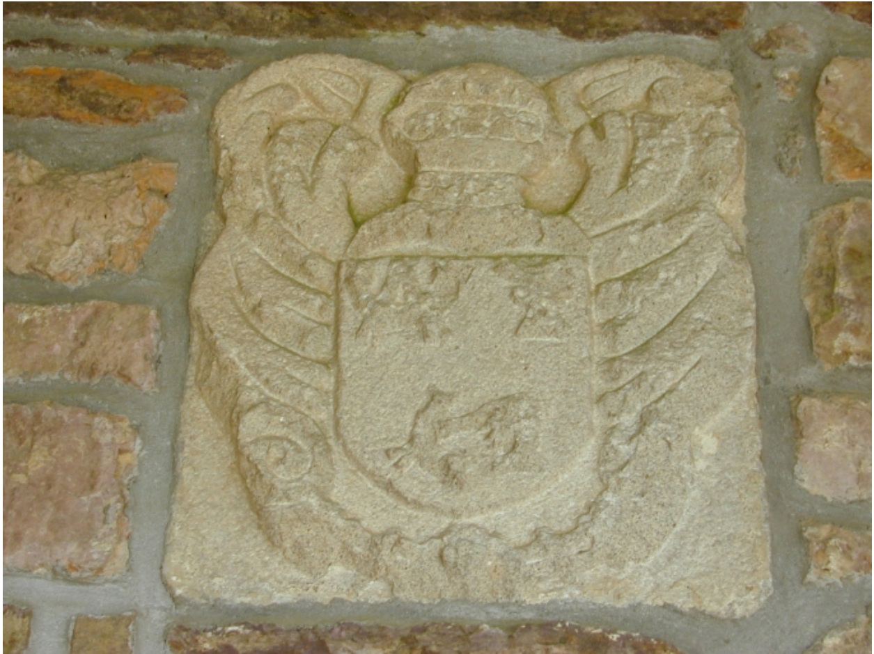
Détail : face sud, blason ouest sous le porche