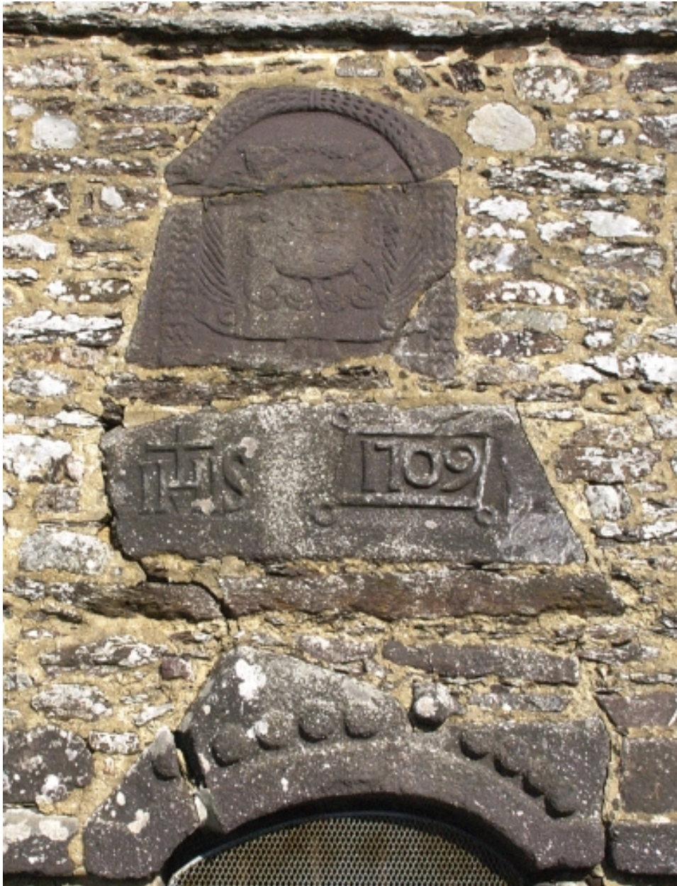
Détail : face ouest, les décors de la tour