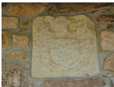
Détail : face sud, blason est sous le porche IVR53_20023509904NUCA