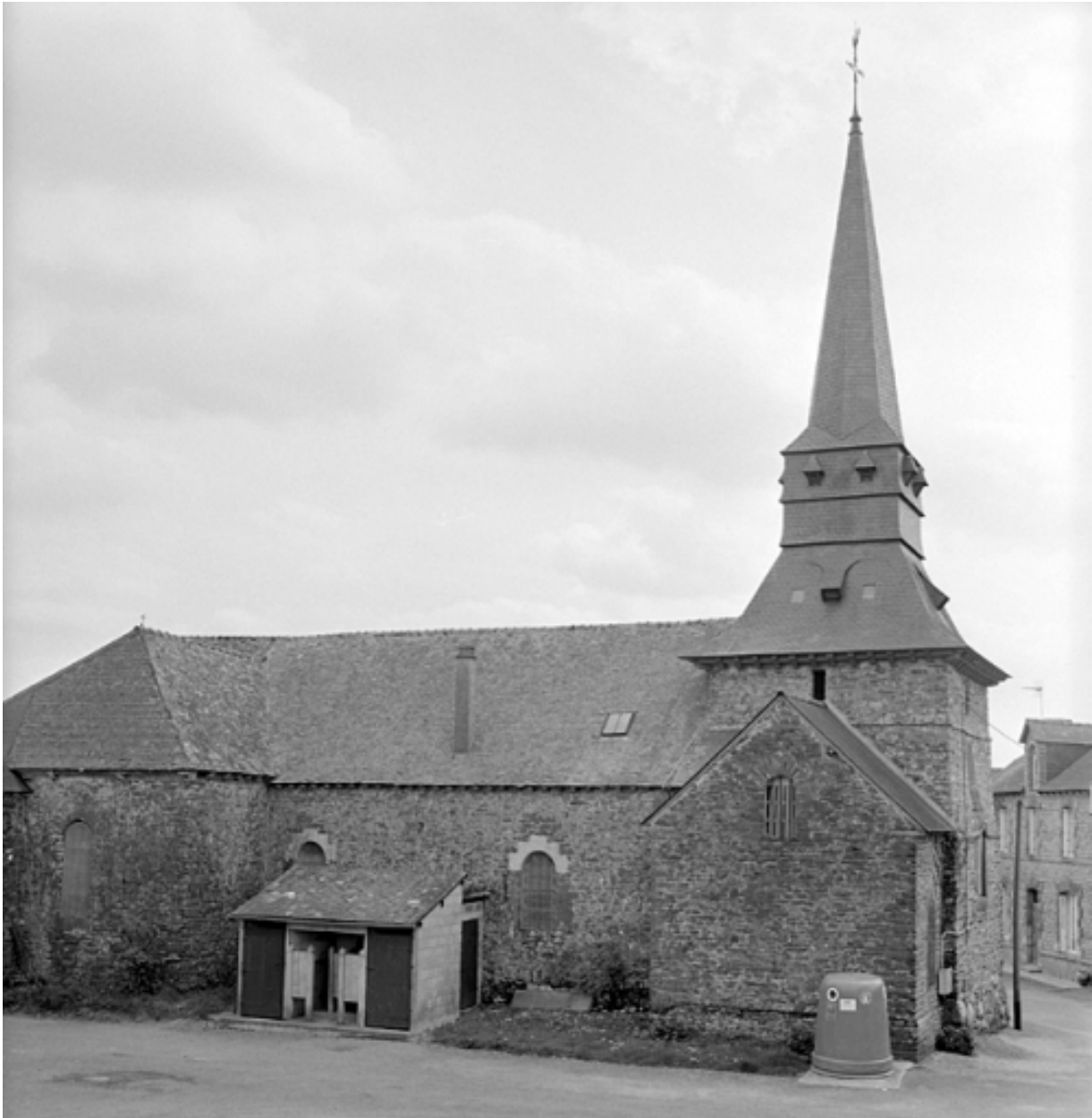
Vue générale nord