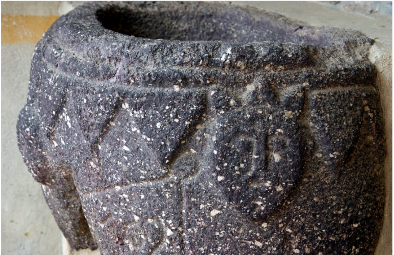
Détail : face sud, bénitier extérieur, détail de la sculpture