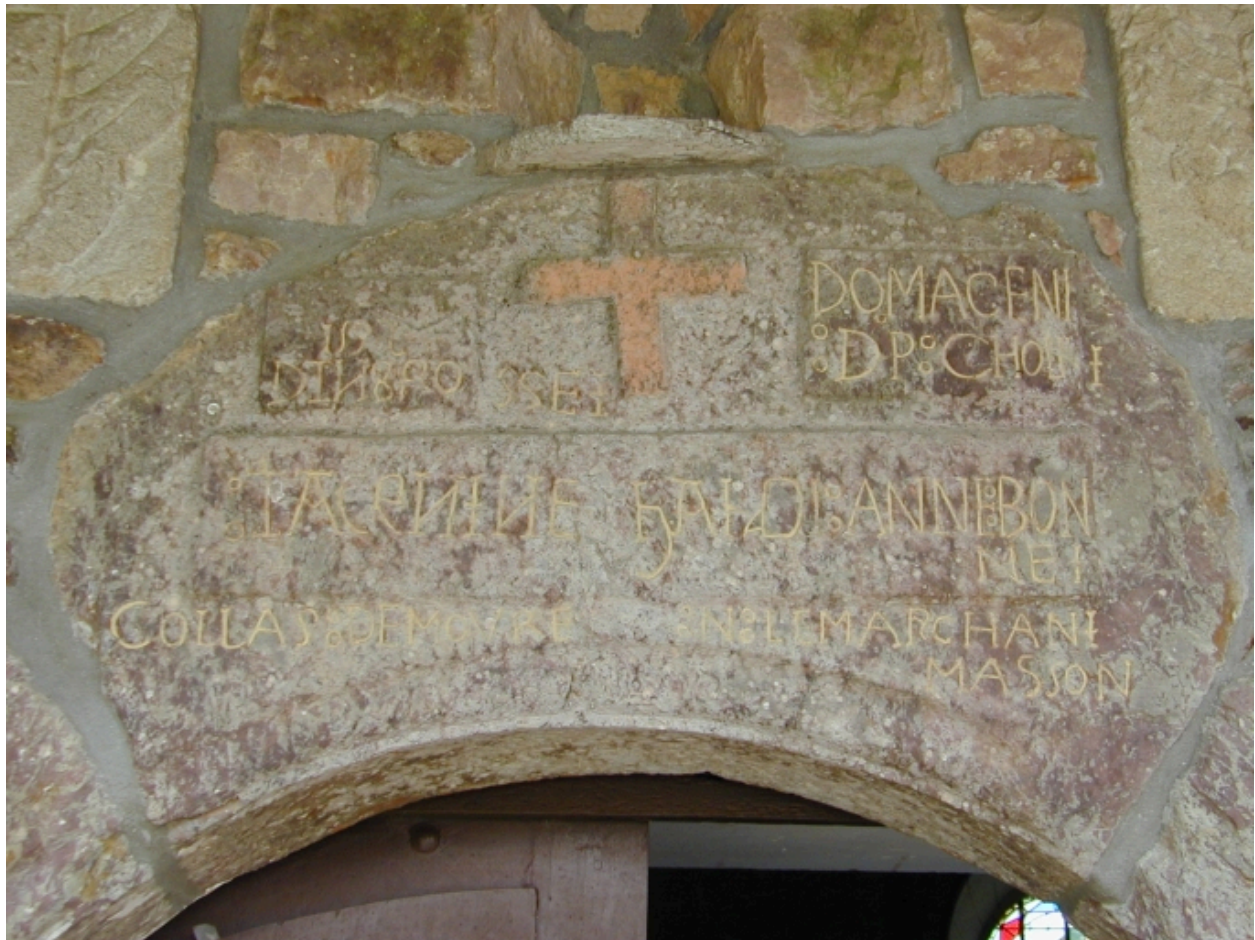
Détail : face sud, inscriptions de la porte datée 1592