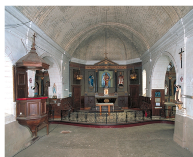
Vue intérieure prise de la nef vers le chœur IVR53_20023501307XA