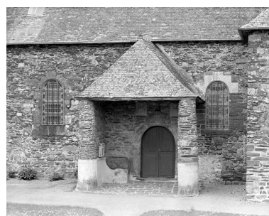
Détail : face sud, le porche IVR53_19943500820X