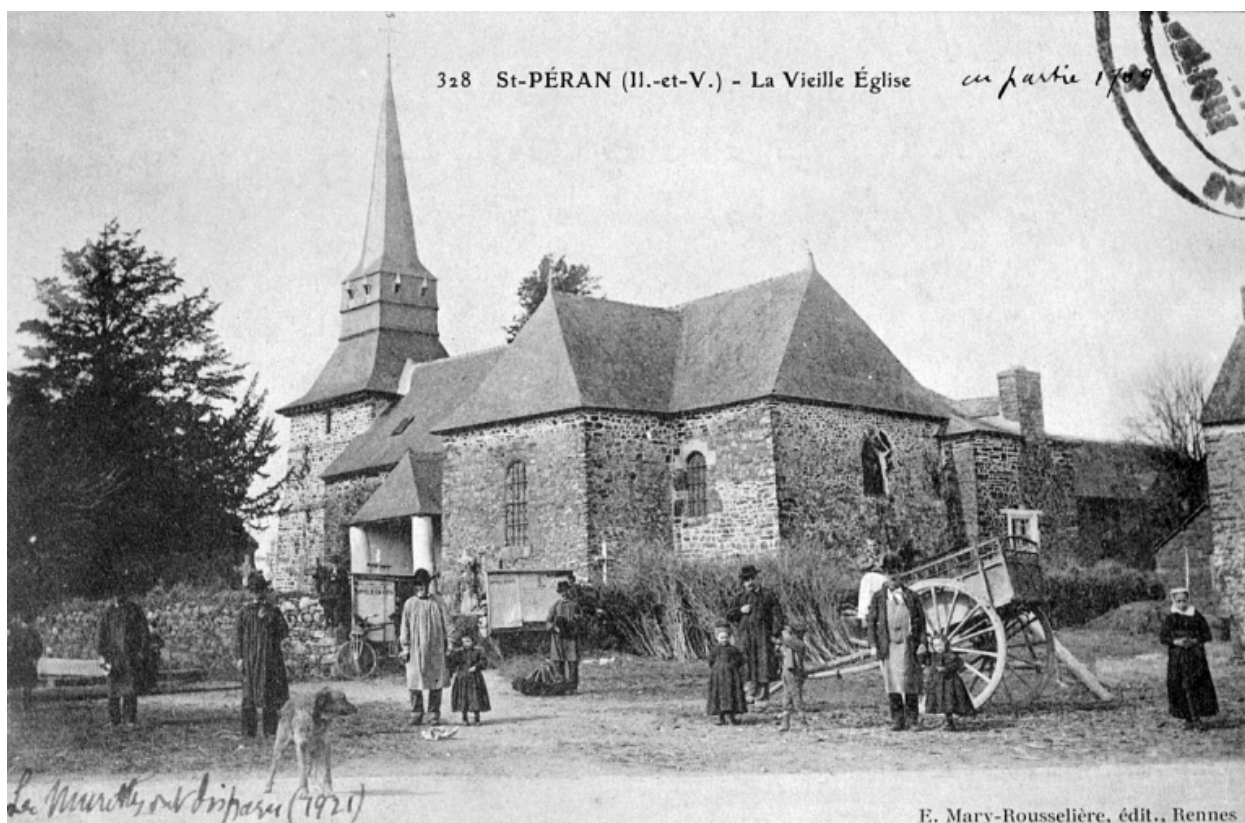
L'église paroissiale et son enclos autour de 1900