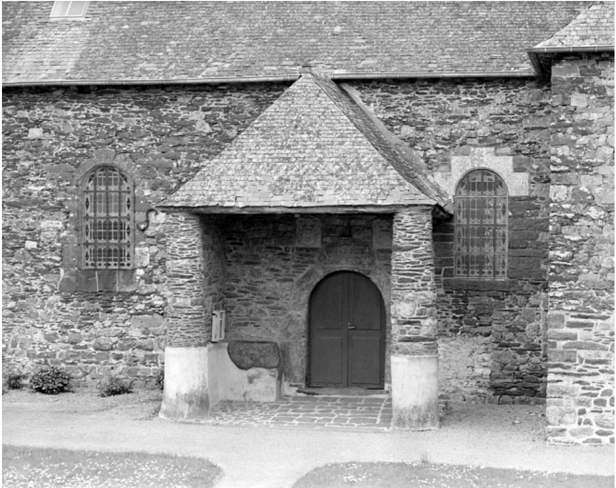
Détail : face sud, le porche