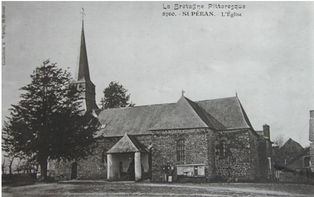
L'église paroissiale vers 1905 (le cimetière a été transféré)