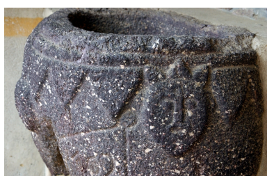
Détail : face sud, bénitier extérieur, détail de la sculpture IVR53_20023502836NUCA