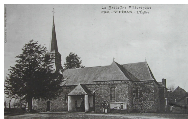
L'église paroissiale vers 1905 (le cimetière a été transféré) IVR53_20023509841NUC