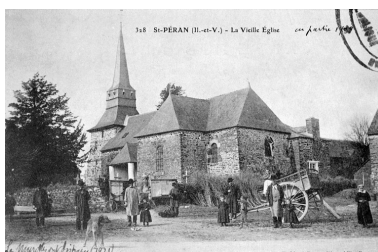
L'église paroissiale et son enclos autour de 1900