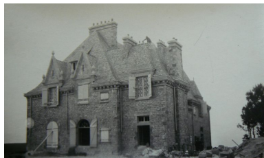
Vue générale ancienne du château de Rulianec

Phot. Archives municipales de Brest IVR53_20072908784NUC