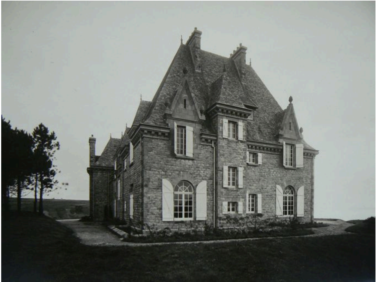
Vue générale ancienne du château de Rulianec