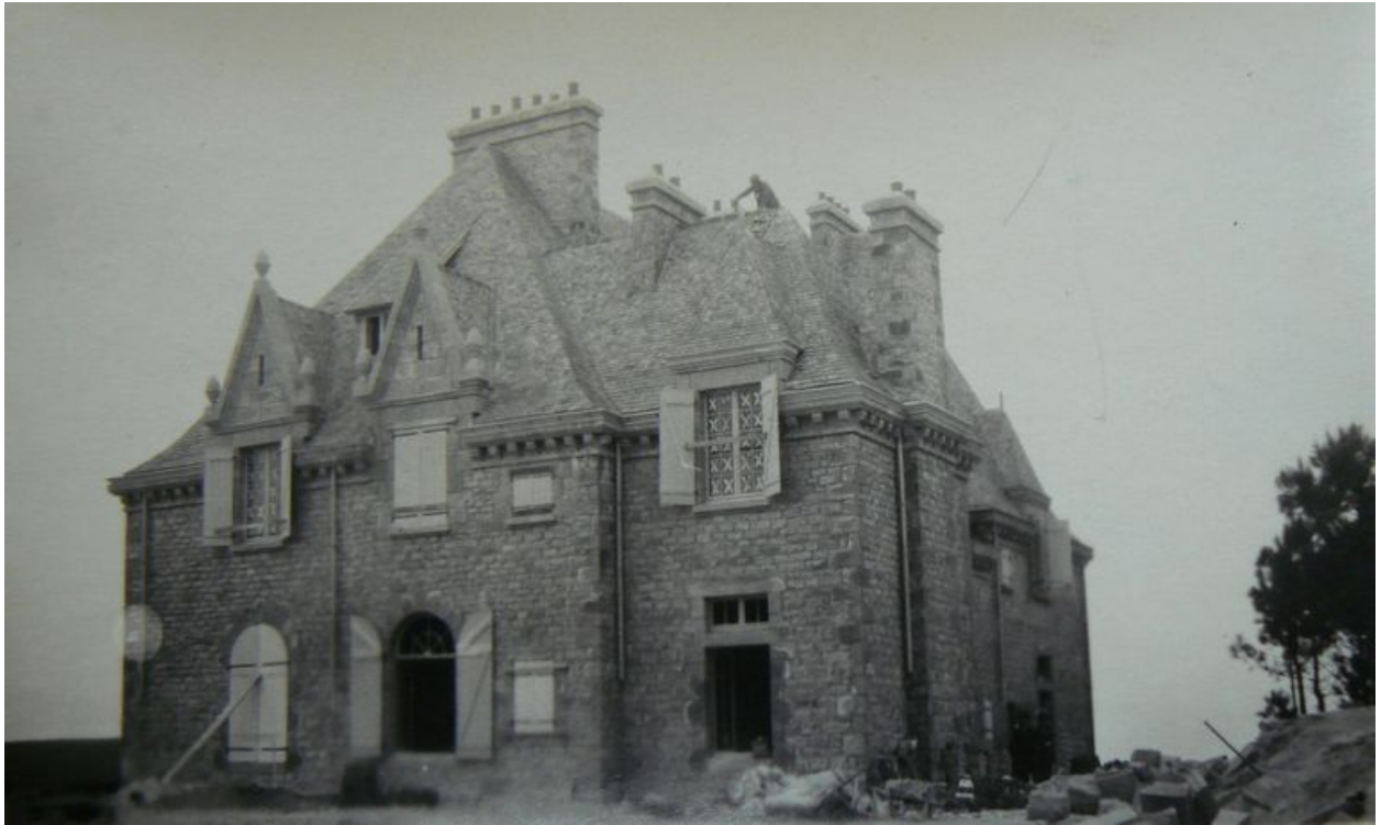
Vue générale ancienne du château de Rulianec