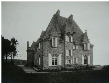
Vue générale ancienne du château de Rulianec

Phot. Archives municipales de Brest IVR53_20072908784NUC