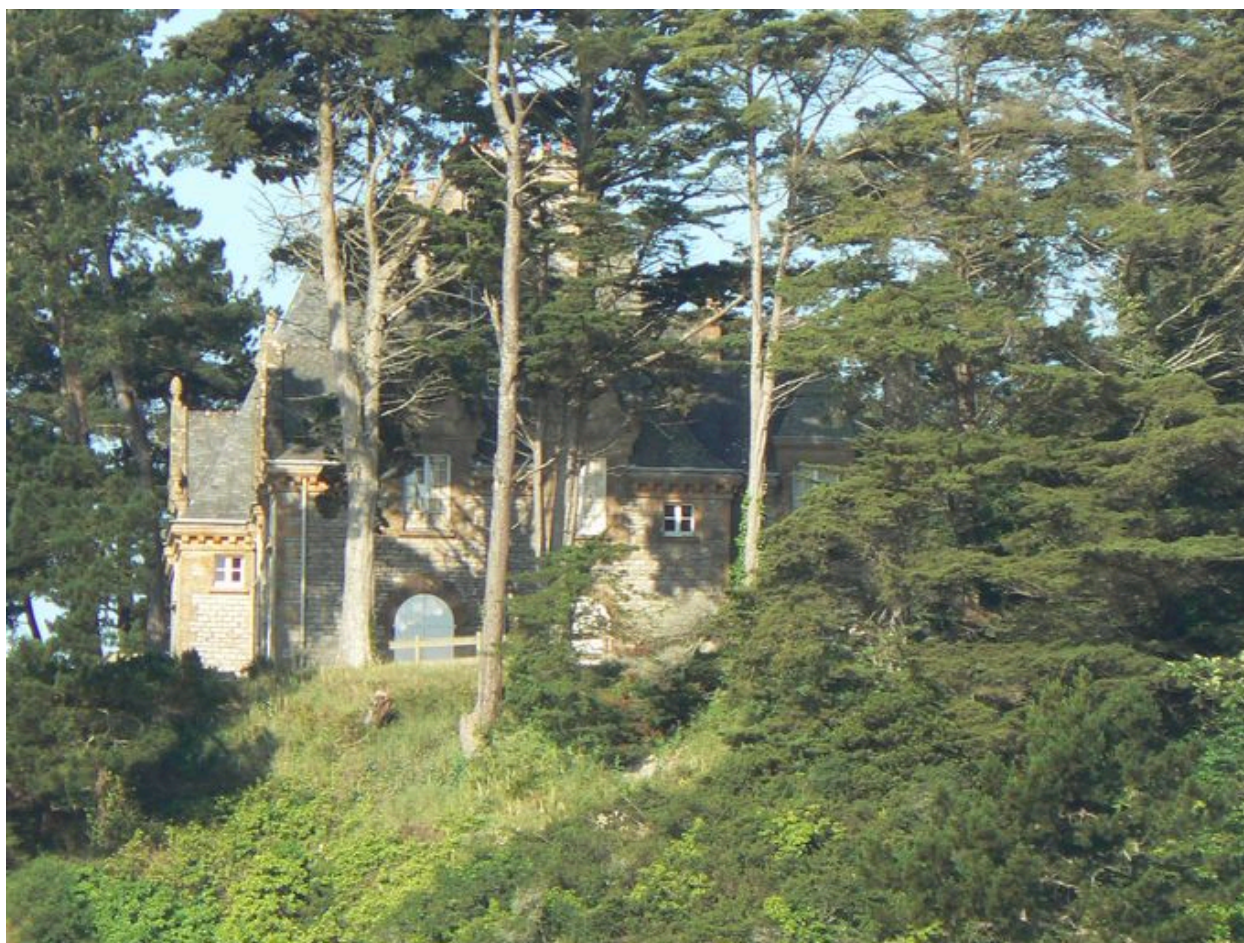
Vue générale du château de Rulianec