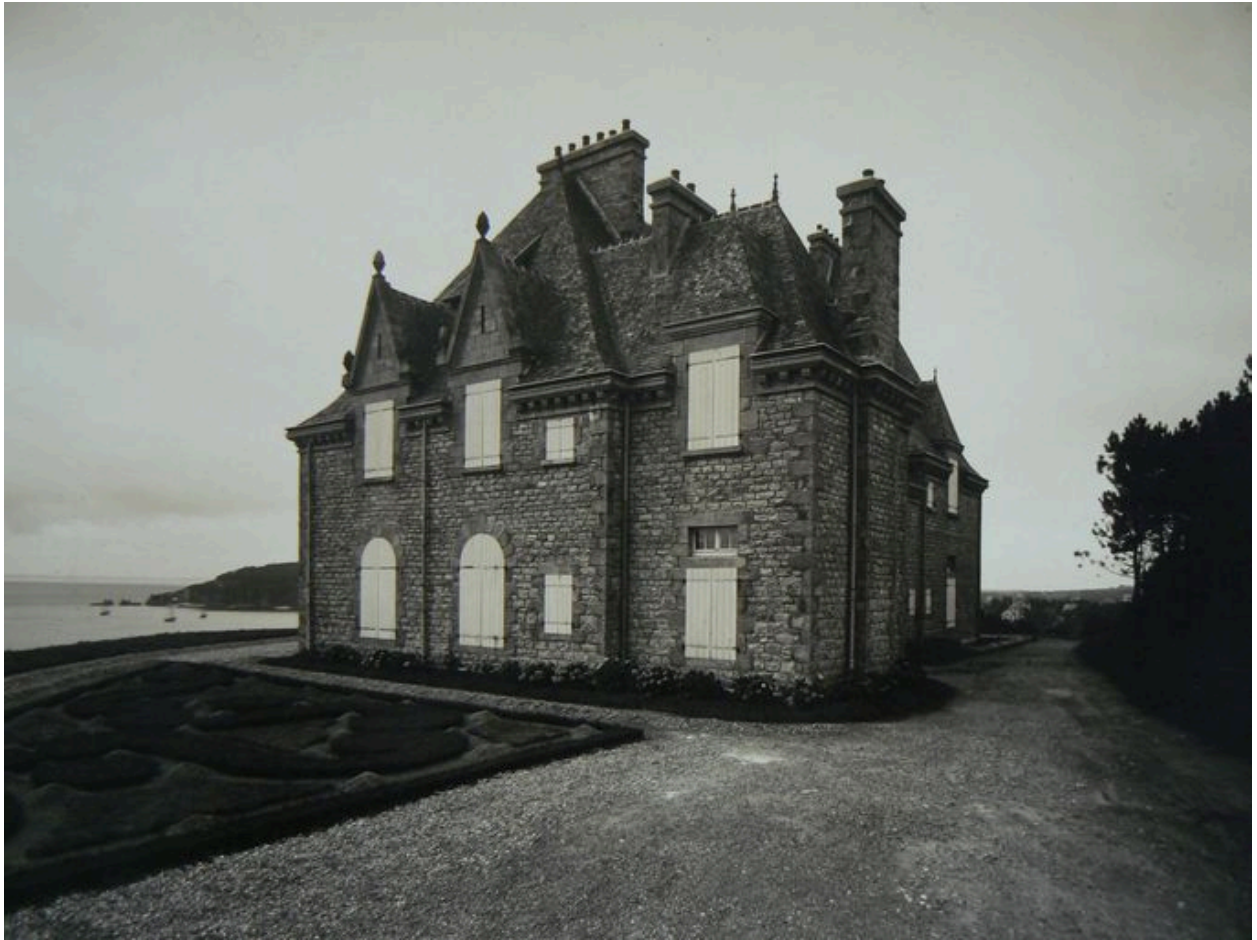
Vue générale ancienne du château de Rulianec