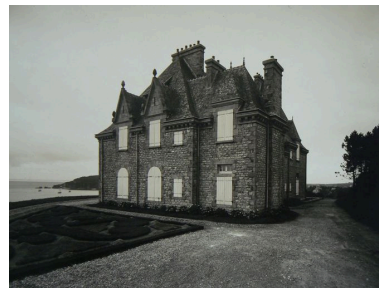
Vue générale ancienne du château de Rulianec

Phot. Archives municipales de Brest IVR53_20072908783NUC