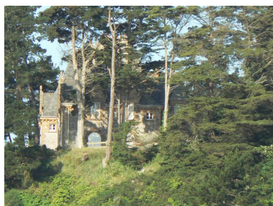
Vue générale du château de Rulianec

IVR53_20072908810NUC