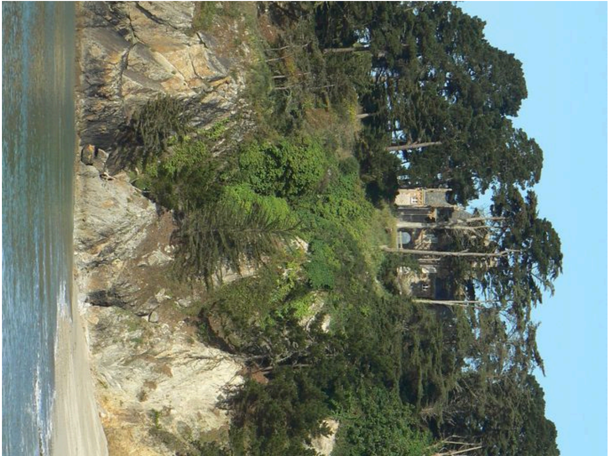
Vue de la plage du château de Rulianec