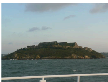
Vue générale des trois poudrières de l'île des Morts IVR53_20072908861NUCA