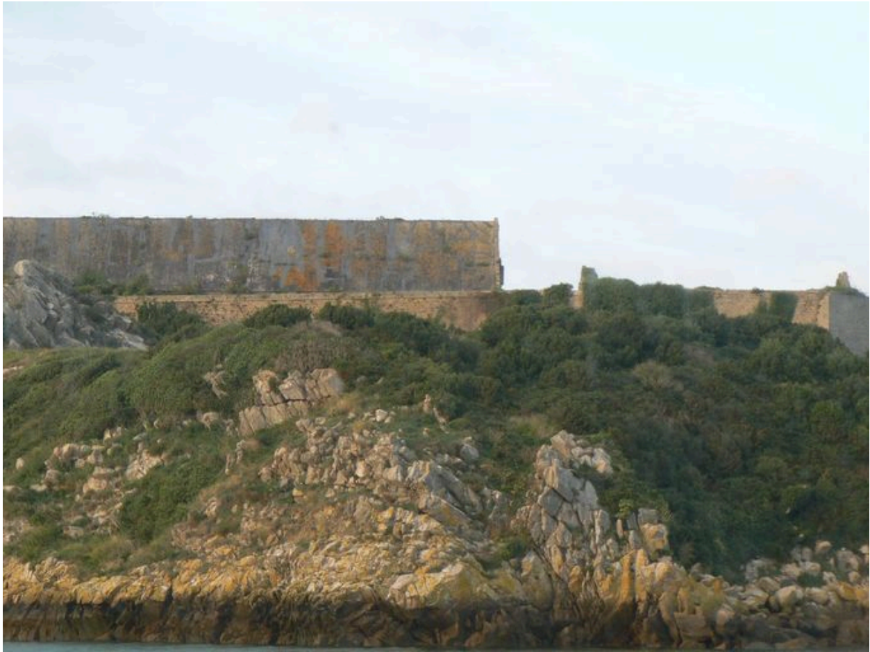
Vue latérale d'une poudrière