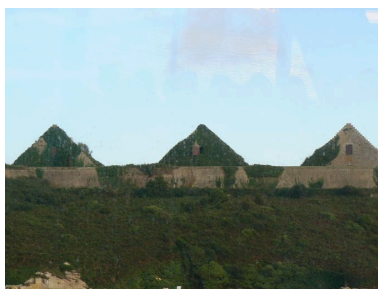
Vue des trois poudrières de l'île des Morts