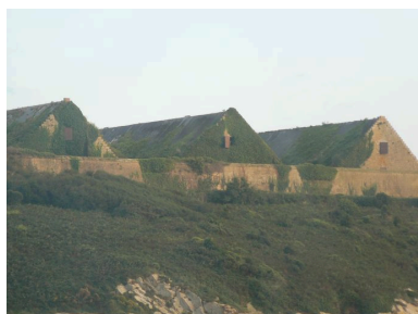
Vue générale des trois poudrières de l'île des Morts