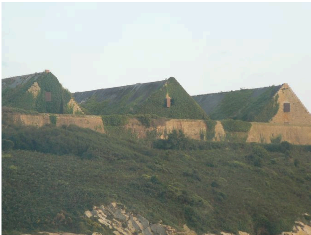
Vue générale des trois poudrières de l'île des Morts