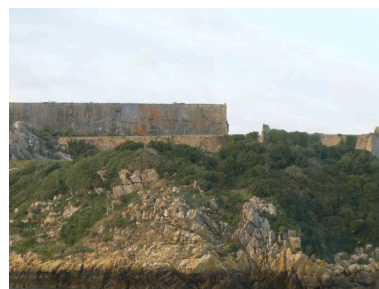
Vue latérale d'une poudrière IVR53_20072908863NUCA