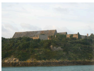
Vue des trois poudrières de l'île des Morts