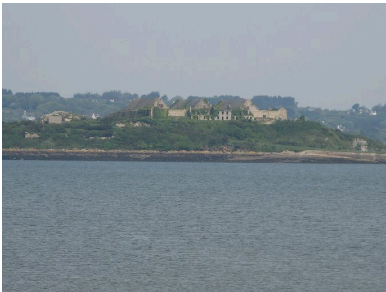
Vue de la partie méridionale de l'île des Morts