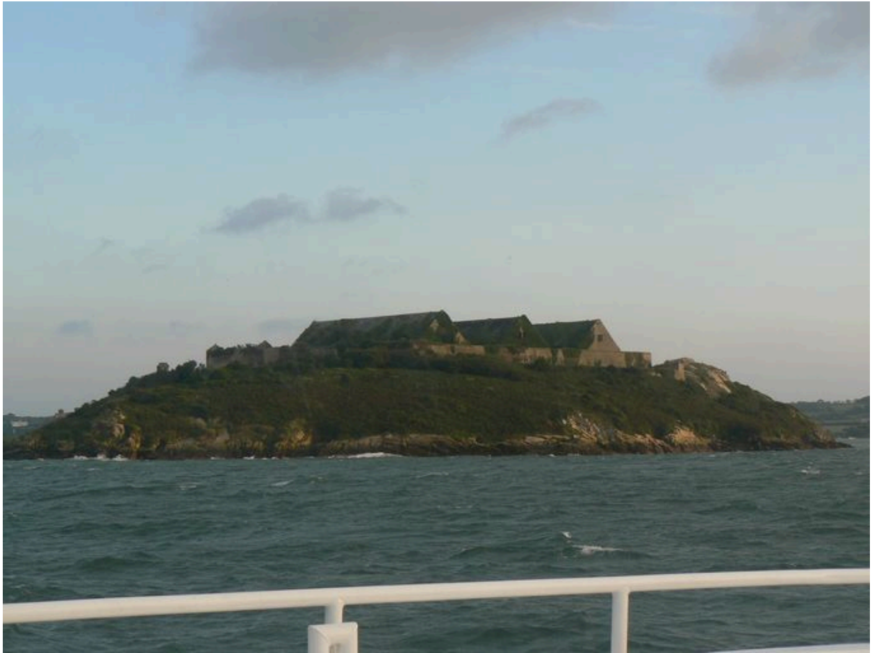
Vue générale des trois poudrières de l'île des Morts