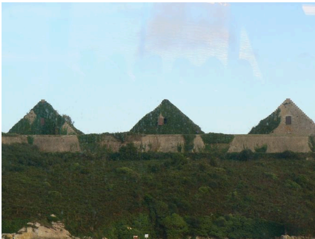
Vue des trois poudrières de l'île des Morts