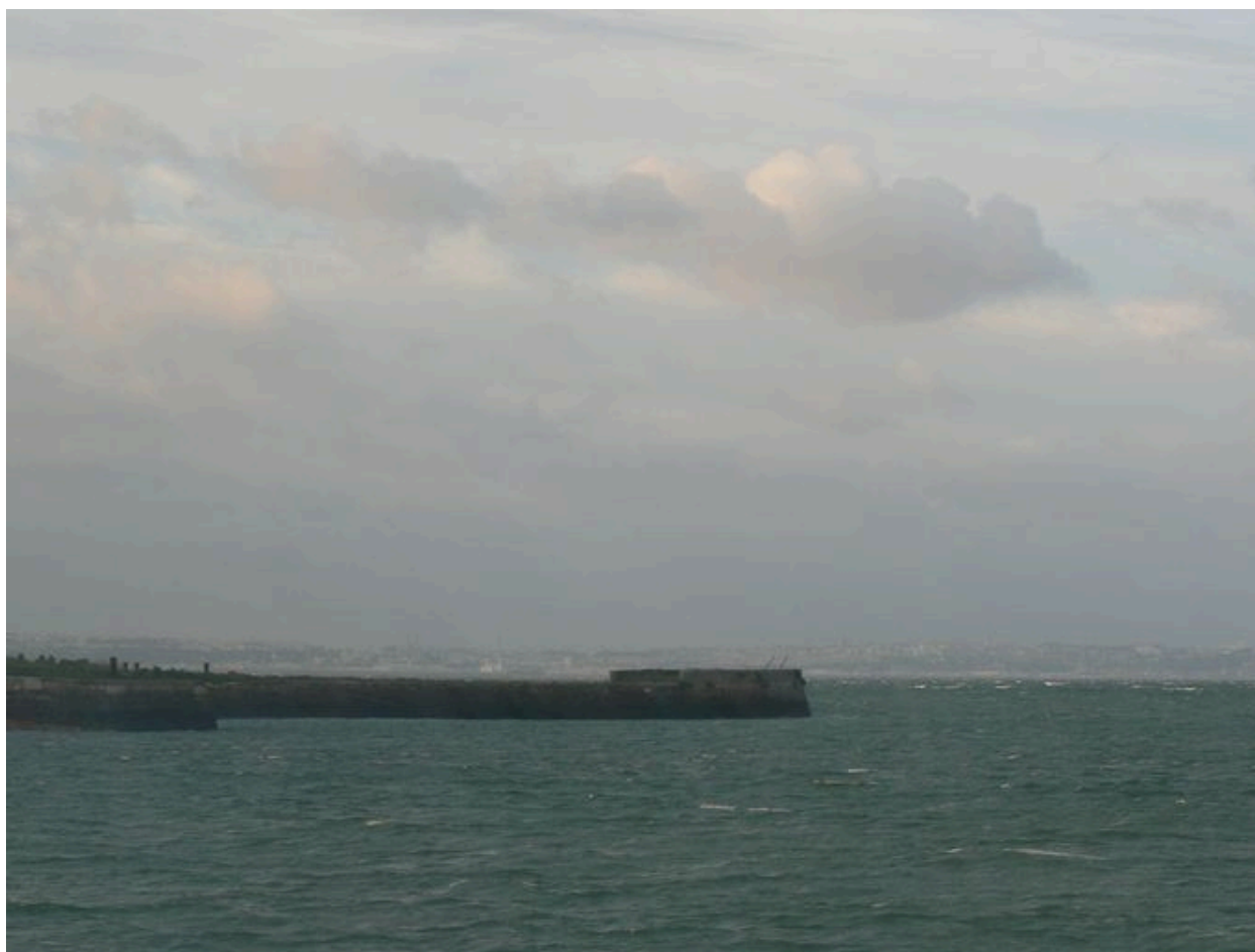
Vue de la cale de l'île des Morts