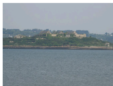
Vue de la partie méridionale de l'île des Morts