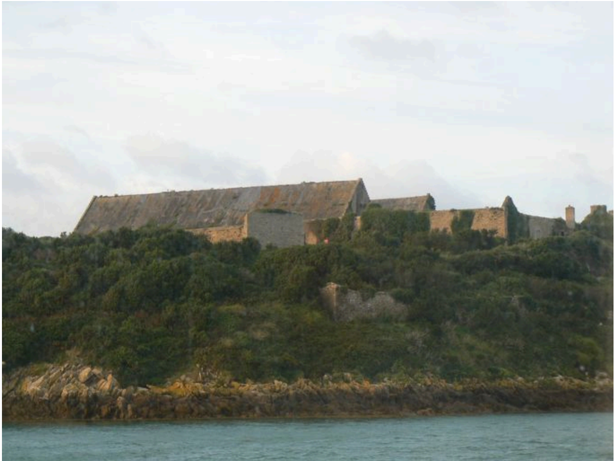
Vue des trois poudrières de l'île des Morts