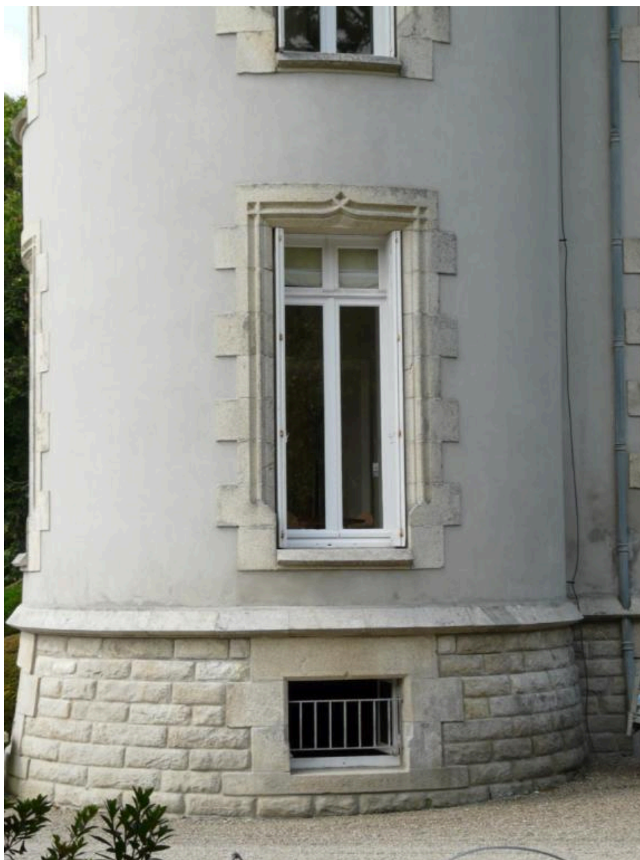
Ouverture, linteau à double accolade