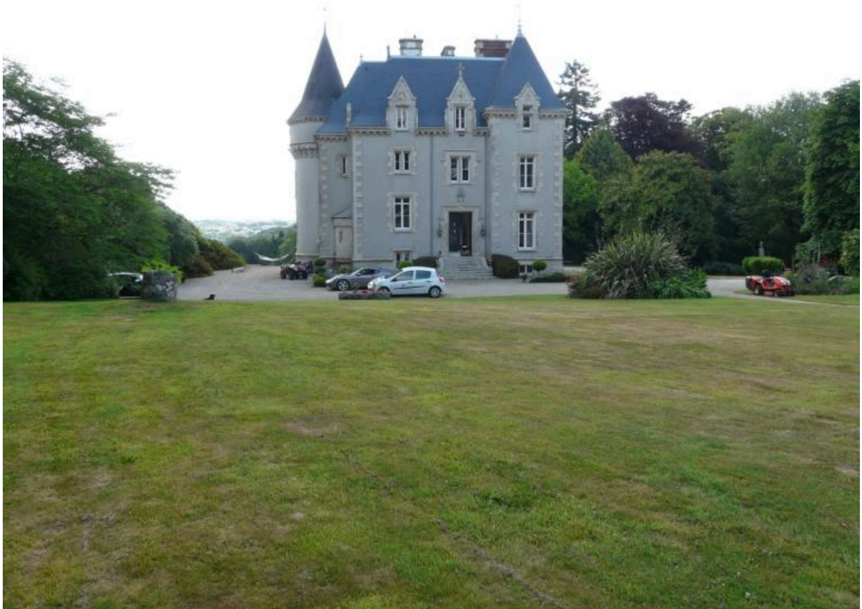
Vue générale du château de Kistinic, façade nord