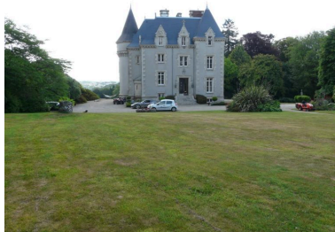
Vue générale du château de Kistinic, façade nord IVR53_20152911176NUCA

IVR53_20032902773NUCB