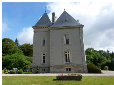
Façade ouest IVR53_20152911178NUCA