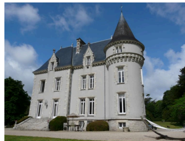
Façade sud IVR53_20152911177NUCA