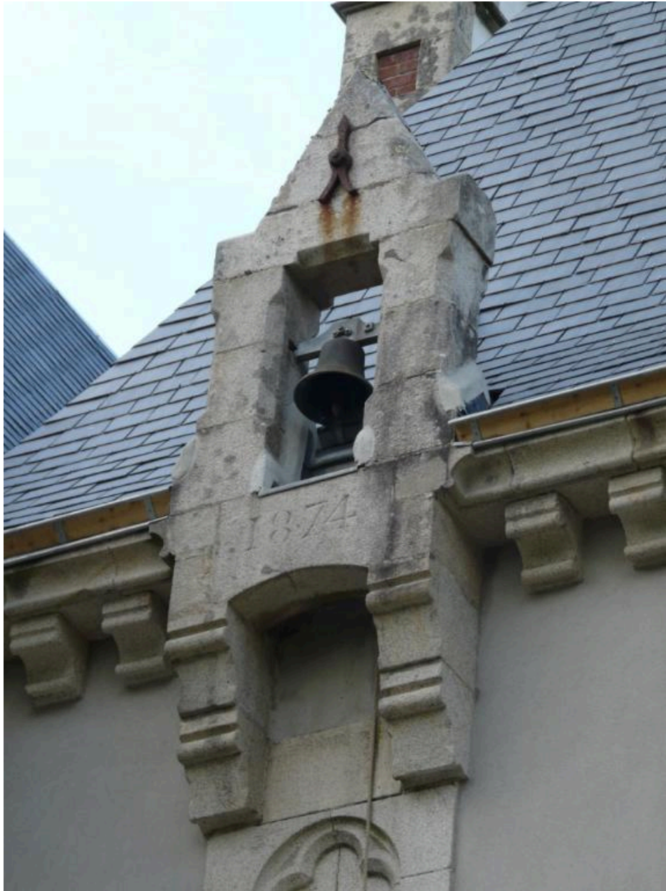
Clocheton sur bretèche, date de construction