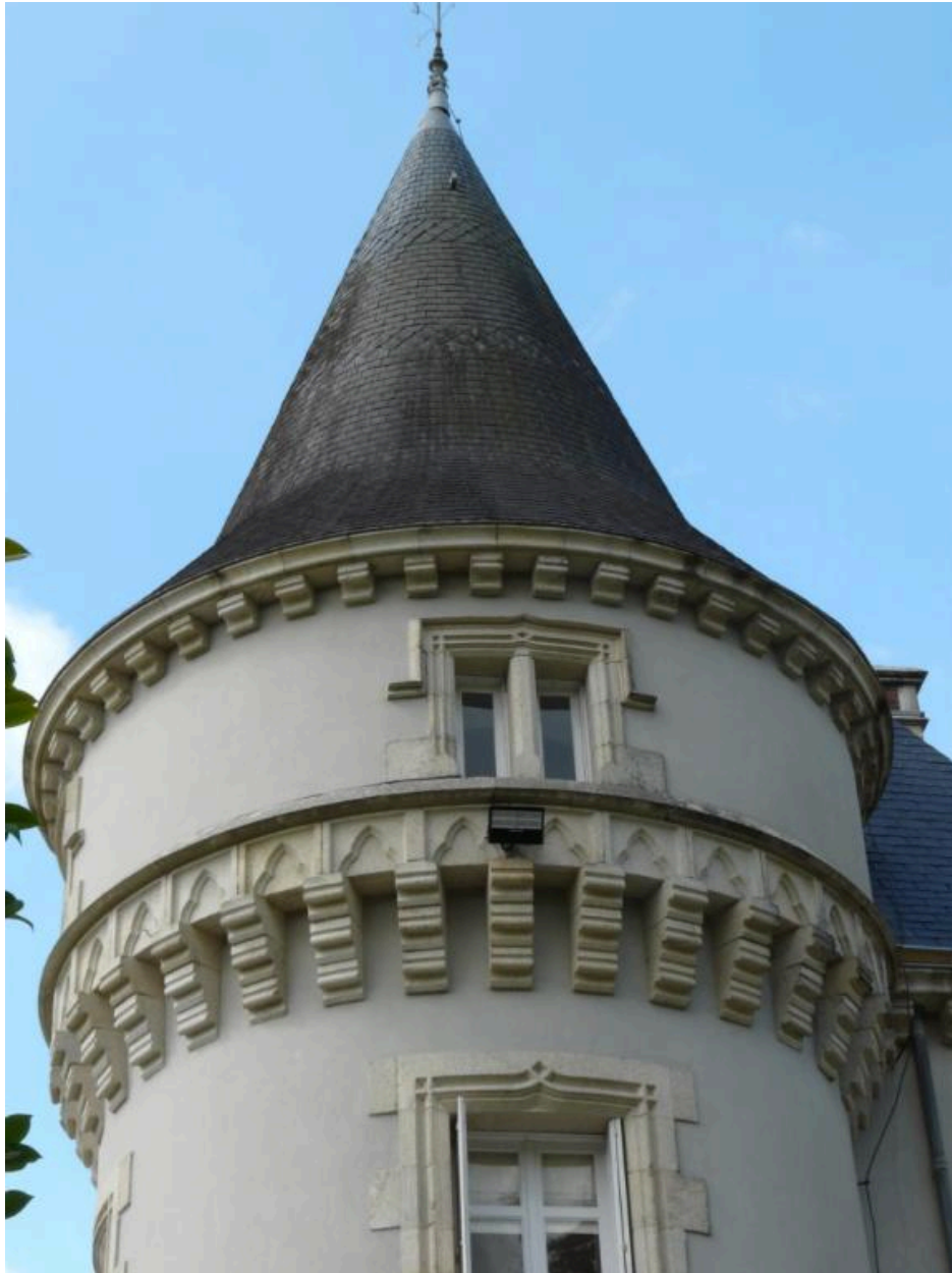
Tour d'angle, machicoulis et toiture en poivrière