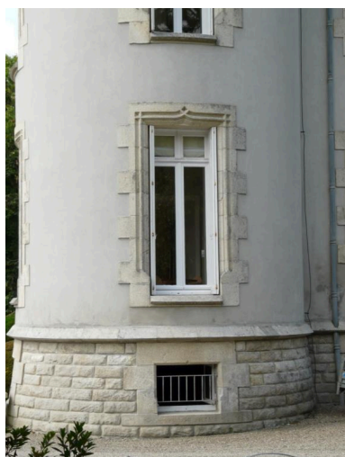
Ouverture, linteau à double accolade