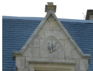
Lucarne, bécasse sculptée IVR53_20152911183NUCA