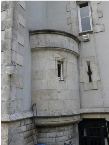
Echauguette IVR53_20152911184NUCA