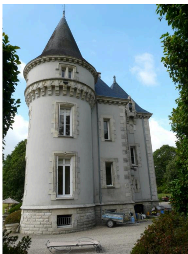
Façade est