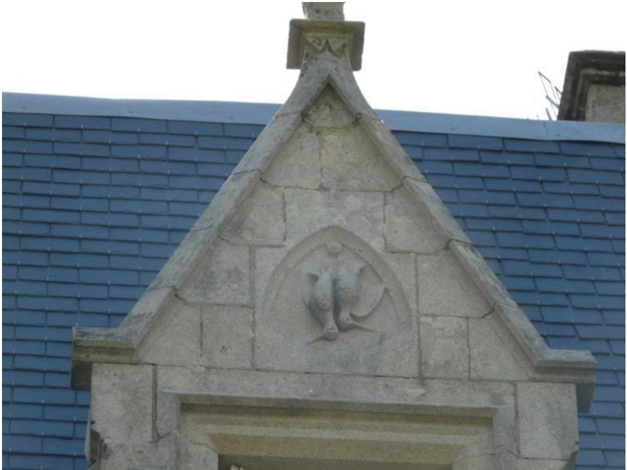
Lucarne, bécasse sculptée