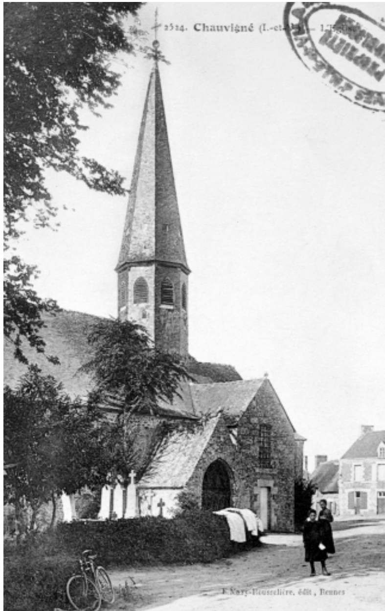
Elévation Sud : vue générale (Carte postale ancienne, AD35 : 6Fi)