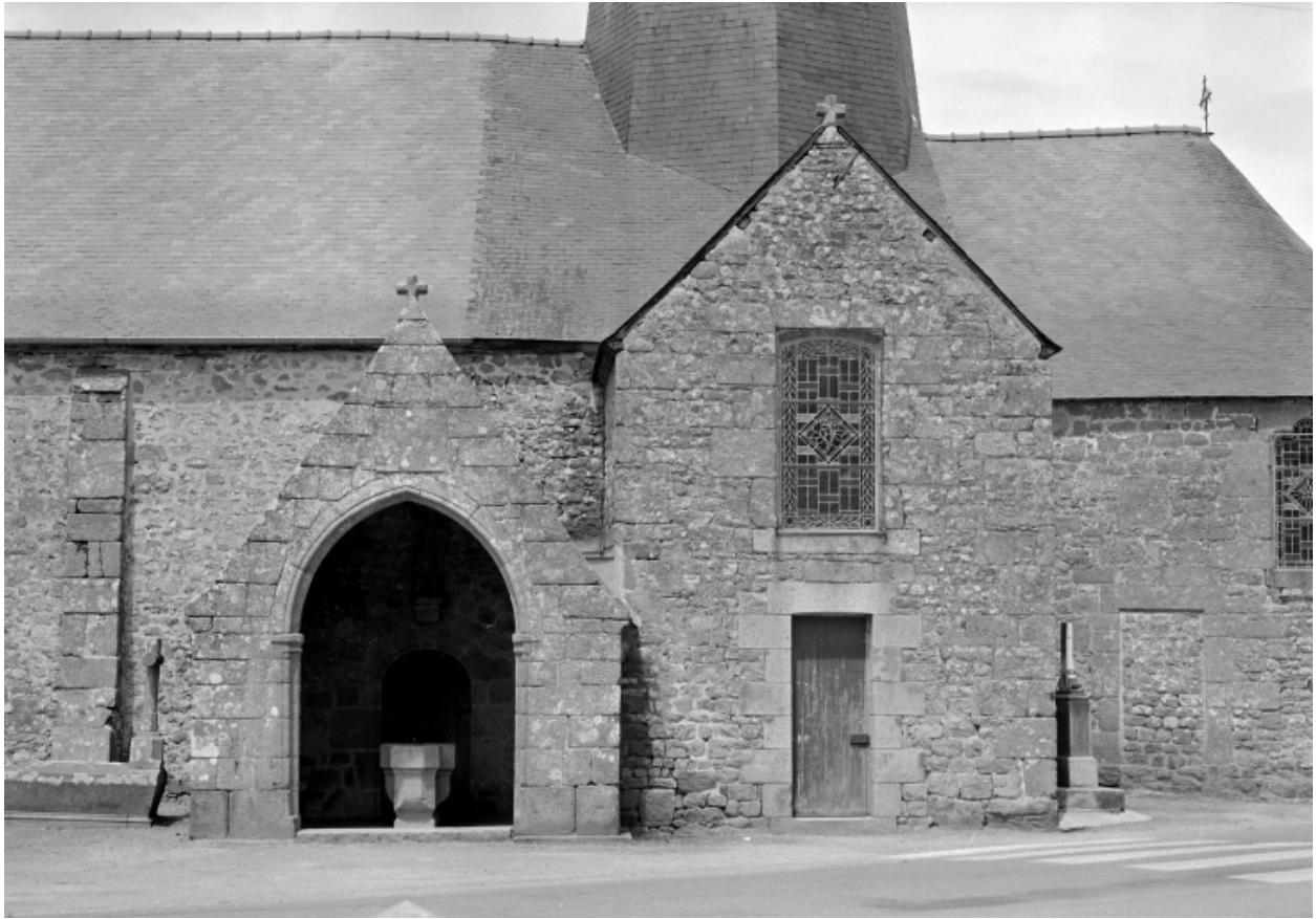
Elévation Sud, partie centrale, porte Sud : vue générale