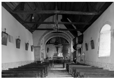
Intérieur : vue générale vers le choeur.