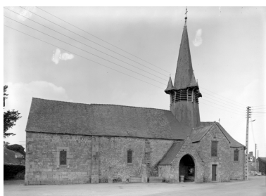
Elévation Sud : vue générale IVR53_19773500416V