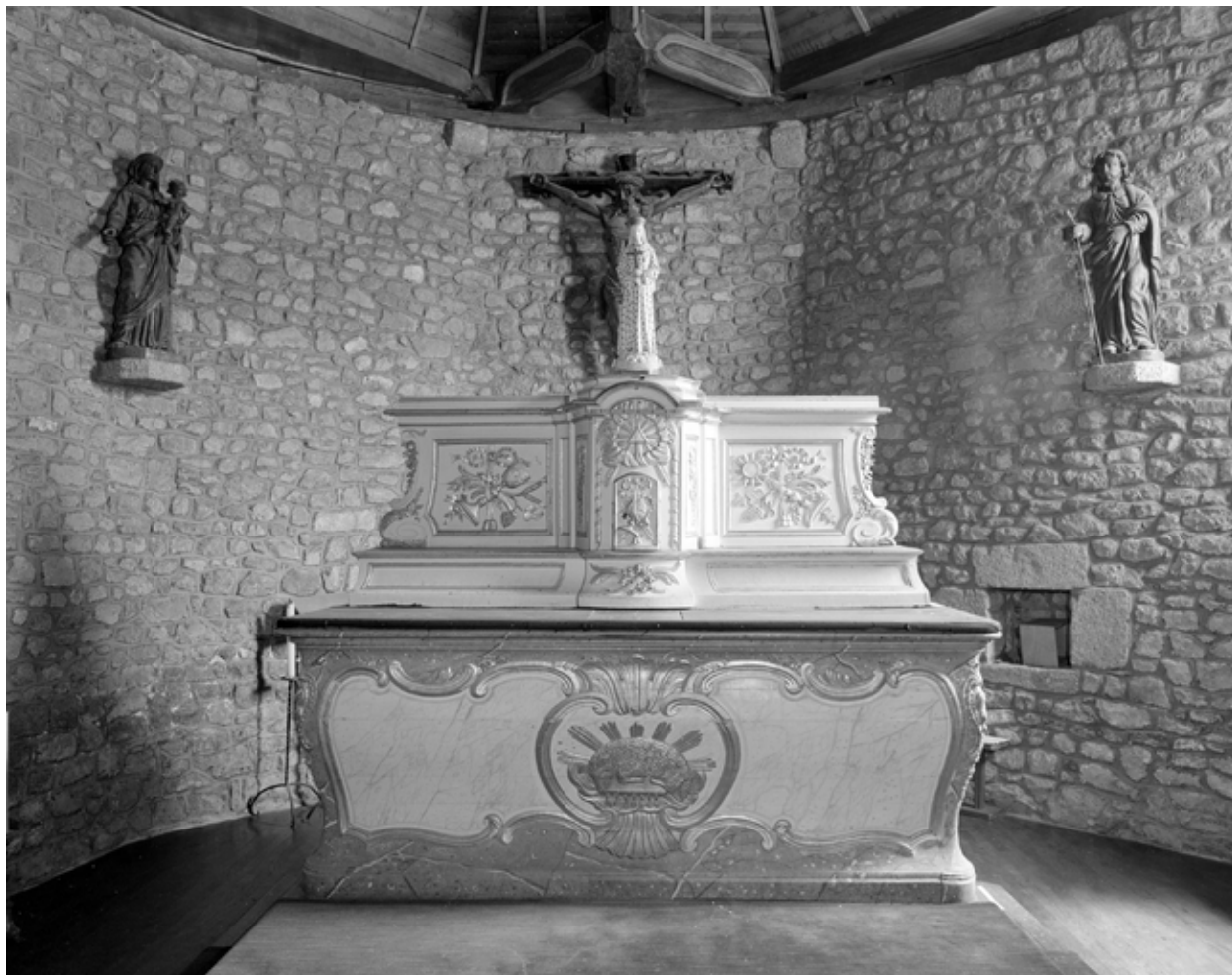
Intérieur, chœur : vue générale