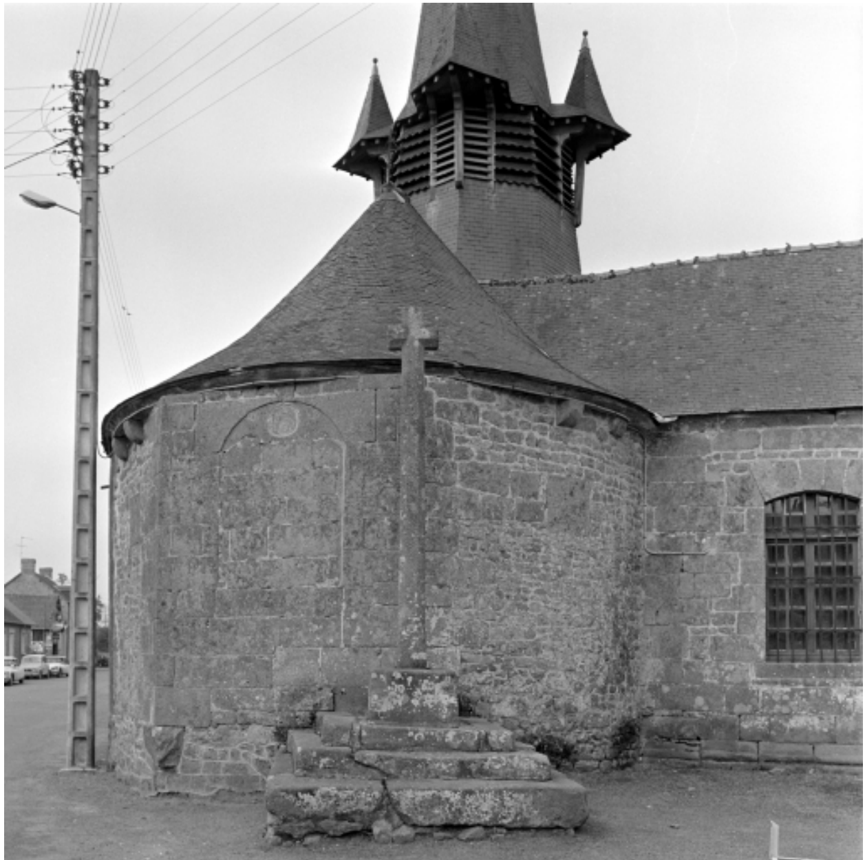
Elévation Est : vue générale