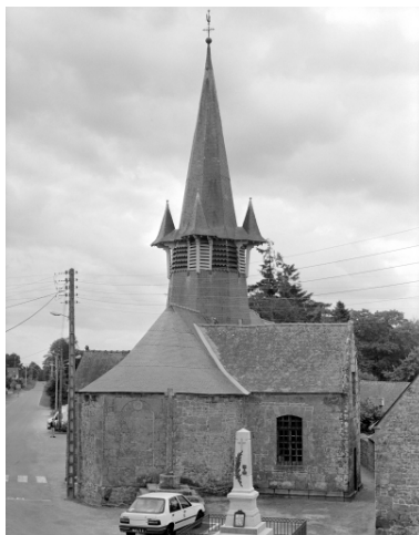
Elévation Est : vue générale IVR53_19943501279X