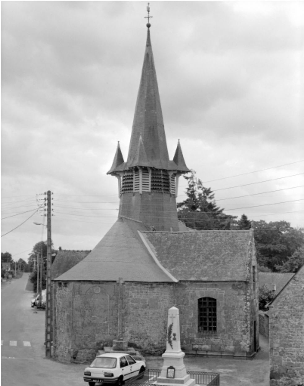
Elévation Est : vue générale