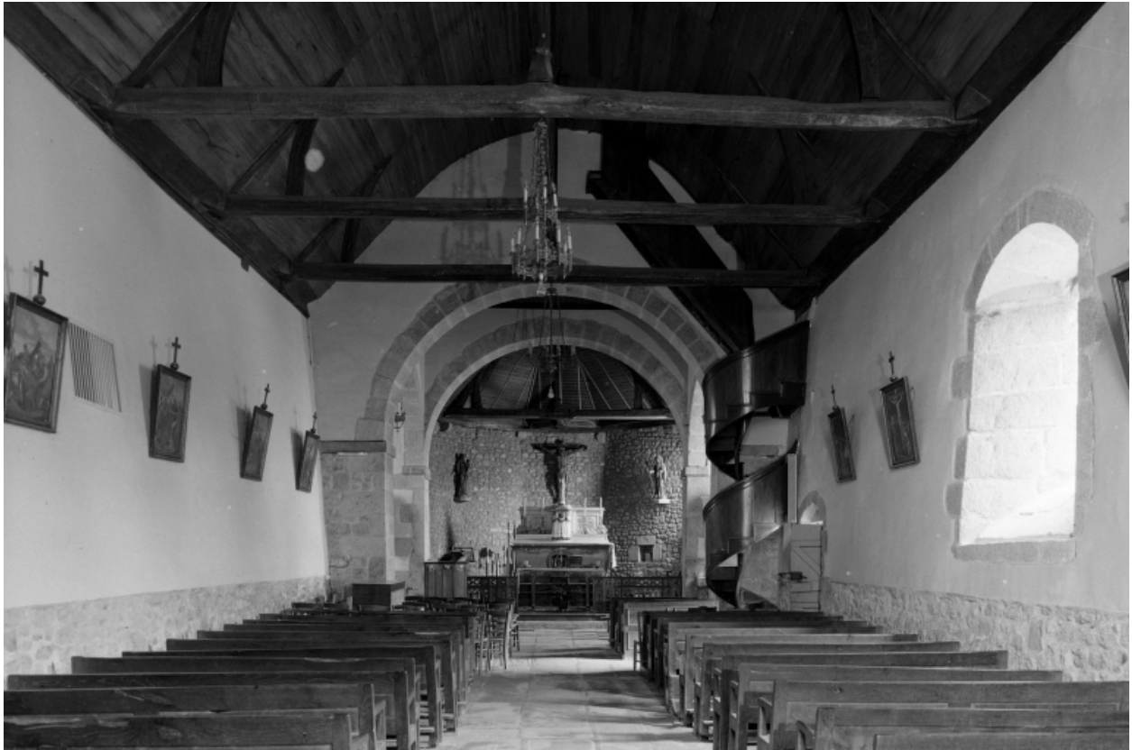
Intérieur : vue générale vers le chœur.