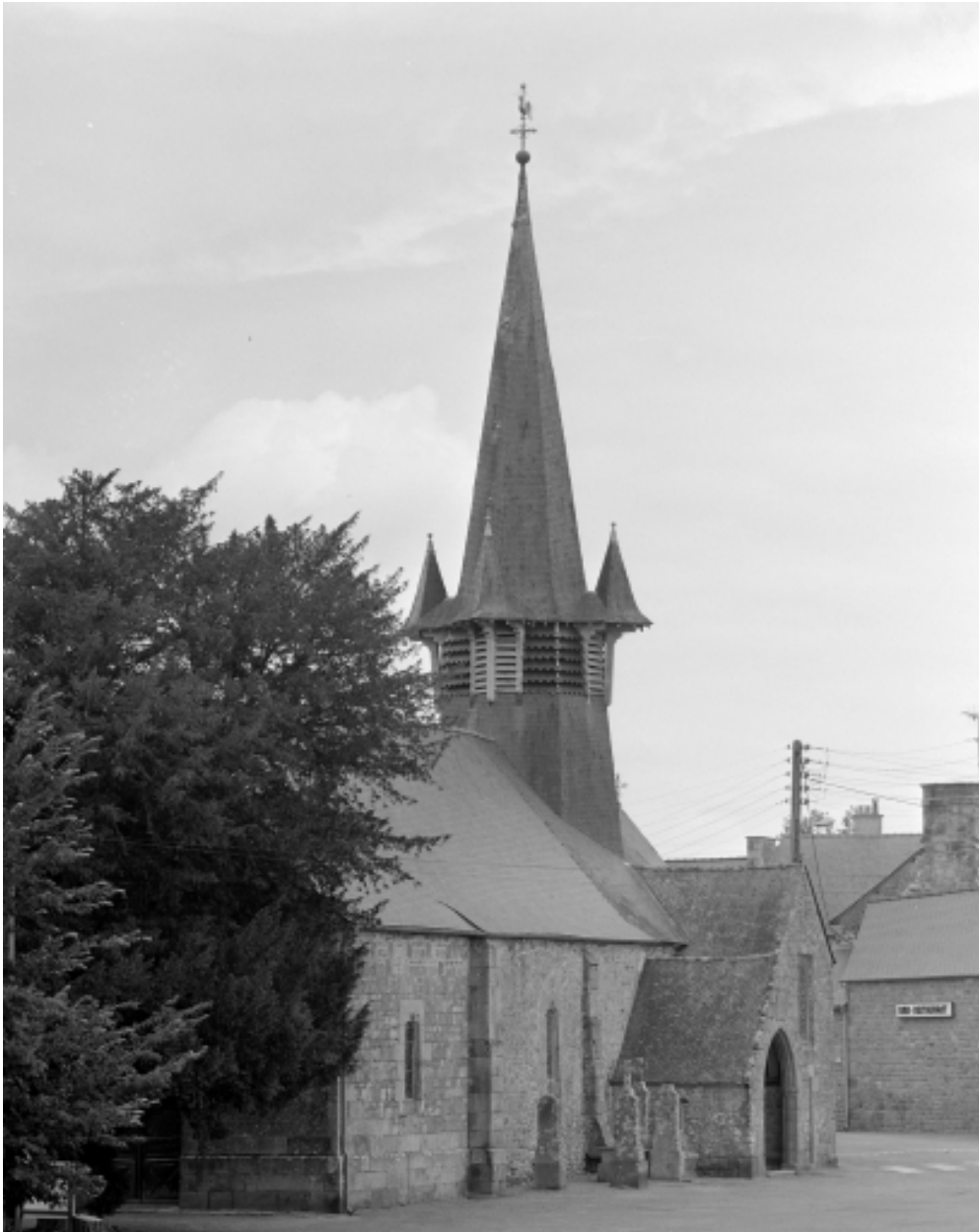
Elévation Sud-Ouest : vue générale