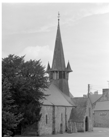
Elévation Sud-Ouest : vue générale, IVR53_19943501280X