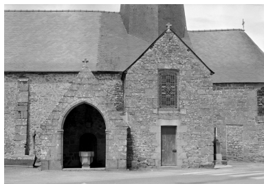
Elévation Sud, partie centrale, porte Sud : vue générale IVR53_19943501278X