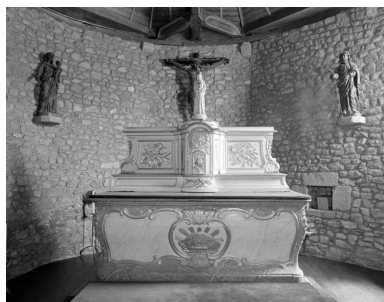
Intérieur, choeur : vue générale IVR53_19773500123X