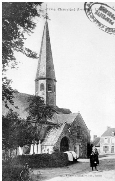
Elévation Sud : vue générale IVR53_19933500541XB