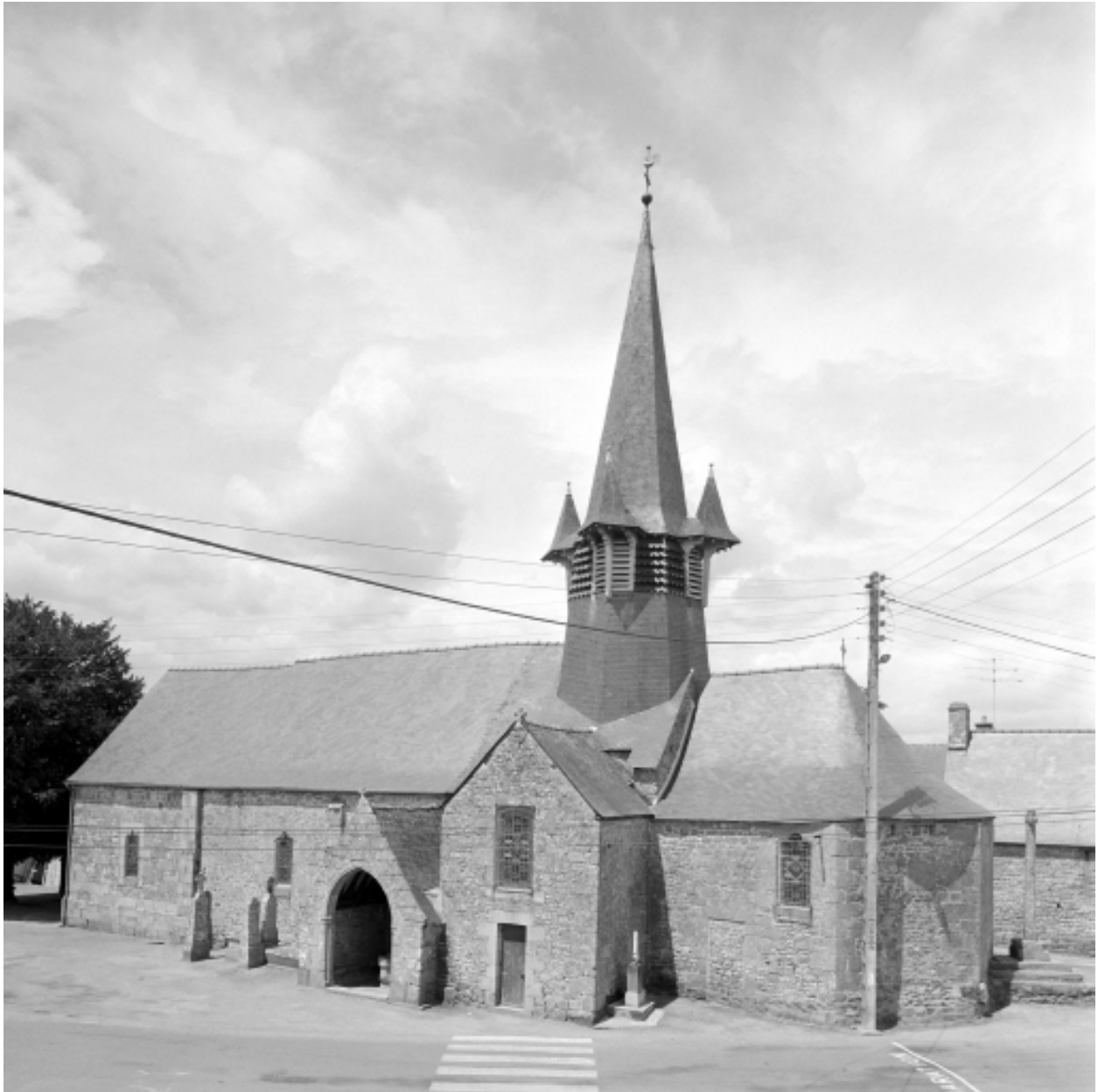
Elévation Sud-Est : vue générale