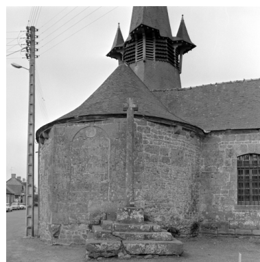
Elévation Est : vue générale IVR53_19773500159X