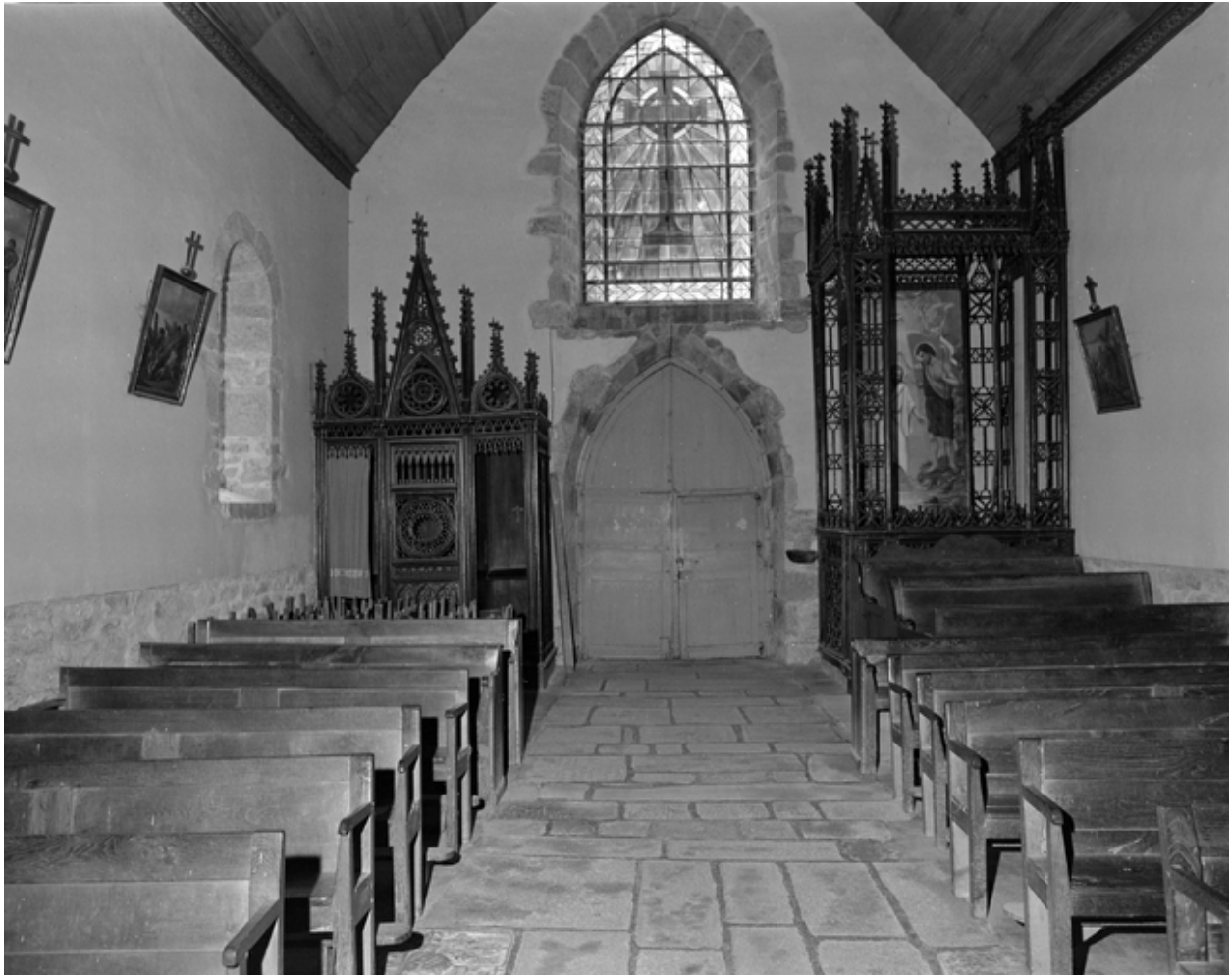
Intérieur, nef : vue générale