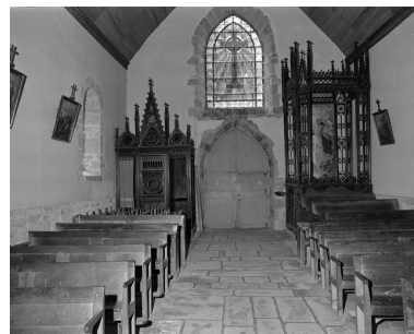
Intérieur, nef : vue générale IVR53_19773500134X