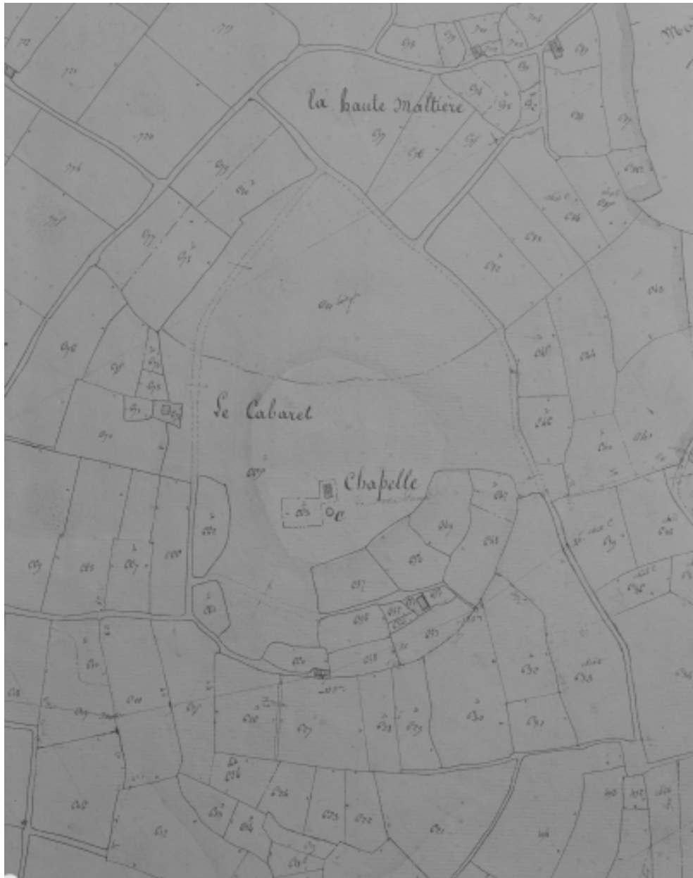
Extrait cadastral de 1833, section A2 n°663 (AD35 : 3 P 5418)