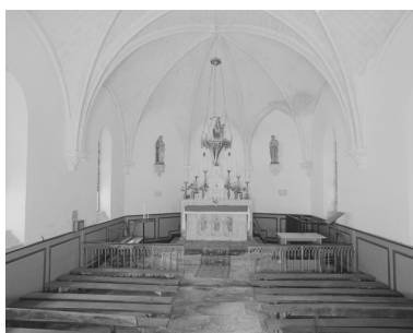
Intérieur : vue générale vers le chœur.