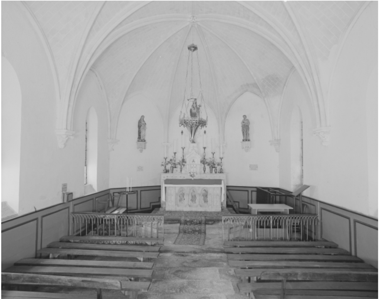
Intérieur : vue générale vers le chœur.