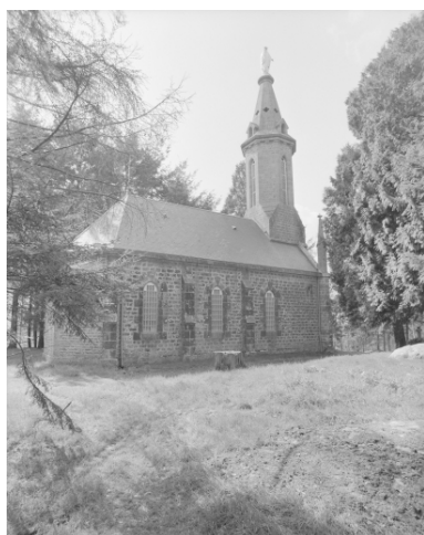
Elévation Nord : vue générale IVR53_19933500325X