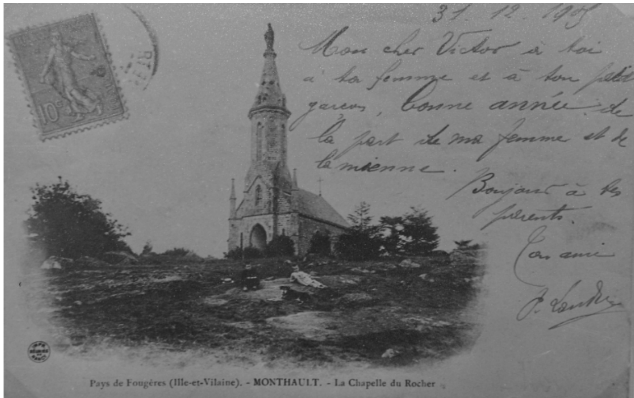
Elévation Sud-Ouest : vue de situation (Carte postale ancienne, AD35 : 6Fi)