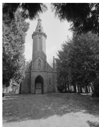
Elévation Ouest : vue générale IVR53_19933500324X