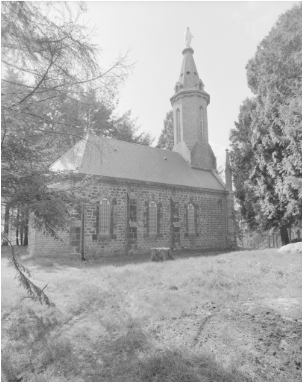
Elévation Nord : vue générale