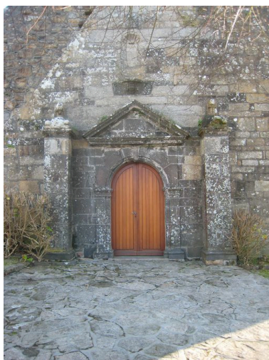
Porche de l'église IVR53_20072908903NUCA