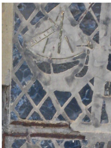
Vitrail de l'église