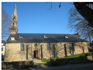
Vue générale de l'église Saint-Eloi