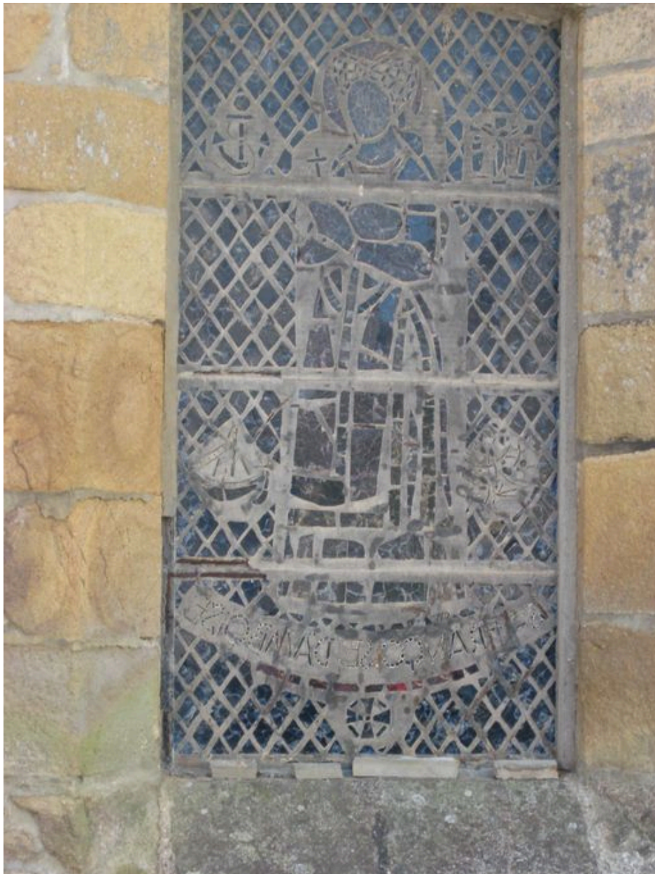
Vitrail de l'église