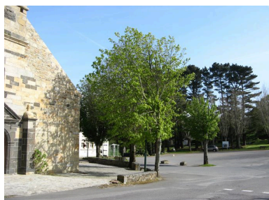
Place de l'Eglise