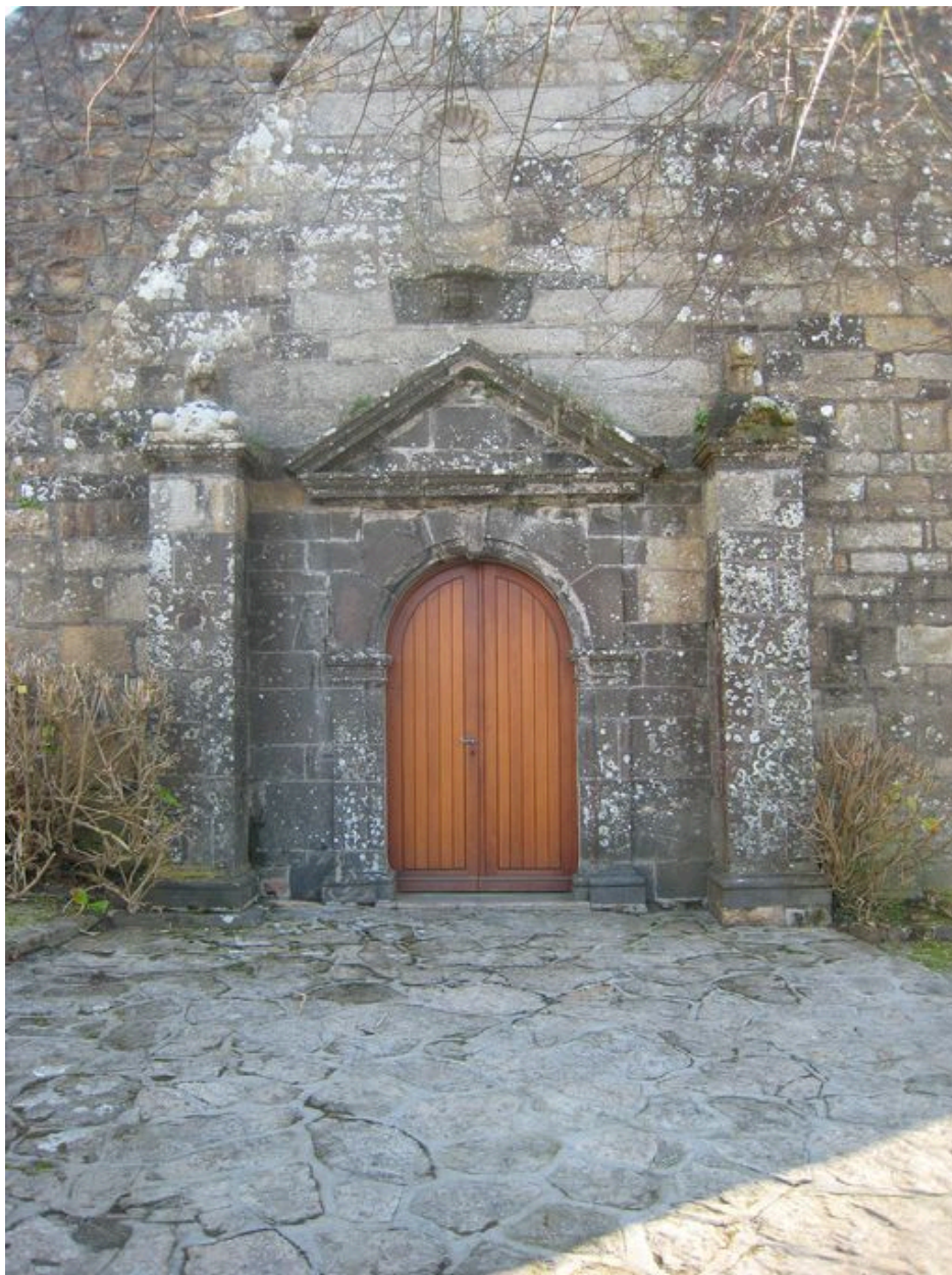
Porche de l'église