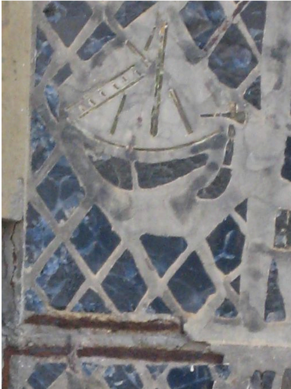
Vitrail de l'église