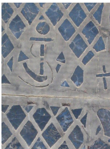
Vitrail de l'église