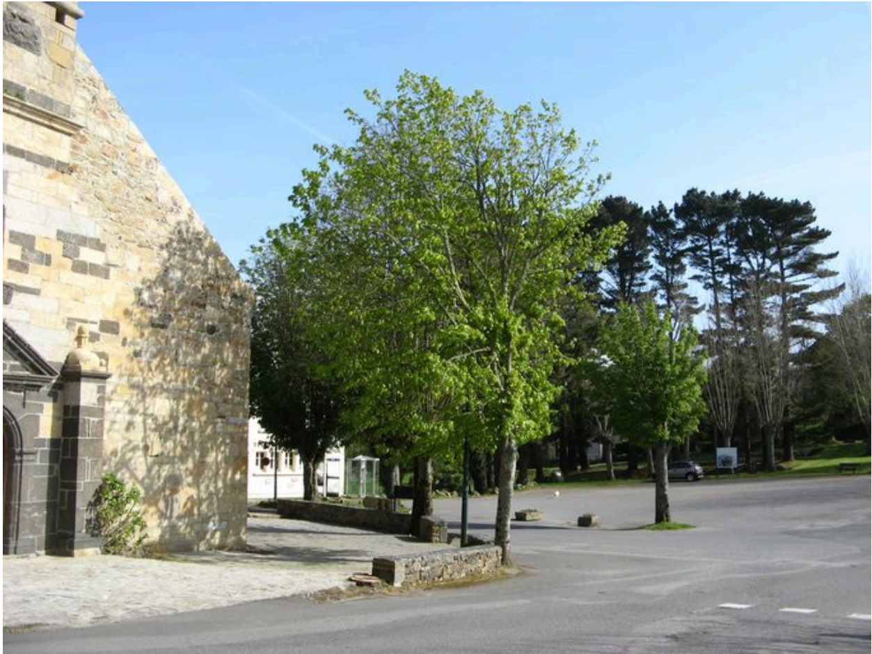
Place de l'Eglise