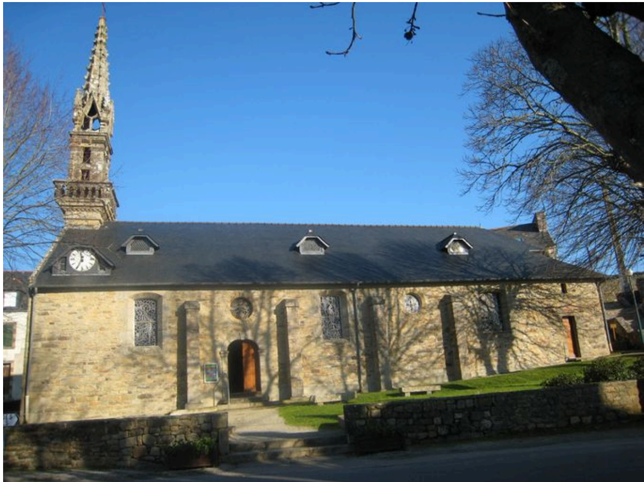
Vue générale de l'église Saint-Eloi