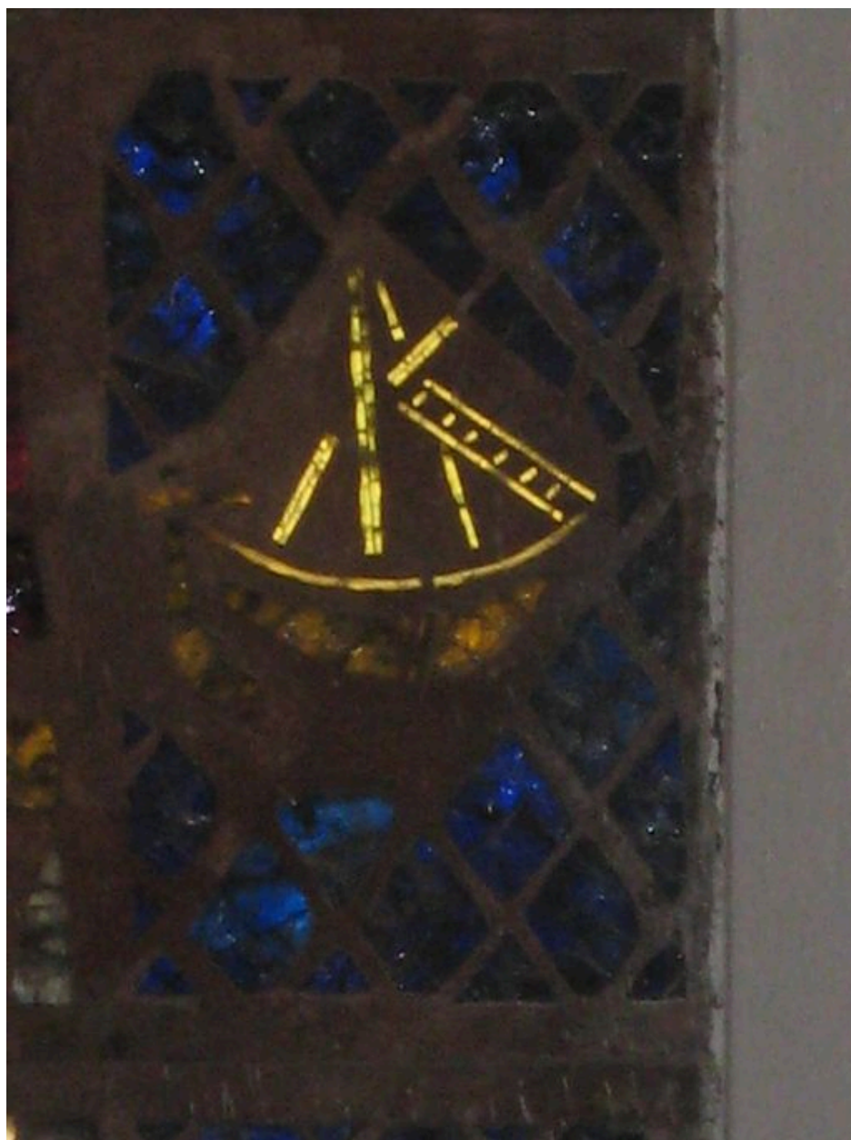
Vitrail de l'église