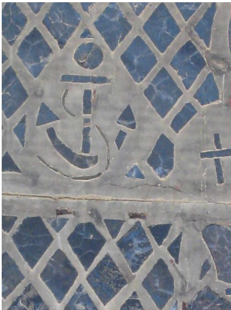
Vitrail de l'église