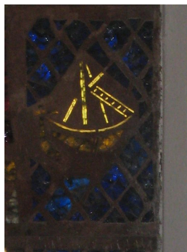
Vitrail de l'église IVR53_20072908907NUCA