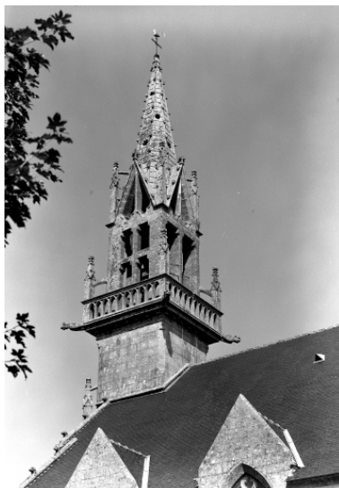
Plonévez-Porzay, chapelle Sainte- Anne-La-Palud : clocher, état en 1970 IVR53_19702901011V