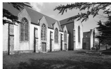
Plonévez-Porzay, chapelle Sainte-Anne-La-Palud : façade sud, état en 1972