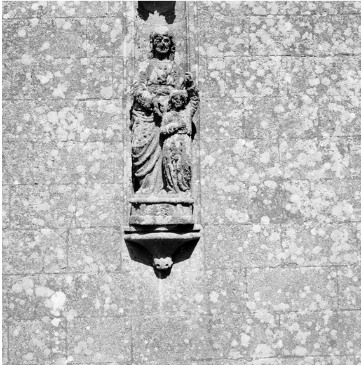
Plonévez-Porzay, chapelle Sainte-Anne-La-Palud : groupe de sainte Anne et la Vierge n°4, état en 1969