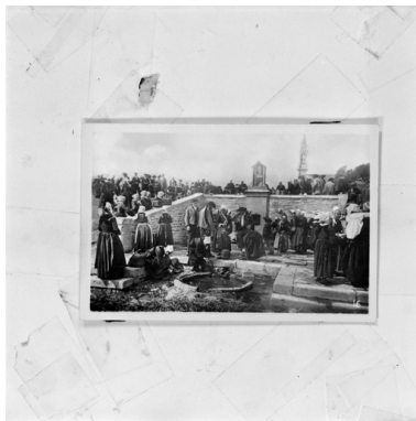
Plonévez-Porzay, chapelle Sainte-Anne-La-Palud : la fontaine miraculeuse, photographie vers 1900

Repro. Guy Artur, Repro. Norbert Lambart, Autr. Léon Gaucherel, Autr. Adrien Dauzats IVR53_19922900095X