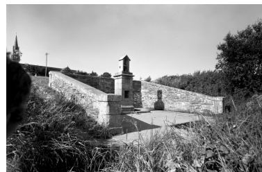
Plonévez-Porzay, chapelle Sainte-Anne-La-Palud : oratoire de l'enclos, état en 1970