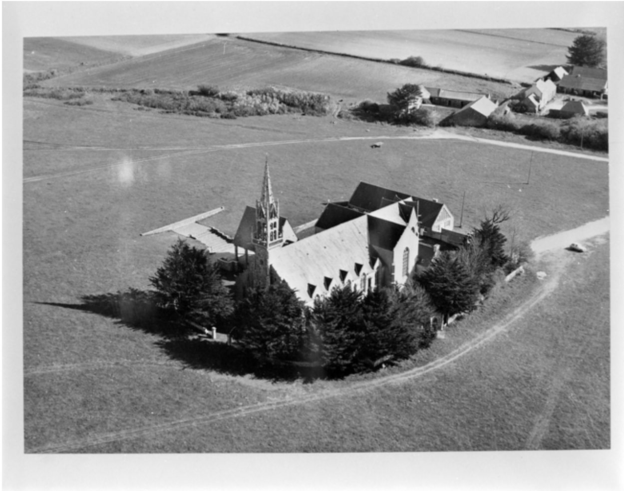
Plonévez-Porzay, chapelle Sainte-Anne-La-Palud : vue aérienne sud-ouest, état en 1977