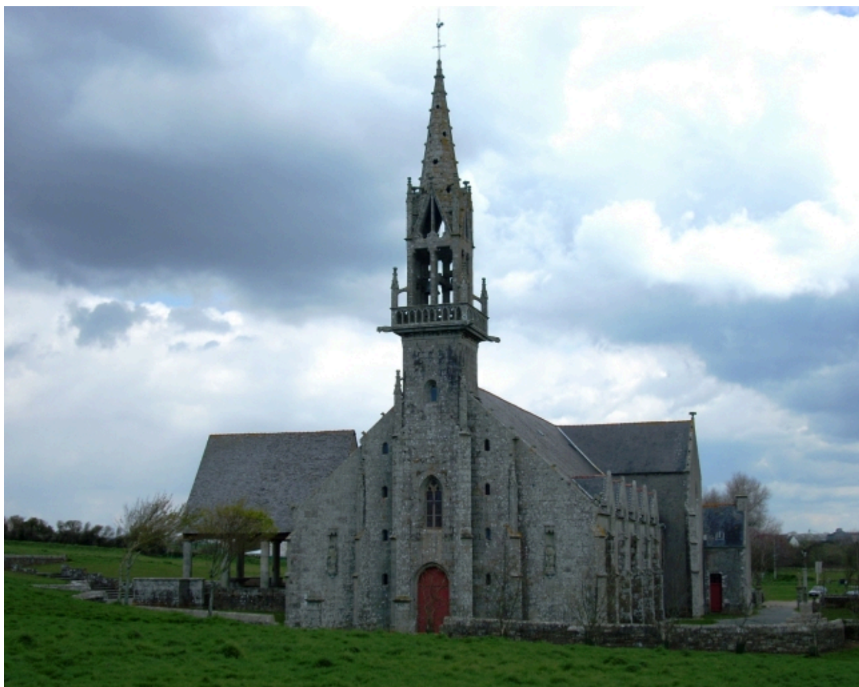
Plonévez-Porzay, chapelle Sainte-Anne-La-Palud : vue générale sud-ouest