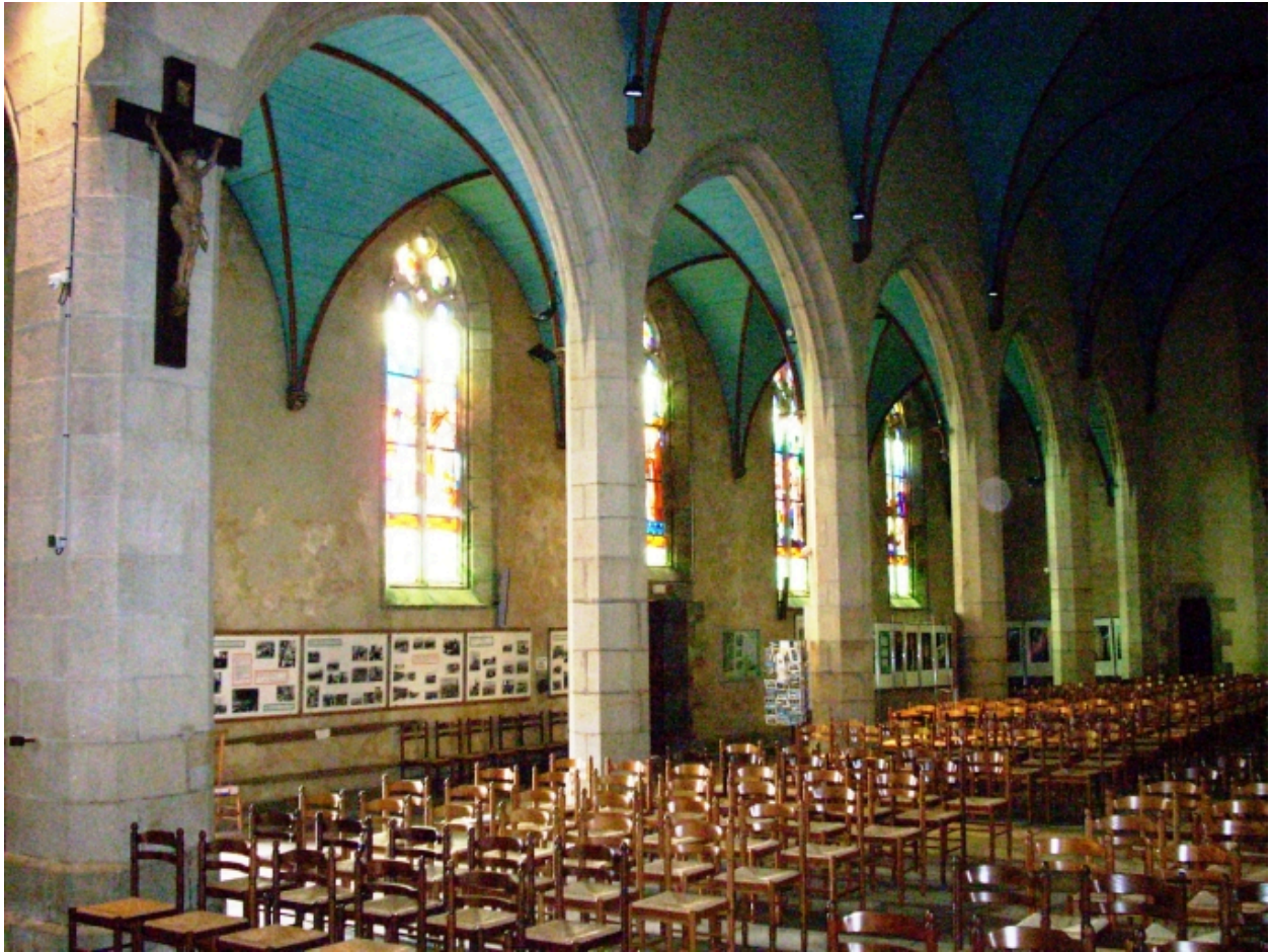
Plonévez-Porzay, chapelle Sainte-Anne-La-Palud : vue transversale sud-ouest