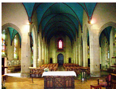
Plonévez-Porzay, chapelle Sainte- Anne-La-Palud : vue axiale ouest IVR53_20082905669NUCA