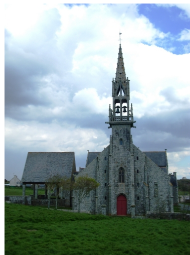
Plonévez-Porzay, chapelle Sainte- Anne-La-Palud : vue générale ouest IVR53_20082905665NUCA