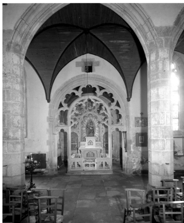
Plonévez-Porzay, chapelle Sainte-Anne-La-Palud : chapelle latérale nord, état en 1972