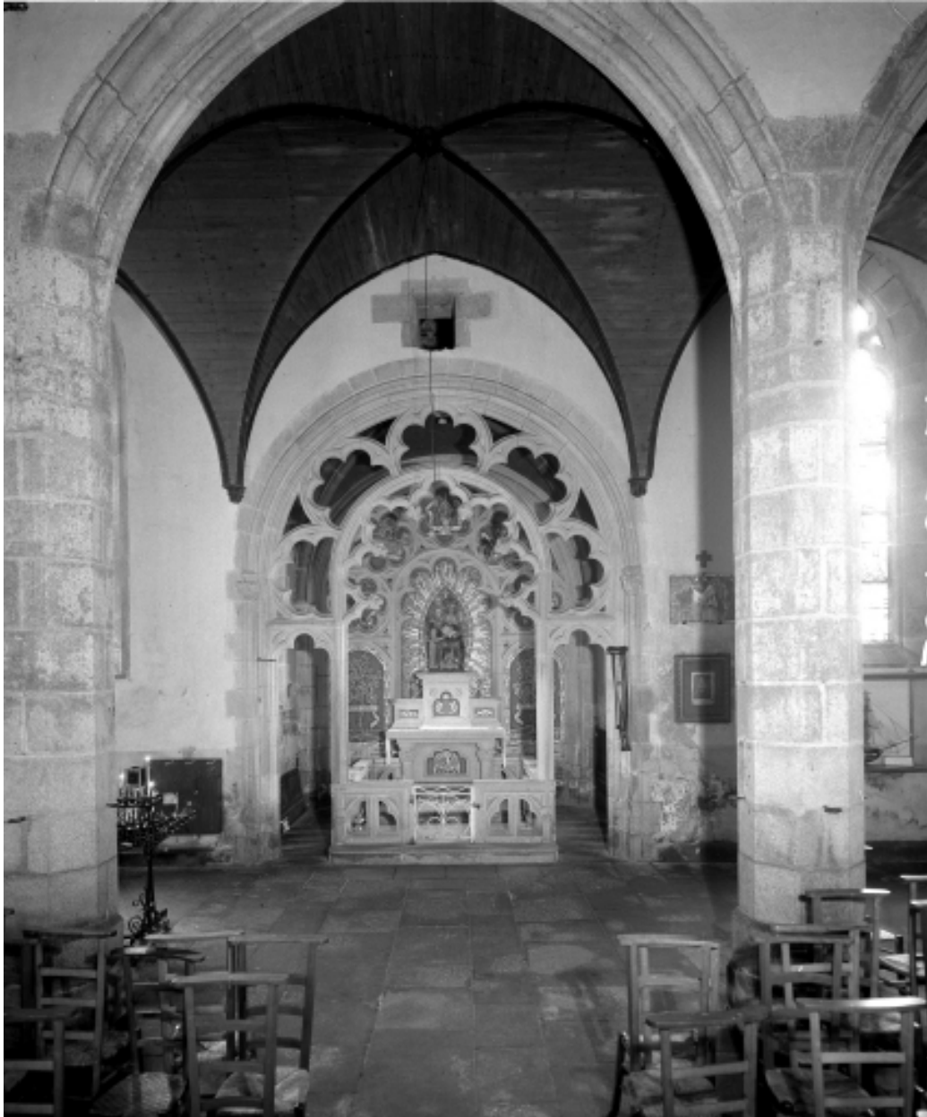
Plonévez-Porzay, chapelle Sainte-Anne-La-Palud : chapelle latérale nord, état en 1972