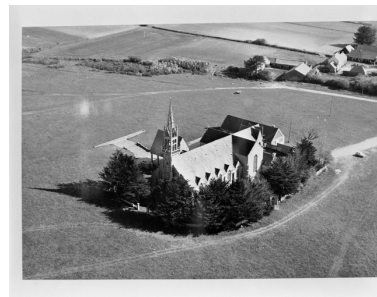
Plonévez-Porzay, chapelle Sainte-Anne-La-Palud : vue aérienne sud-ouest, état en 1977

Phot. Base aéronavale de Lanvéoc-Poulmic IVR53_19772900046X