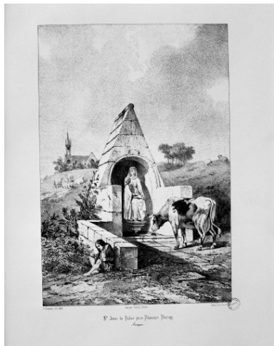
Plonévez-Porzay, chapelle Sainte-Anne-La-Palud. Gravure (Voyages pittoresques et romantiques dans l'ancienne France, 1845-1846)