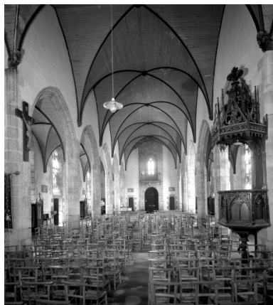
Plonévez-Porzay, chapelle Sainte-Anne-La-Palud : nef, vue générale vers l'ouest, état en 1972