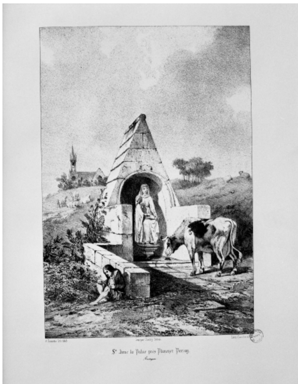
Plonévez-Porzay, chapelle Sainte-Anne-La-Palud. Gravure (Voyages pittoresques et romantiques dans l'ancienne France, 1845-1846)