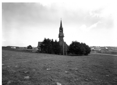
Plonévez-Porzay, chapelle Sainte-Anne-La-Palud : vue de situation ouest, état en 1972

Phot. Base aéronavale de Lanvéoc-Poulmic IVR53_19772900046X