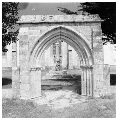
Plonévez-Porzay, chapelle Sainte-Anne-La-Palud : portail sud de l'enclos, état en 1969