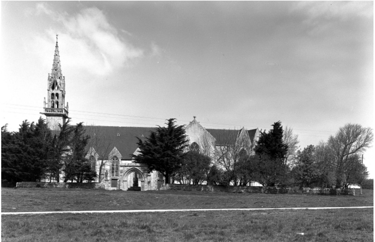
Plonévez-Porzay, chapelle Sainte-Anne-La-Palud : vue générale sud, état en 1972