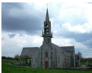
Plonévez-Porzay, chapelle Sainte-Anne-La-Palud : vue générale sud-ouest