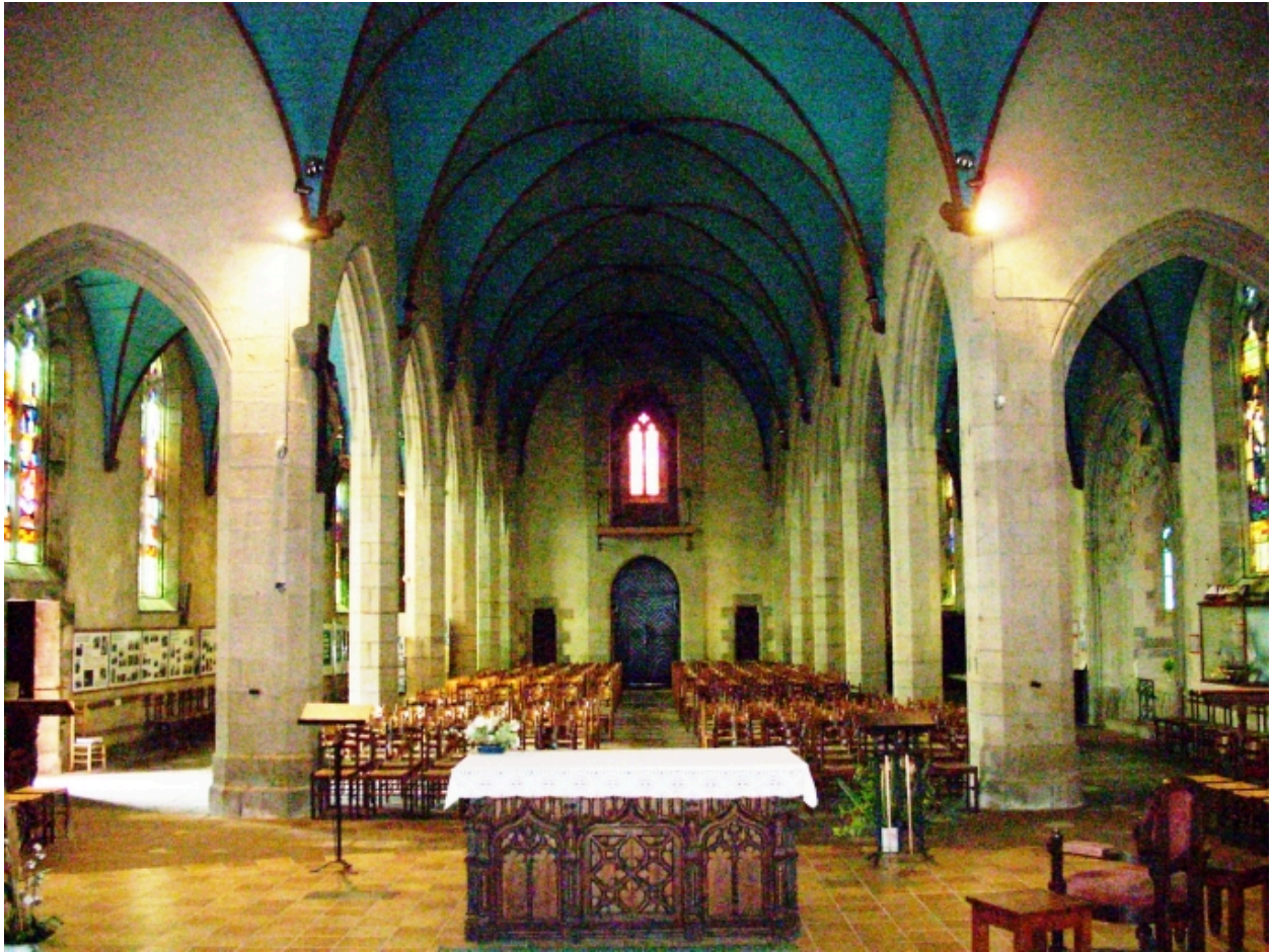
Plonévez-Porzay, chapelle Sainte-Anne-La-Palud : vue axiale ouest