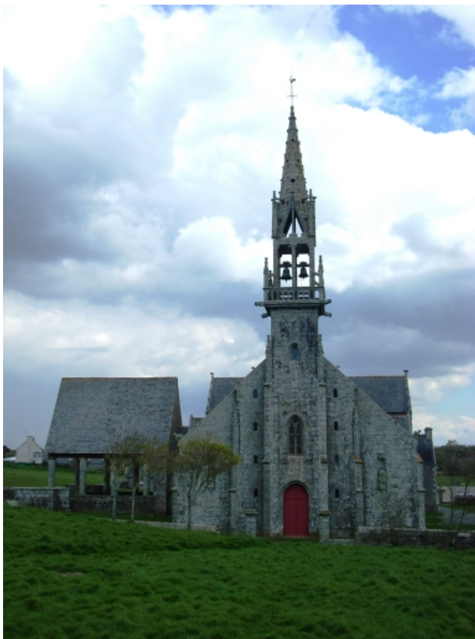
Plonévez-Porzay, chapelle Sainte-Anne-La-Palud : vue générale ouest