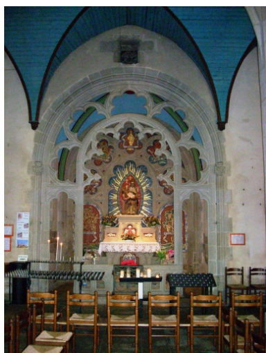
Plonévez-Porzay, chapelle Sainte-Anne-La-Palud : chapelle latérale Sainte-Anne, détail