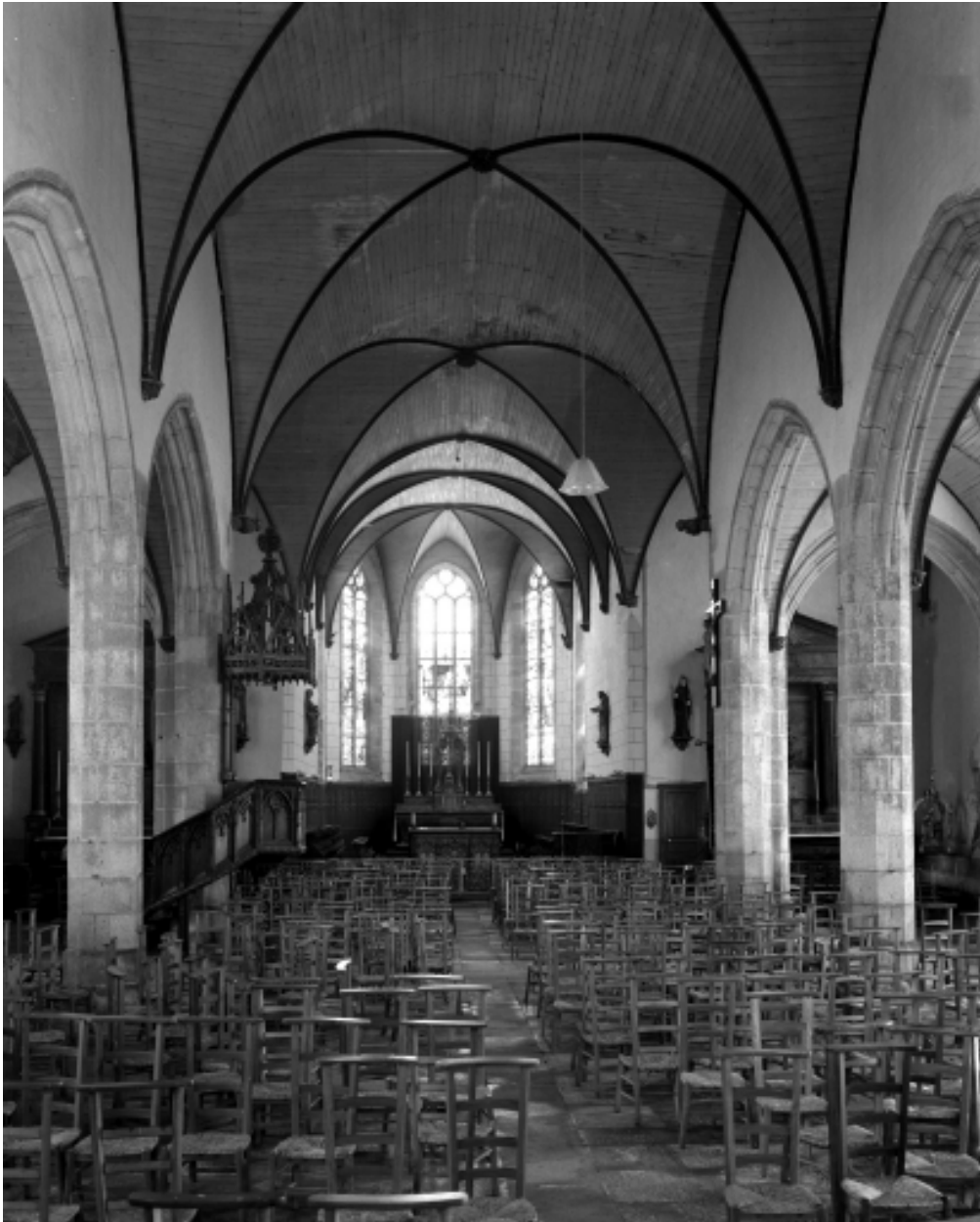
Plonévez-Porzay, chapelle Sainte-Anne-La-Palud : nef, vue générale vers l'est, état en 1970