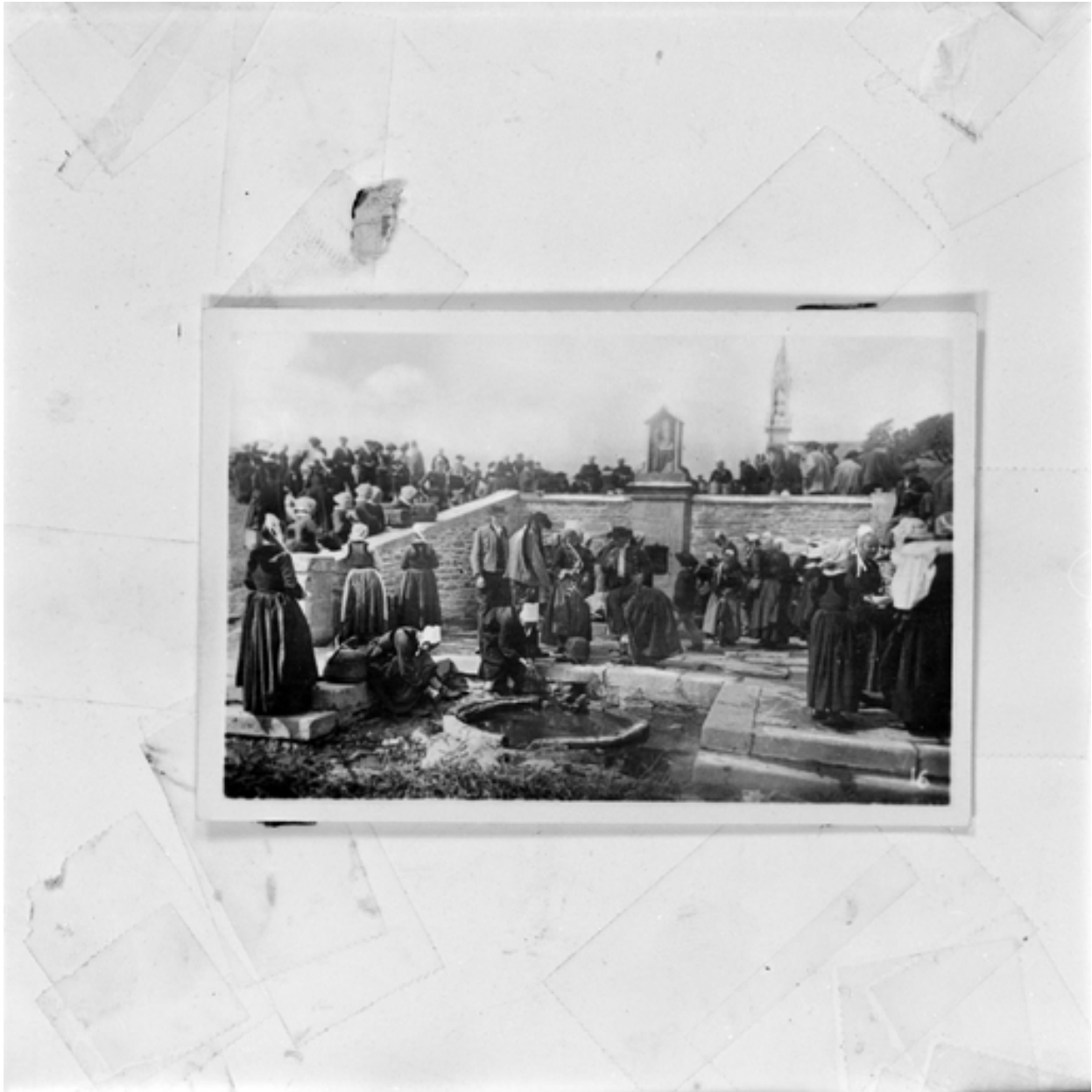
Plonévez-Porzay, chapelle Sainte-Anne-La-Palud : la fontaine miraculeuse, photographie vers 1900