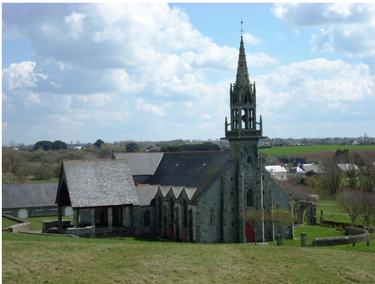
Plonévez-Porzay, chapelle Sainte-Anne-La-Palud : vue générale nord-ouest