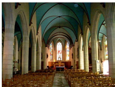
Plonévez-Porzay, chapelle Sainte- Anne-La-Palud : vue axiale est IVR53_20082905668NUCA