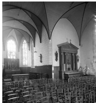
Plonévez-Porzay, chapelle Sainte-Anne-La-Palud : croisée du transept, état en 1972