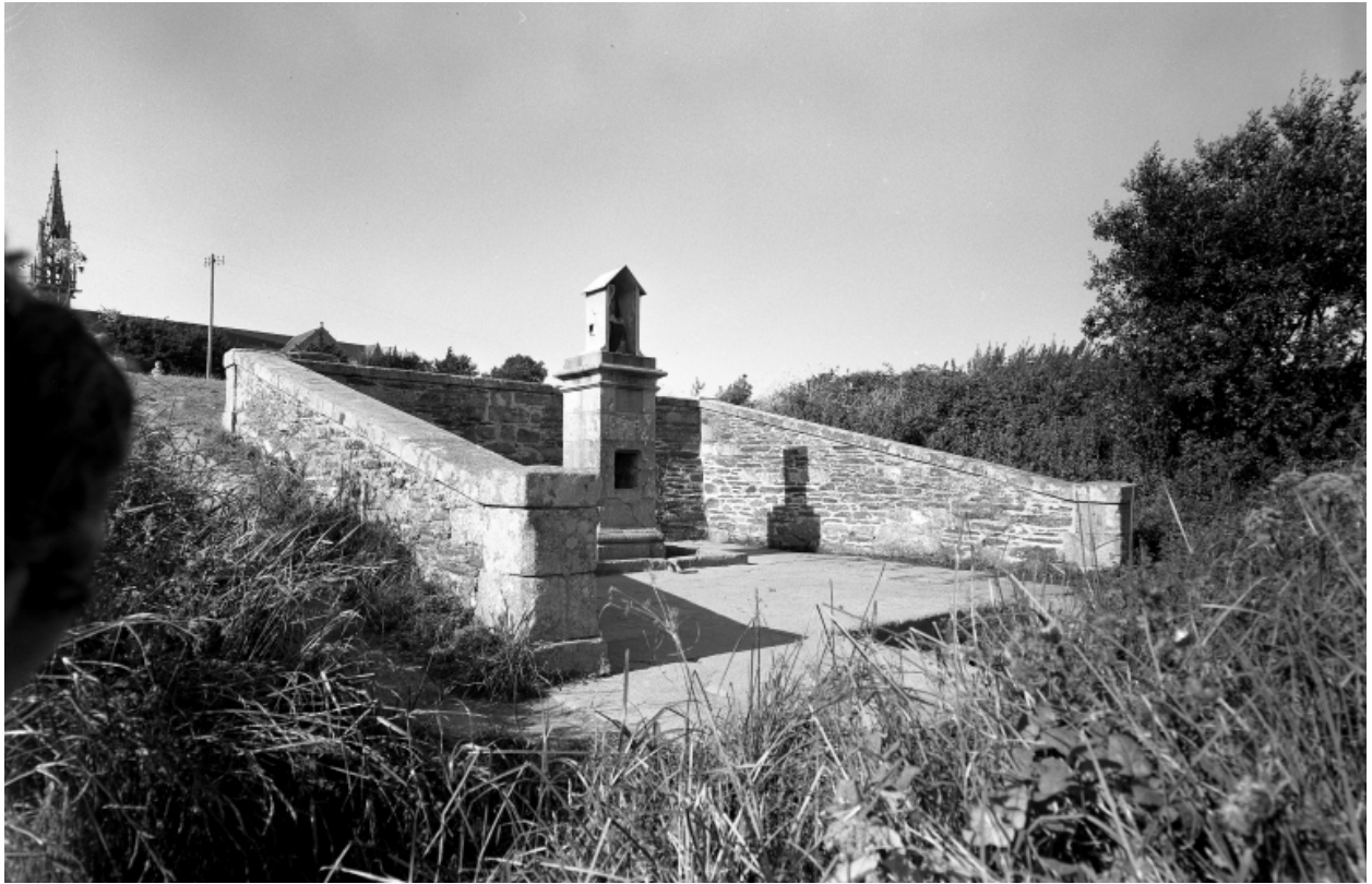
Plonévez-Porzay, chapelle Sainte-Anne-La-Palud : oratoire de l'enclos, état en 1970