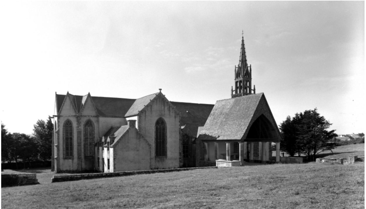
Plonévez-Porzay, chapelle Sainte-Anne-La-Palud : façade nord, état en 1970