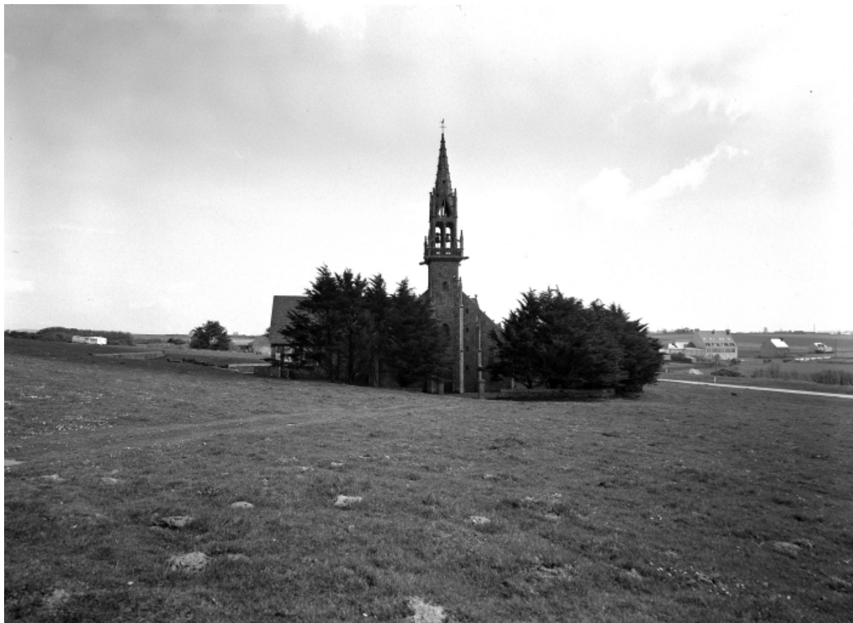
Plonévez-Porzay, chapelle Sainte-Anne-La-Palud : vue de situation ouest, état en 1972