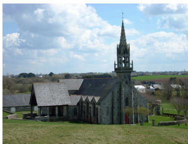
Plonévez-Porzay, chapelle Sainte-Anne-La-Palud : vue générale nord-ouest IVR53_20082905664NUCA