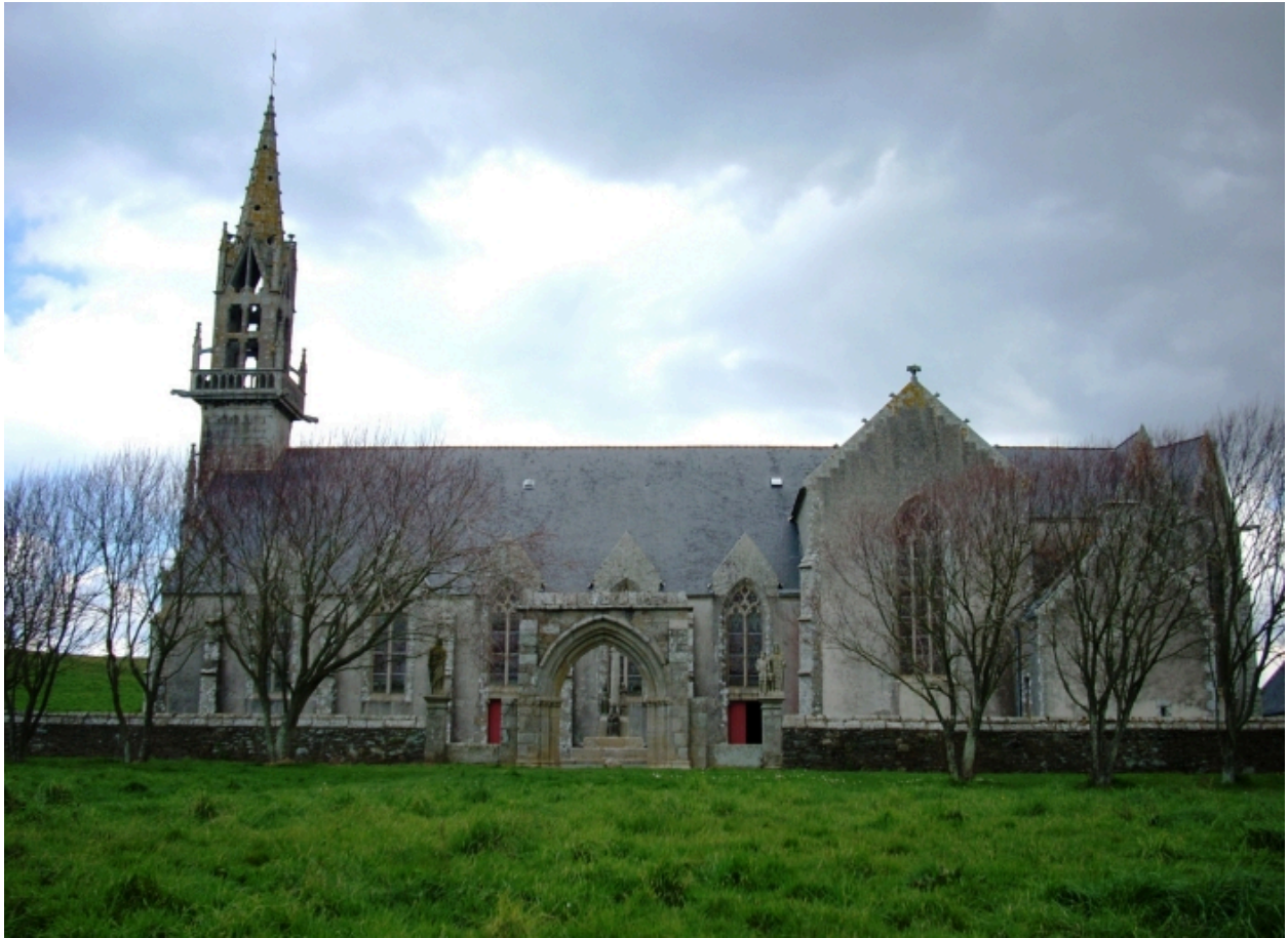
Plonévez-Porzay, chapelle Sainte-Anne-La-Palud : élévation sud