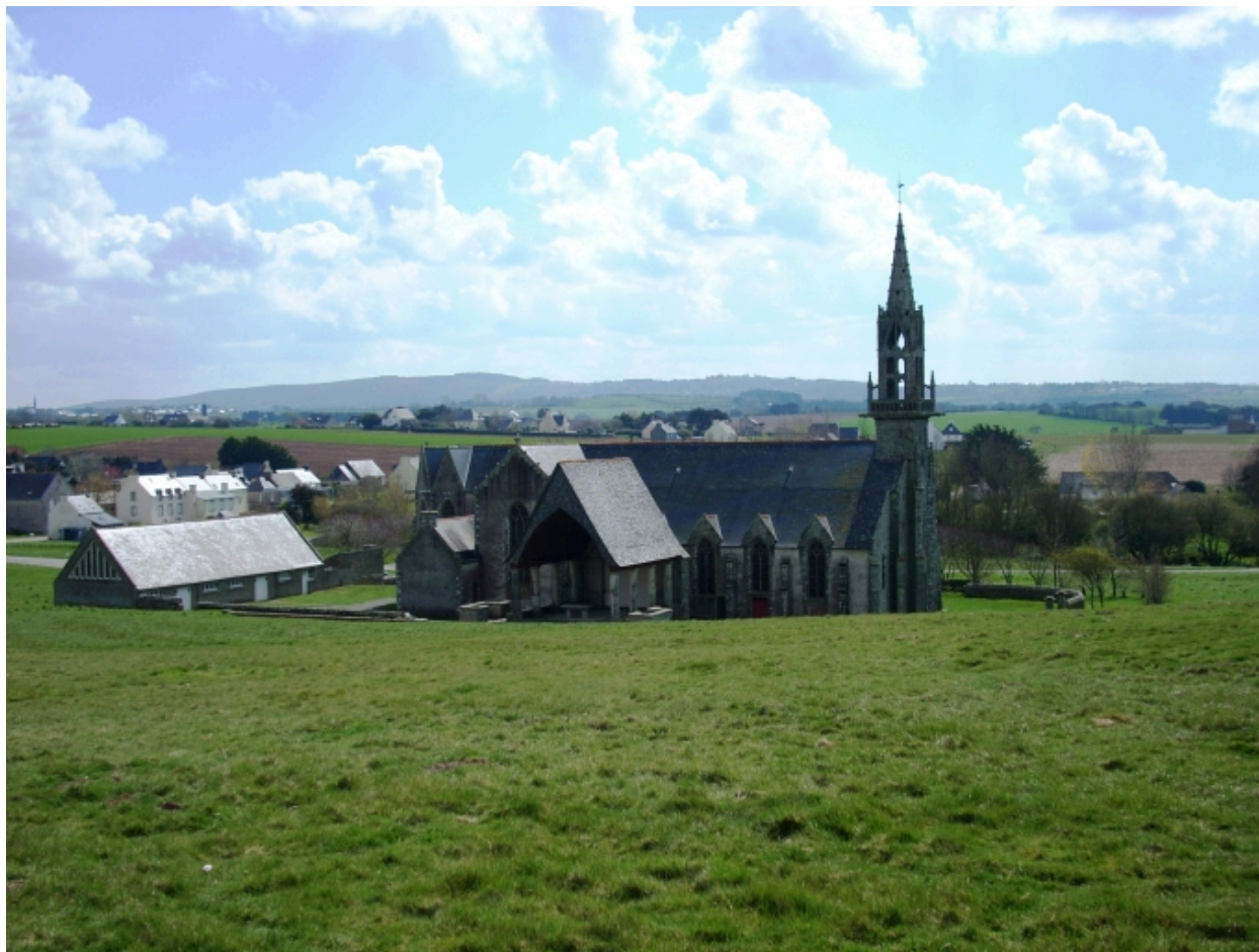
Plonévez-Porzay, chapelle Sainte-Anne-La-Palud : vue de situation nord