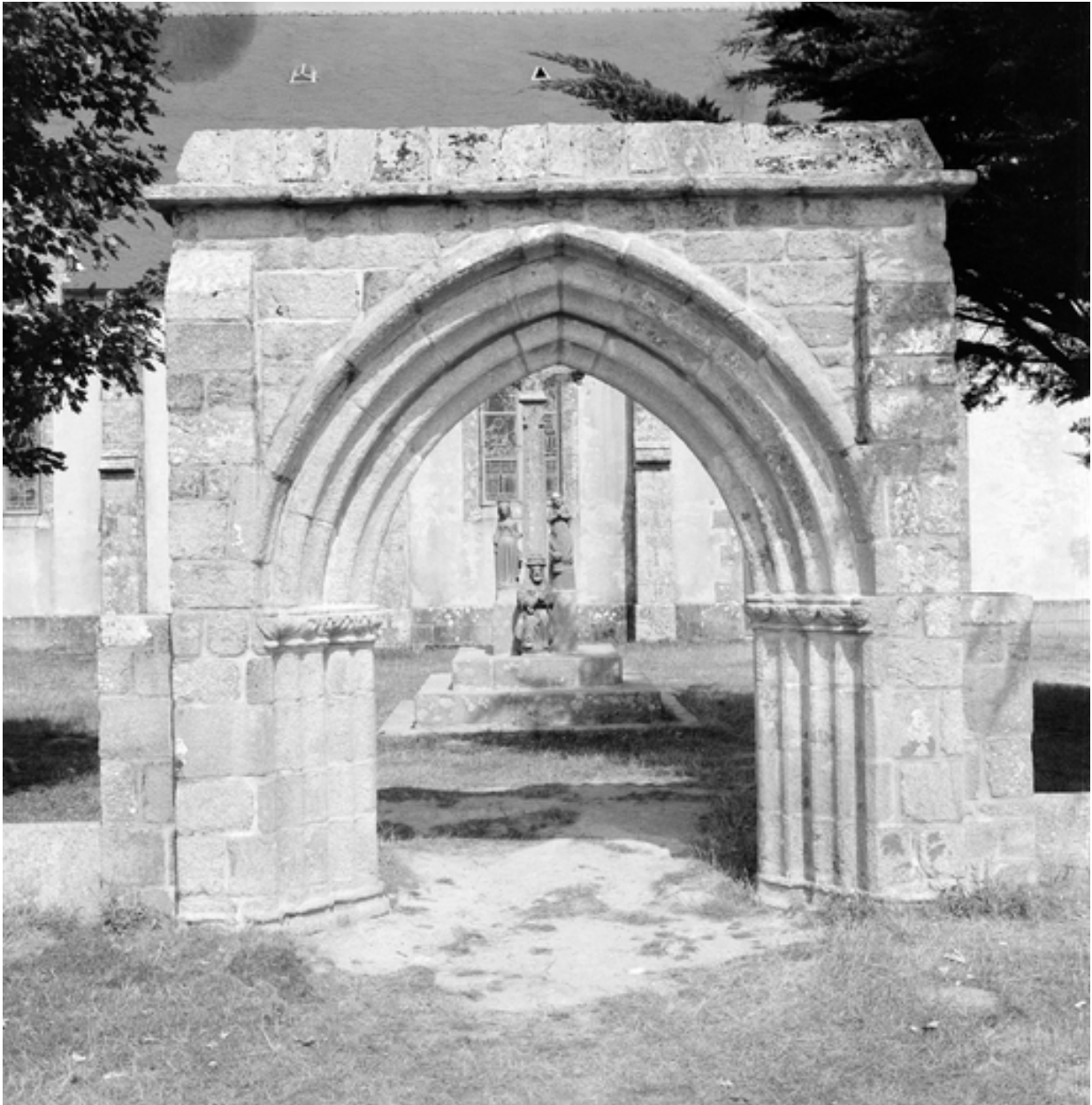
Plonévez-Porzay, chapelle Sainte-Anne-La-Palud : portail sud de l'enclos, état en 1969