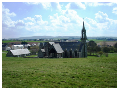
Plonévez-Porzay, chapelle Sainte- Anne-La-Palud : vue de situation nord IVR53_20082905663NUCA