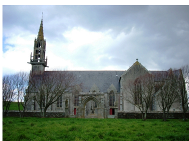
Plonévez-Porzay, chapelle Sainte- Anne-La-Palud : élévation sud