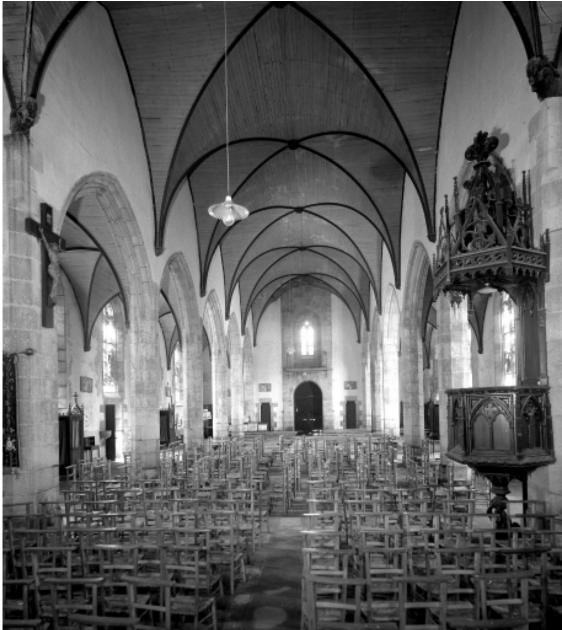
Plonévez-Porzay, chapelle Sainte-Anne-La-Palud : nef, vue générale vers l'ouest, état en 1972