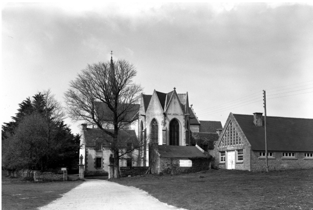
Plonévez-Porzay, chapelle Sainte-Anne-La-Palud : façade est, état en 1970