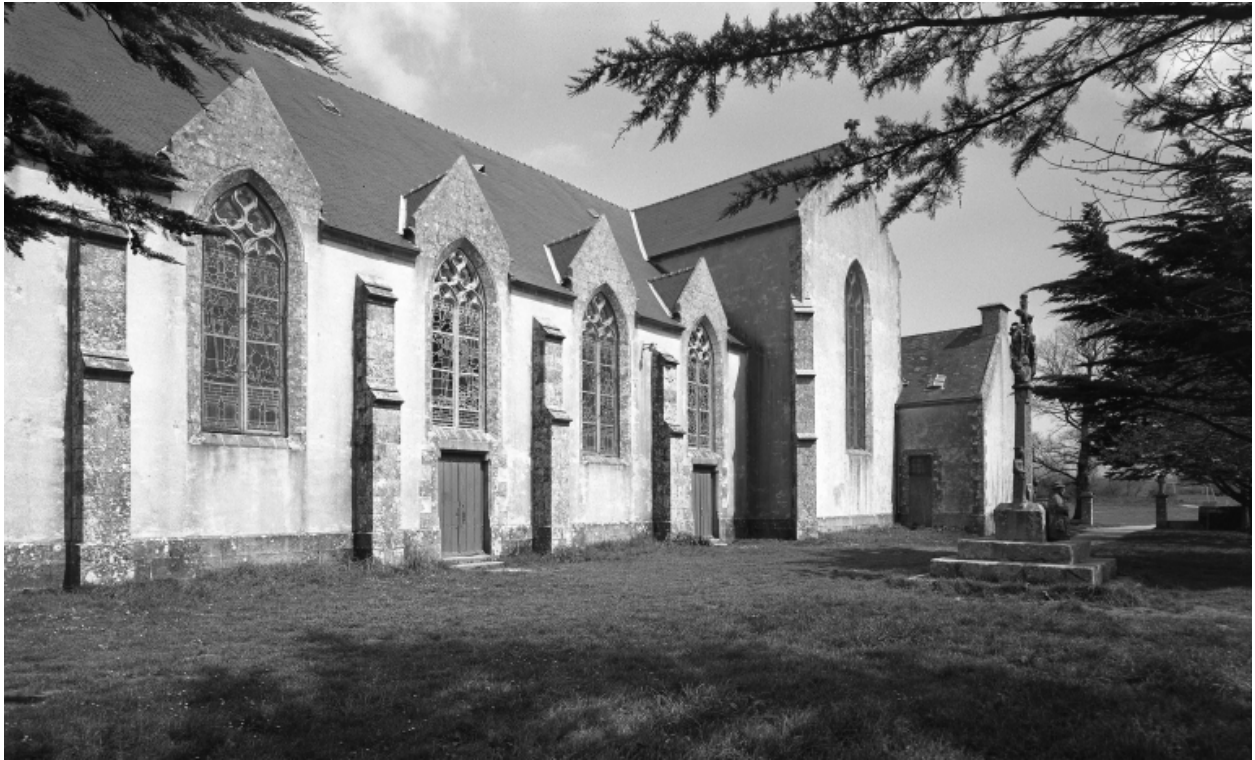
Plonévez-Porzay, chapelle Sainte-Anne-La-Palud : façade sud, état en 1972