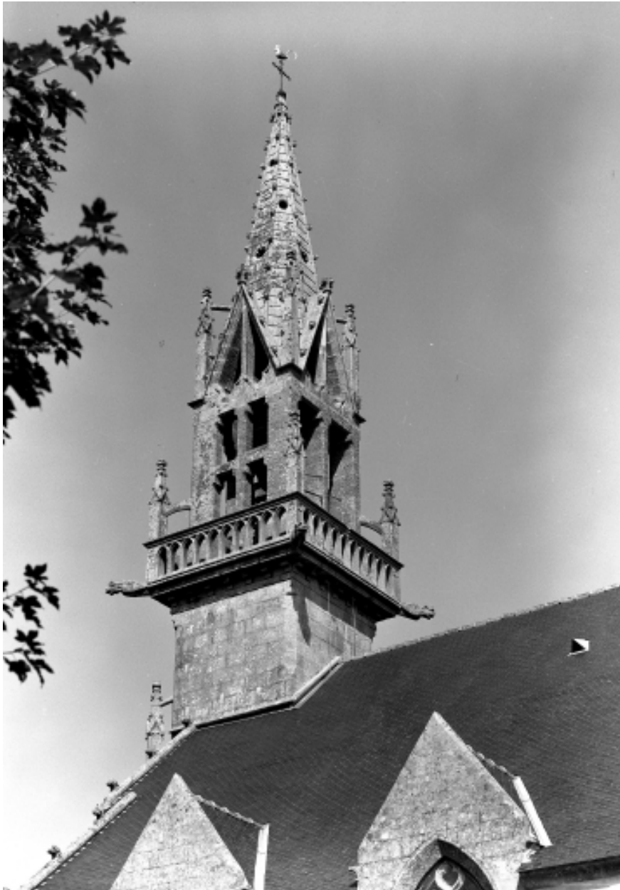
Plonévez-Porzay, chapelle Sainte-Anne-La-Palud : clocher, état en 1970