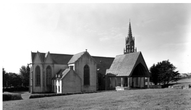
Plonévez-Porzay, chapelle Sainte-Anne-La-Palud : façade nord, état en 1970