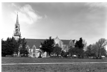
Plonévez-Porzay, chapelle Sainte-Anne-La-Palud : vue générale sud, état en 1972