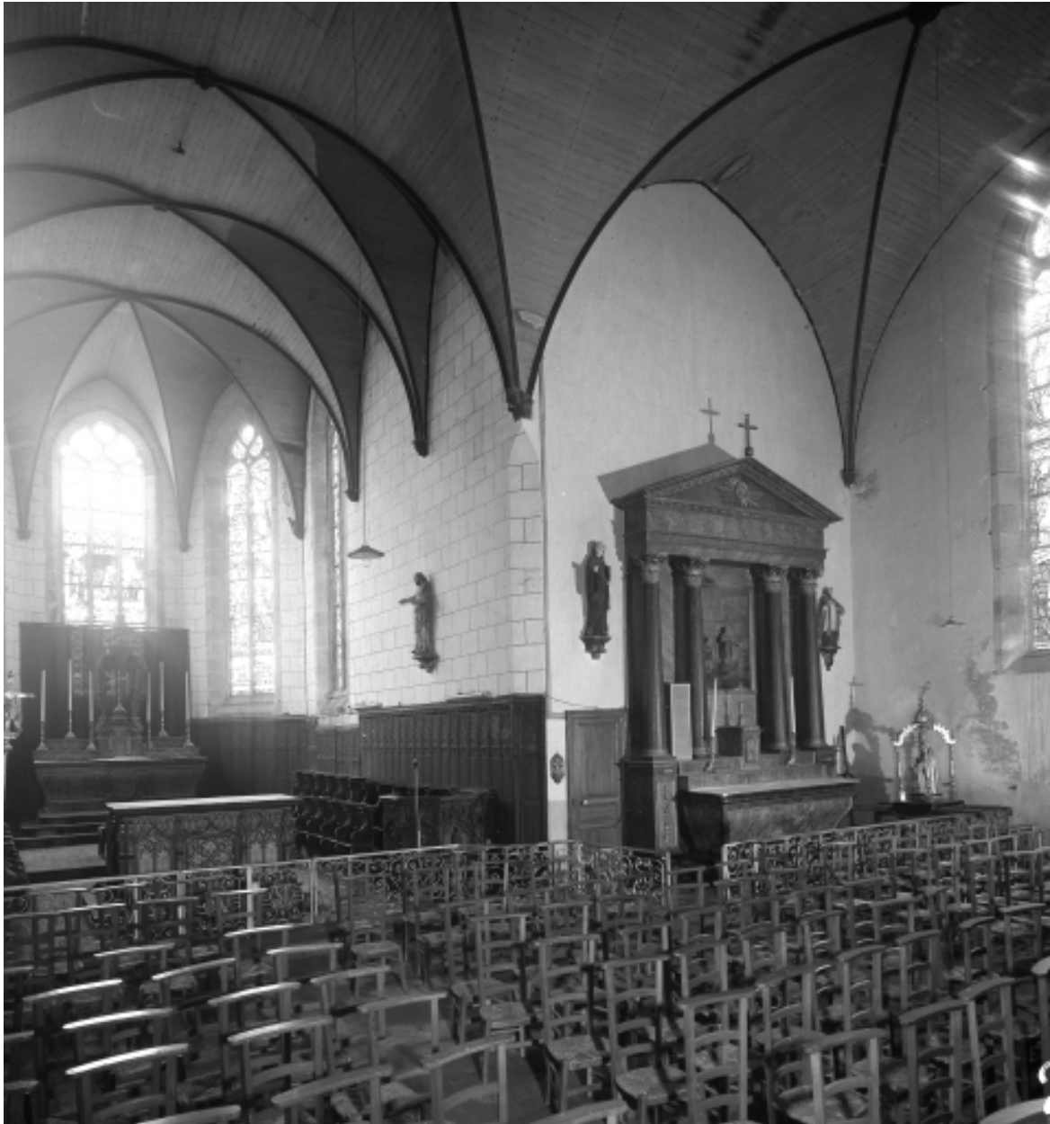
Plonévez-Porzay, chapelle Sainte-Anne-La-Palud : croisée du transept, état en 1972