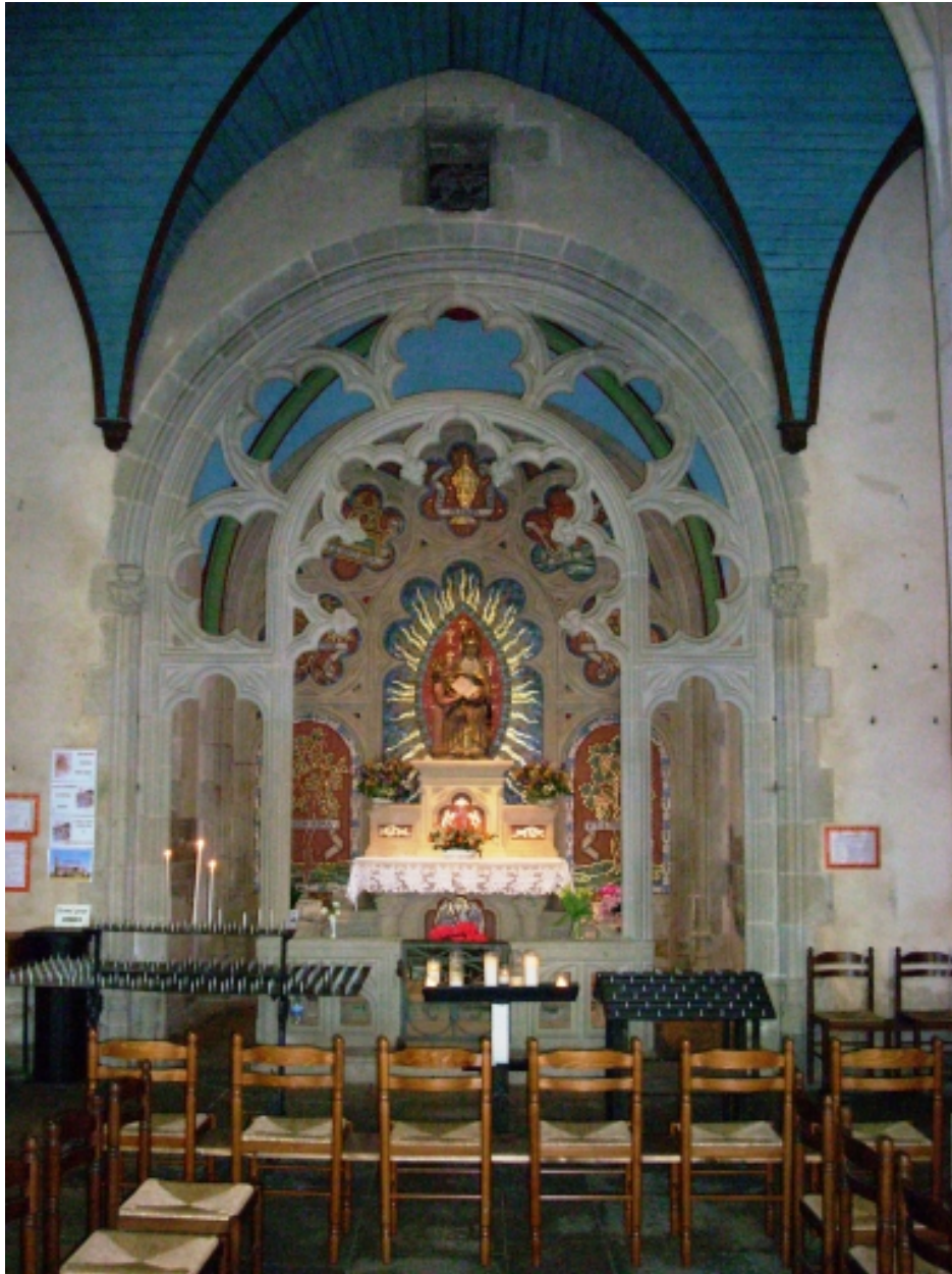
Plonévez-Porzay, chapelle Sainte-Anne-La-Palud : chapelle latérale Sainte-Anne, détail