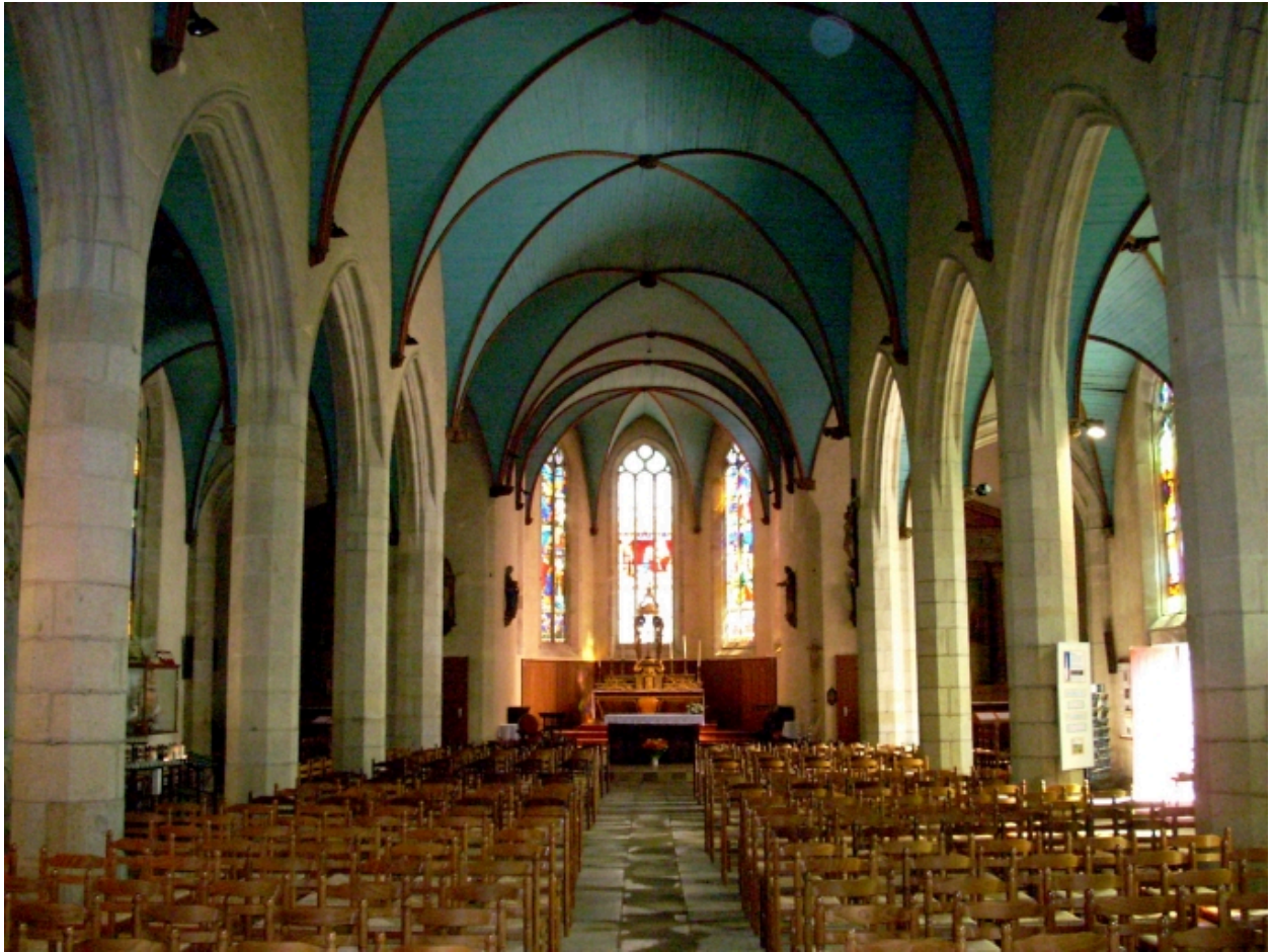
Plonévez-Porzay, chapelle Sainte-Anne-La-Palud : vue axiale est