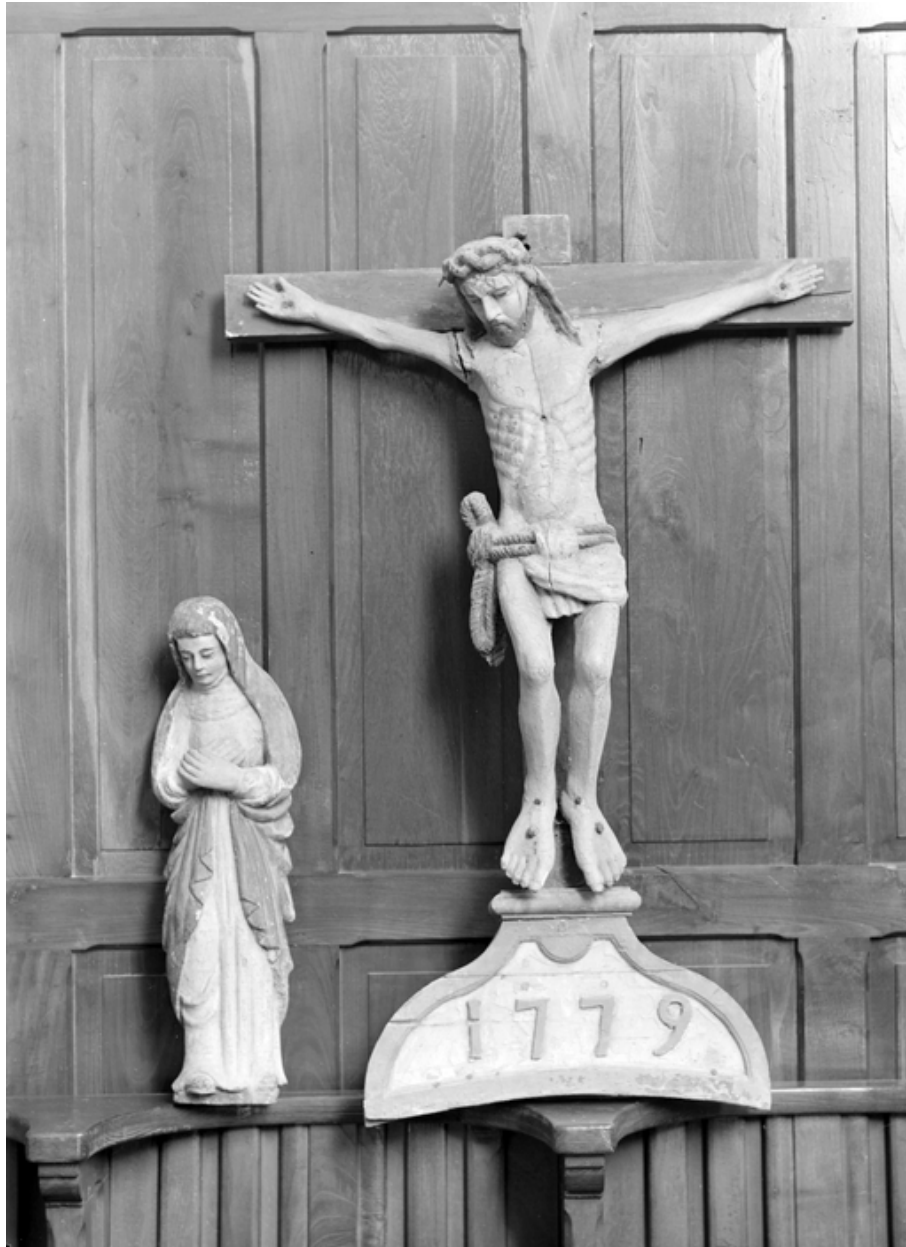
Vierge et Christ en croix : vue générale