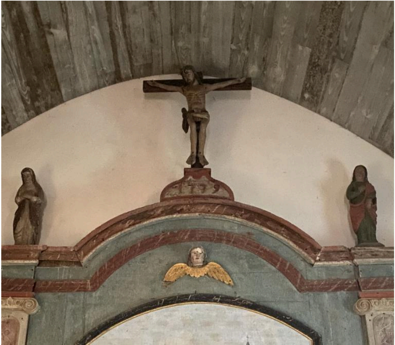
Groupe de Crucifixion : vue générale