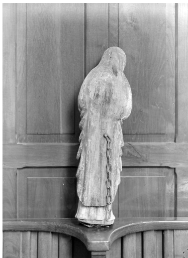
Statue de la Vierge : vue générale du revers IVR53_19845600850V