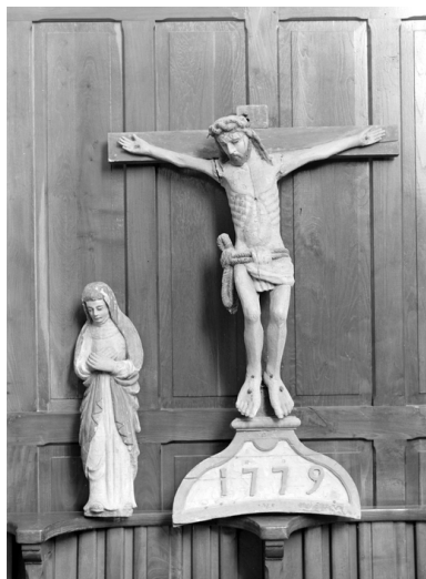
Vierge et Christ en croix : vue générale IVR53_19845600849V