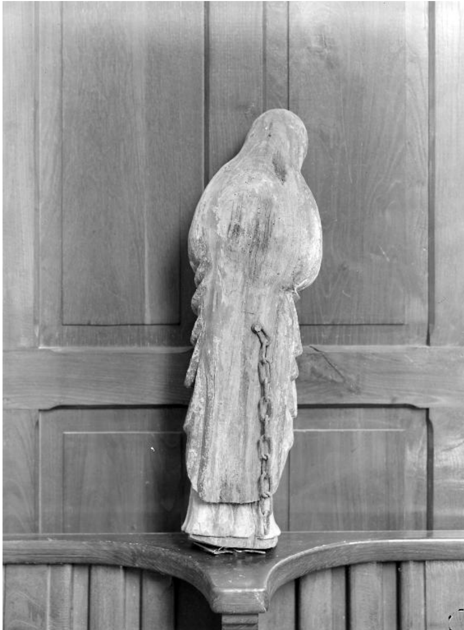
Statue de la Vierge : vue générale du revers