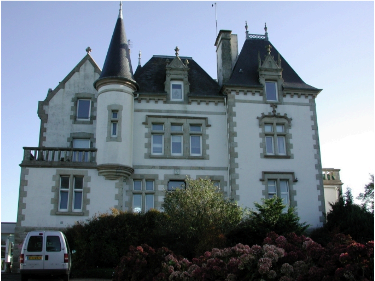
Vue générale (façade antérieure)