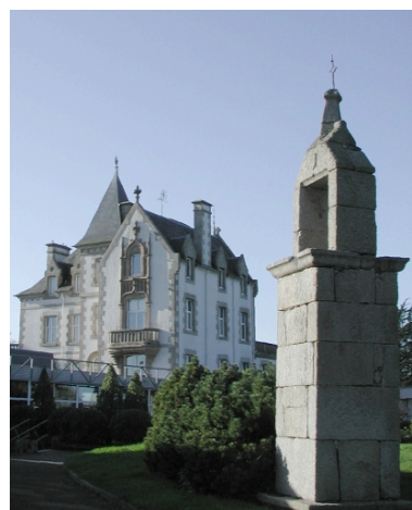
Vue générale IVR53_20042206022NUCA