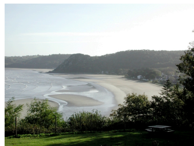
Vue générale de la plage de Saint-Efflam depuis le manoir de Kerallic