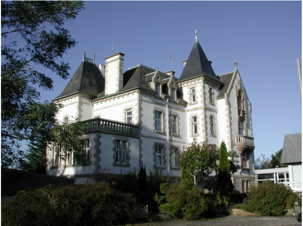
Vue générale (façade postérieure)