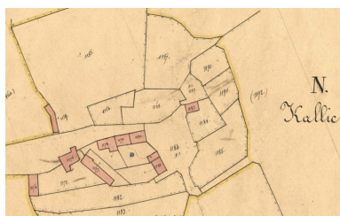
Extrait des plans cadastraux parcellaires de 1848 (AD 22) IVR53_20042206051NUCB