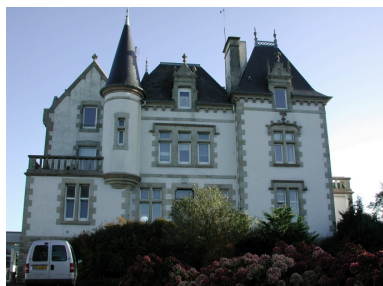
Vue générale (façade antérieure) IVR53_20042206023NUCA