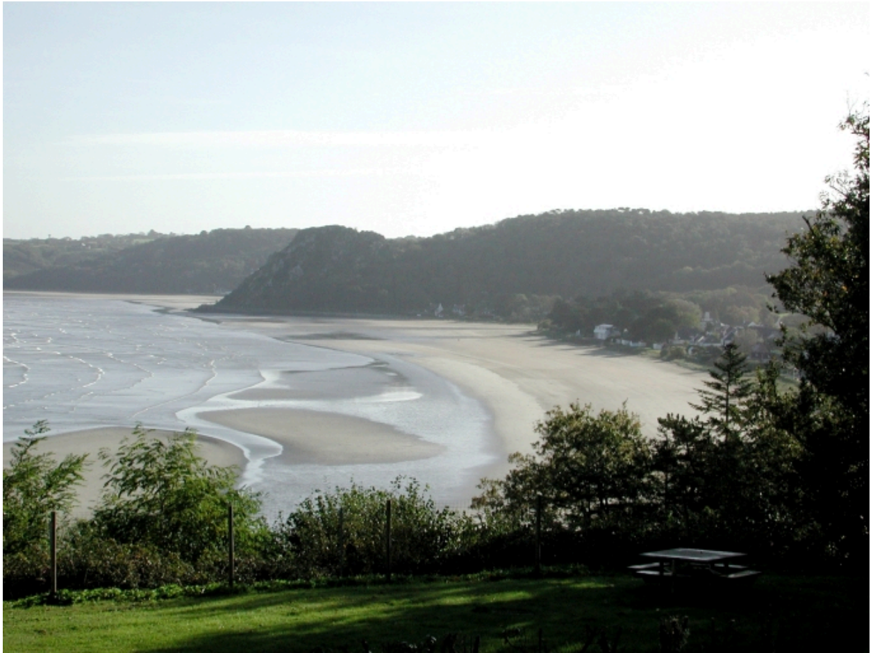
Vue générale de la plage de Saint-Efflam depuis le manoir de Kerallic