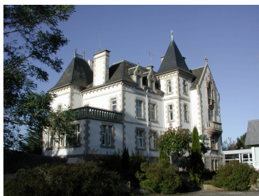
Vue générale (façade postérieure) IVR53_20042206024NUCA