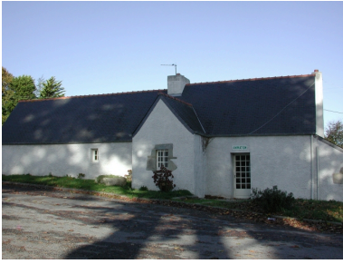
Logement et dépendance IVR53_20042206025NUCA