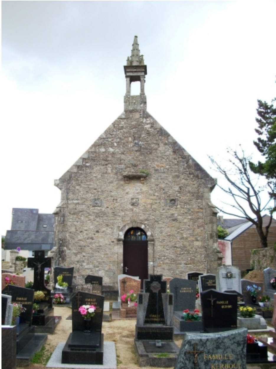
Gouesnou, chapelle Sainte-Anne : élévation ouest