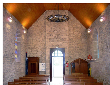
Gouesnou, chapelle Sainte- Anne : vue axiale ouest IVR53_20082906200NUCA