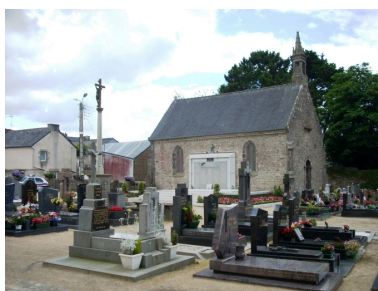
Gouesnou, chapelle Sainte- Anne : vue générale nord-ouest IVR53_20082906196NUCA