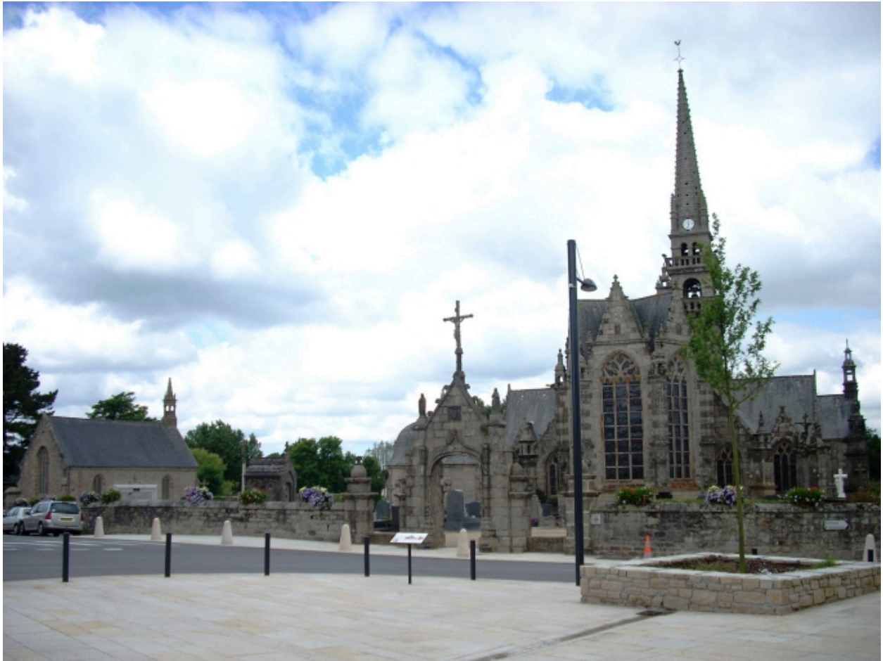
Gouesnou, chapelle Sainte-Anne : vue de situation de la chapelle dans l'enclos depuis le nord-est