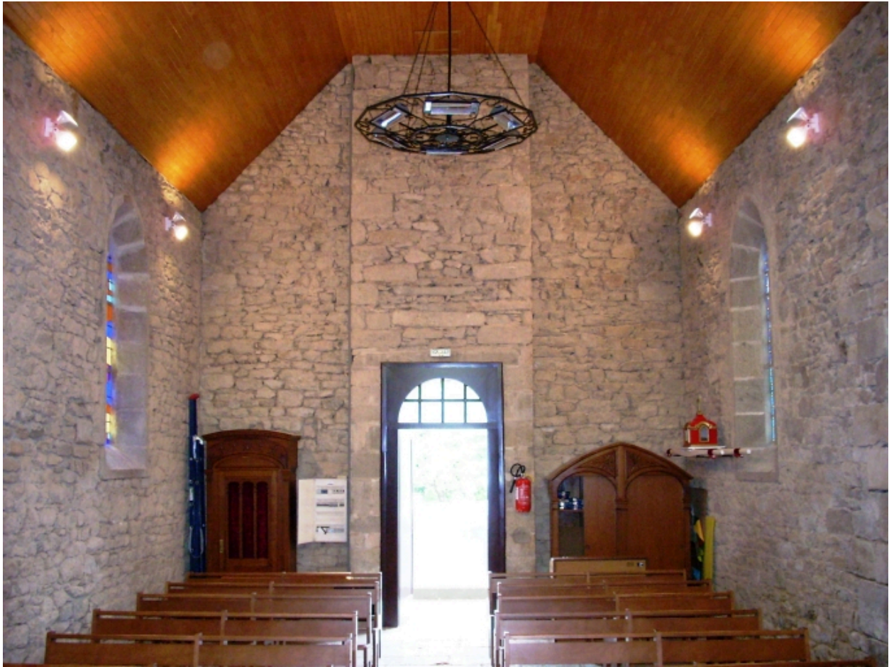
Gouesnou, chapelle Sainte-Anne : vue axiale ouest