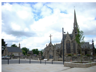
Gouesnou, chapelle Sainte-Anne : vue de situation de la chapelle dans l'enclos depuis le nord-est