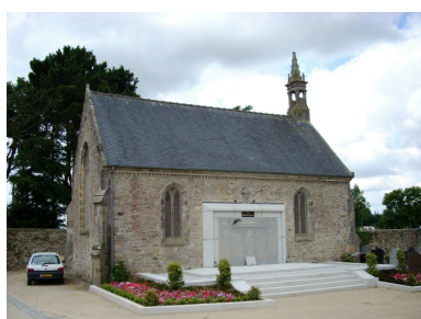
Gouesnou, chapelle Sainte- Anne : vue générale nord-est IVR53_20082906198NUCA