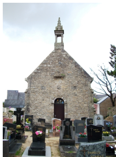
Gouesnou, chapelle Sainte- Anne : élévation ouest IVR53_20082906197NUCA