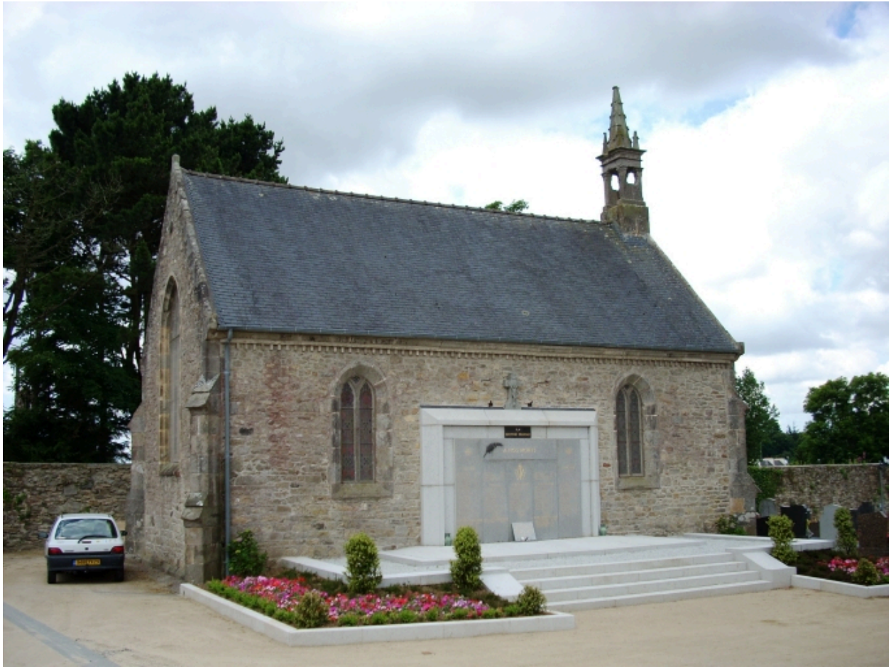
Gouesnou, chapelle Sainte-Anne : vue générale nord-est