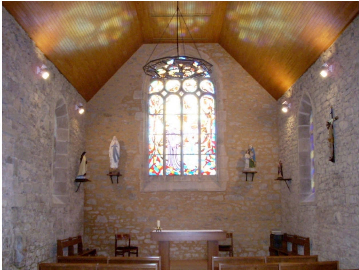
Gouesnou, chapelle Sainte-Anne : vue axiale est