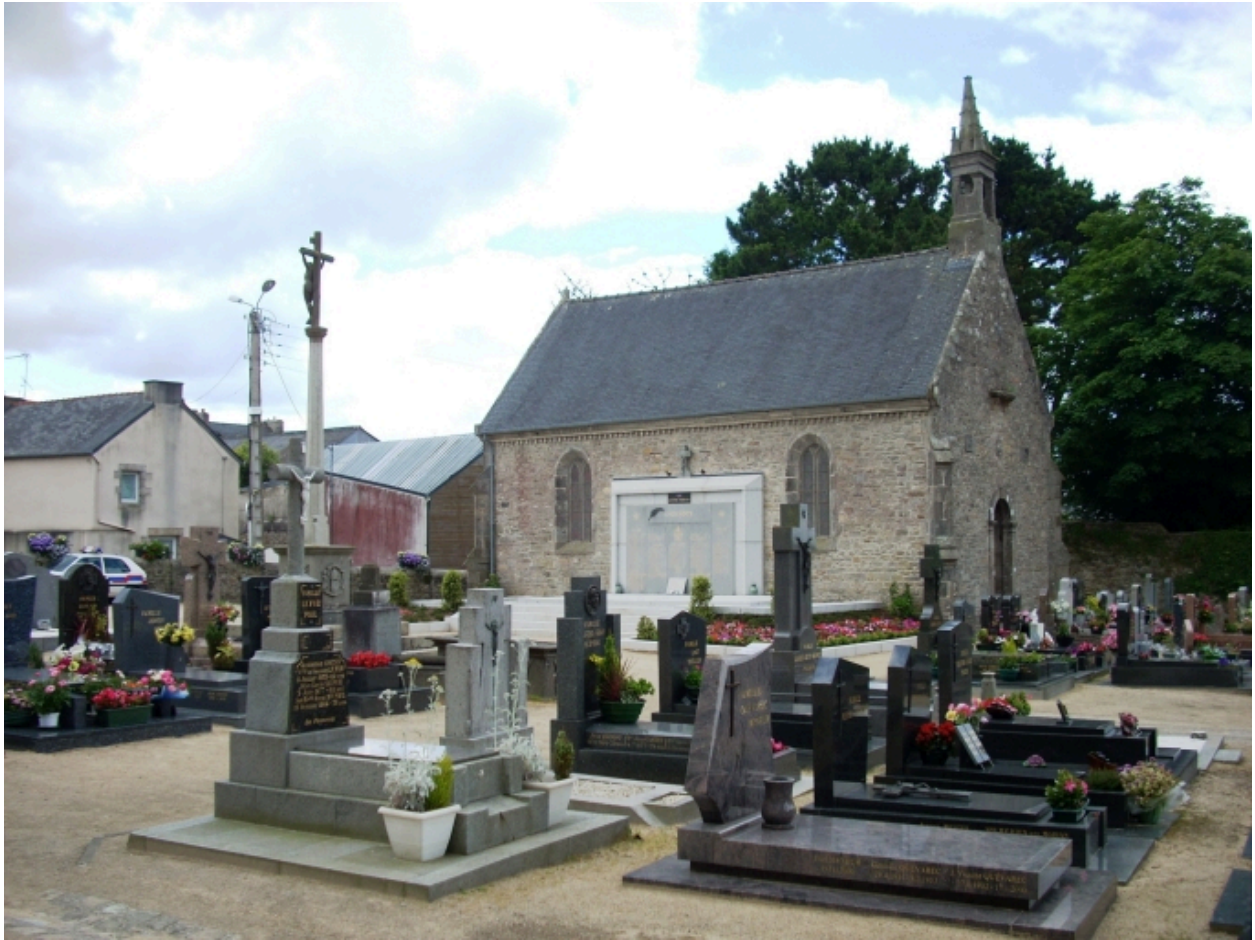
Gouesnou, chapelle Sainte-Anne : vue générale nord-ouest