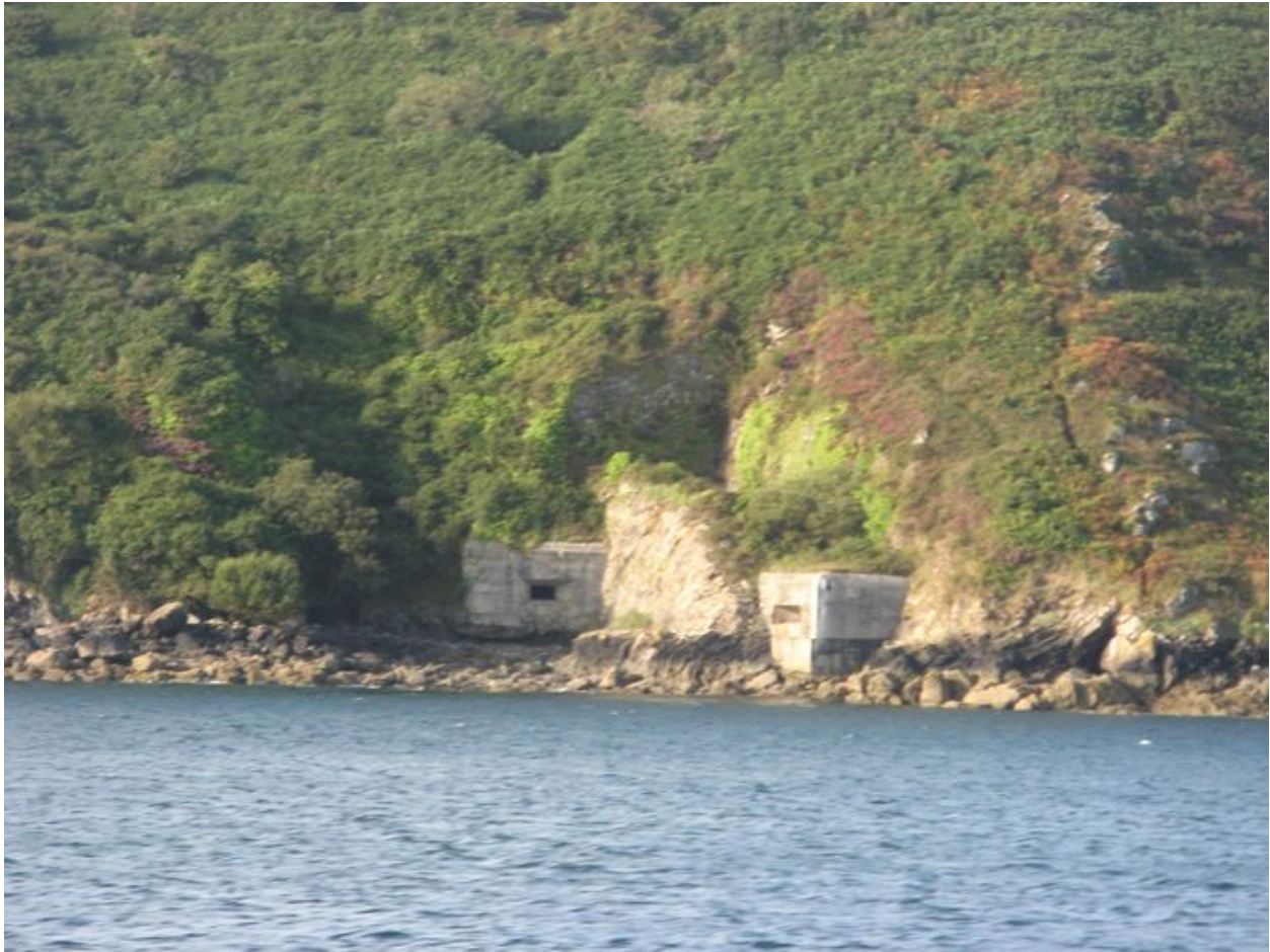
Batterie de rupture de Pourjoint depuis la mer