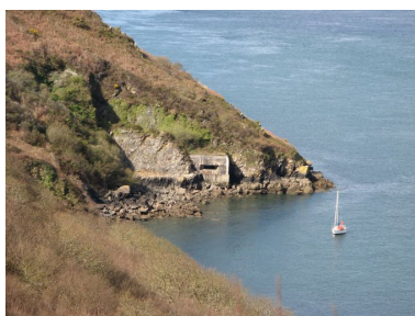
Situation de la batterie de rupture de Pourjoint