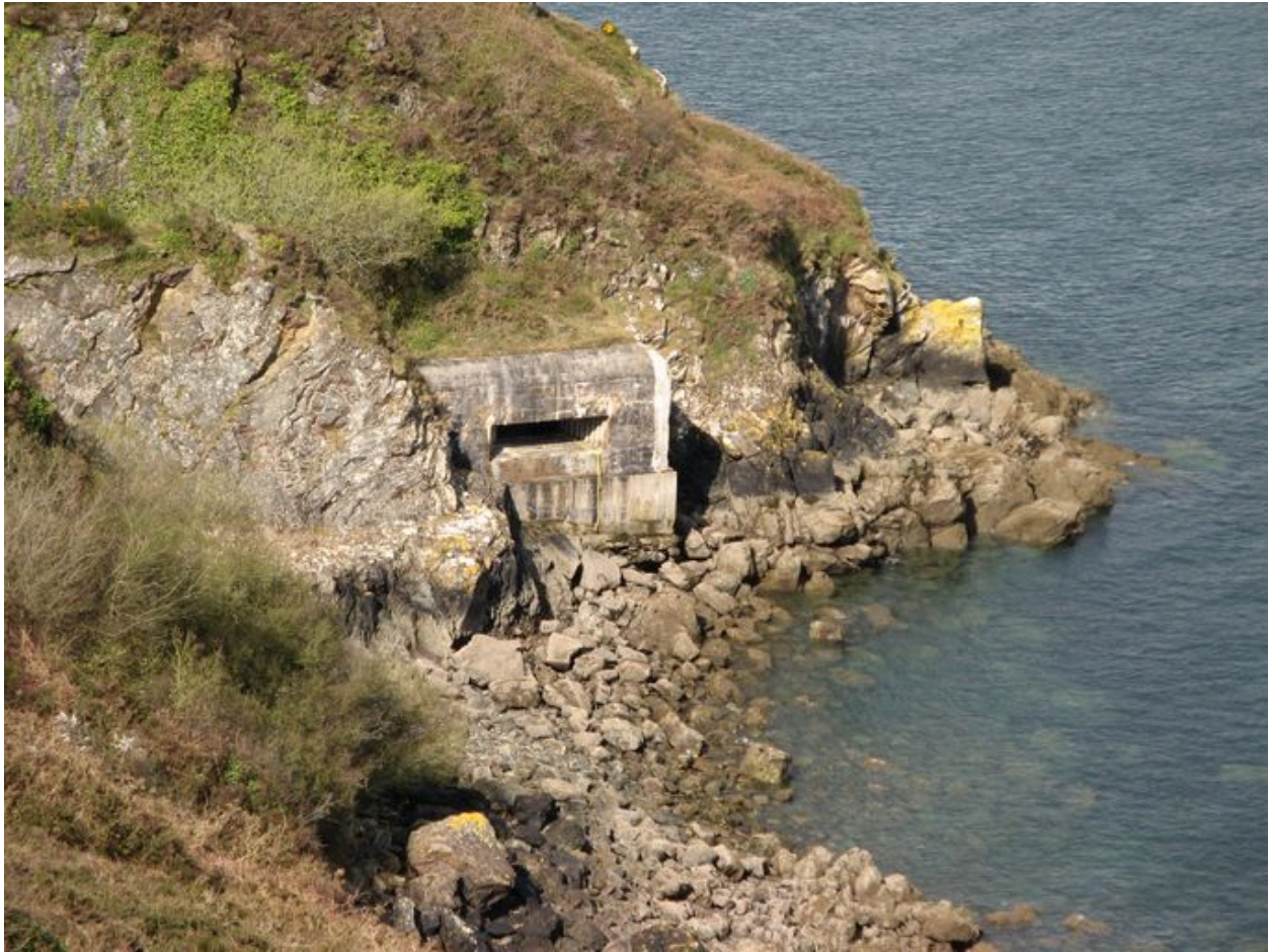
Vue générale de la batterie de rupture de Pourjoint