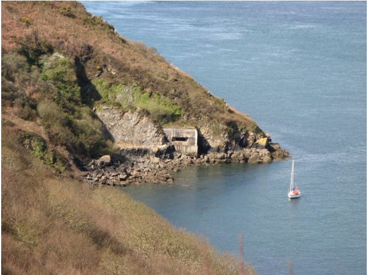
Situation de la batterie de rupture de Pourjoint