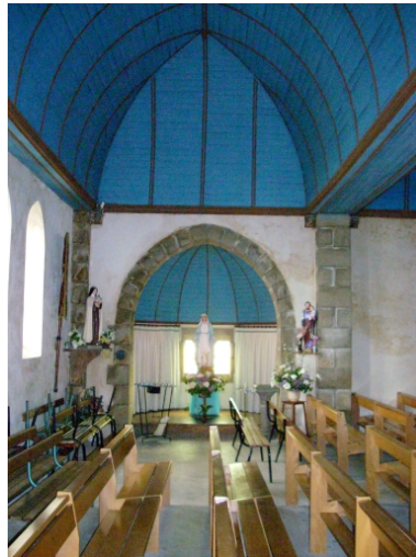
Plouhinec, église paroissiale de Poulgoazec : chapelle des fonts baptismaux IVR53_20082905767NUCA