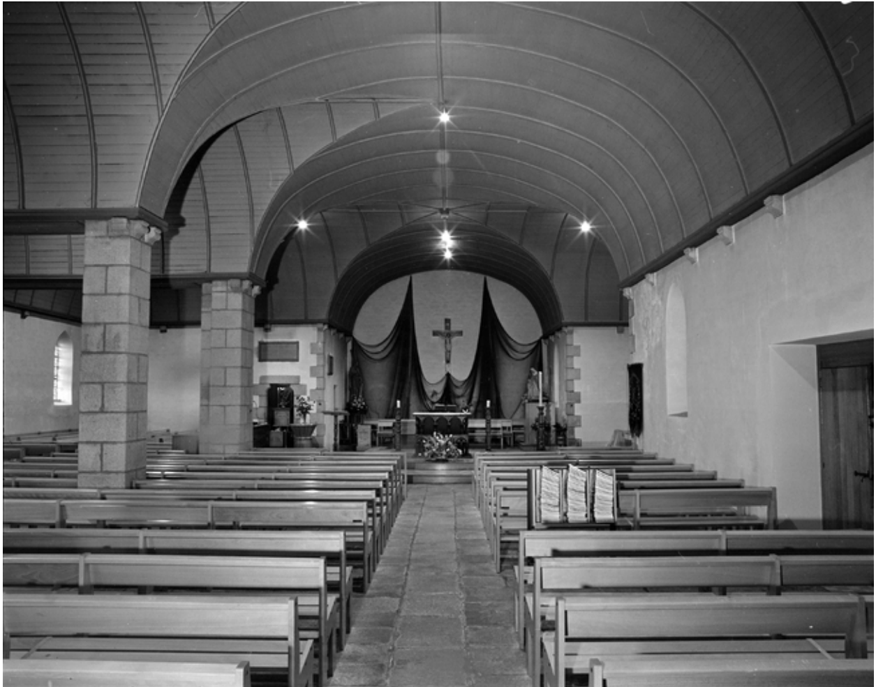
Plouhinec, église paroissiale de Poulgoazec : vue intérieure ouest-est, état en 1983