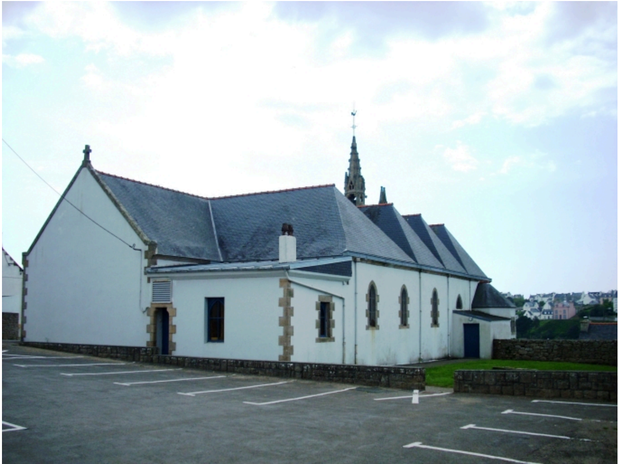
Plouhinec, église paroissiale de Poulgoazec : vue générale nord-est