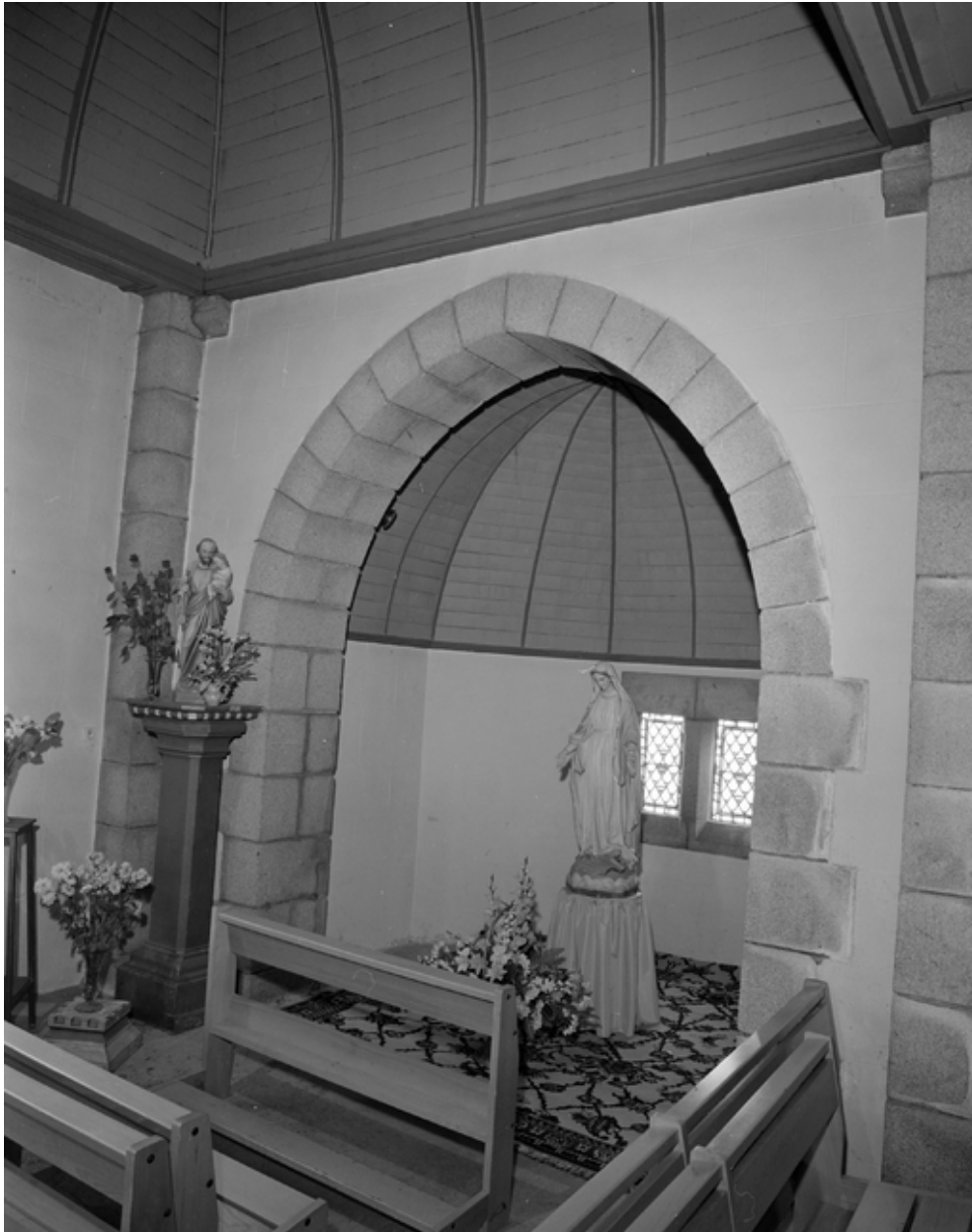
Plouhinec, église paroissiale de Poulgoazec : Chapelle des fonts, vue nord, état en 1983