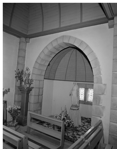
Plouhinec, église paroissiale de Poulgoazec : Chapelle des fonts, vue nord, état en 1983