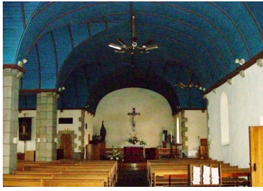
Plouhinec, église paroissiale de Poulgoazec : vue axiale est IVR53_20082905763NUCA