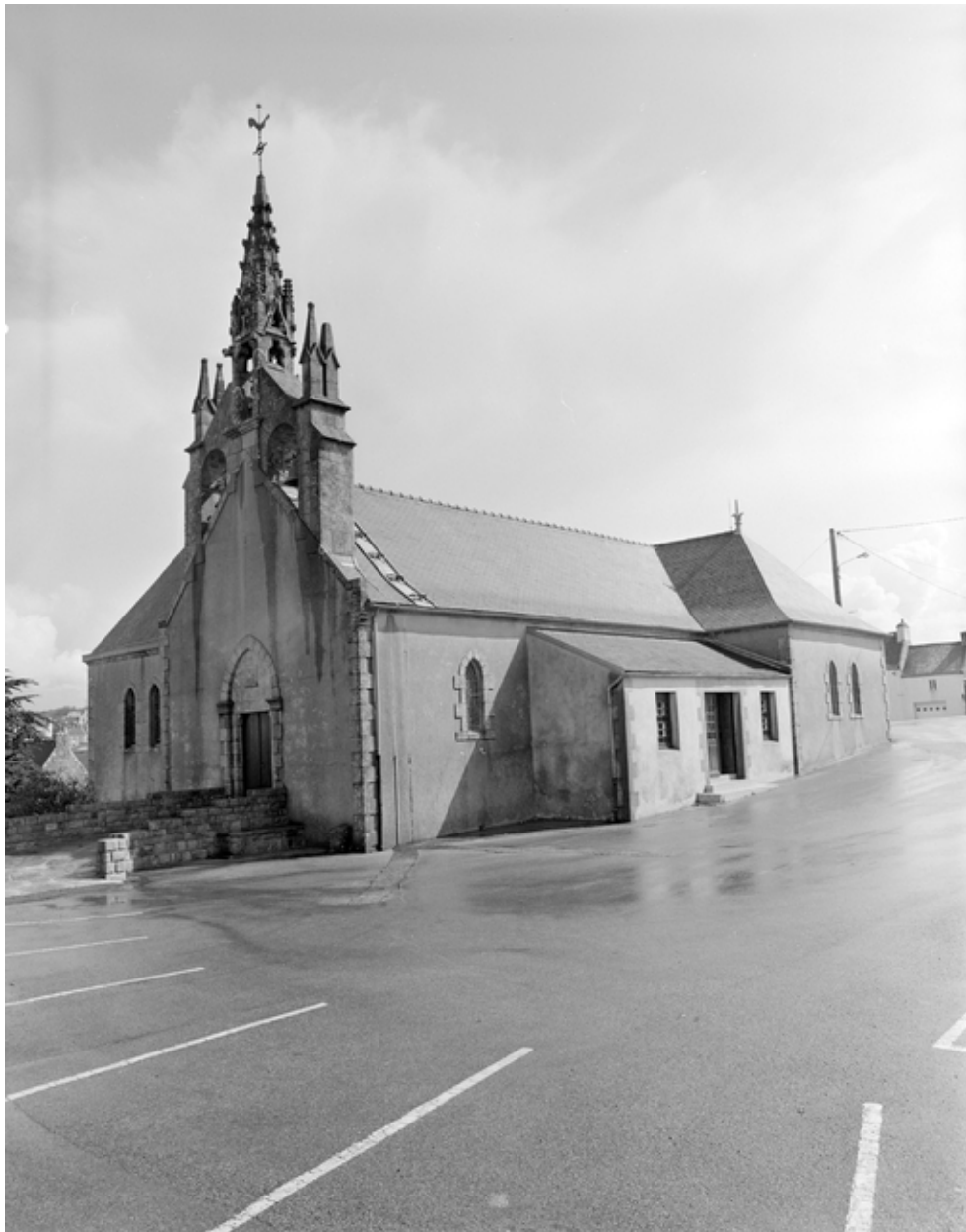
Plouhinec, église paroissiale de Poulgoazec : vue générale sud-ouest, état en 1983