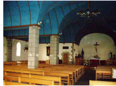
Plouhinec, église paroissiale de Poulgoazec : vue transversale nord-est IVR53_20082905765NUCA