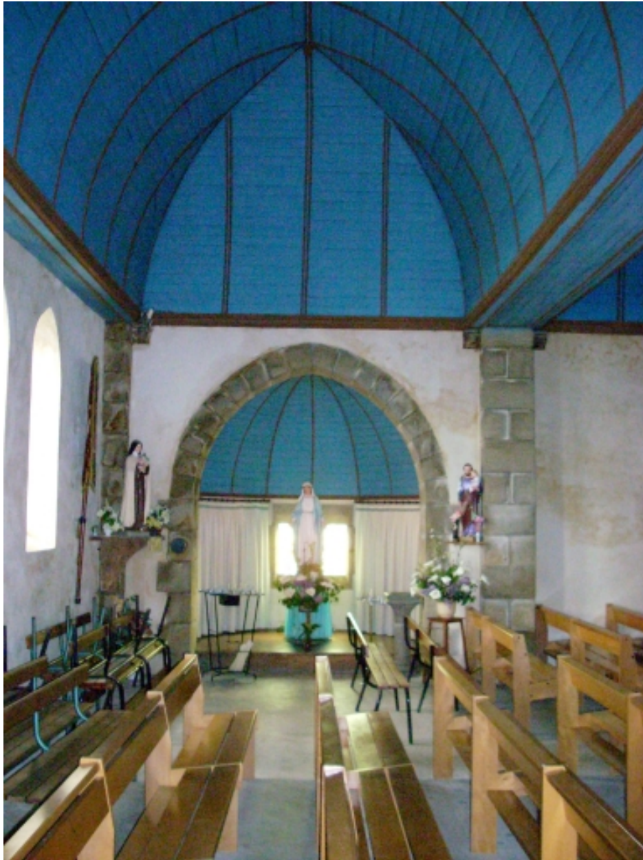
Plouhinec, église paroissiale de Poulgoazec : chapelle des fonts baptismaux