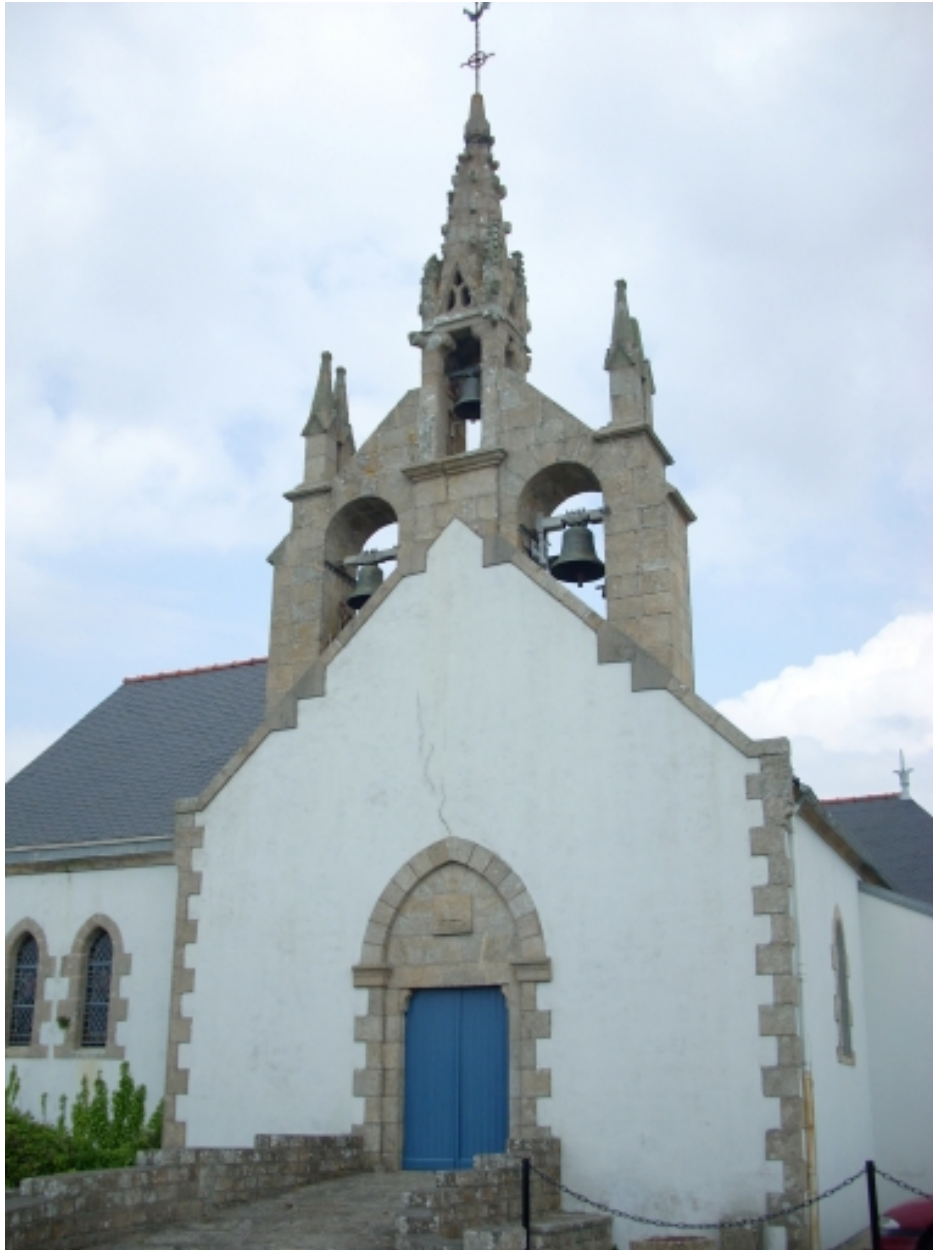
Plouhinec, église paroissiale de Poulgoazec : vue générale sud-ouest