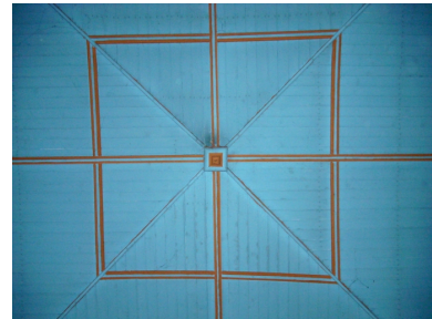
Plouhinec, église paroissiale de Poulgoazec : détail lambris de couverture IVR53_20082905768NUCA