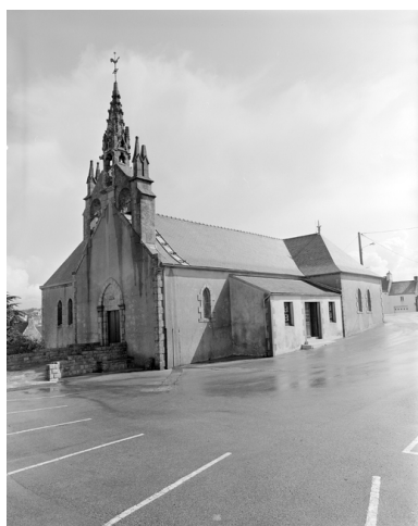
Plouhinec, église paroissiale de Poulgoazec : vue générale sud-ouest, état en 1983 IVR53_19832900960X