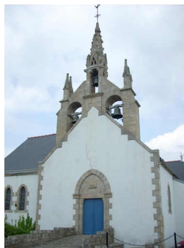
Plouhinec, église paroissiale de Poulgoazec : vue générale sud-ouest IVR53_20082905762NUCA