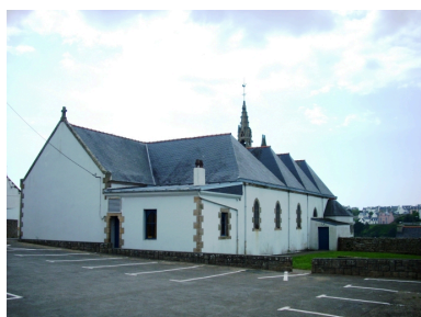
Plouhinec, église paroissiale de Poulgoazec : vue générale nord-est