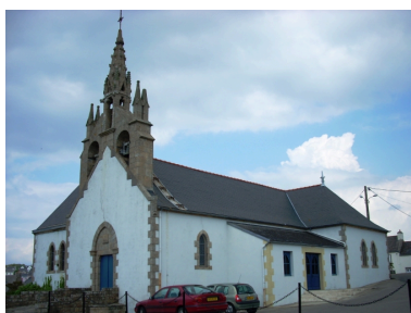
Plouhinec, église paroissiale de Poulgoazec : vue générale sud-ouest IVR53_20082905761NUCA