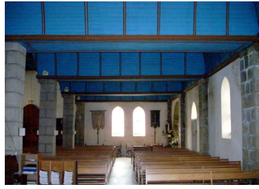
Plouhinec, église paroissiale de Poulgoazec : bas-côté nord vue axiale ouest IVR53_20082905764NUCA