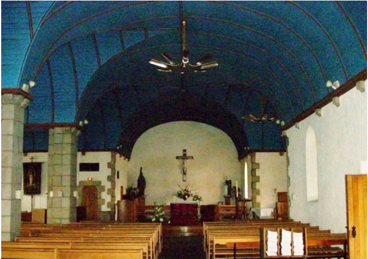
Plouhinec, église paroissiale de Poulgoazec : vue axiale est