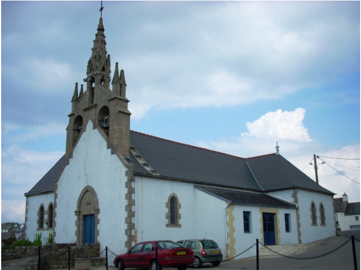
Plouhinec, église paroissiale de Poulgoazec : vue générale sud-ouest