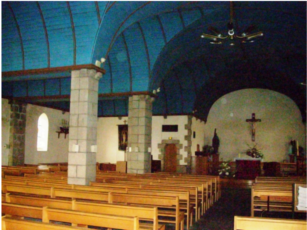
Plouhinec, église paroissiale de Poulgoazec : vue transversale nord-est