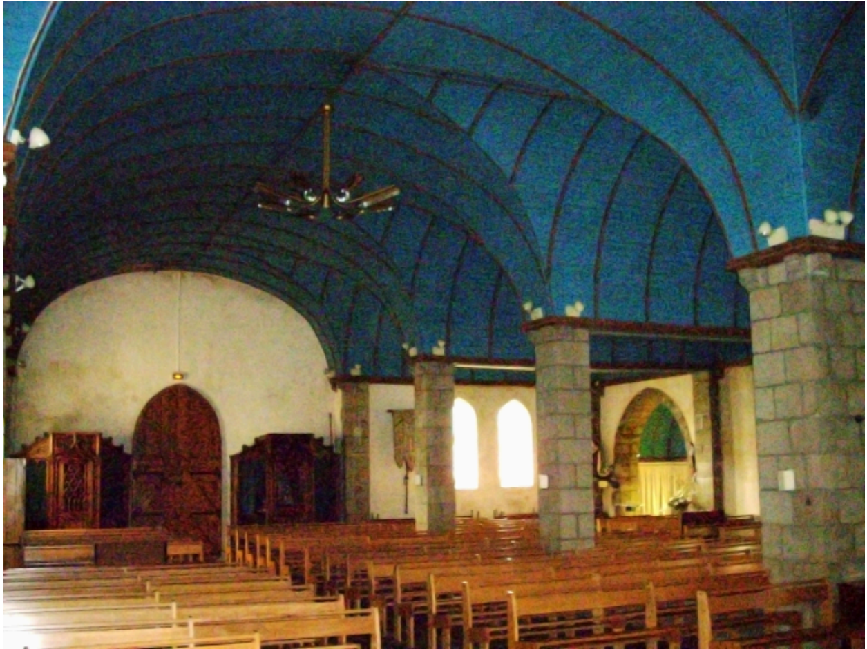
Plouhinec, église paroissiale de Poulgoazec : vue transversale nord-ouest