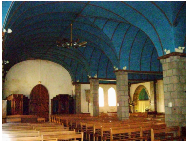
Plouhinec, église paroissiale de Poulgoazec : vue transversale nord-ouest IVR53_20082905766NUCA