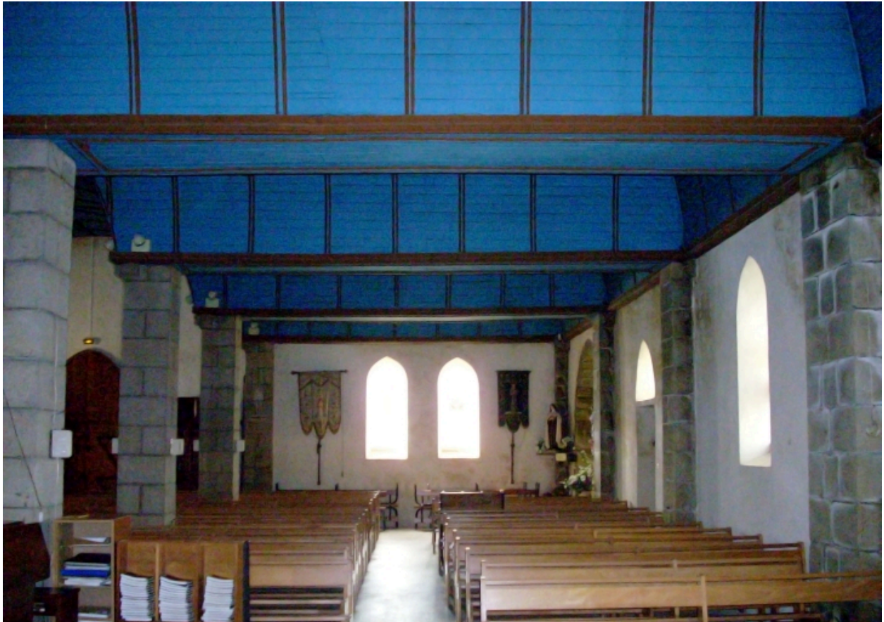
Plouhinec, église paroissiale de Poulgoazec : bas-côté nord vue axiale ouest