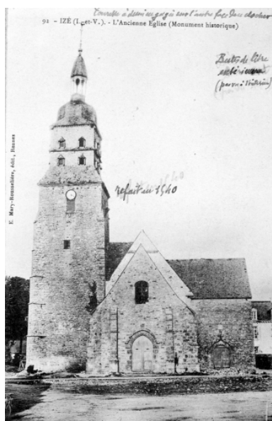
Carte postale ancienne - Ancienne église, élévation ouest : vue générale. IVR53_19933500938X