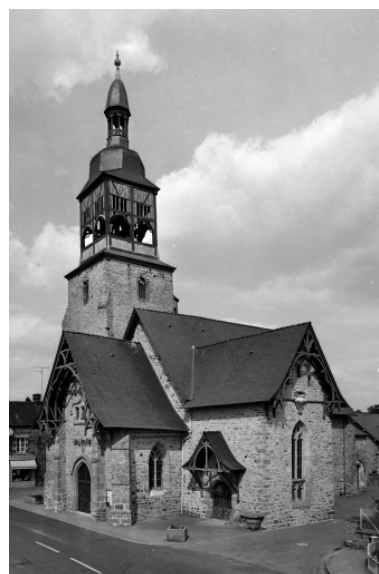
Ancienne église, actuellement mairie, élévation sud-ouest. IVR53_19973502119V