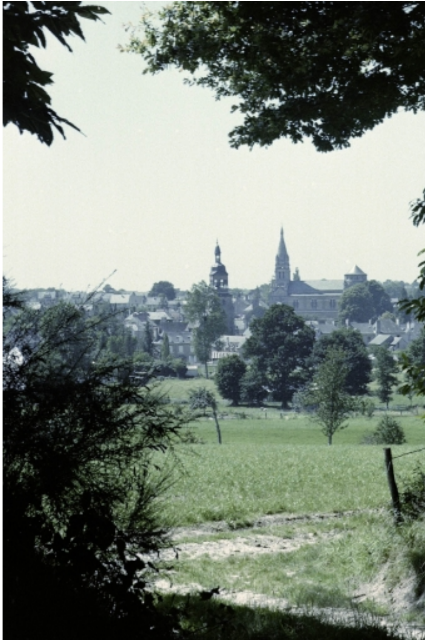
Vue de situation du bourg, prise du sud-est.