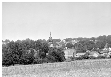
Vue de situation du bourg, et de l'ancienne église.