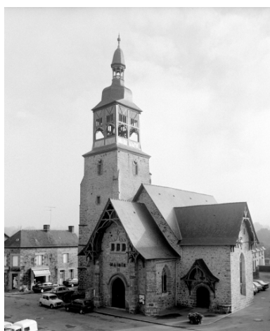
Elévation sud-ouest IVR53_19953500530X