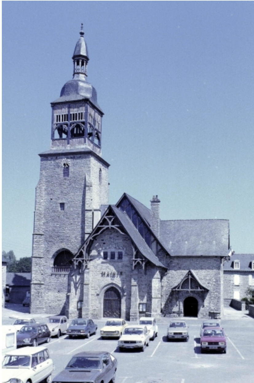
Ancienne église, actuellement mairie, élévation ouest.