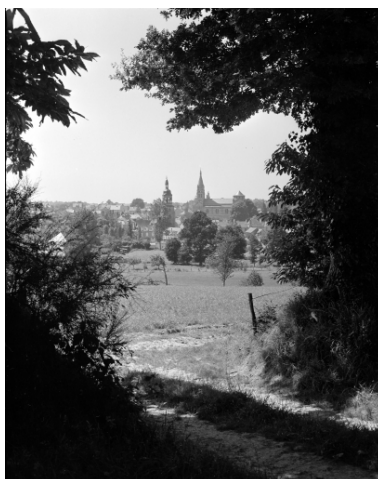
Vue de situation du bourg, prise du sud-est. IVR53_19803500500X