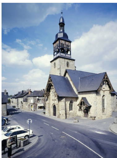
Ancienne église, actuellement mairie, élévation ouest. IVR53_19973502042VA