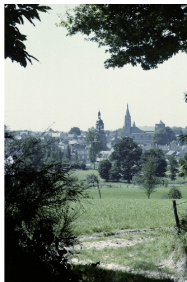
Vue de situation du bourg, prise du sud-est. IVR53_19803500624XE