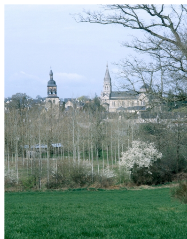
Vue de situation du bourg, et des deux églises.