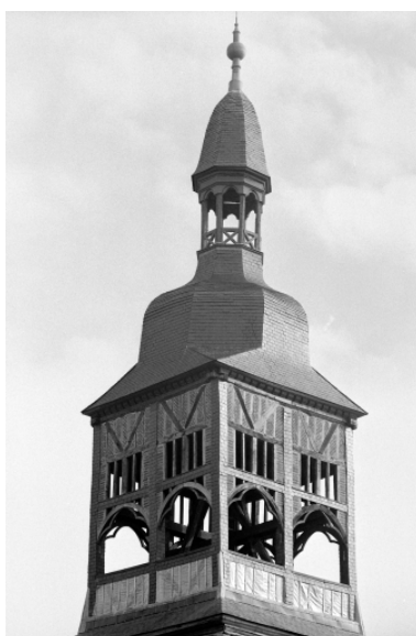
Détail, campanile IVR53_19953500529X