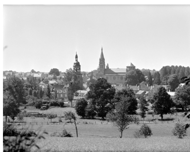
Vue de situation du bourg, et des deux églises.