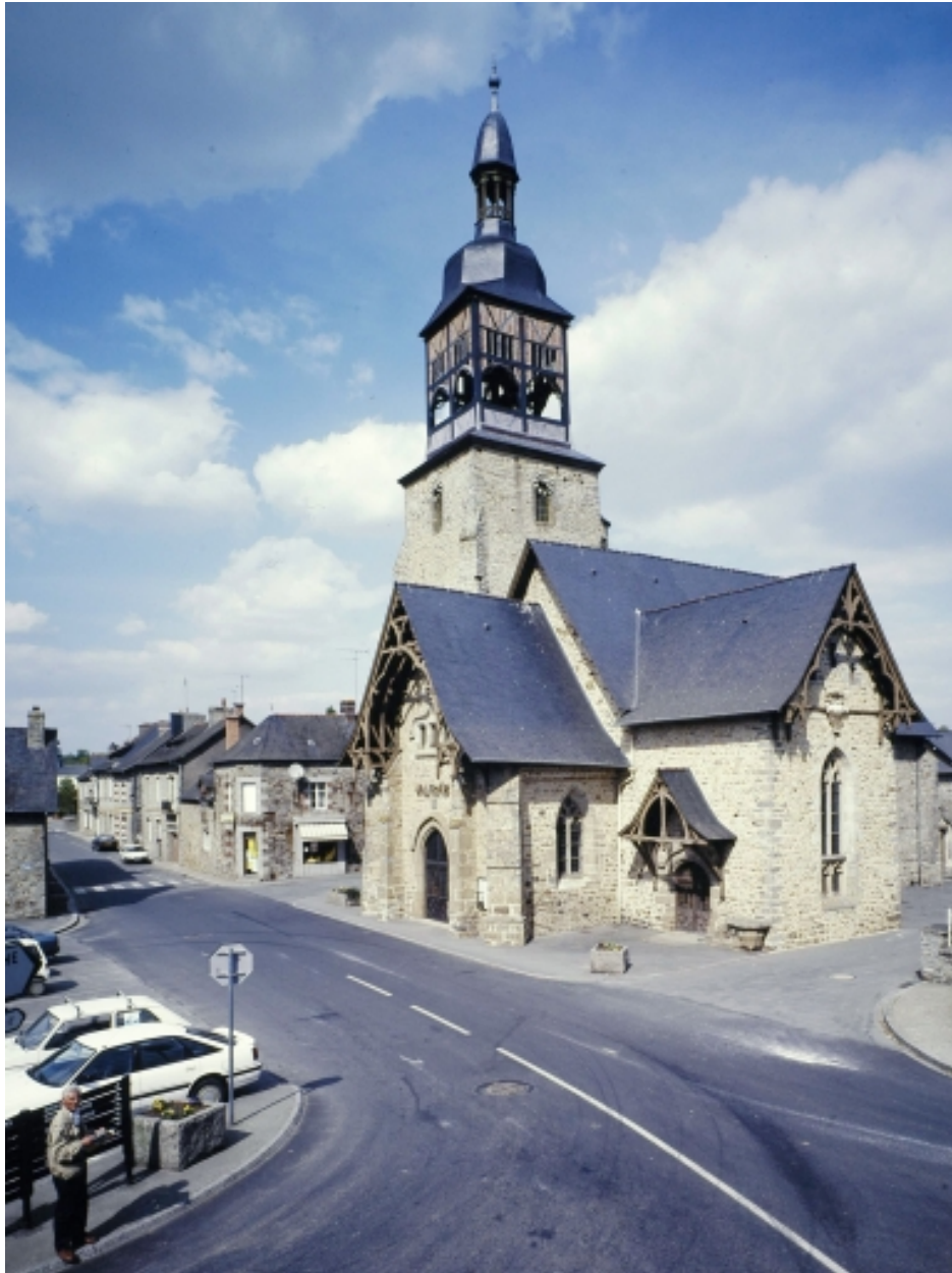
Ancienne église, actuellement mairie, élévation ouest.