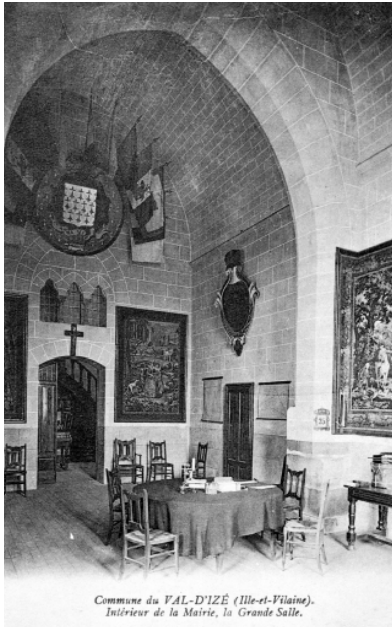
Commune du VAL-D'IZÉ (Ile-et-Vilaine). Intérieur de la Mairie, la Grande Salle.

Carte postale ancienne - Ancienne église, intérieur : vue générale.