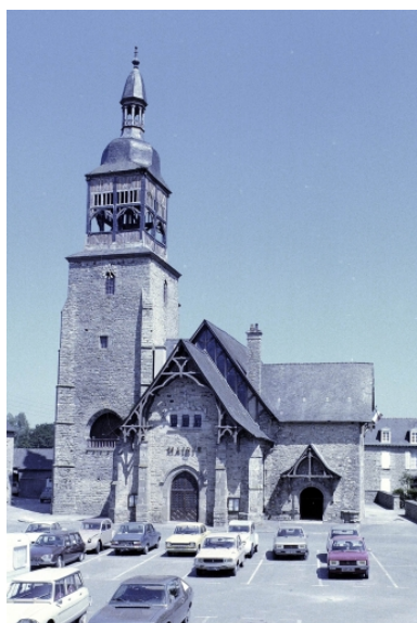
Ancienne église, actuellement mairie, élévation ouest.