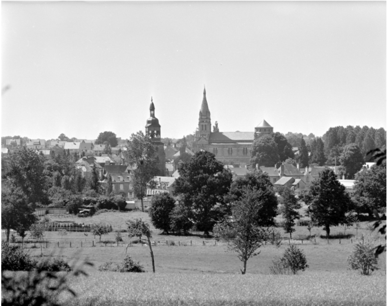
Vue de situation du bourg, et des deux églises.