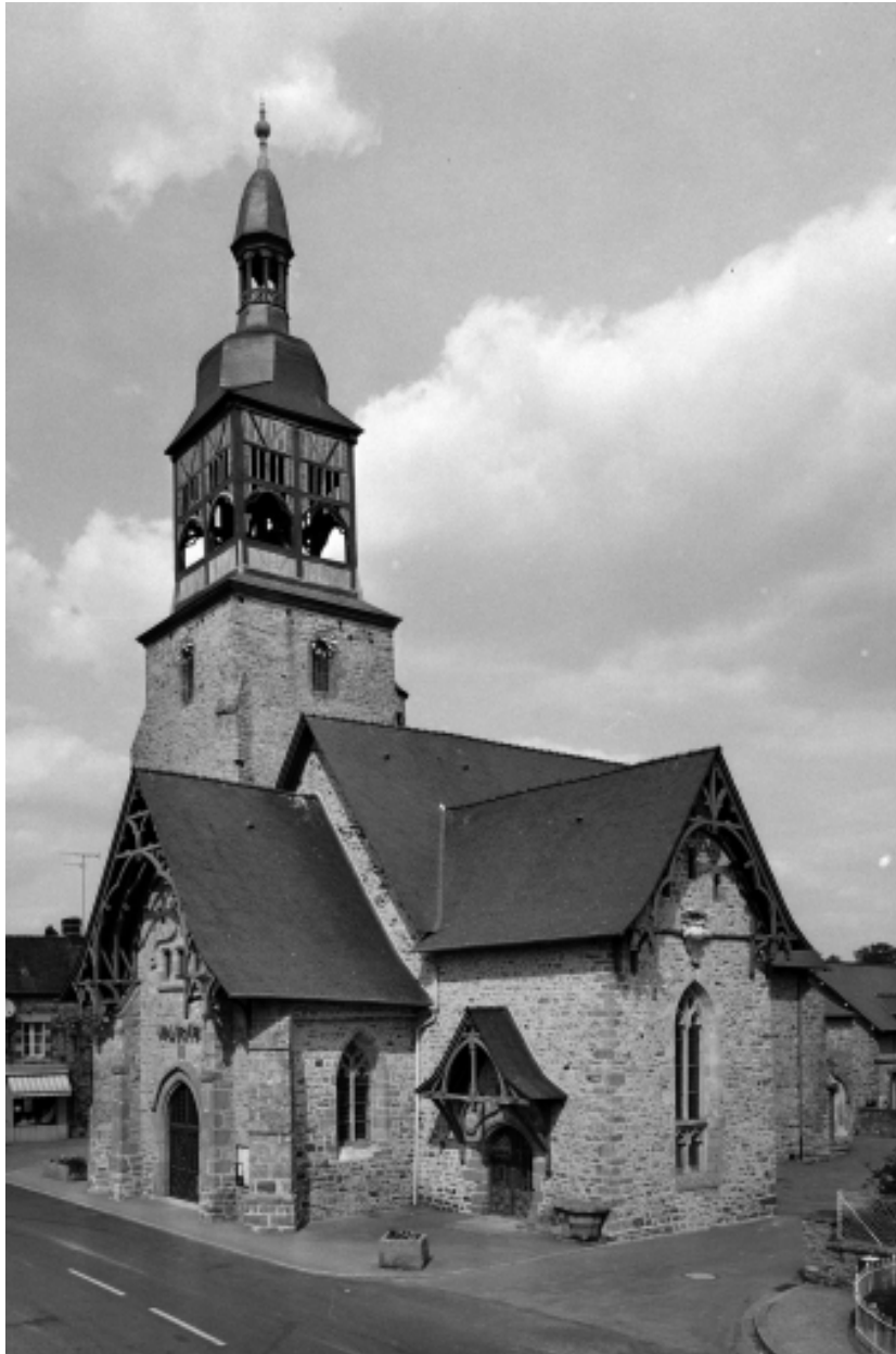
Ancienne église, actuellement mairie, élévation sud-ouest.