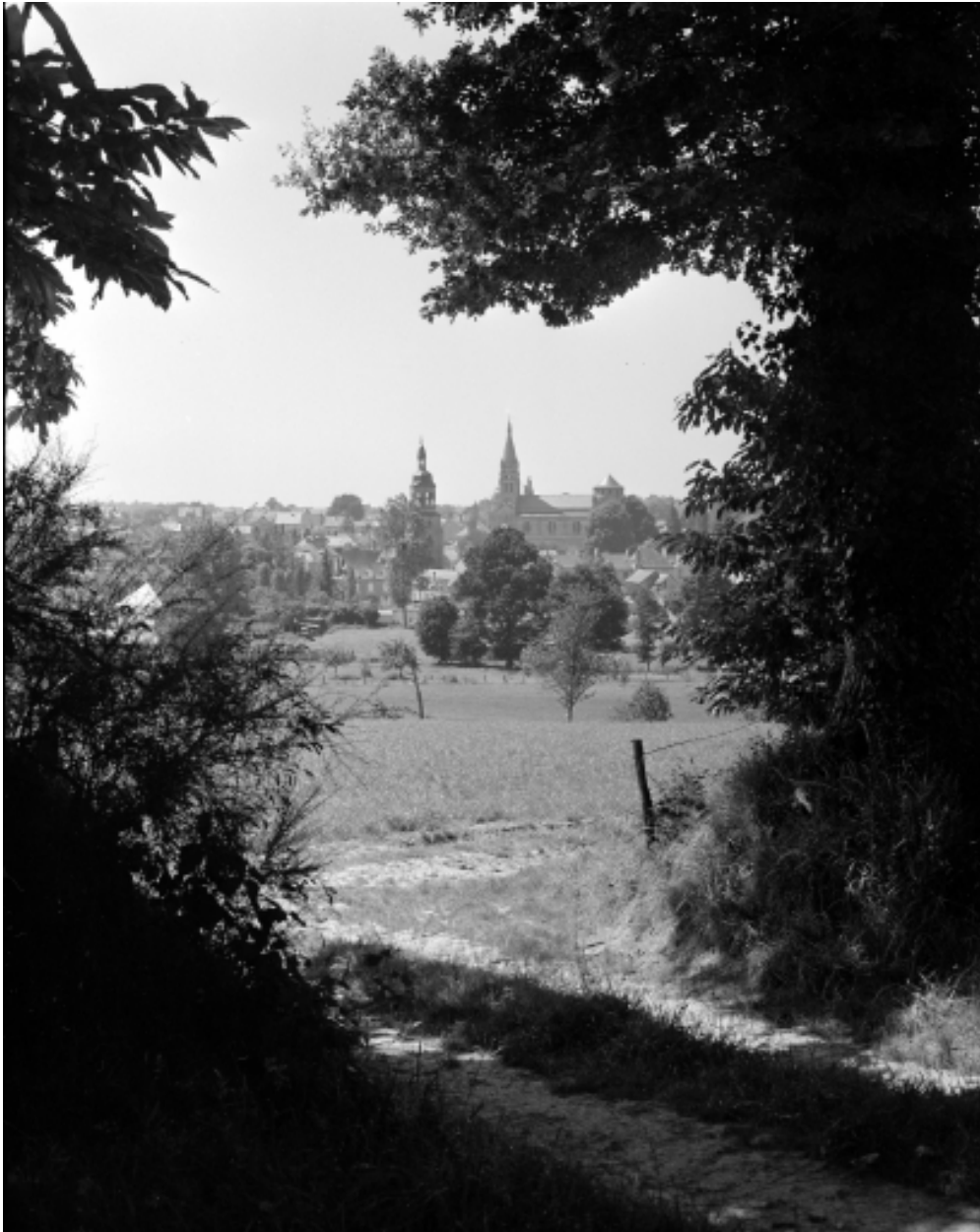
Vue de situation du bourg, prise du sud-est.