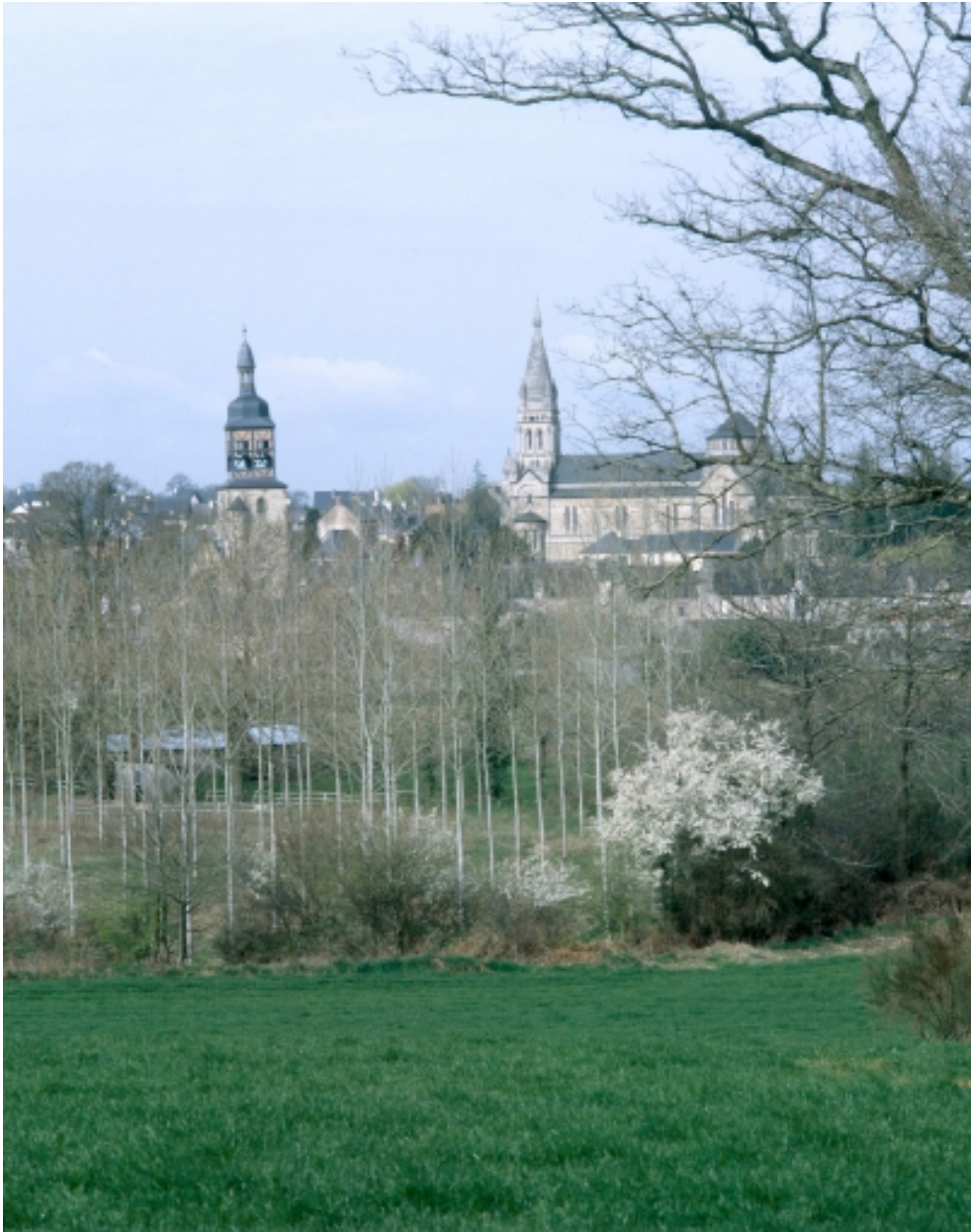
Vue de situation du bourg, et des deux églises.