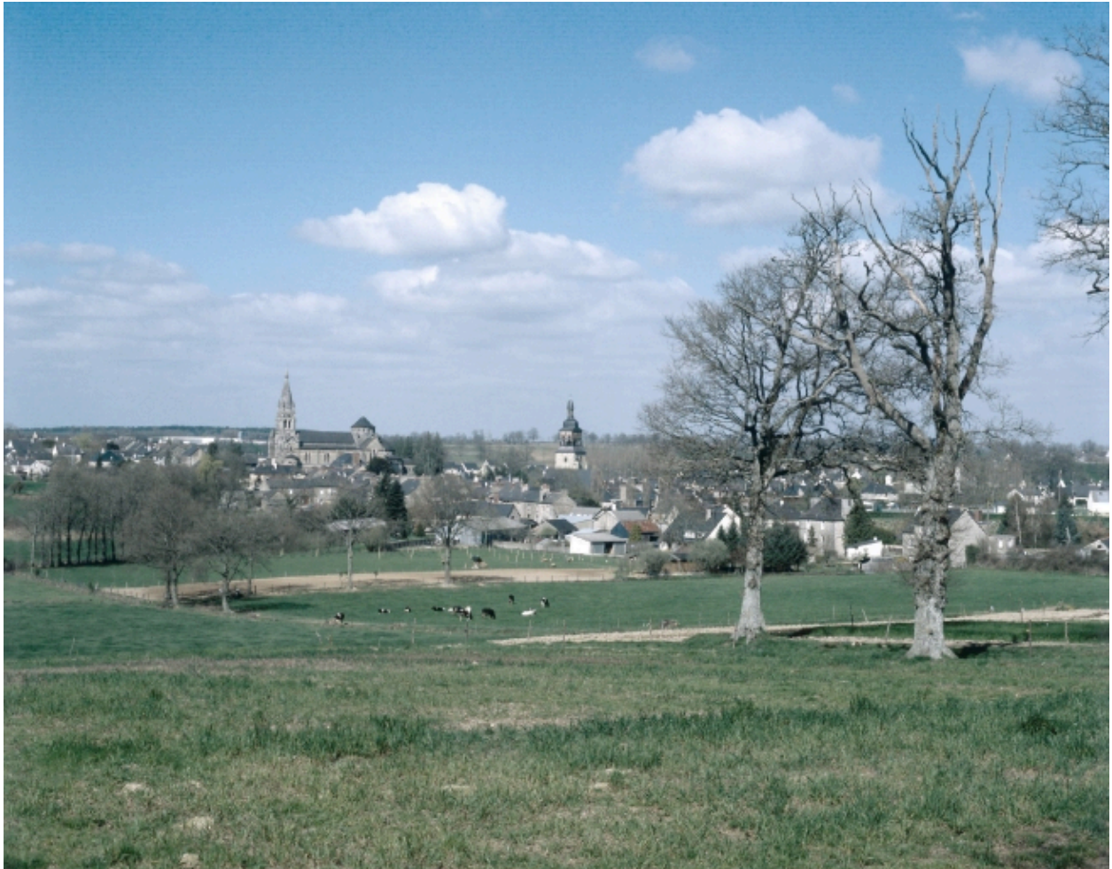
Vue de situation du bourg, et des deux églises.