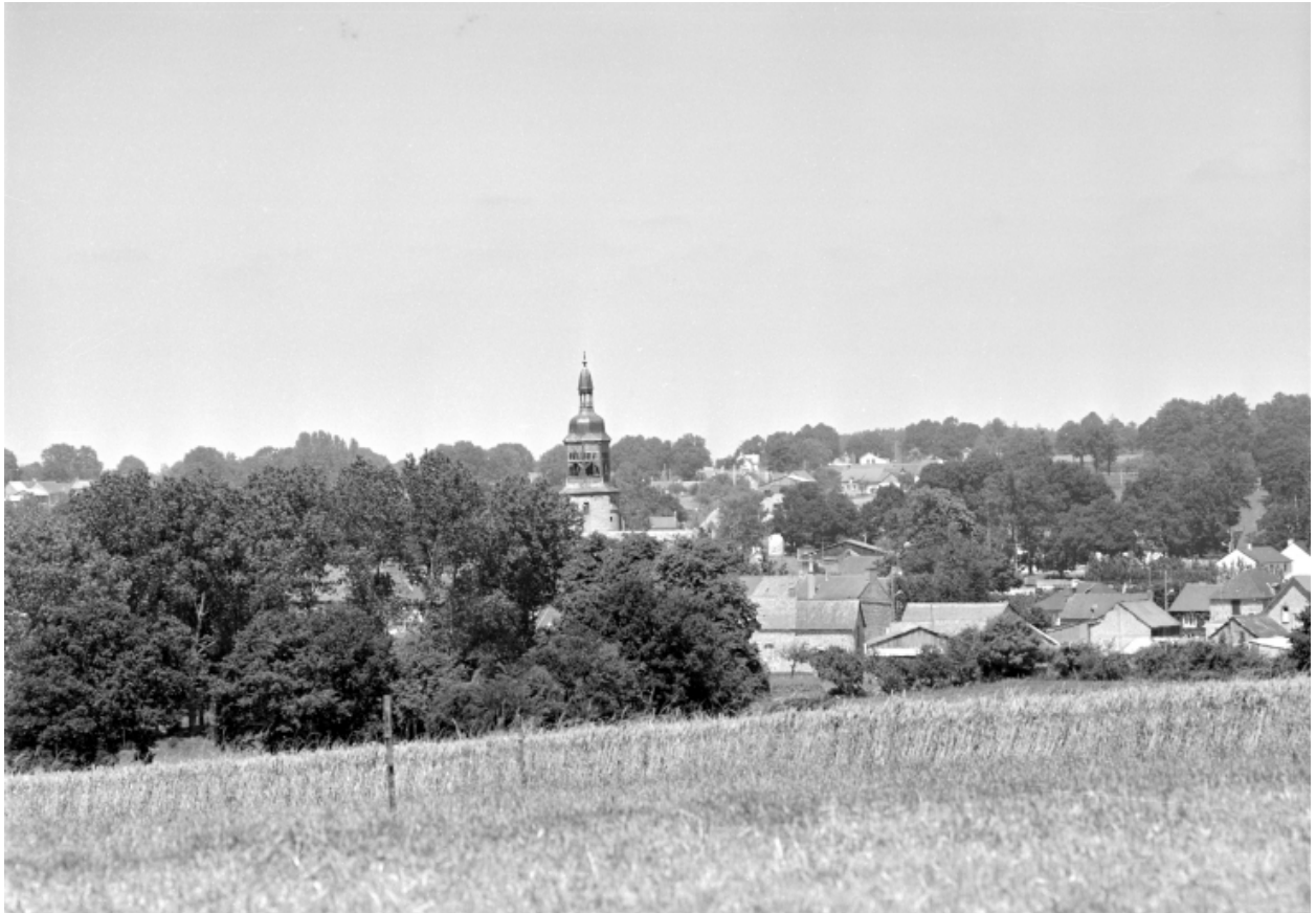
Vue de situation du bourg, et de l'ancienne église.