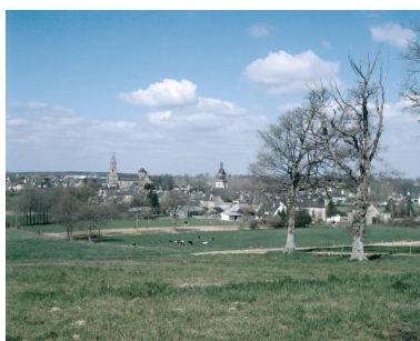
Vue de situation du bourg, et des deux églises.