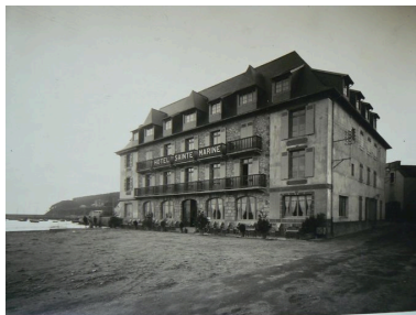
Vue latérale ancienne de l'Hôtel Sainte-Marine, aujourd'hui immeuble Les Flots

Phot. Archives municipales de Brest IVR53_20072908728NUC