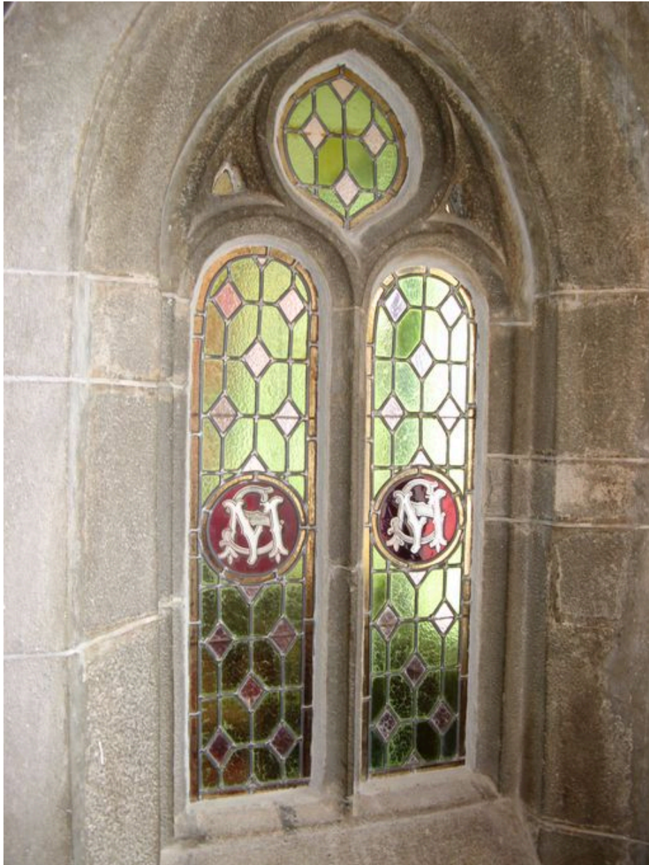
Vitrail de l'ancienne chapelle Sainte-Marine à l'intérieur du restaurant