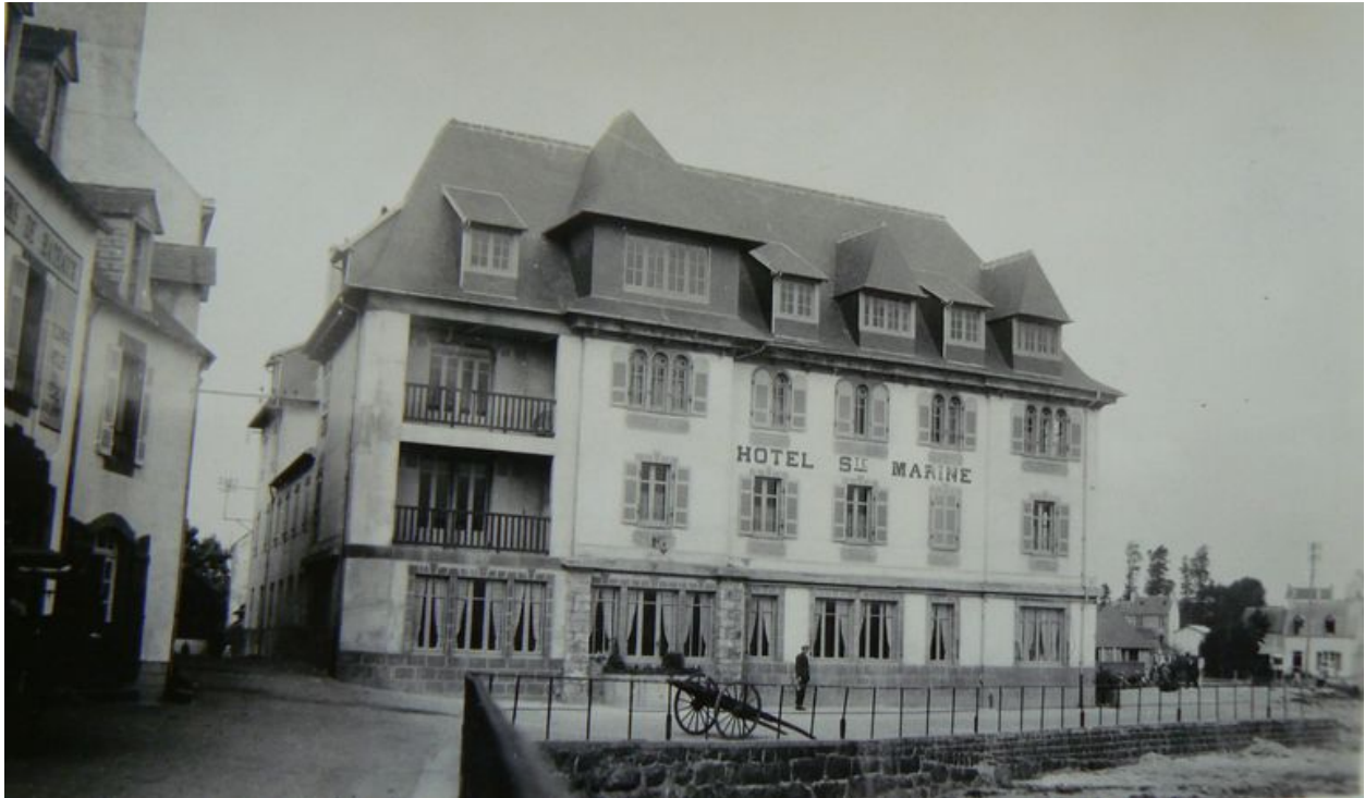
Vue générale ancienne de l'Hôtel Sainte-Marine, aujourd'hui immeuble Les Flots