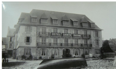
Vue ancienne de l'Hôtel Sainte-Marine, aujourd'hui immeuble Les Flots

IVR53_20072908728NUC