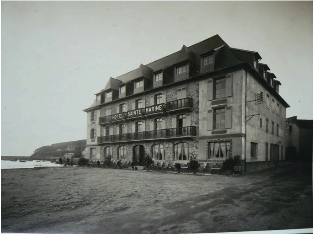
Vue latérale ancienne de l'Hôtel Sainte-Marine, aujourd'hui immeuble Les Flots