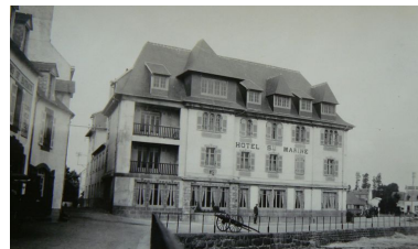
Vue générale ancienne de l'Hôtel Sainte-Marine, aujourd'hui immeuble Les Flots