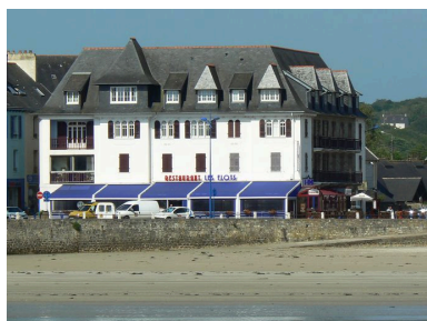
Vue générale de l'ancien Hôtel Sainte-Marine, aujourd'hui immeuble Les Flots IVR53_20072908725NUCA