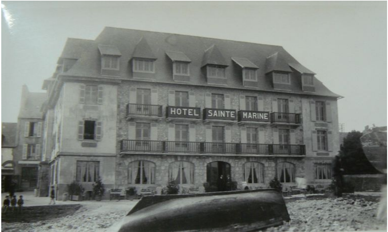
Vue ancienne de l'Hôtel Sainte-Marine, aujourd'hui immeuble Les Flots