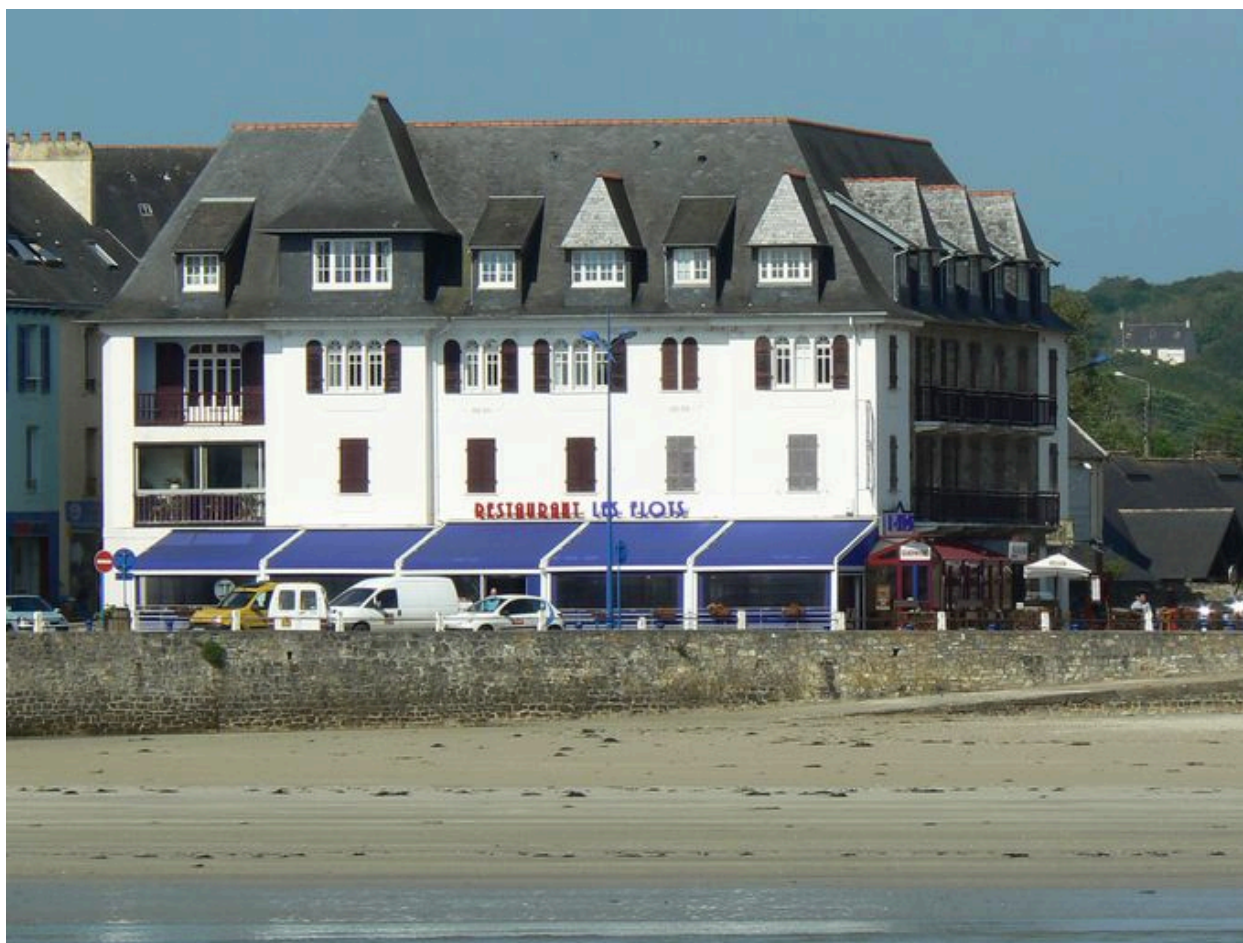
Vue générale de l'ancien Hôtel Sainte-Marine, aujourd'hui immeuble Les Flots