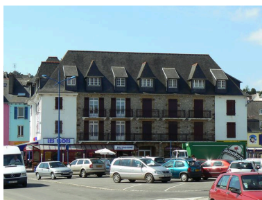
Vue latérale de l'immeuble les Flots, ancien hôtel Sainte-Marine IVR53_20072908724NUCA