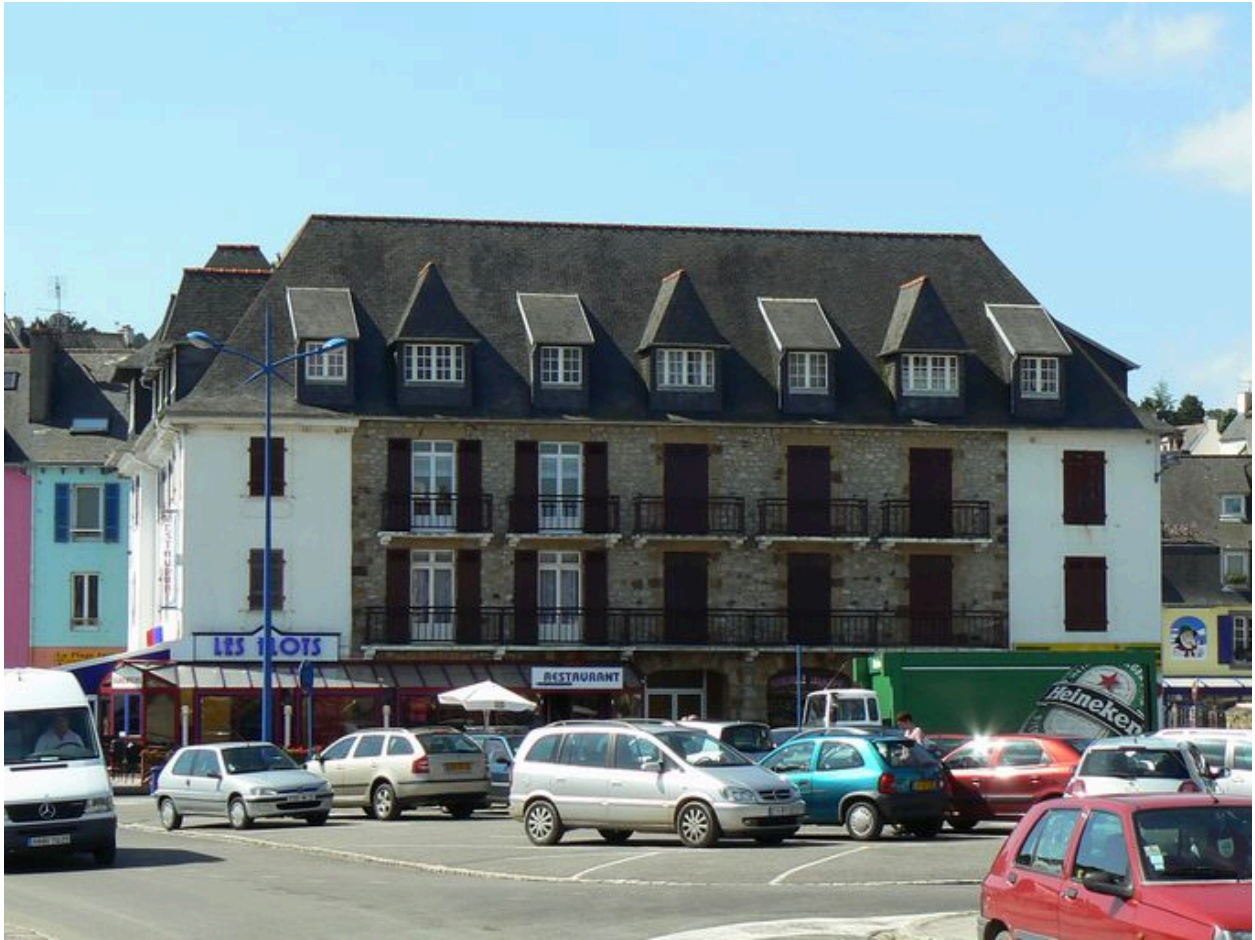
Vue latérale de l'immeuble les Flots, ancien hôtel Sainte-Marine