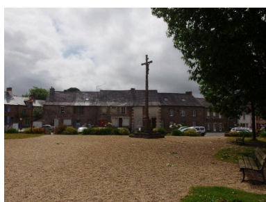
Vue nord du calvaire, place de l'église (Hédé-Bazouges)