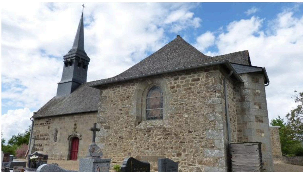
Vue générale sud