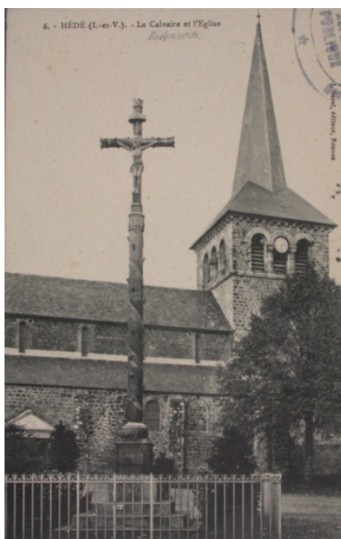
Le calvaire sur une carte postale ancienne IVR53_20053518388NUCA