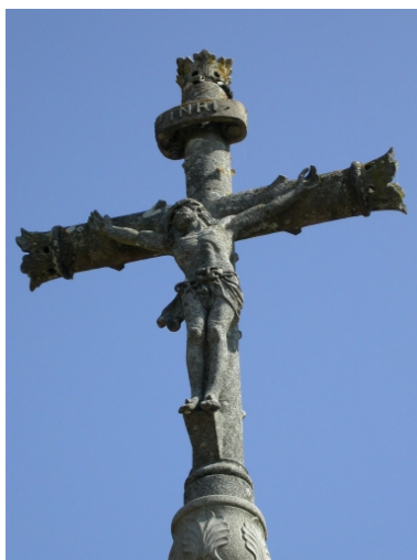
Détail du Christ IVR53_20053518164NUCA