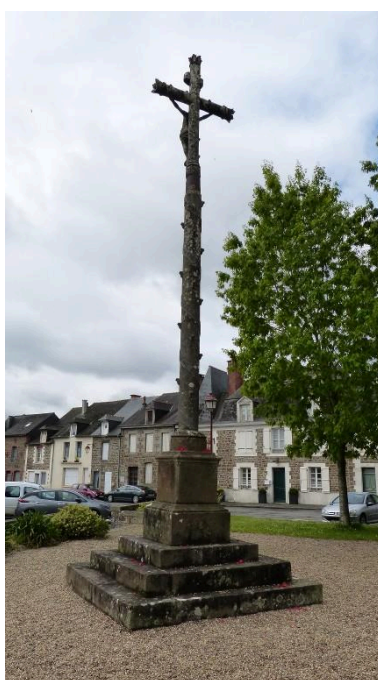
Vue nord est, calvaire, place de l'église (Hédé-Bazouges)