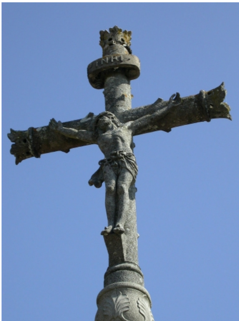
Détail du Christ