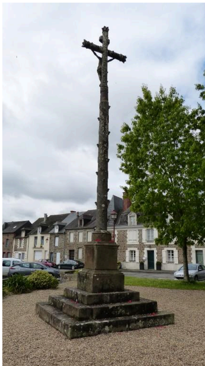
Vue nord est, calvaire, place de l'église (Hédé-Bazouges)