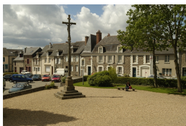
Vue nord-est