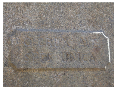
Détail de l'inscription IVR53_20053518188NUCA