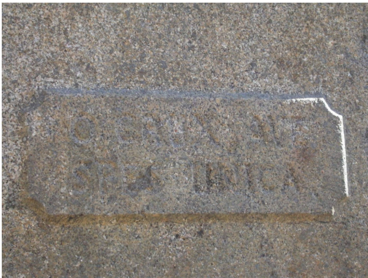
Détail de l'inscription