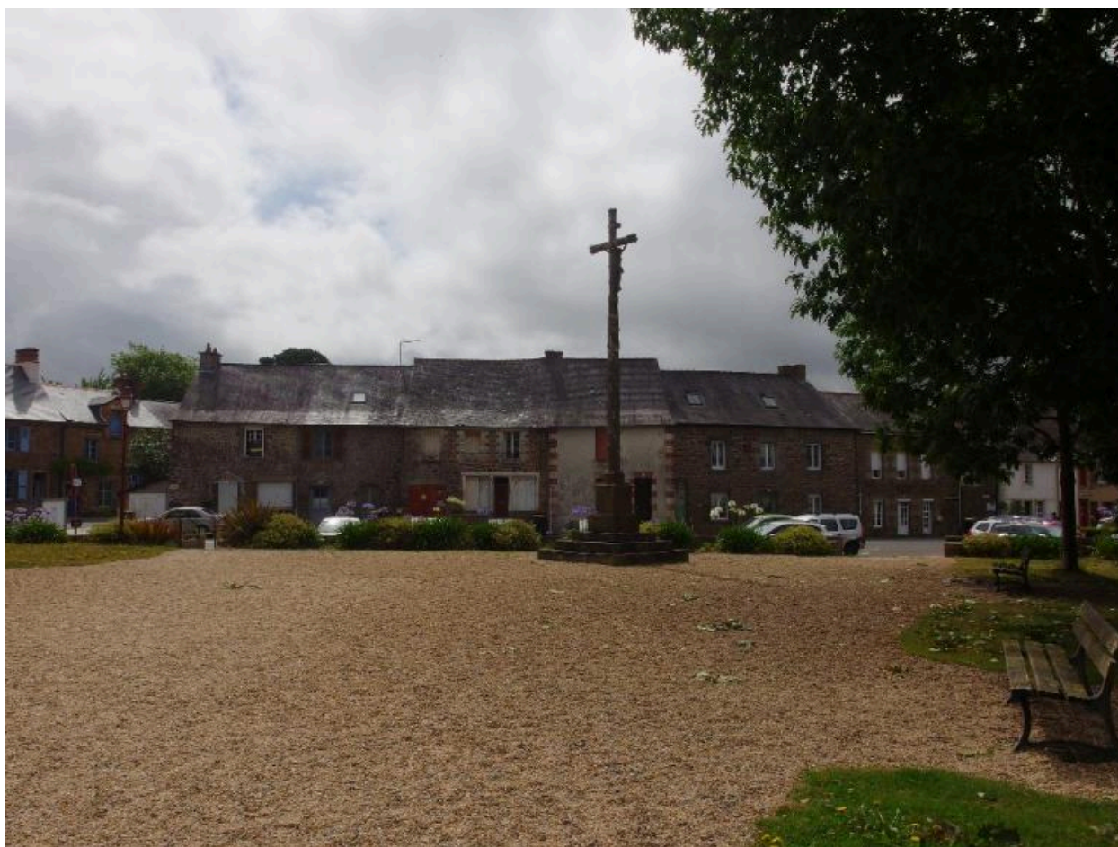
Vue nord du calvaire, place de l'église (Hédé-Bazouges)