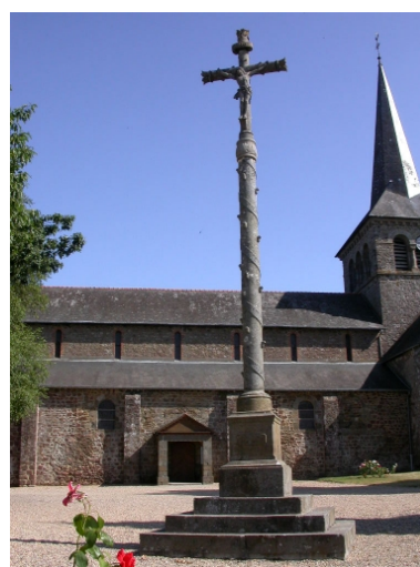
Vue générale IVR53_20053518163NUCA