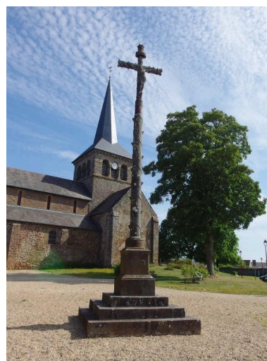
Vue sud du calvaire, place de l'église (Hédé-Bazouges) IVR53_20253510041NUCA