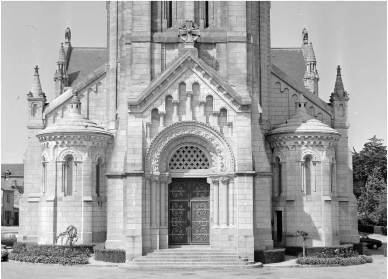
Elévation Sud, partie basse : vue générale