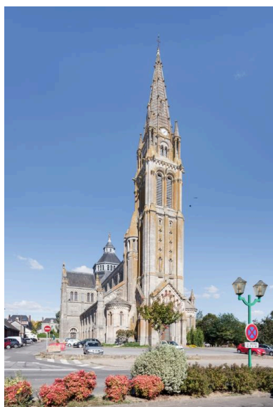
IVR53_20183500341NUCA