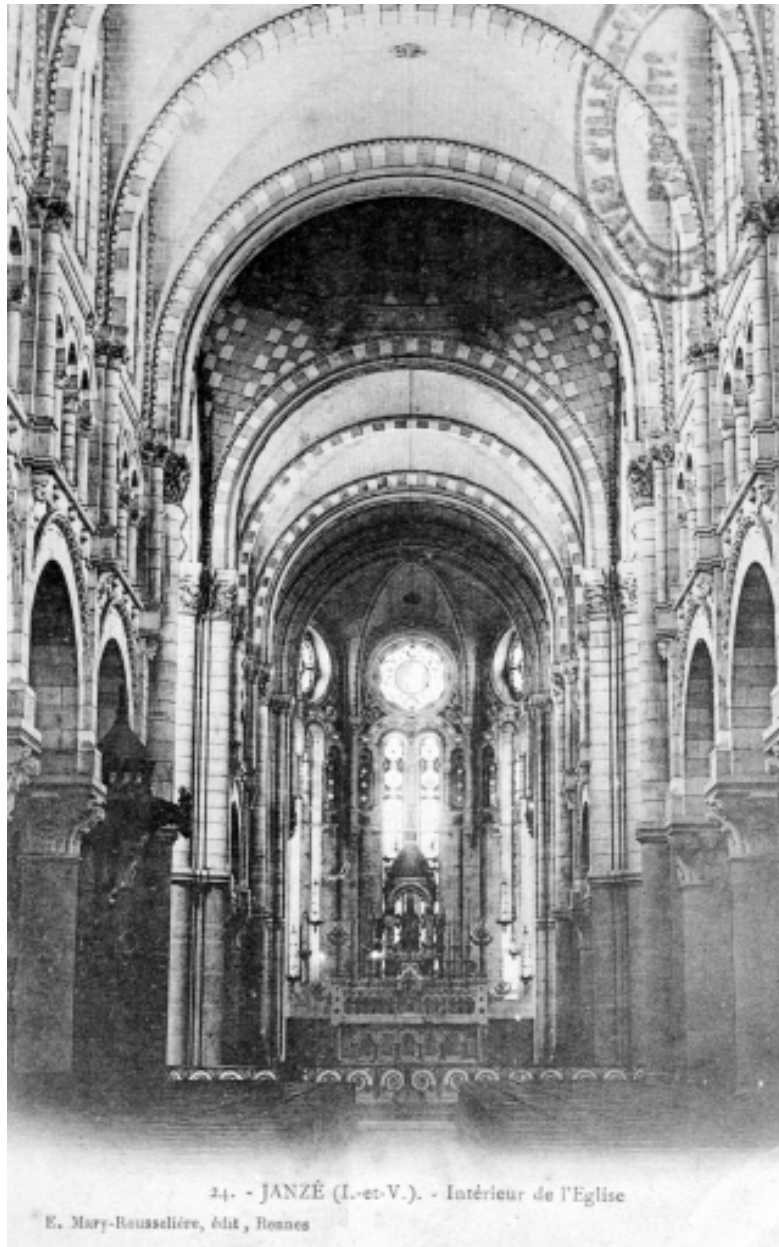
24. - JANZÉ (I.-et-V.). - Intérieur de l'Eglise E. Mary-Rousselière, édit., Rennes