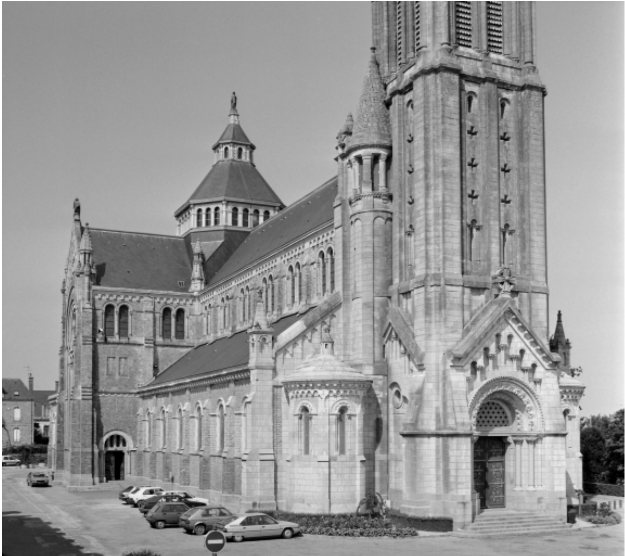
Elévation Sud-Ouest : vue générale