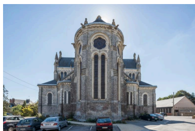
IVR53_20183500338NUCA