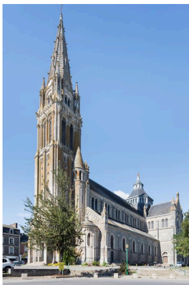
IVR53_20183500339NUCA