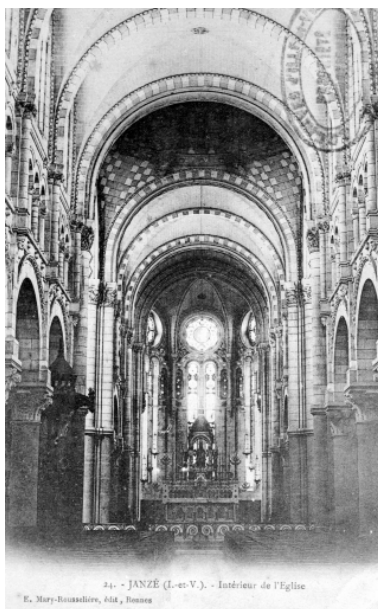
Carte postale ancienne - Intérieur, chœur : vue générale. IVR53_19933500571X