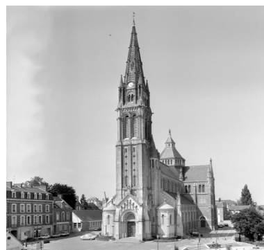
Elévation Sud : vue générale IVR53_19943501428X