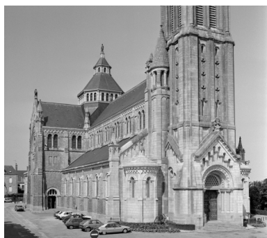
Elévation Sud-Ouest : vue générale