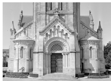
Elévation Sud, partie basse : vue générale