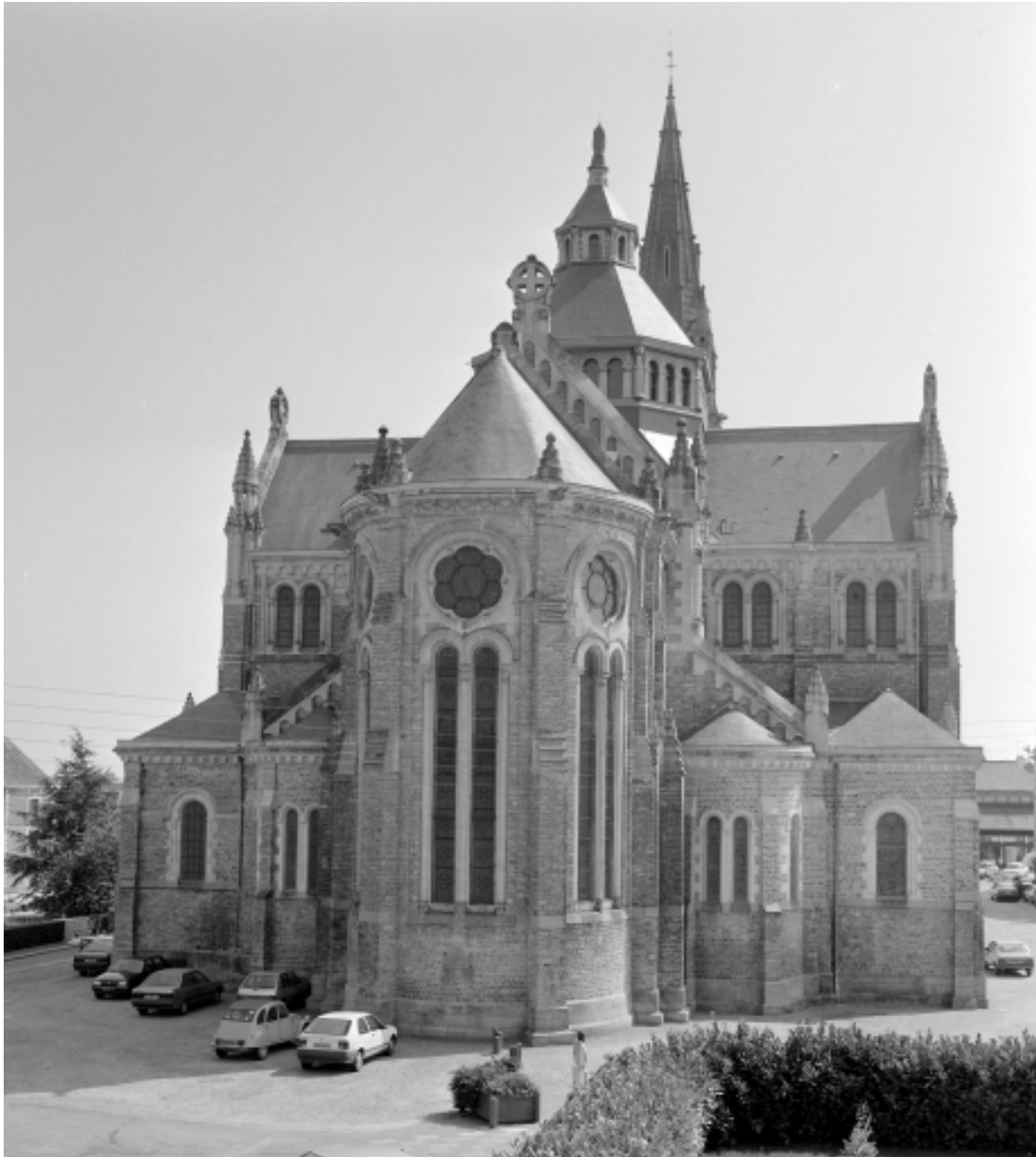
Elévation Nord-Ouest : vue générale