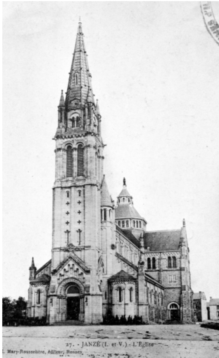
Elévation Sud : vue générale (Carte postale ancienne, AD35 : 6Fi)