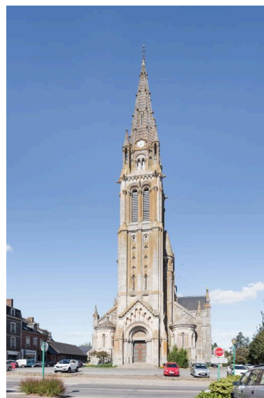
IVR53_20183500340NUCA