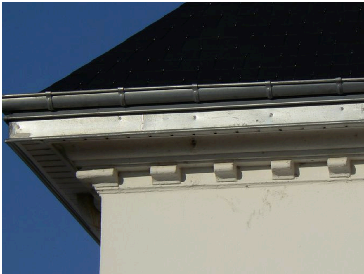
Denticules décoratifs de la corniche extérieure de la villa 3 boulevard des Plages