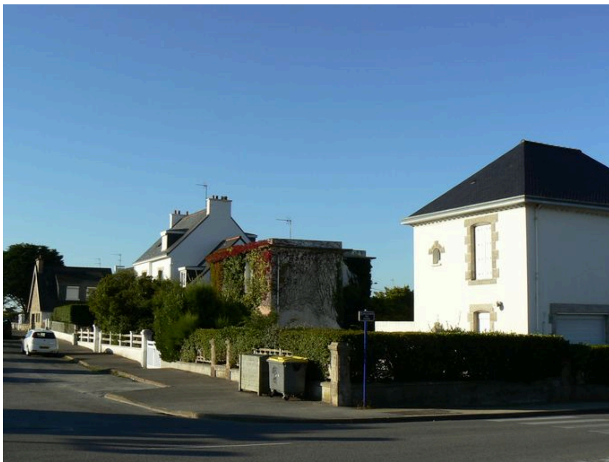
Villas Nestour, place de l'Océan et boulevard des Plages