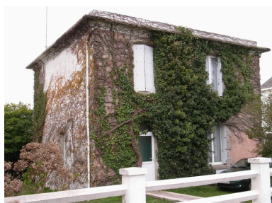
Pignon sud et façade de la villa Les Bleuets IVR53_20072909061NUCA