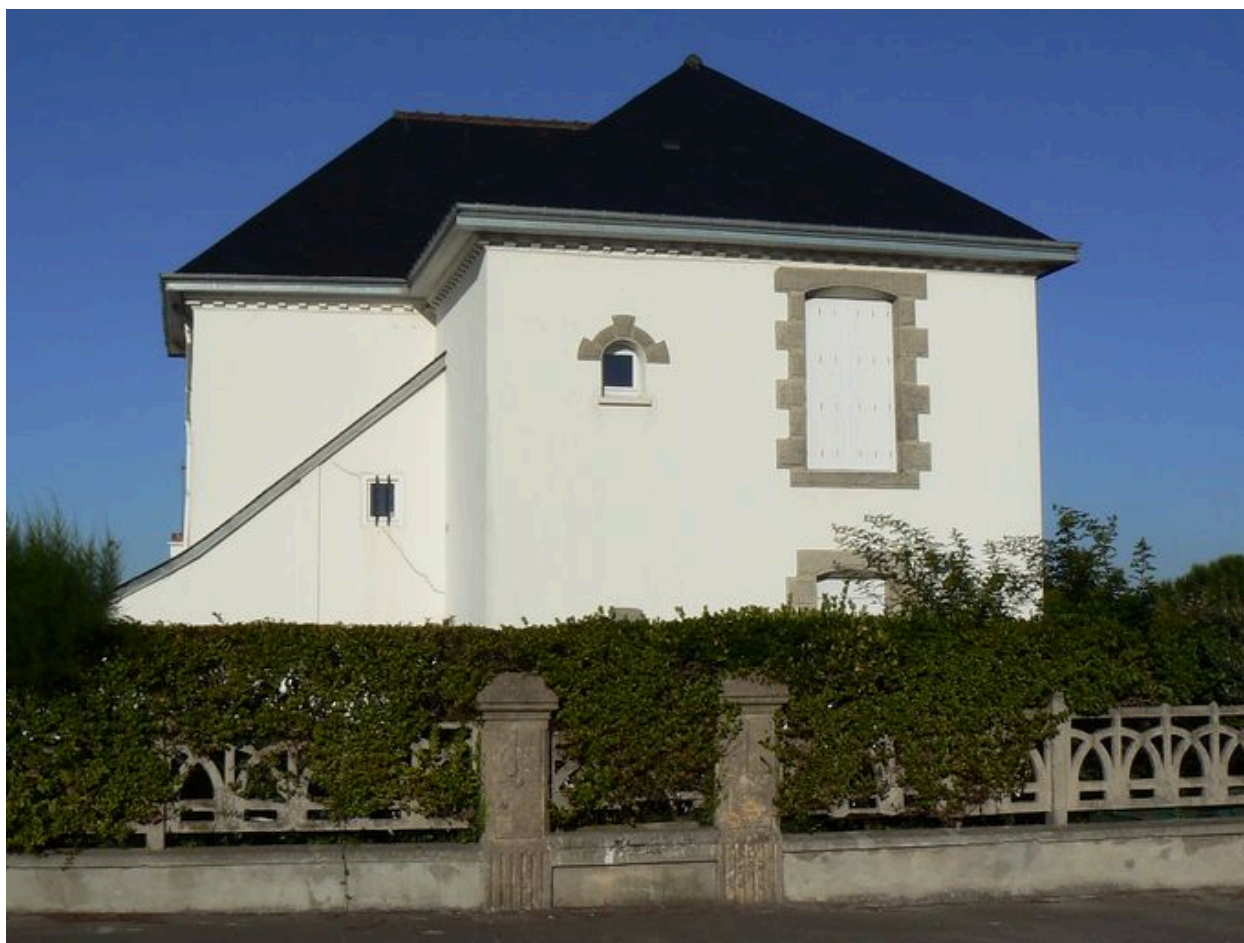
Villa 3 boulevard des Plages