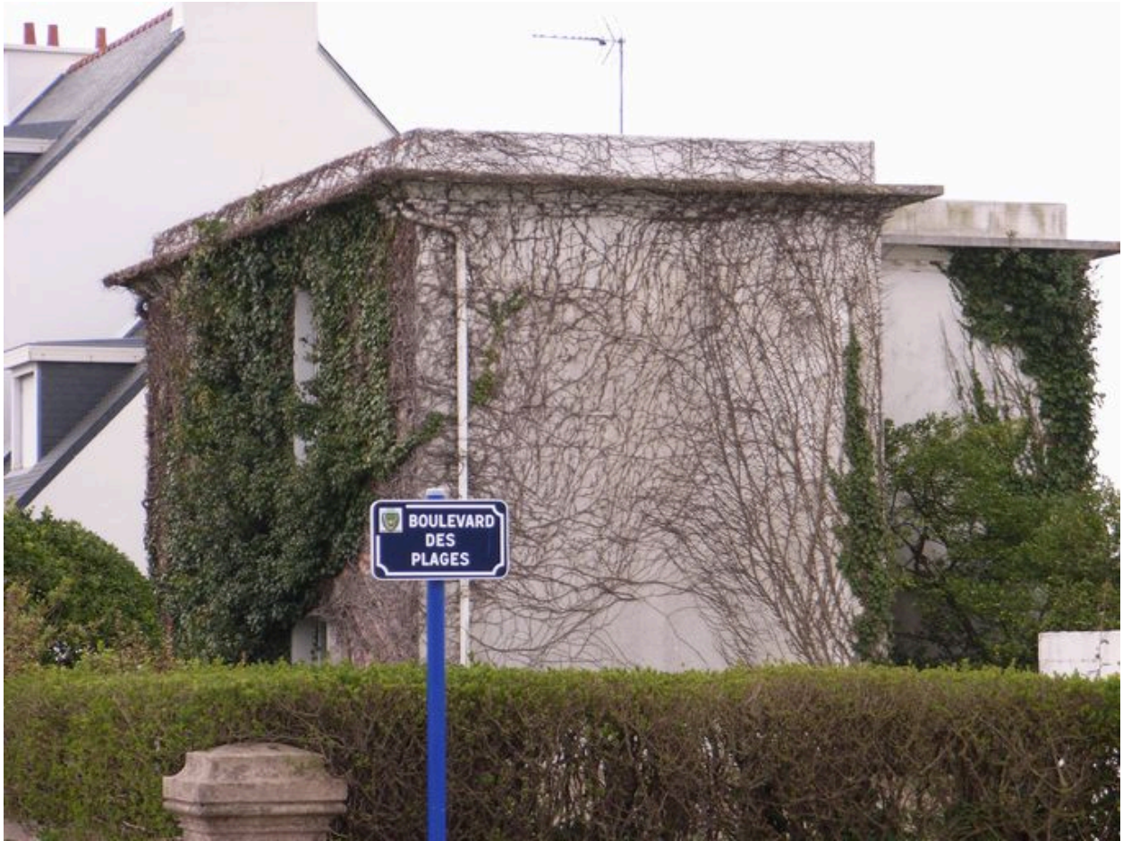
Pignon nord de la villa Les Bleuets