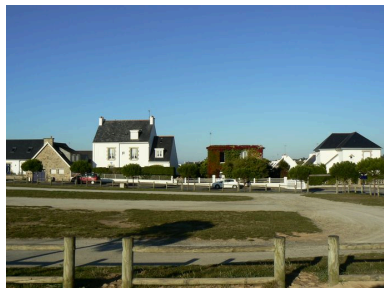
Vue générale des Villas Nestour IVR53_20072909052NUCA