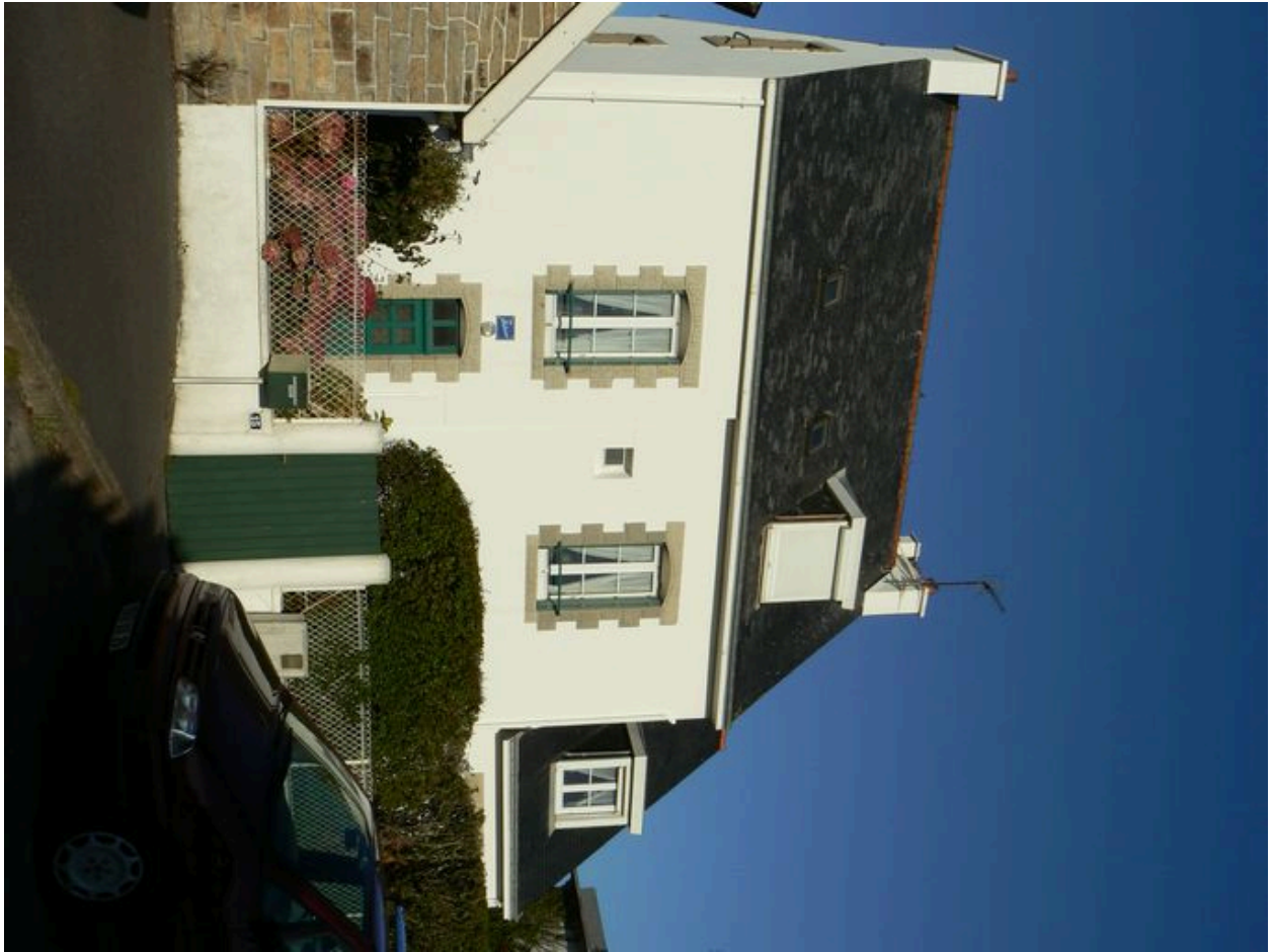
Villa Les Falaises, 15 place de l'Océan