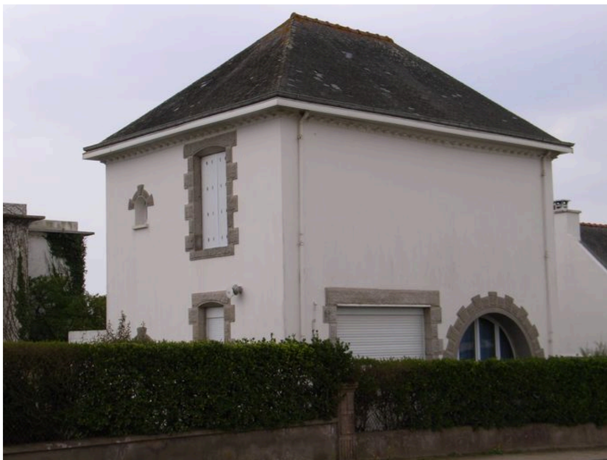
Villa 3 boulevard des Plages