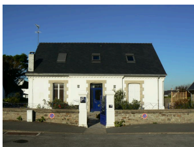
Villa Avel Braz, 17 place de l'Océan IVR53_20072909062NUCA