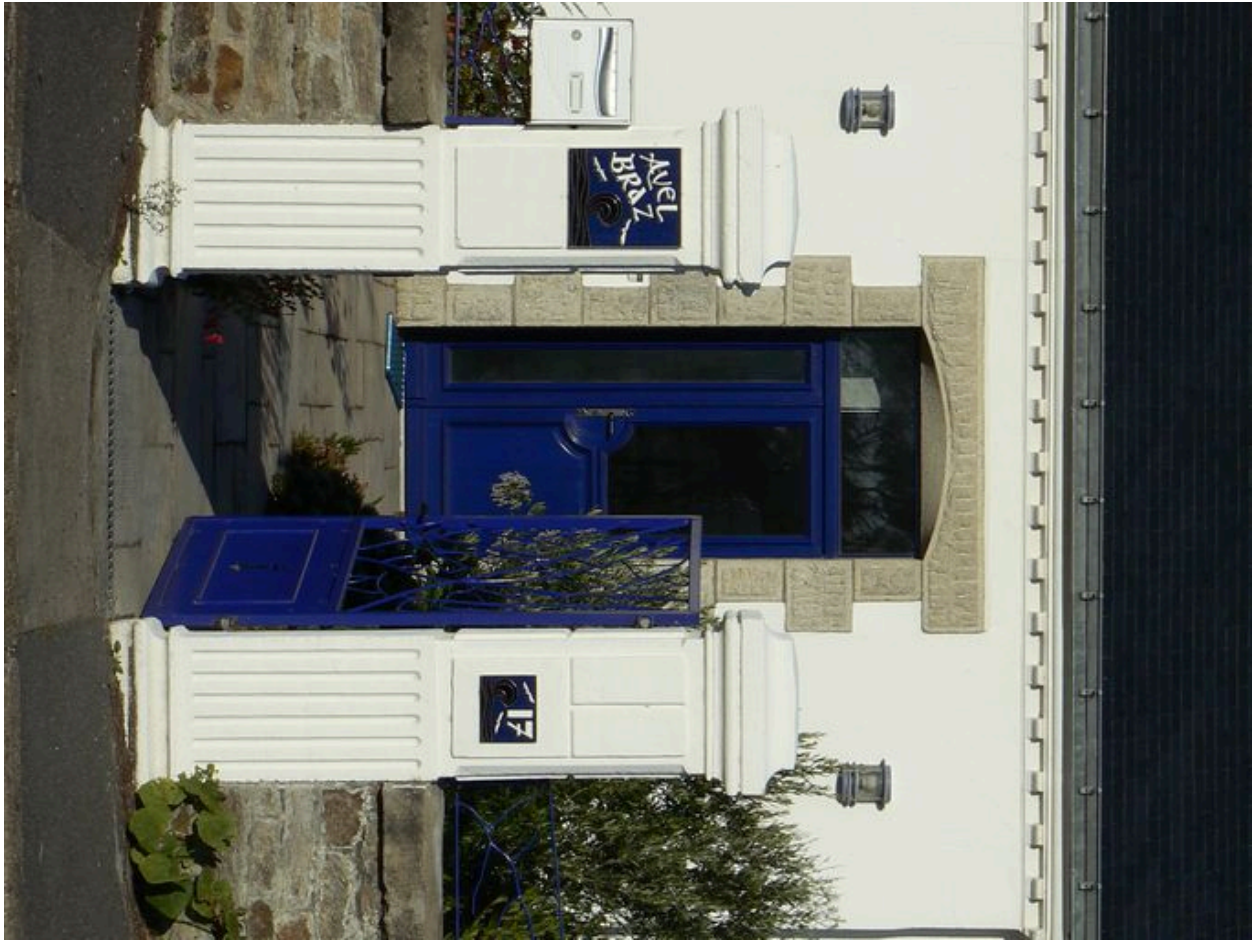
Portail et piliers d'entrée de la villa Avel Braz