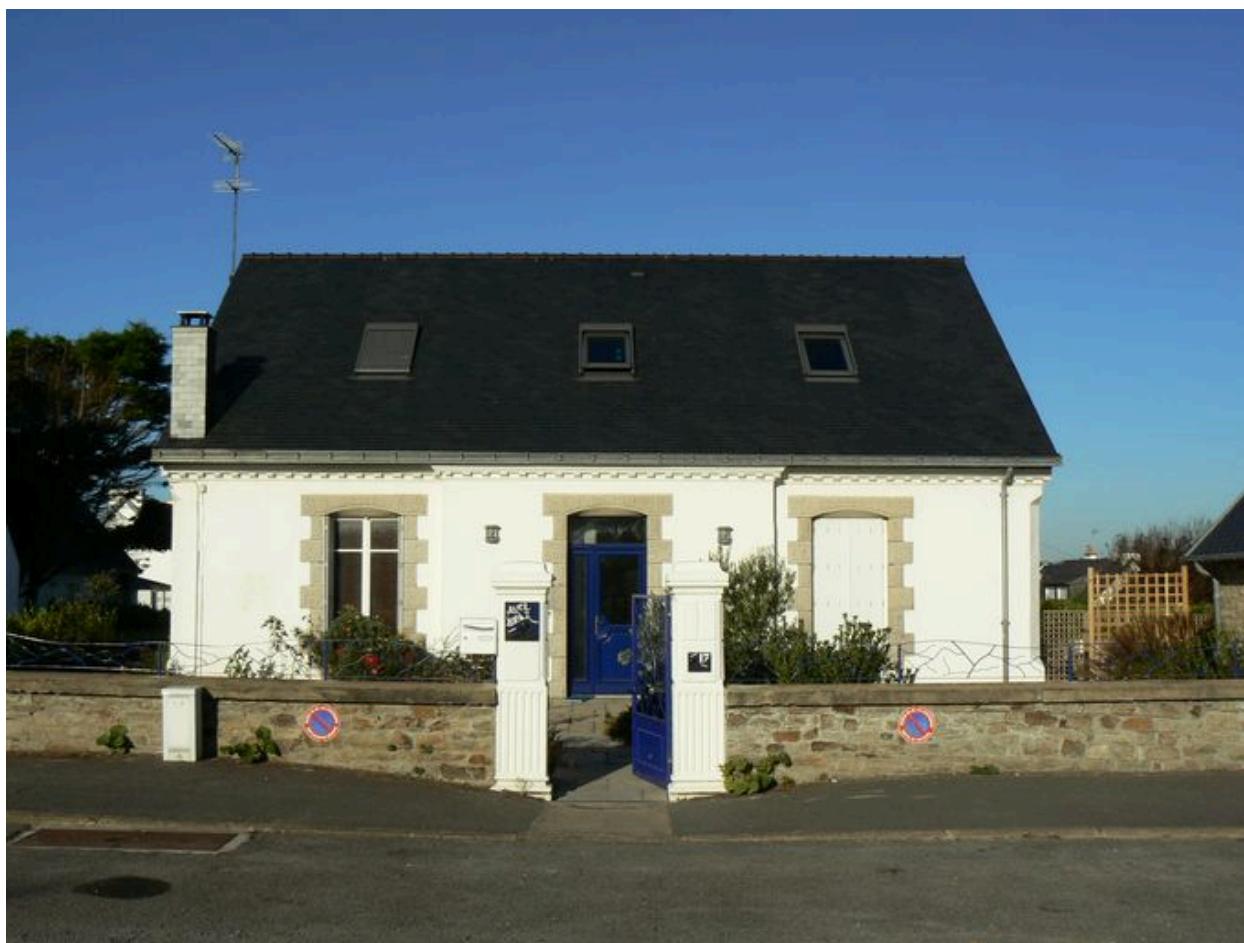
Villa Avel Braz, 17 place de l'Océan