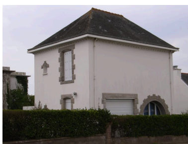
Villa 3 boulevard des Plages IVR53_20072909056NUCA