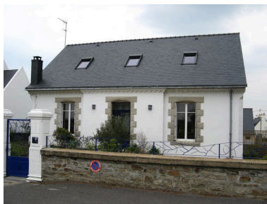
Maison et clôture d'enceinte de la villa Avel Braz IVR53_20072909065NUCA