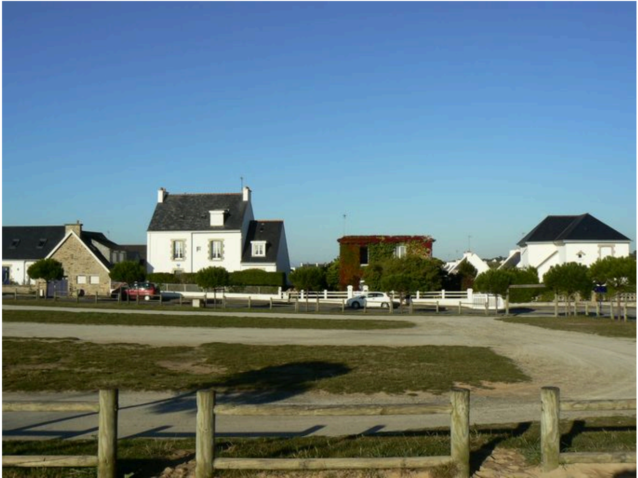
Vue générale des Villas Nestour