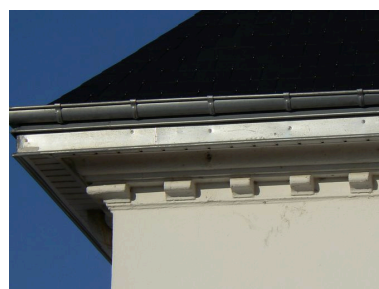
Denticules décoratifs de la corniche extérieure de la villa 3 boulevard des Plages