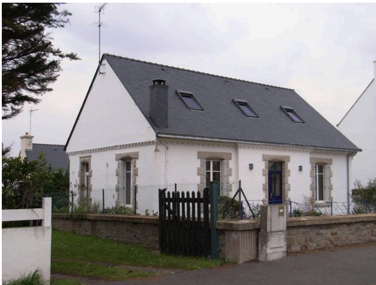
Pignon sud et façade de la villa Avel Braz, côté rue