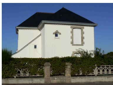
Villa 3 boulevard des Plages IVR53_20072909055NUCA