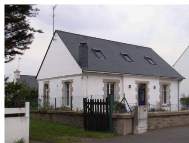
Pignon sud et façade de la villa Avel Braz, côté rue IVR53_20072909063NUCA