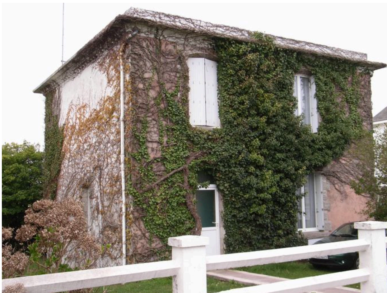
Pignon sud et façade de la villa Les Bleuets