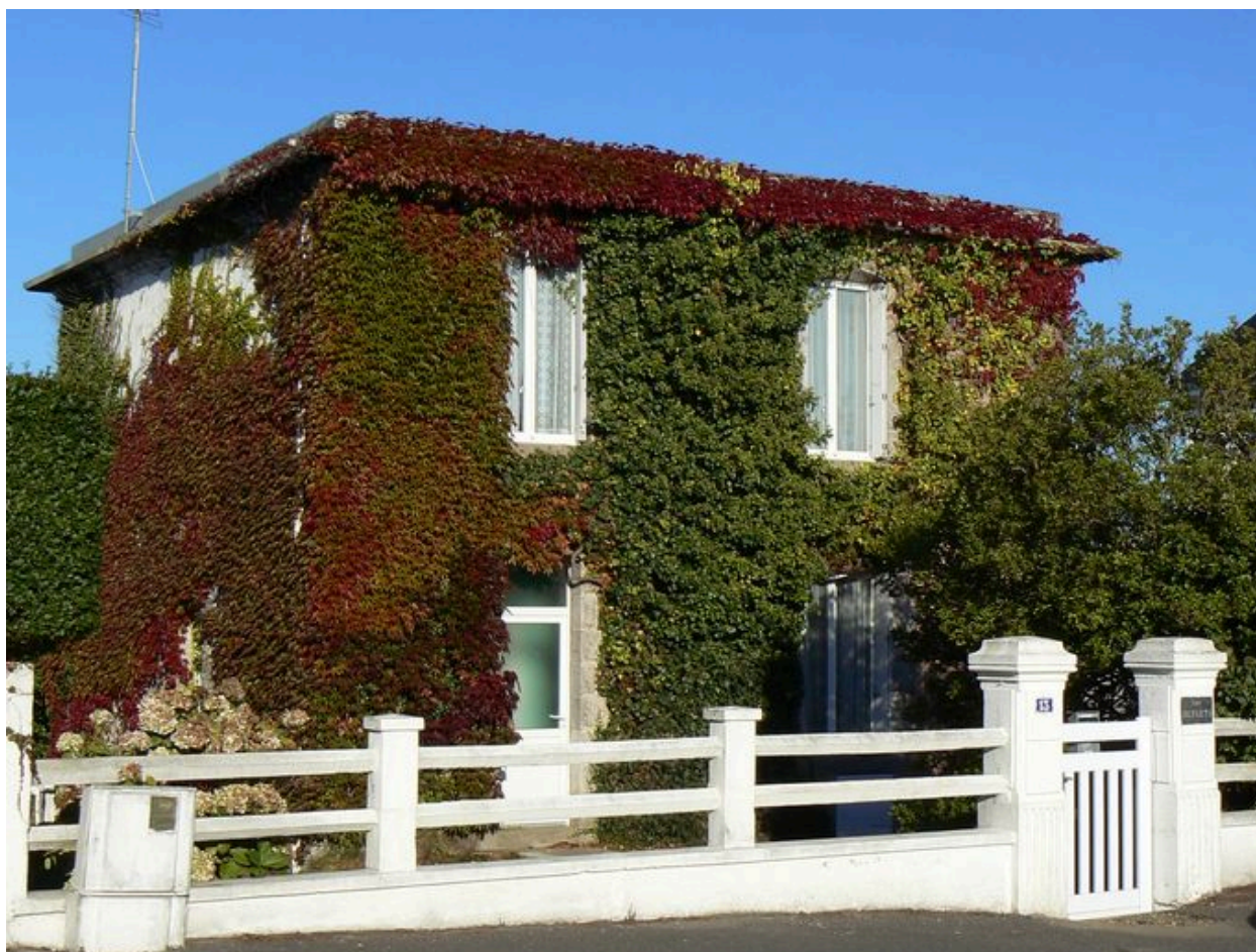
Villa Les Bleuets, 13 place de l'Océan