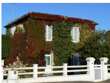
Villa Les Bleuets, 13 place de l'Océan IVR53_20072909059NUCA