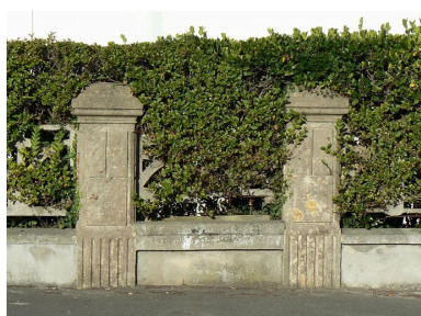
Piliers de clôture de la villa 3 boulevard des Plages