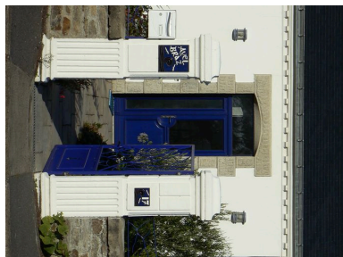
Portail et piliers d'entrée de la villa Avel Braz IVR53_20072909064NUCA