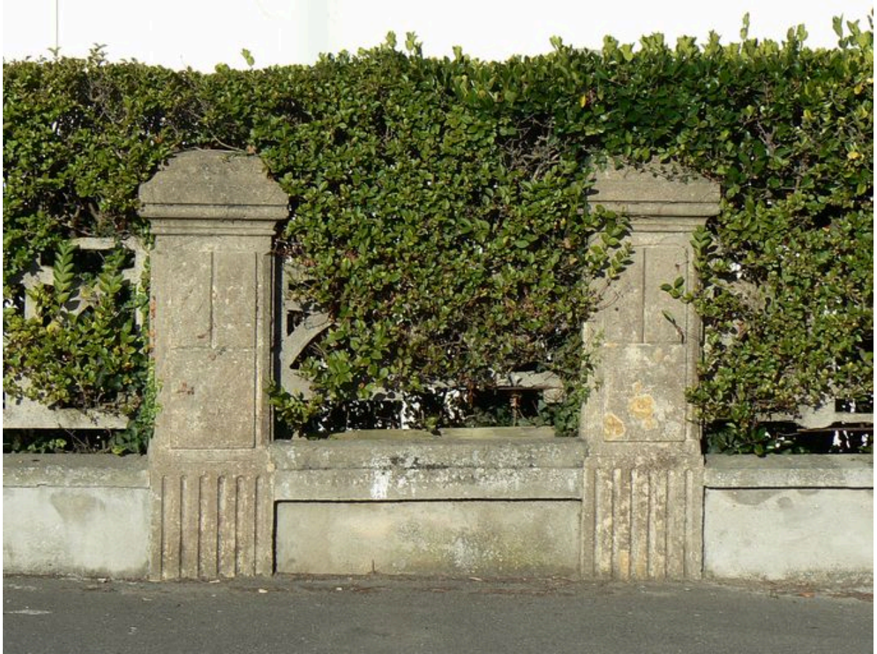
Piliers de clôture de la villa 3 boulevard des Plages