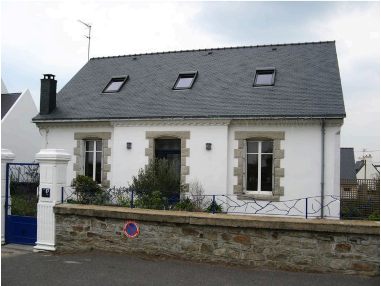
Maison et clôture d'enceinte de la villa Avel Braz