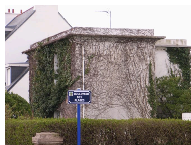
Pignon nord de la villa Les Bleuets