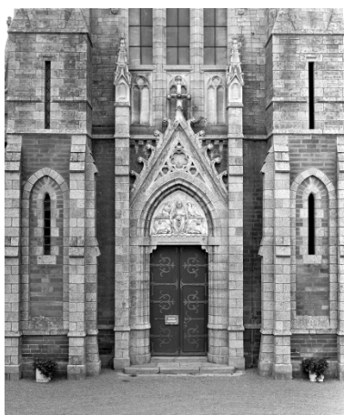
Élévation est, portail : vue générale