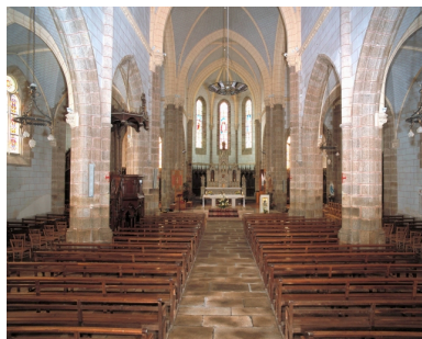
Vue intérieure prise de la nef vers le chœur IVR53_20013501328XA