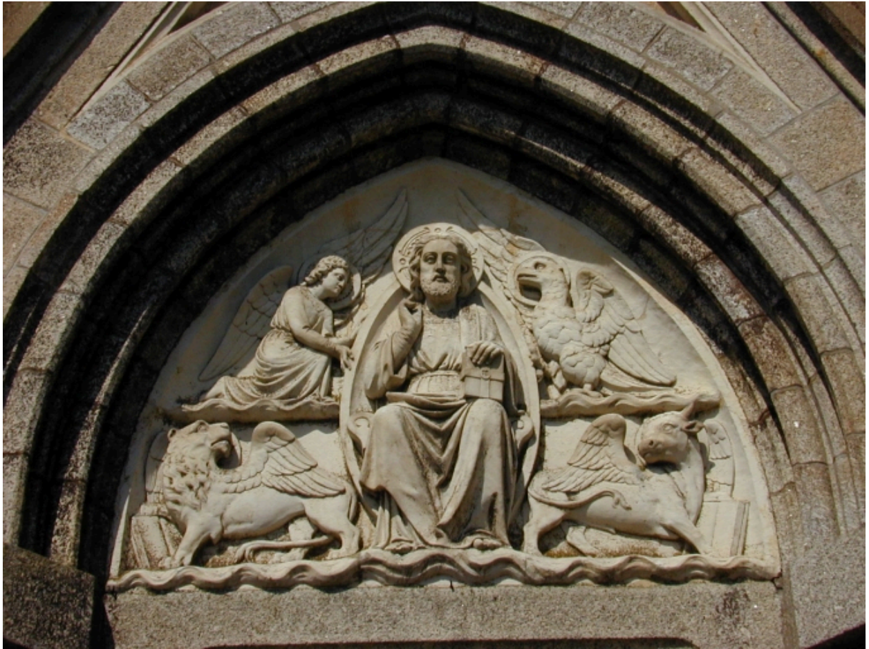
Détail : tympan du portail est