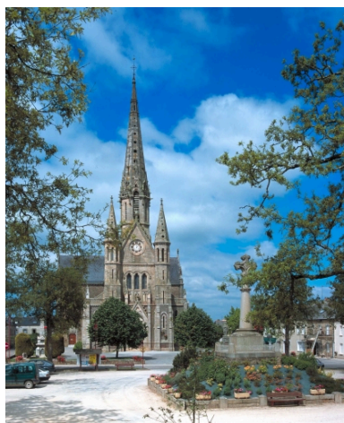
Vue générale est IVR53_20013501778XA