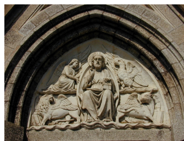
Détail : tympan du portail est IVR53_20013511246NUCA