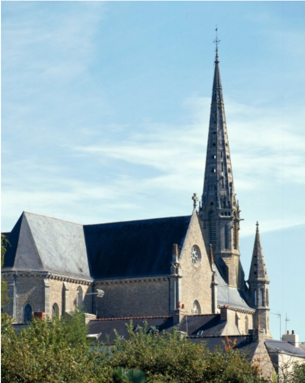
Vue générale sud-ouest