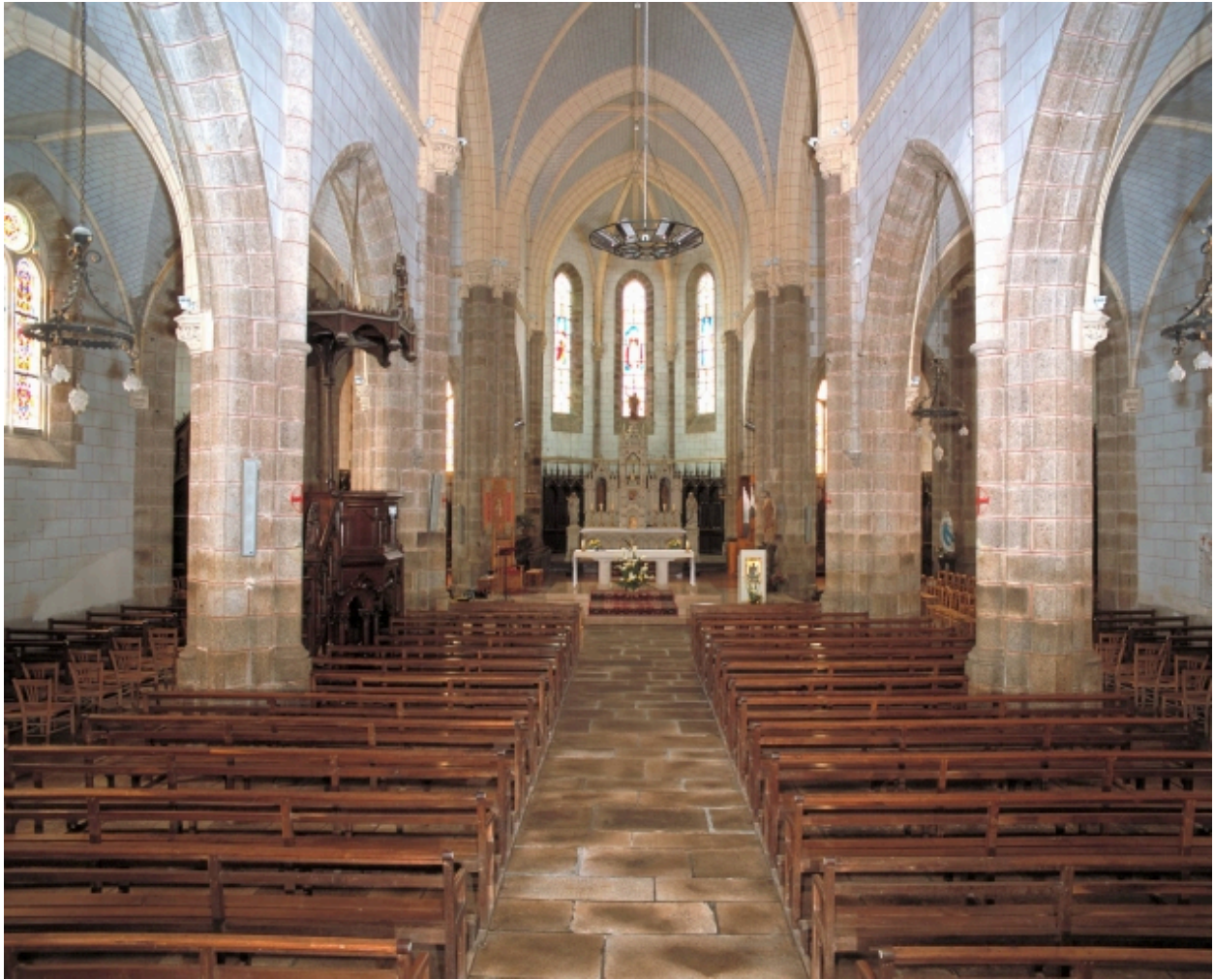
Vue intérieure prise de la nef vers le chœur