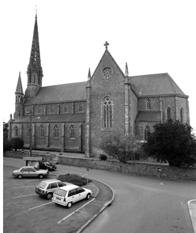
Élévation nord : vue générale