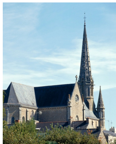
Vue générale sud-ouest, IVR53_20013502050XA