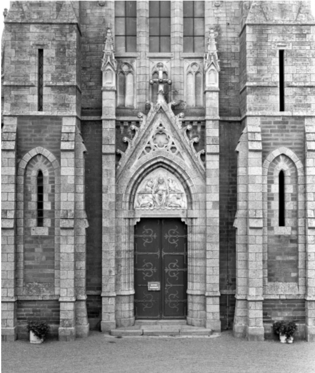
Élévation est, portail : vue générale