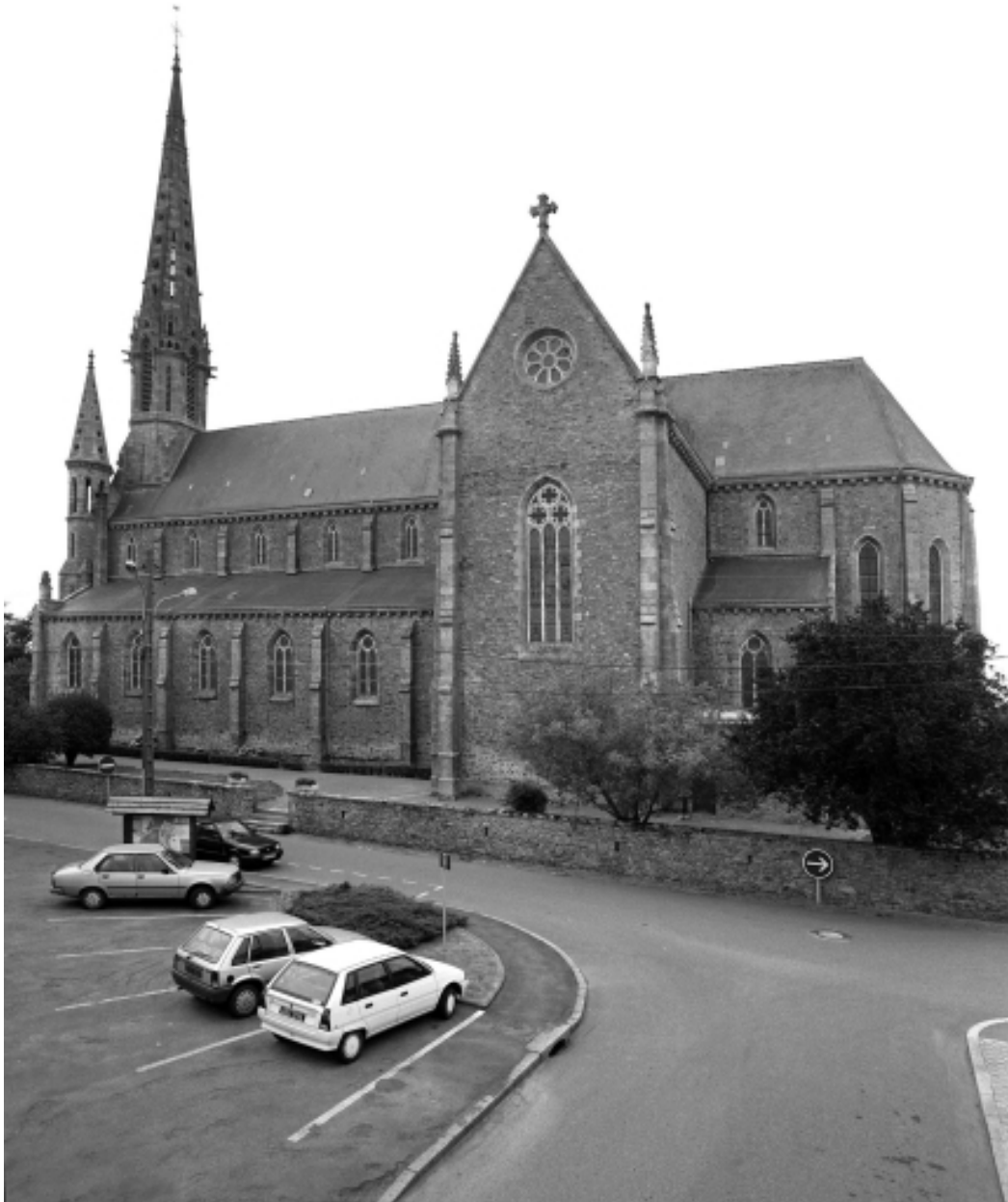
Élévation nord : vue générale