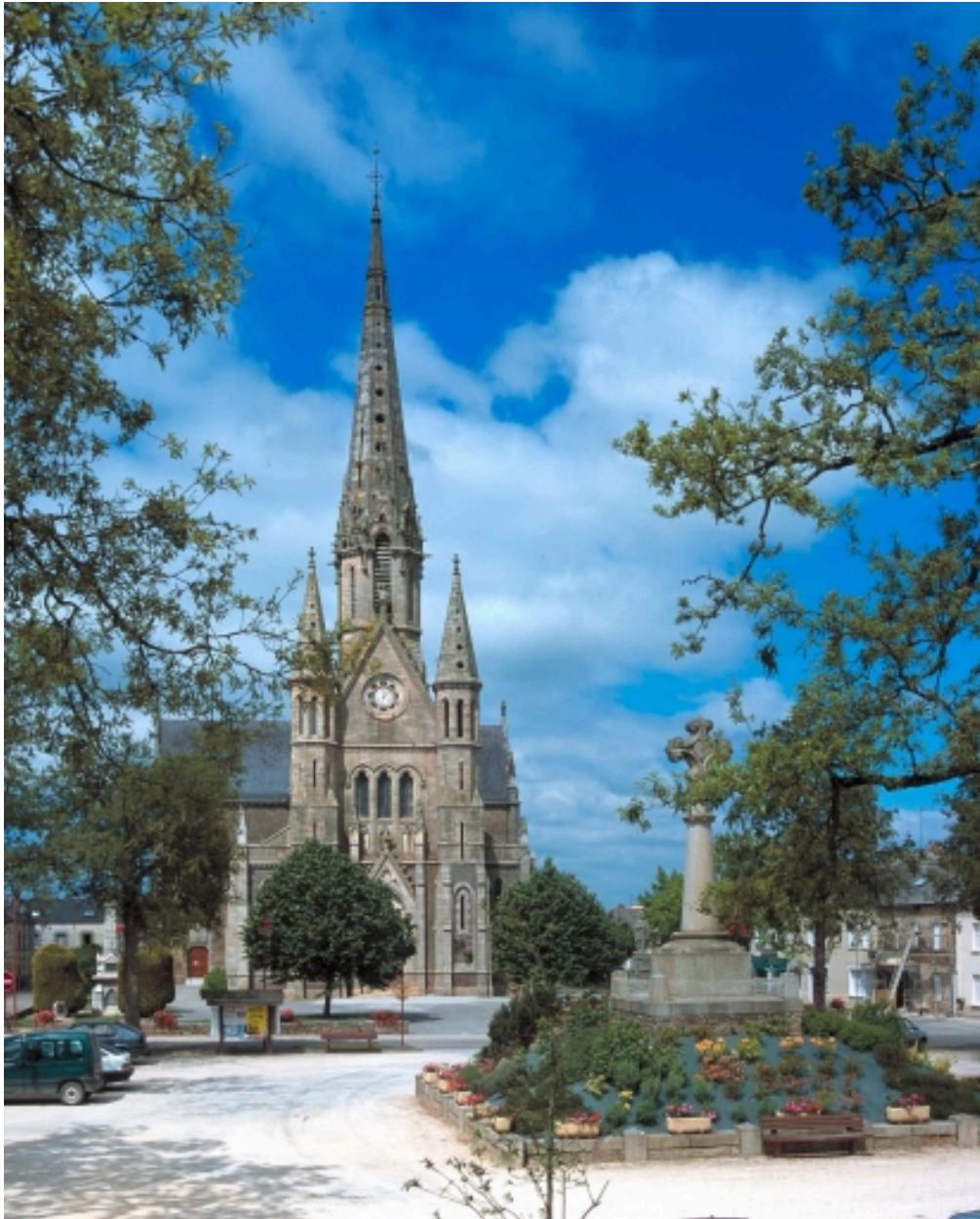
Vue générale est