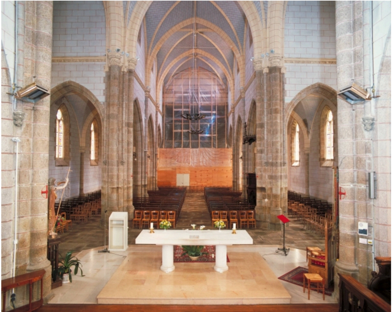
Vue intérieure prise du chœur vers la nef