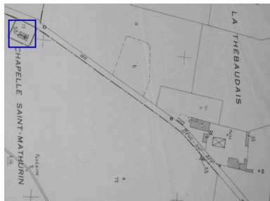
Vue de situation sur le cadastre de 1986 IVR53_20003510429NUC