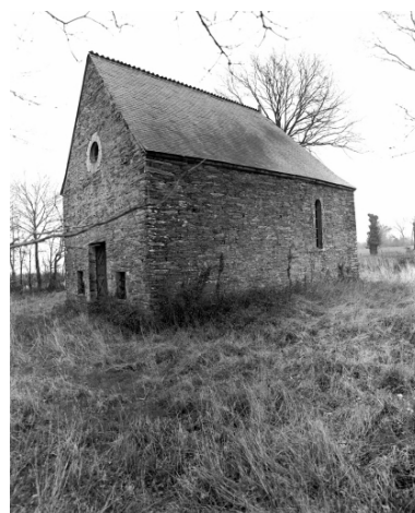
Vue générale sud-ouest IVR53_19933500107X