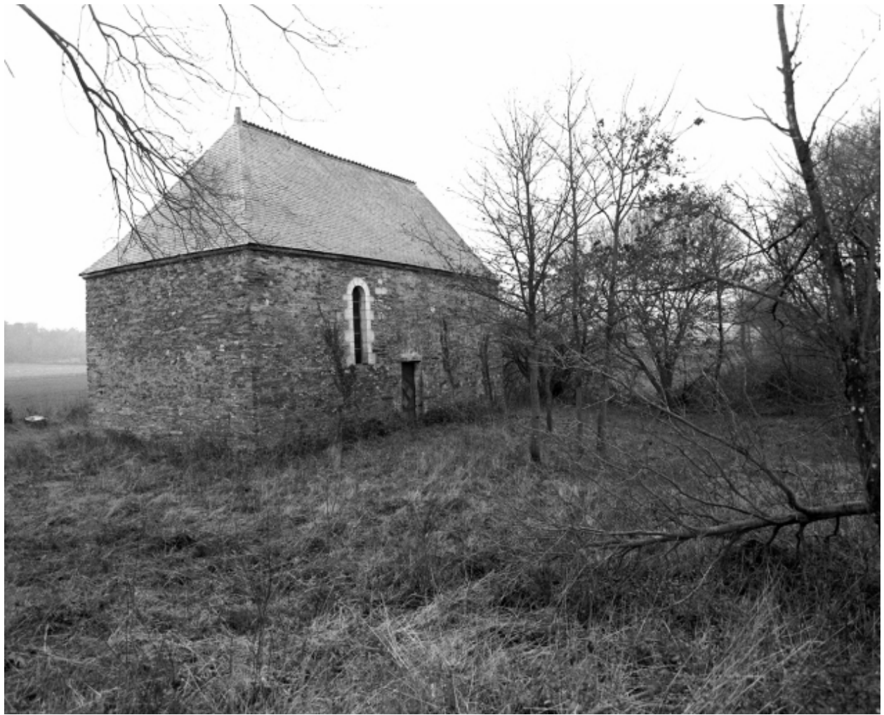
Elévation nord-est : vue générale