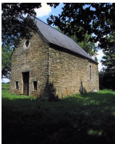
Vue générale sud-ouest IVR53_20003501854XA