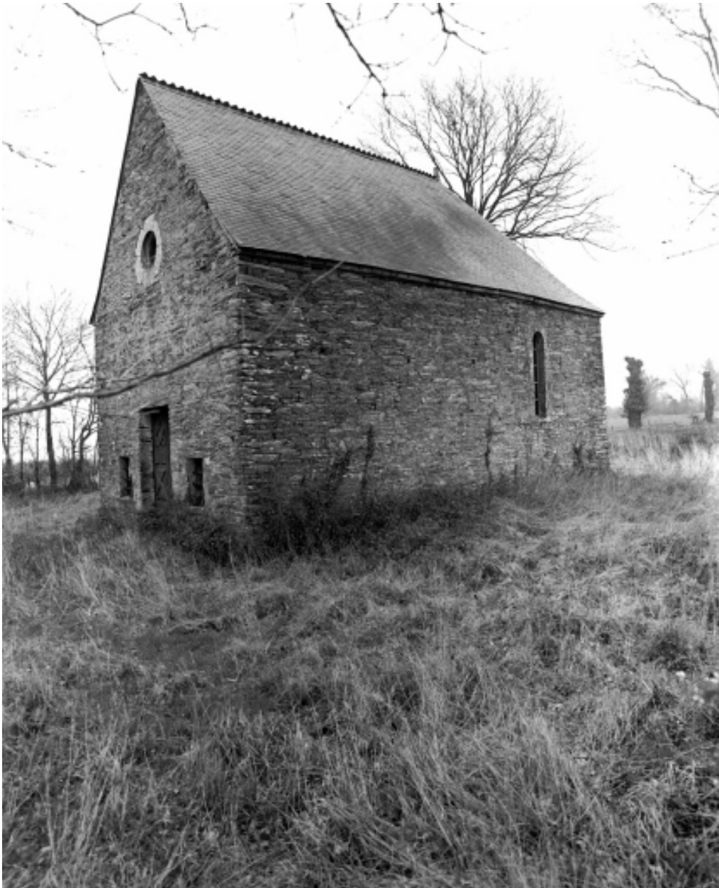
Vue générale sud-ouest