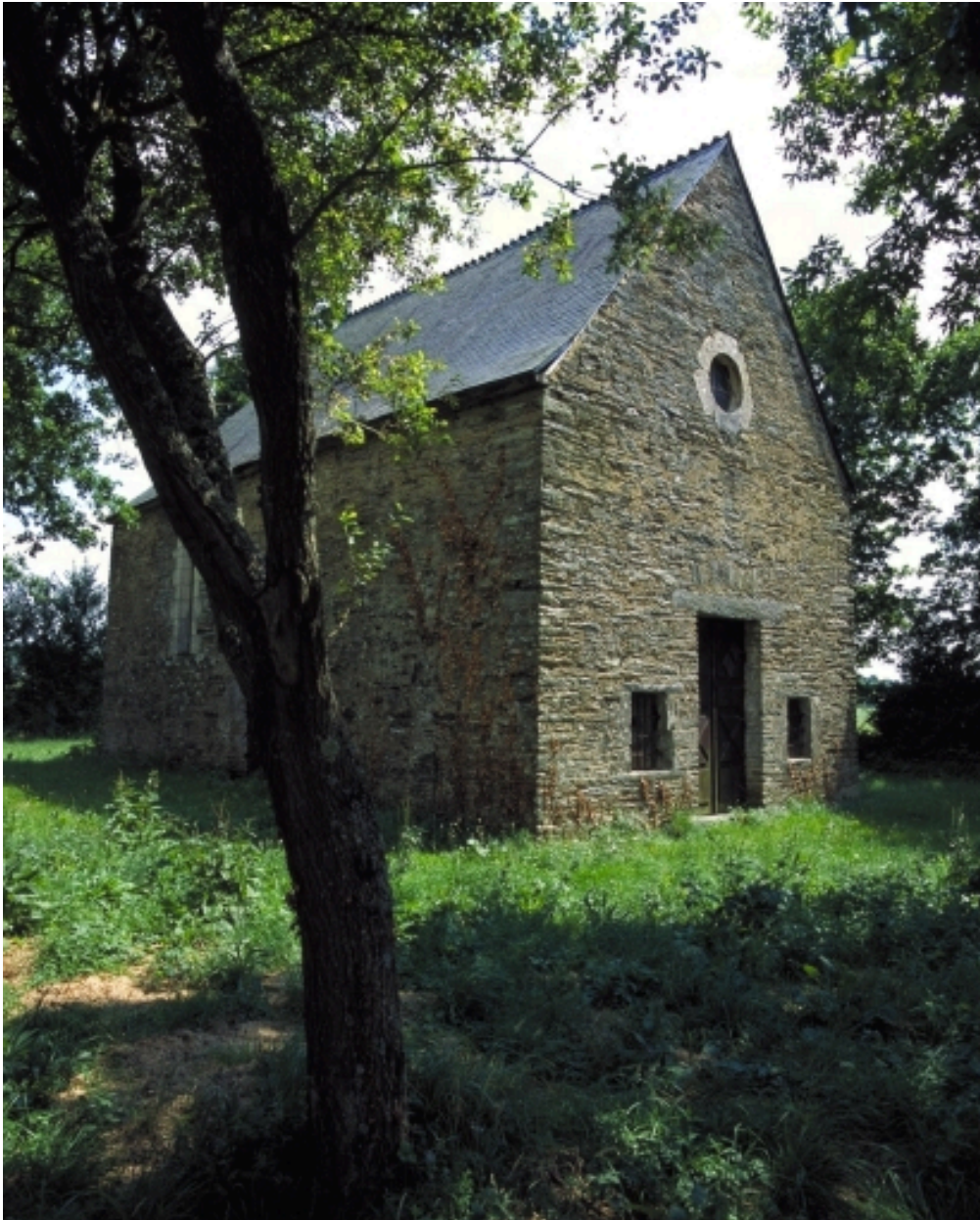
Elévation nord-est : vue générale