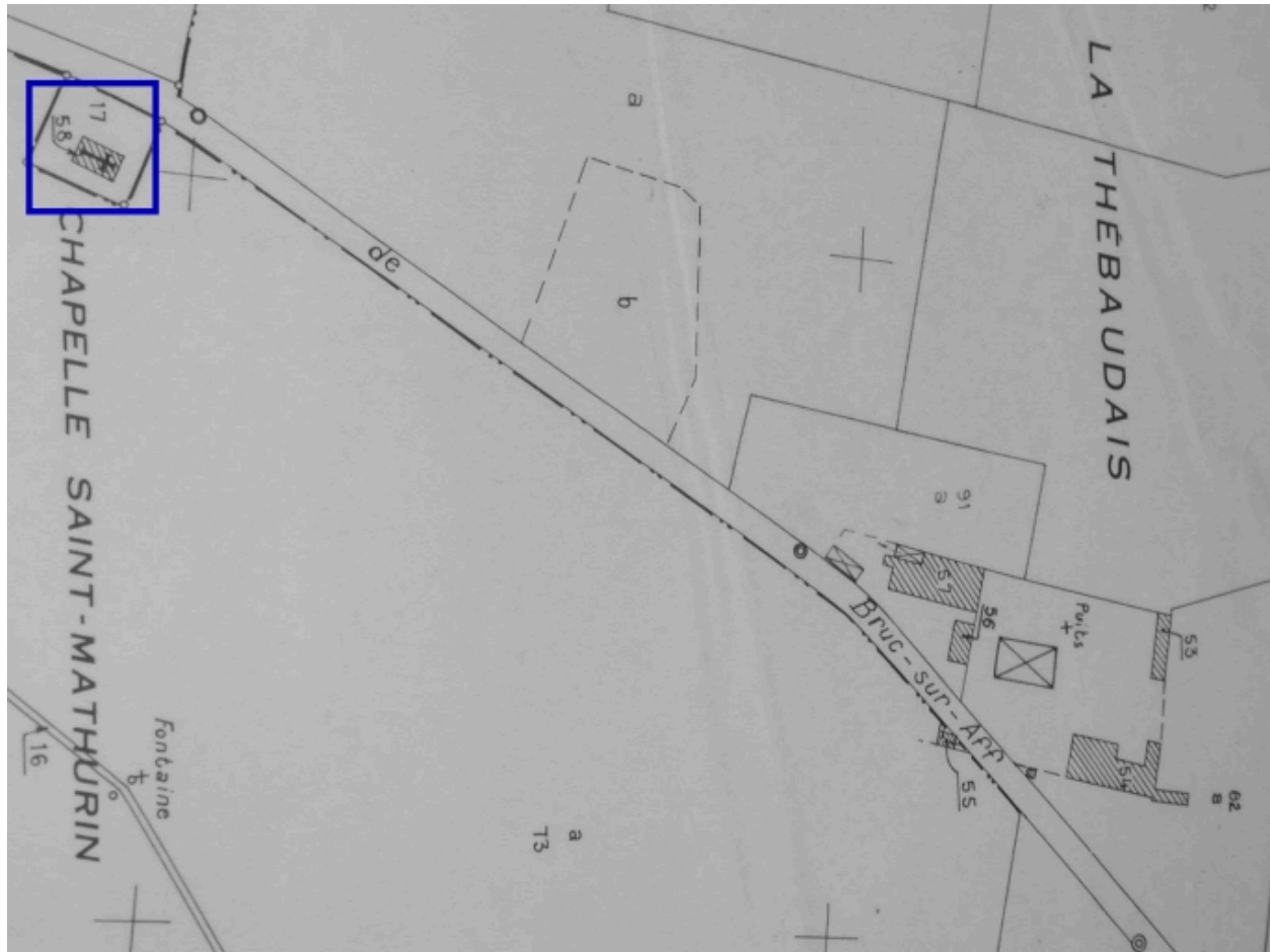
Vue de situation sur le cadastre de 1986