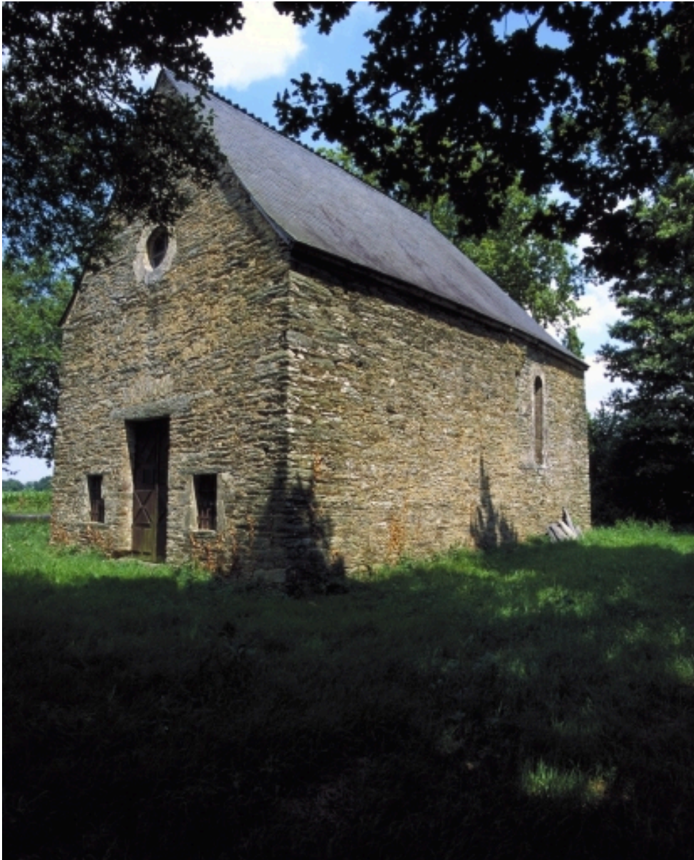
Vue générale sud-ouest