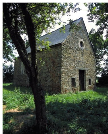
Elévation nord-est : vue générale, IVR53_20003501855XA