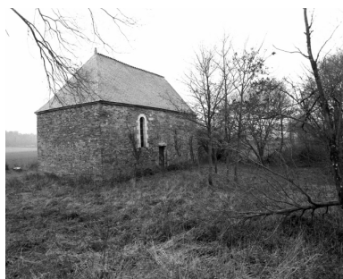
Elévation nord-est : vue générale, IVR53_19933500106X