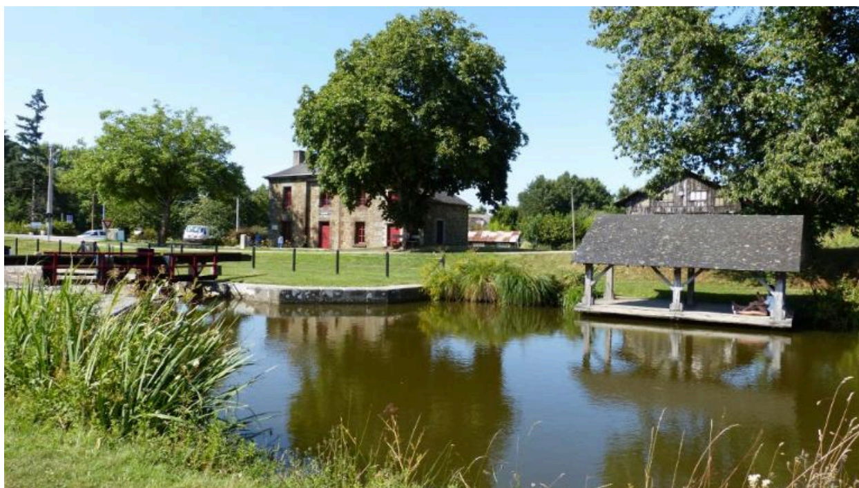
Vue d'ensemble du site de l'écluse de la Madeleine (Hédé-Bazouges)