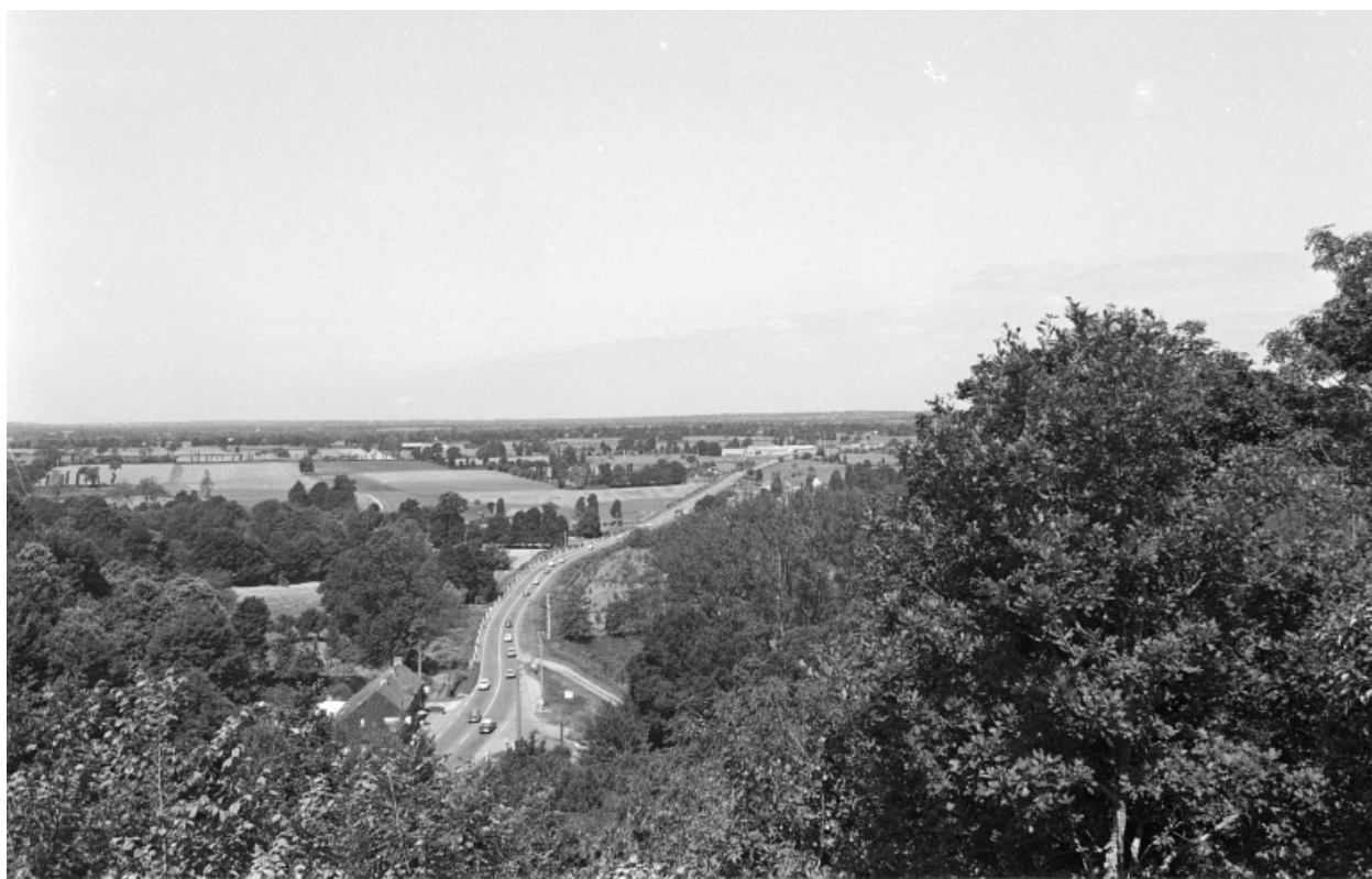
Vue sur la plaine depuis le château