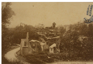
La vallée au début du 20e siècle