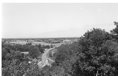
Vue sur la plaine depuis le château