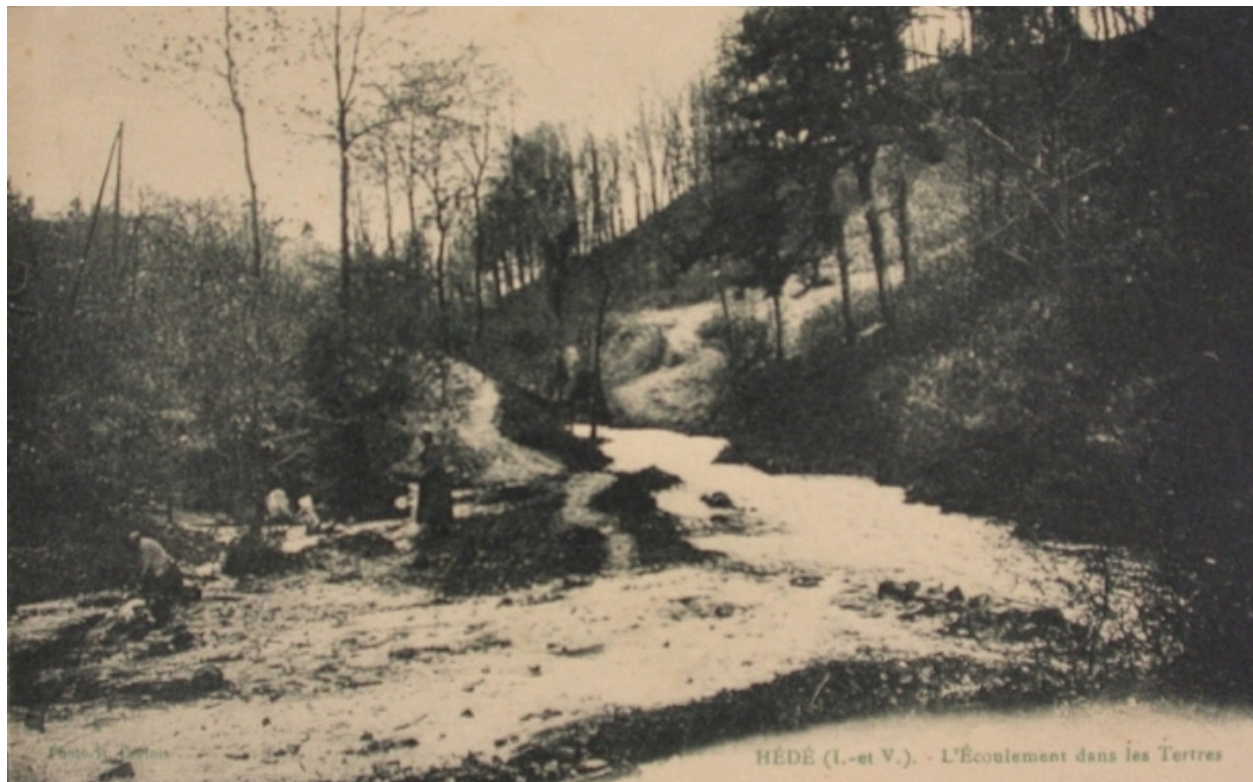
Les Tertres sur une carte postale ancienne