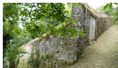
Chemin des Roquets (Hédé-Bazouges) IVR53_20243532405NUCA