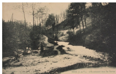
Les Tertres sur une carte postale ancienne