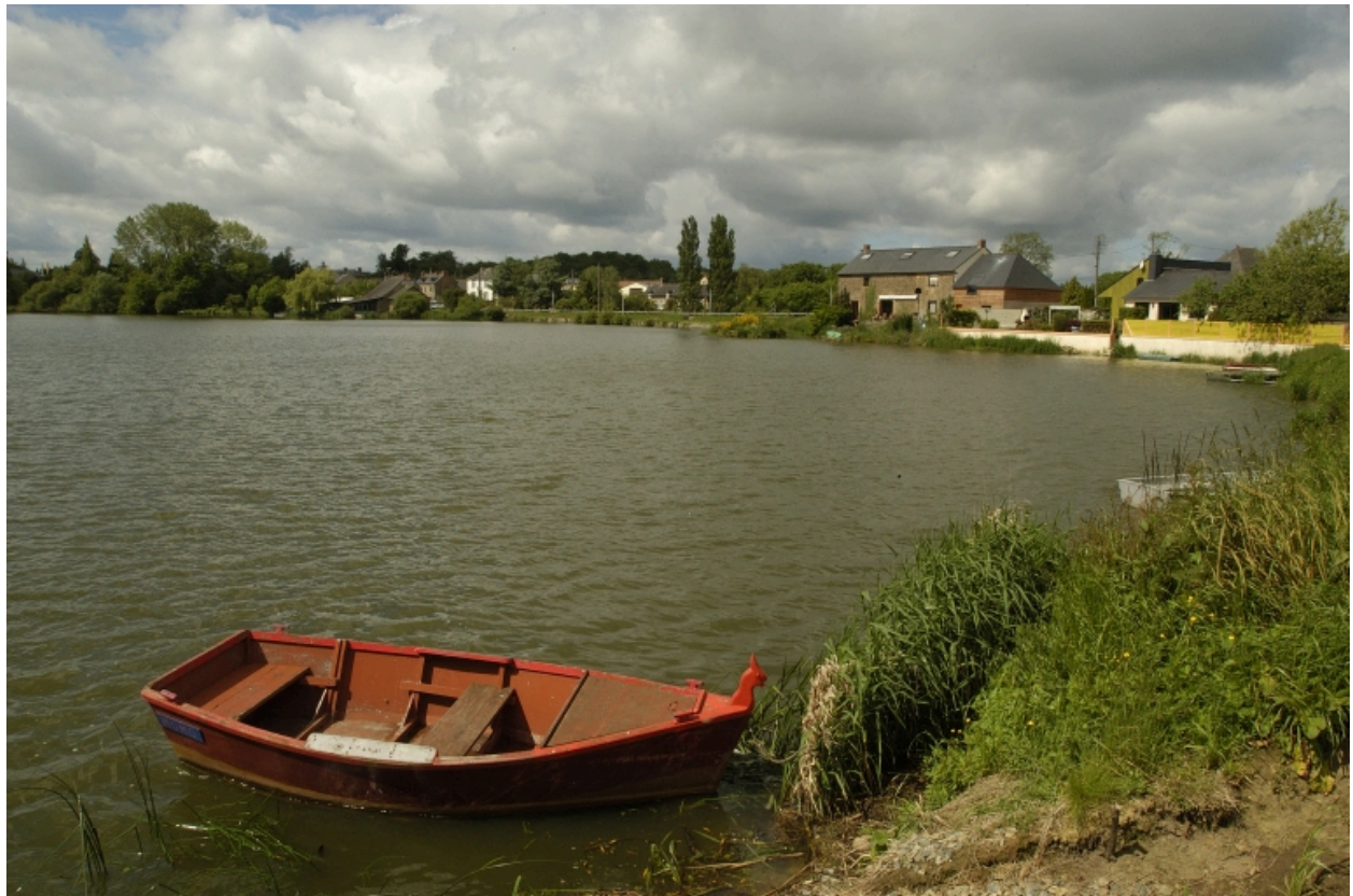
L'étang de Hédé