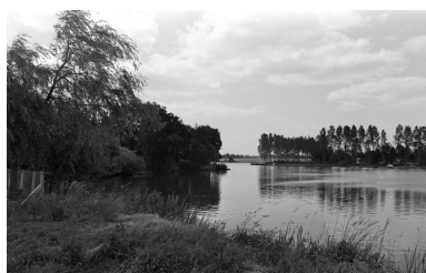
L'étang de Hédé