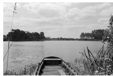
L'étang de Hédé