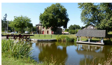
Vue d'ensemble du site de l'écluse de la Madeleine (Hédé-Bazouges)