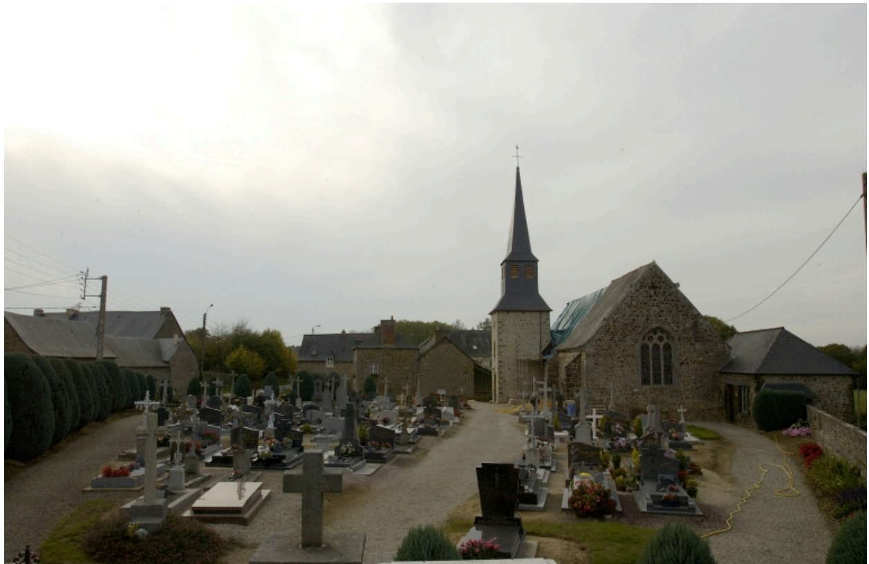
L'église de Saint-Symphorien