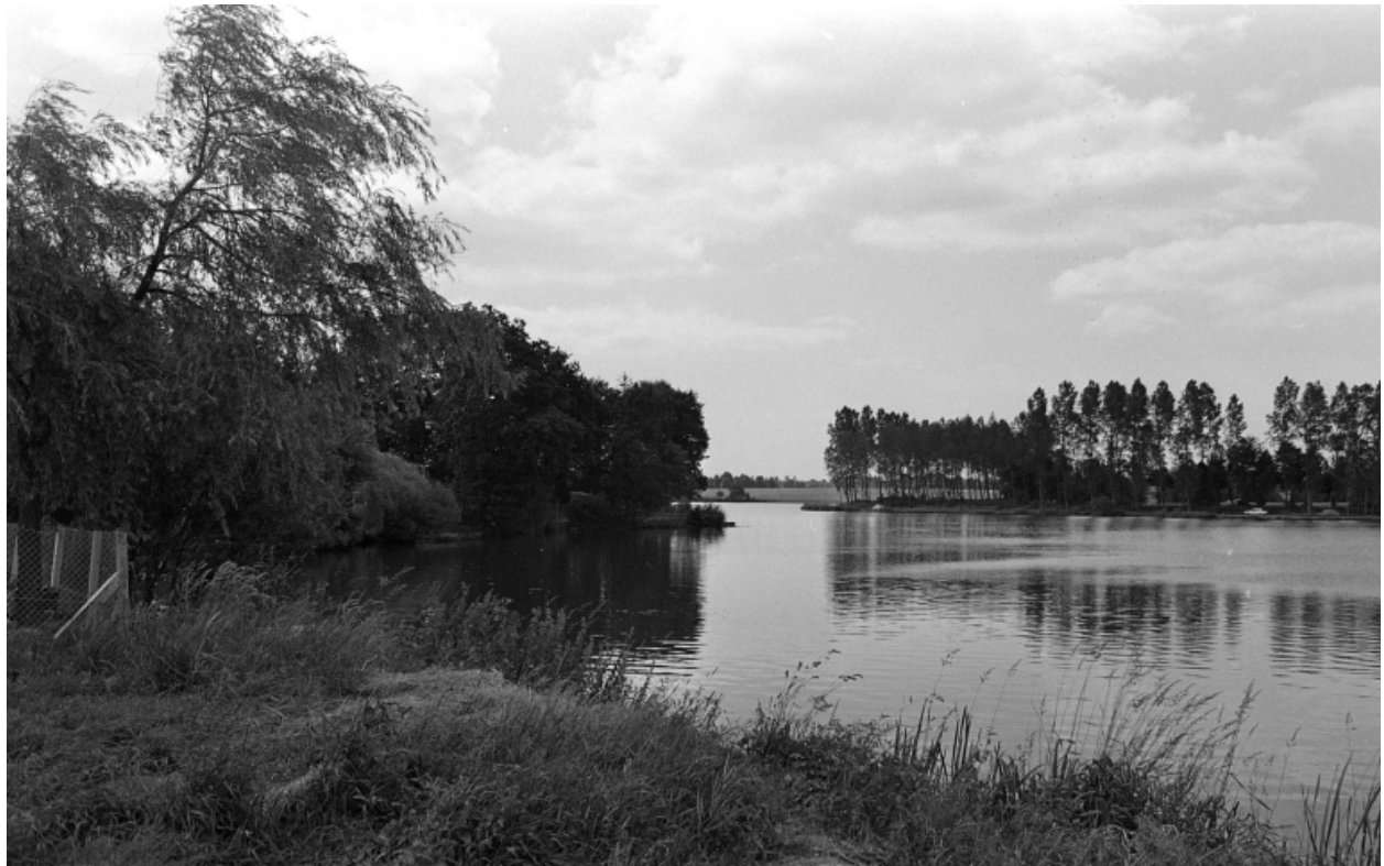
L'étang de Hédé