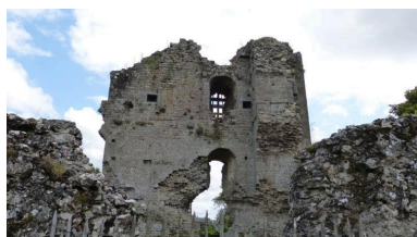
Vue ouest de l'ancienne tour du château (Hédé-Bazouges) IVR53_20243531724NUCA