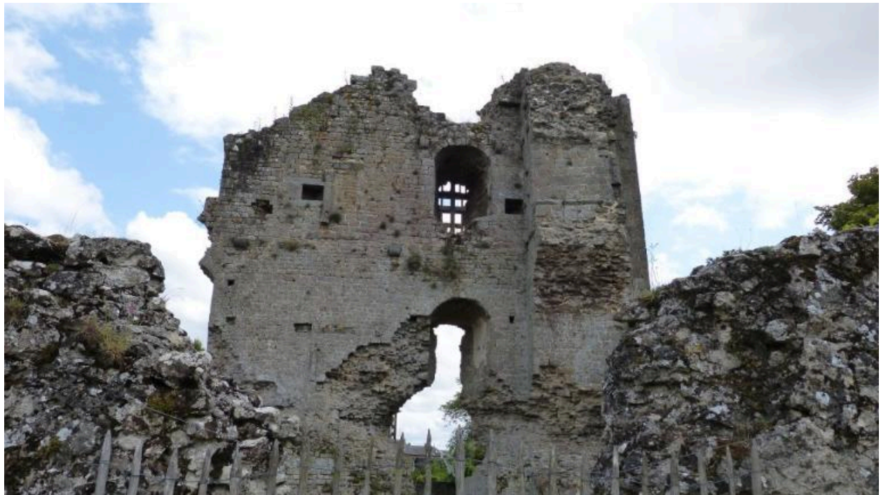
Vue ouest de l'ancienne tour du château (Hédé-Bazouges)