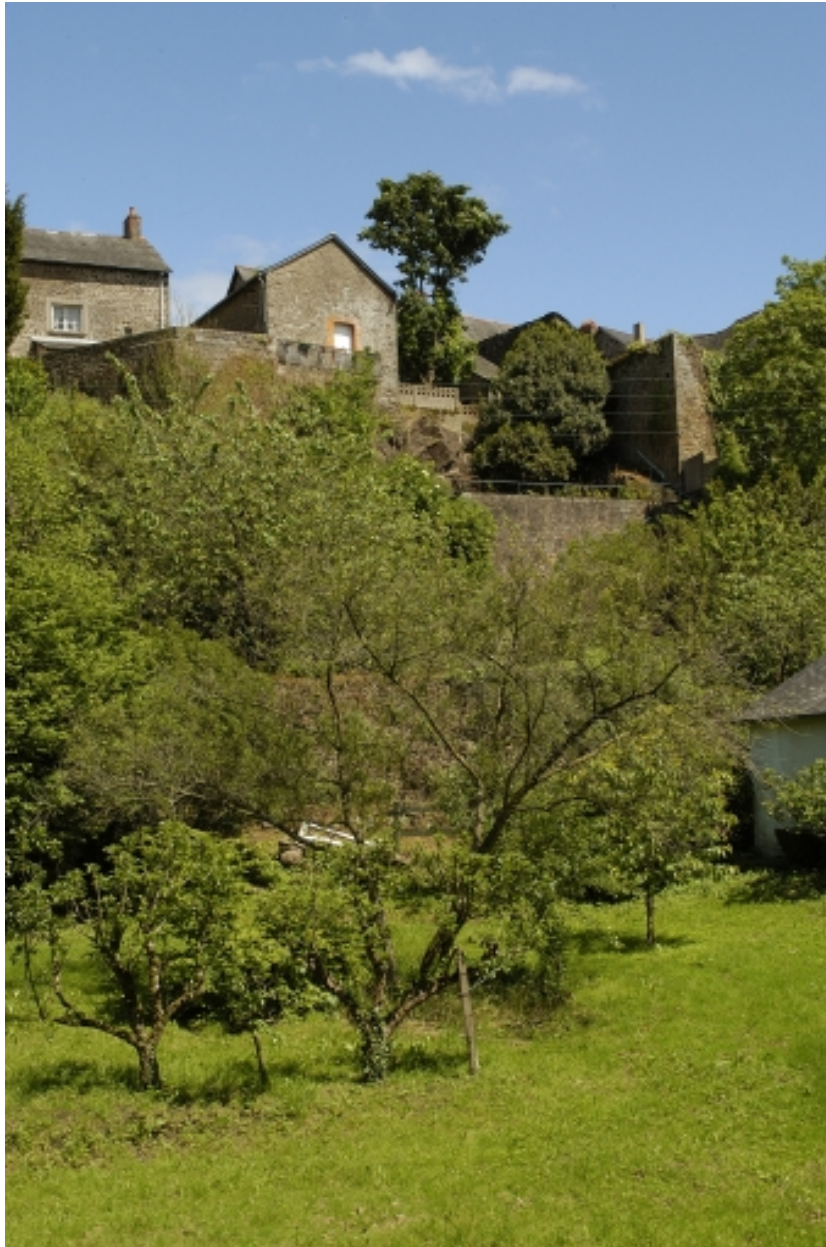
Vue depuis le chemin des Roquets