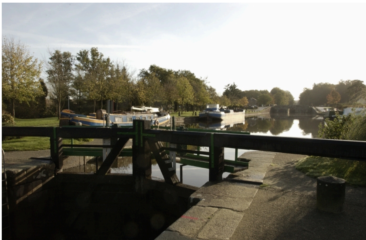
Une écluse sur le canal d'Ille-et-Rance