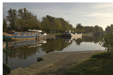
Le canal IVR53_20053503043NUCA