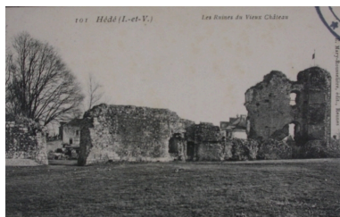
Les ruines du château sur une carte postale ancienne