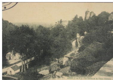
La vallée et le vieux château sur une carte postale ancienne