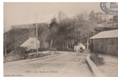
Vue sud-ouest sur une carte postale ancienne IVR53_20053518377NUCA