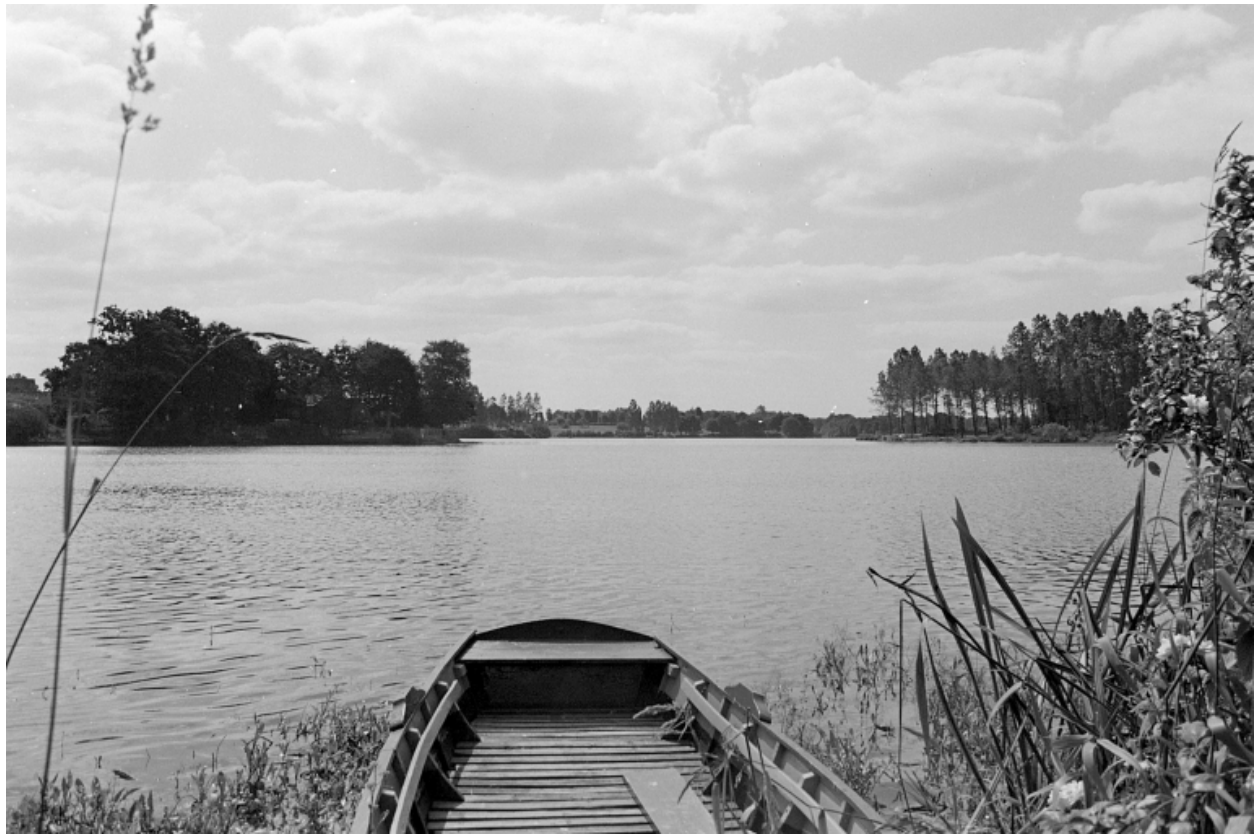
L'étang de Hédé