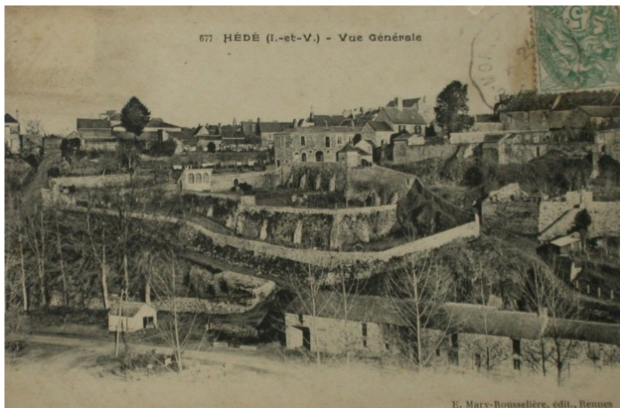
Vue générale sur une carte postale ancienne