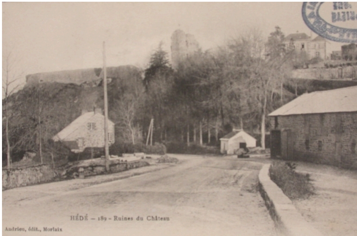
Vue sud-ouest sur une carte postale ancienne