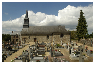
L'église de Bazouges-sous-Hédé