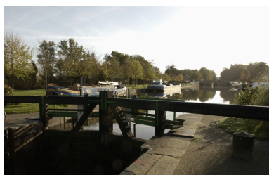
Une écluse sur le canal d'Ille-et-Rance