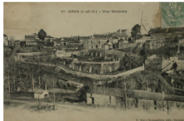
Vue générale sur une carte postale ancienne IVR53_20053519231NUCA