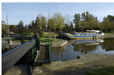
Le canal d'Ille-et-Rance