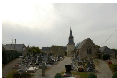
L'église de Saint-Symphorien IVR53_20053502841NUCA