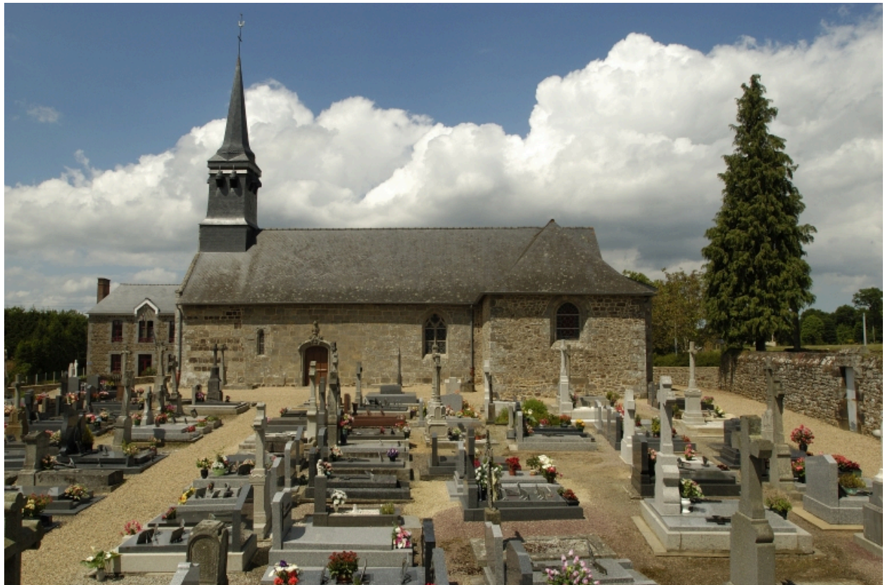
L'église de Bazouges-sous-Hédé