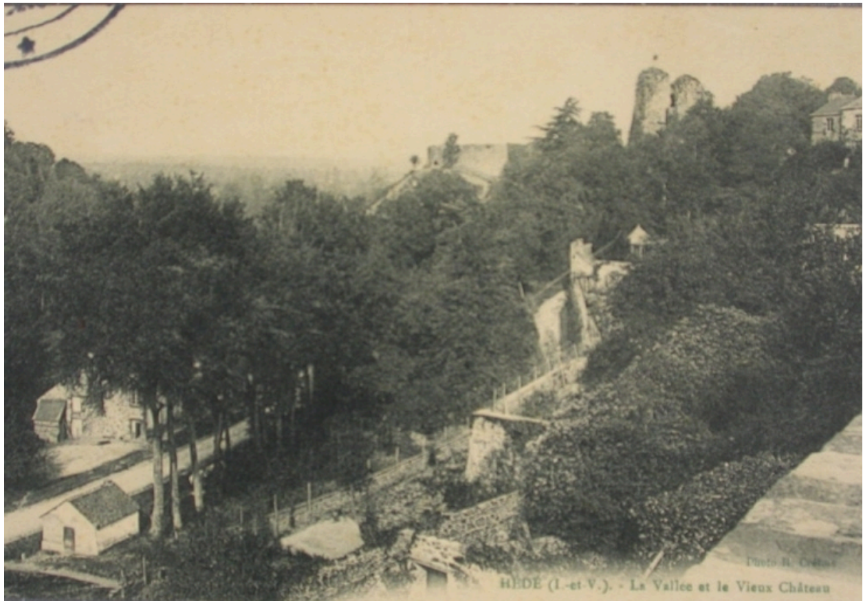
La vallée et le vieux château sur une carte postale ancienne