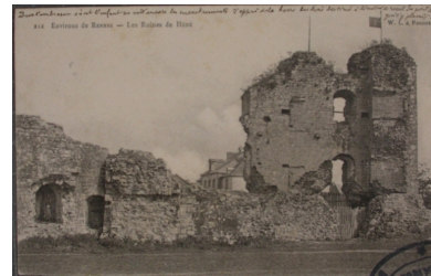
Les ruines du château sur une carte postale du début du 20e siècle IVR53_20053518373NUCA