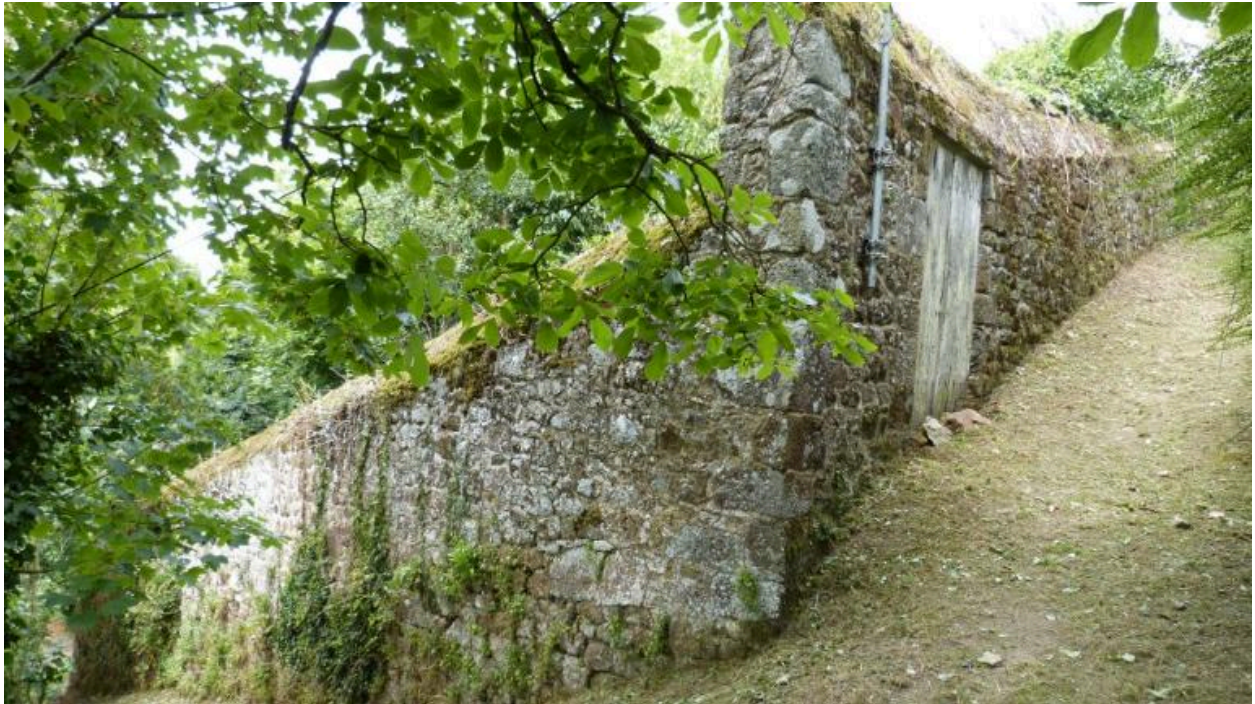
Chemin des Roquets (Hédé-Bazouges)