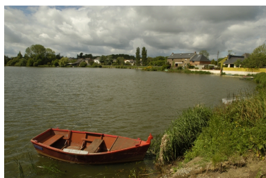
L'étang de Hédé