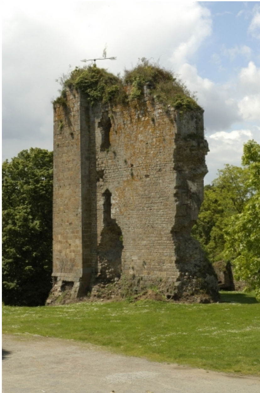
Vue générale du château de Hédé