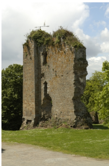
Vue générale du château de Hédé