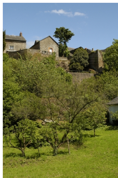
Vue depuis le chemin des Roquets