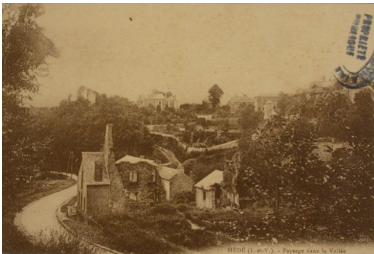
La vallée au début du 20e siècle