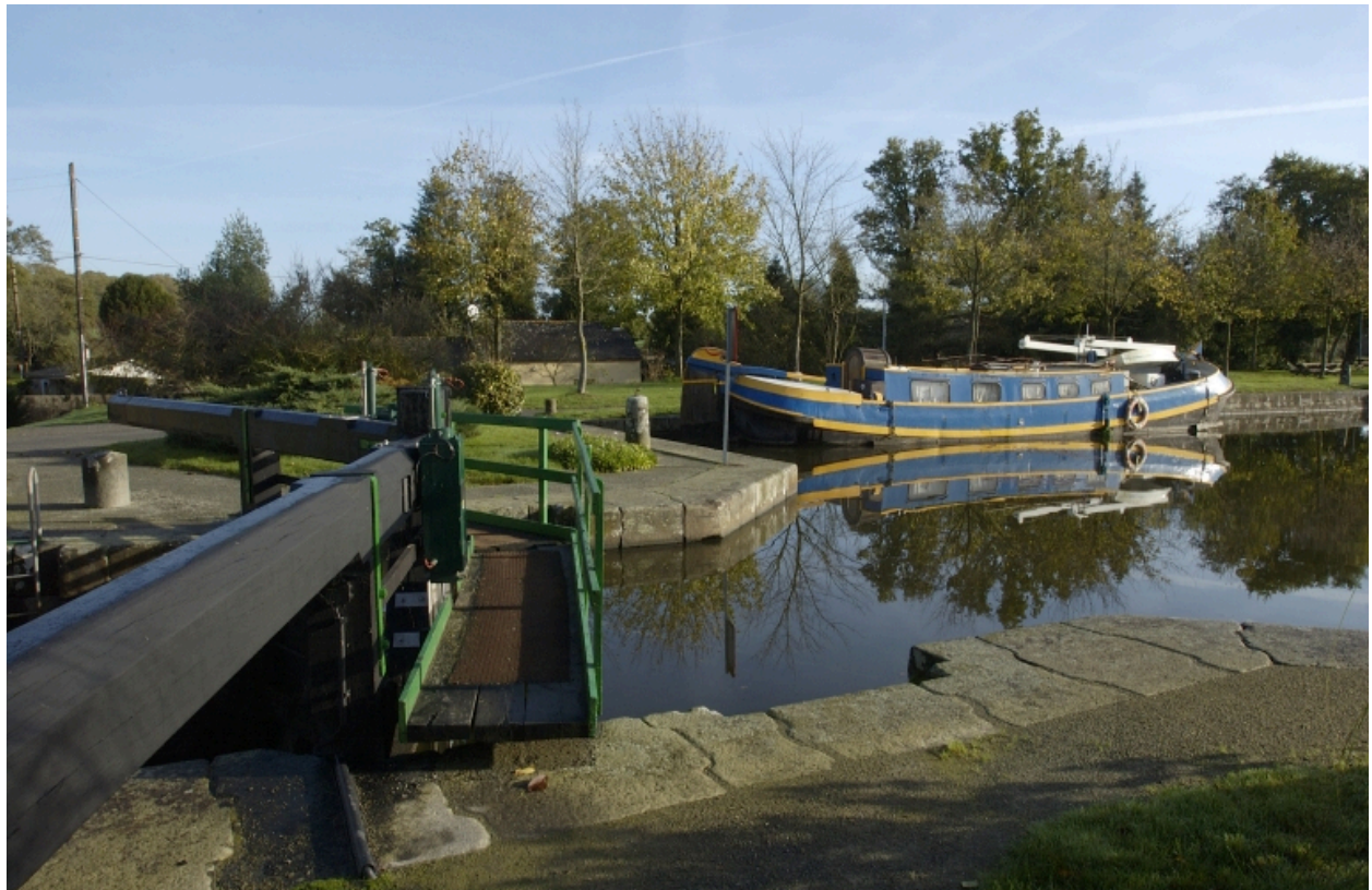
Le canal d'Ile-et-Rance