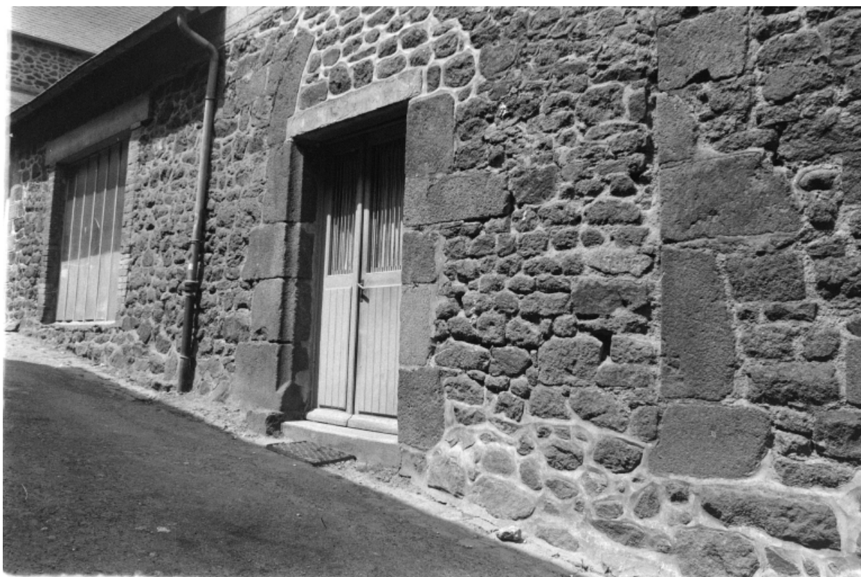
Ancien porche, ruelle du château