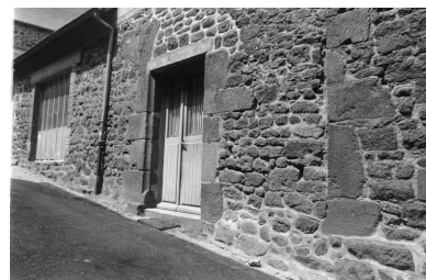
Ancien porche, ruelle du château