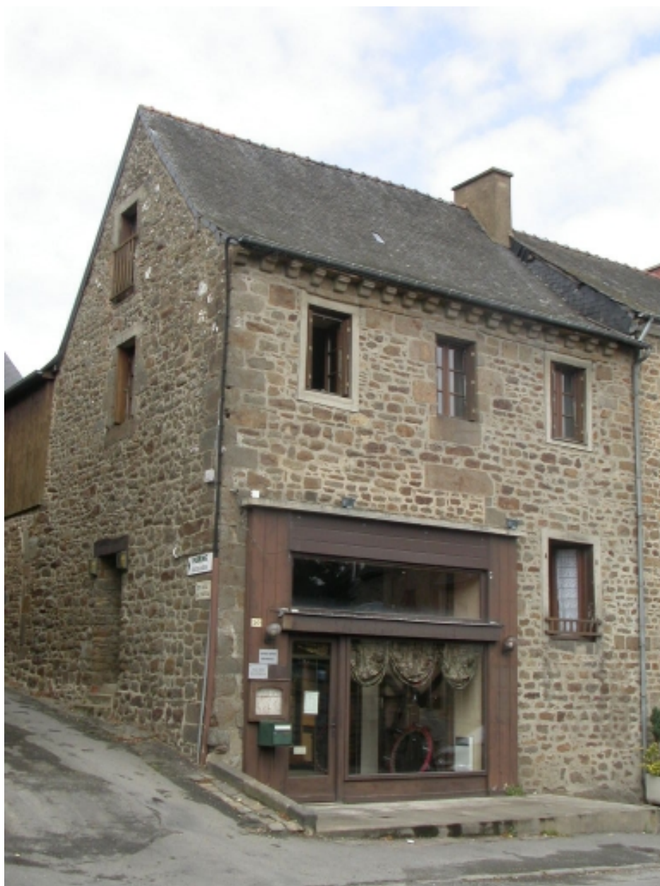
Vue générale sud-est