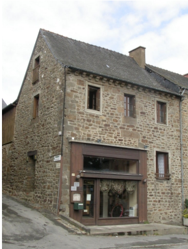
Vue générale sud-est IVR53_20053518298NUCA