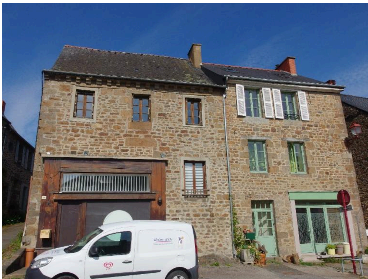
Vue de la façade est