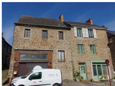
Vue de la façade est IVR53_20243532271NUCA