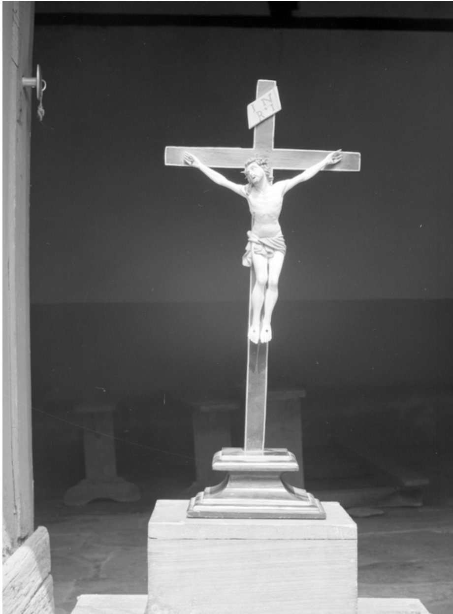
Croix d'autel (état en 1984)