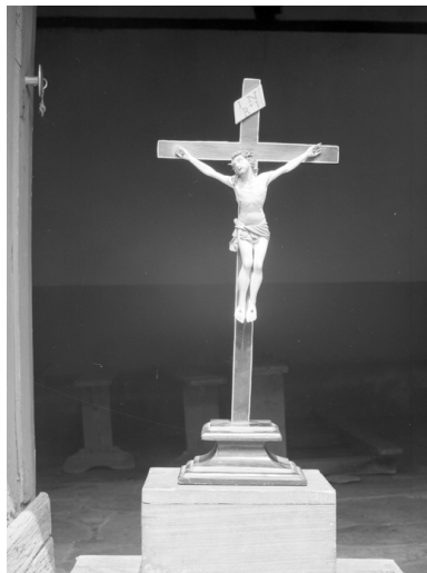
Croix d'autel (état en 1984) IVR53_19845601677X