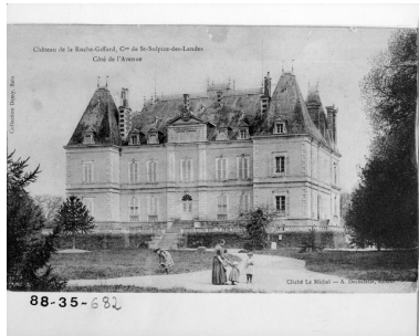
Façade sur jardin : vue générale IVR53_19883500682X