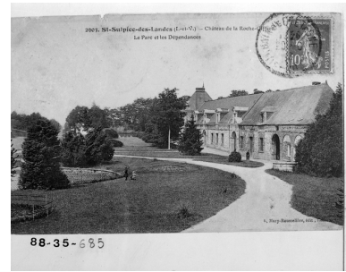
Le parc et les commons IVR53_19883500685X