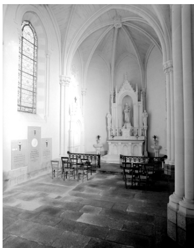
Intérieur : vue générale vers le chœur IVR53_19923500946X