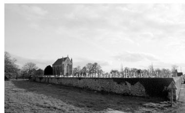
Élévation Nord-Ouest : vue de situation IVR53_19923500944X