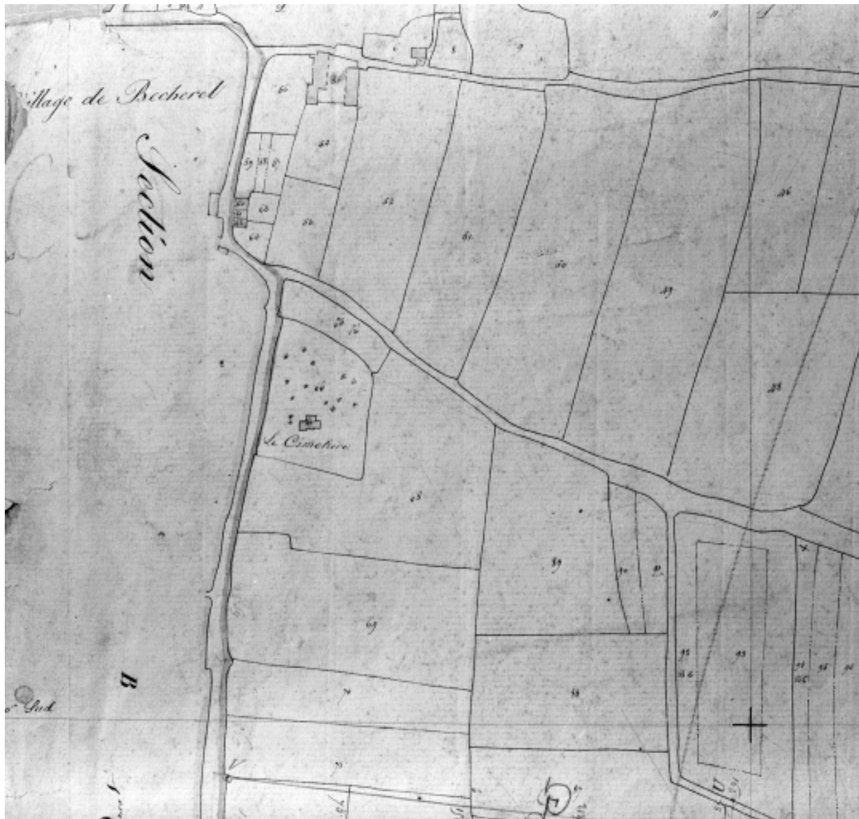
Extrait cadastral de 1834, section C1 n°67 (AD35 : 3 P 5477)