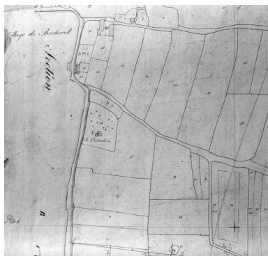
Extrait cadastral de 1834, section CI n°67 (AD35 : 3 P 5477) IVR53_19933500294X