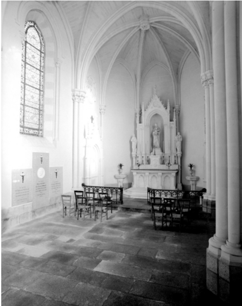
Intérieur : vue générale vers le choeur