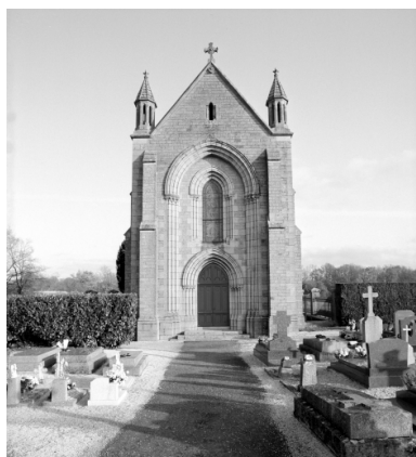
Élévation Ouest : vue générale, IVR53_19923500945X