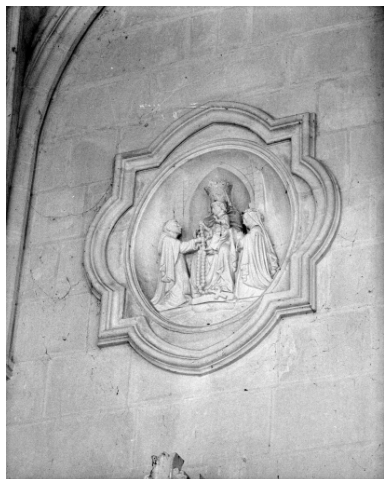
Intérieur, chœur, bas- relief droit : vue générale IVR53_19923500948X