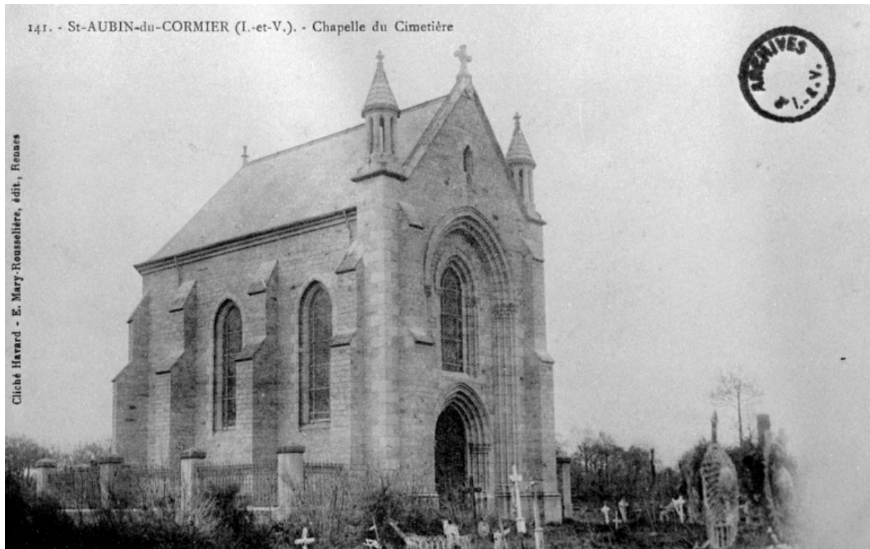
Elévation Nord-Ouest : vue générale (Carte postale ancienne, AD35 : 6Fi)