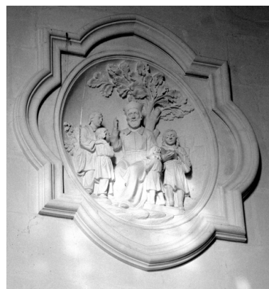
Intérieur, chœur, bas-relief gauche : vue générale IVR53_19923500947X