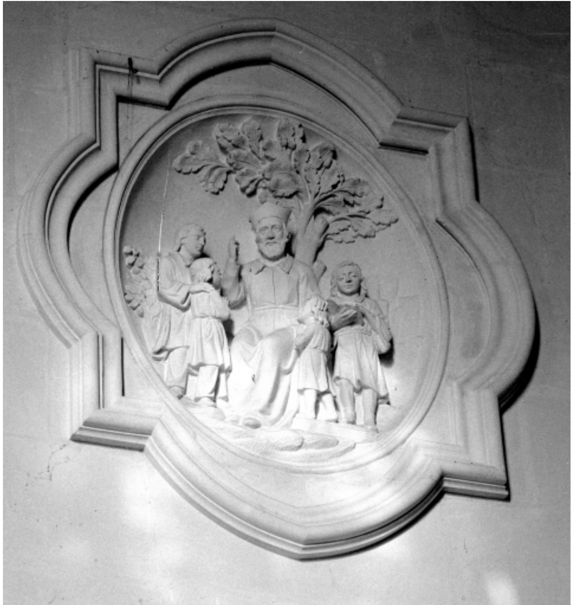
Intérieur, chœur, bas-relief gauche : vue générale