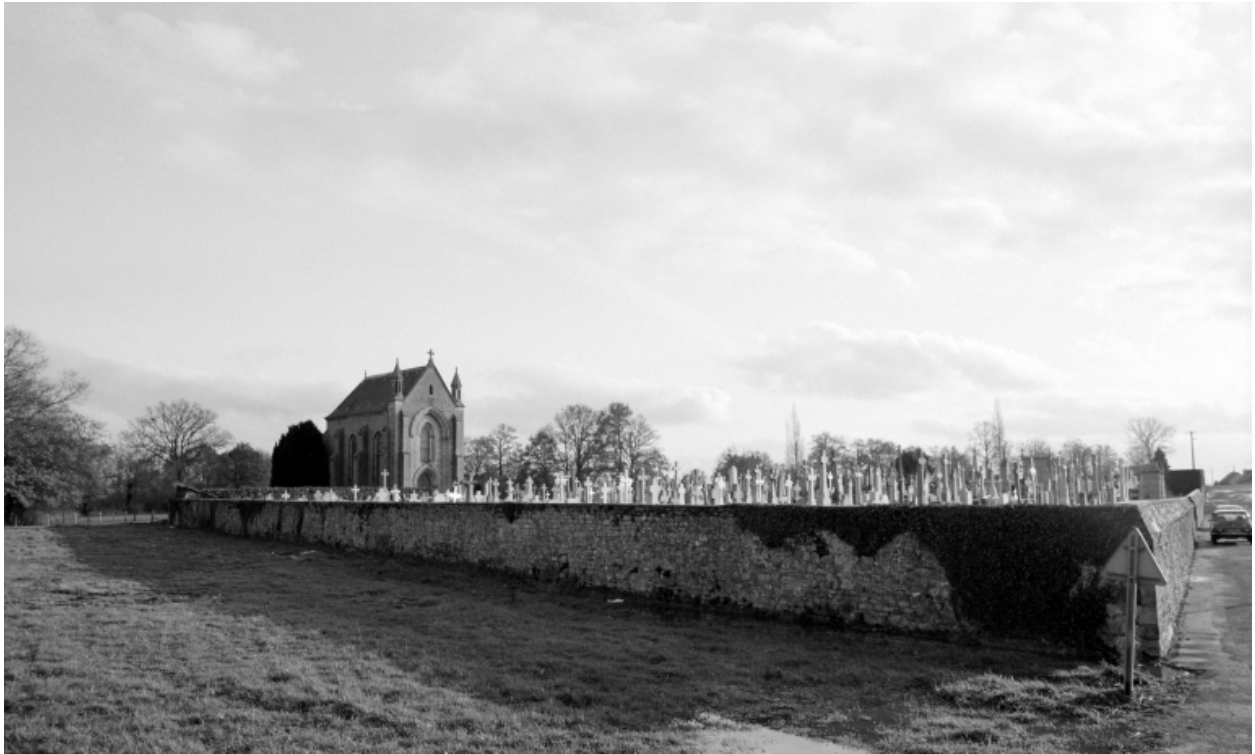
Elévation Nord-Ouest : vue de situation