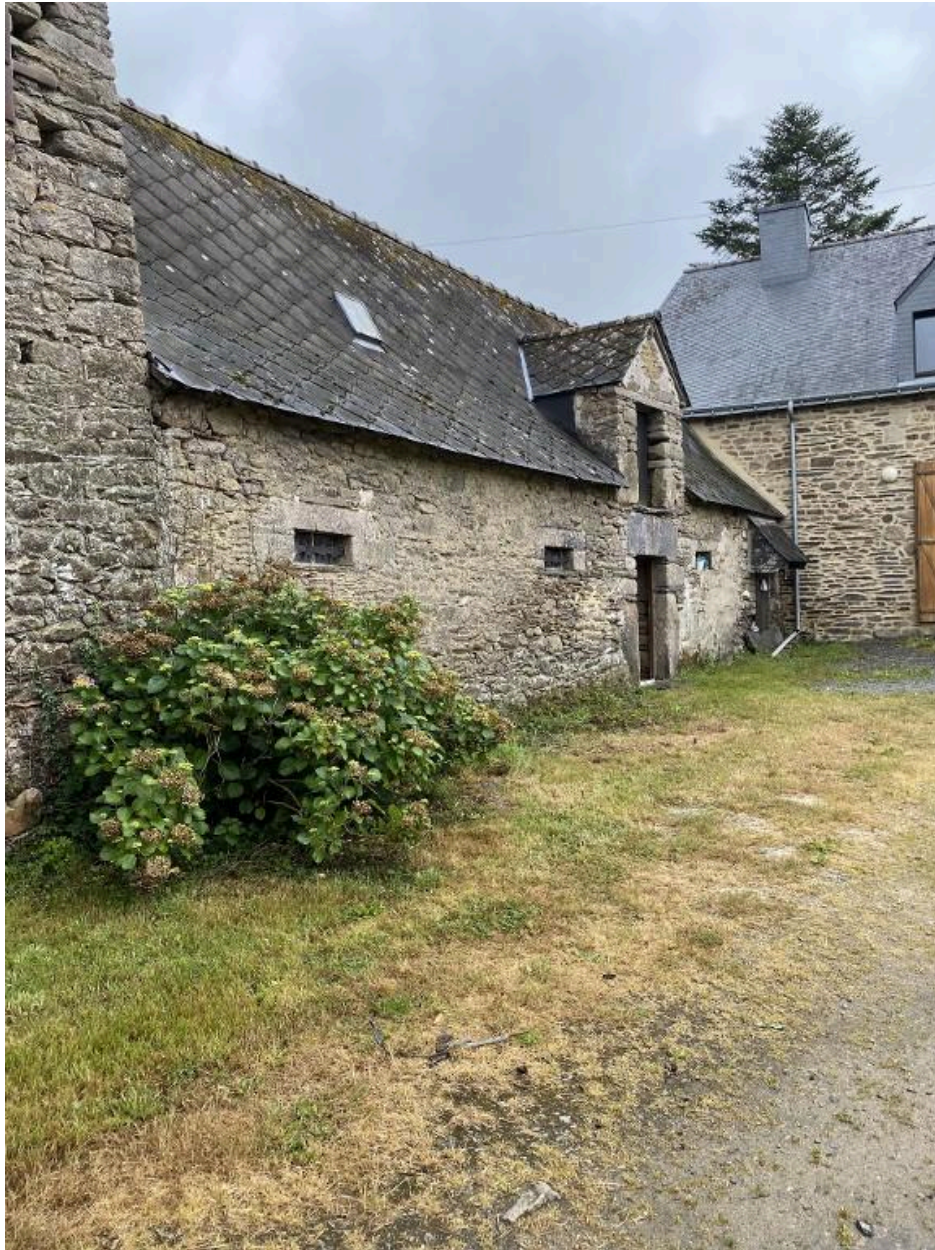
Dépendance, vue nord-est