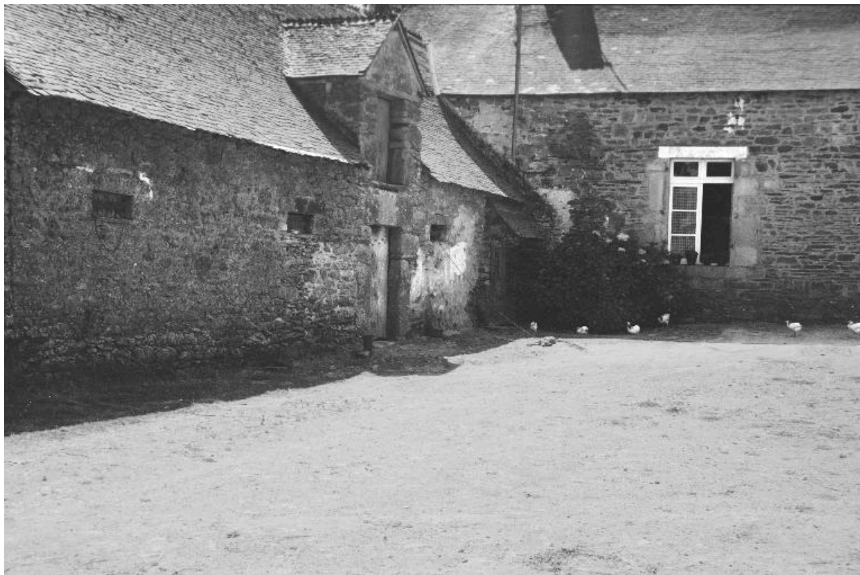
Manoir : dépendance vues depuis le nord-est (état en 1969)