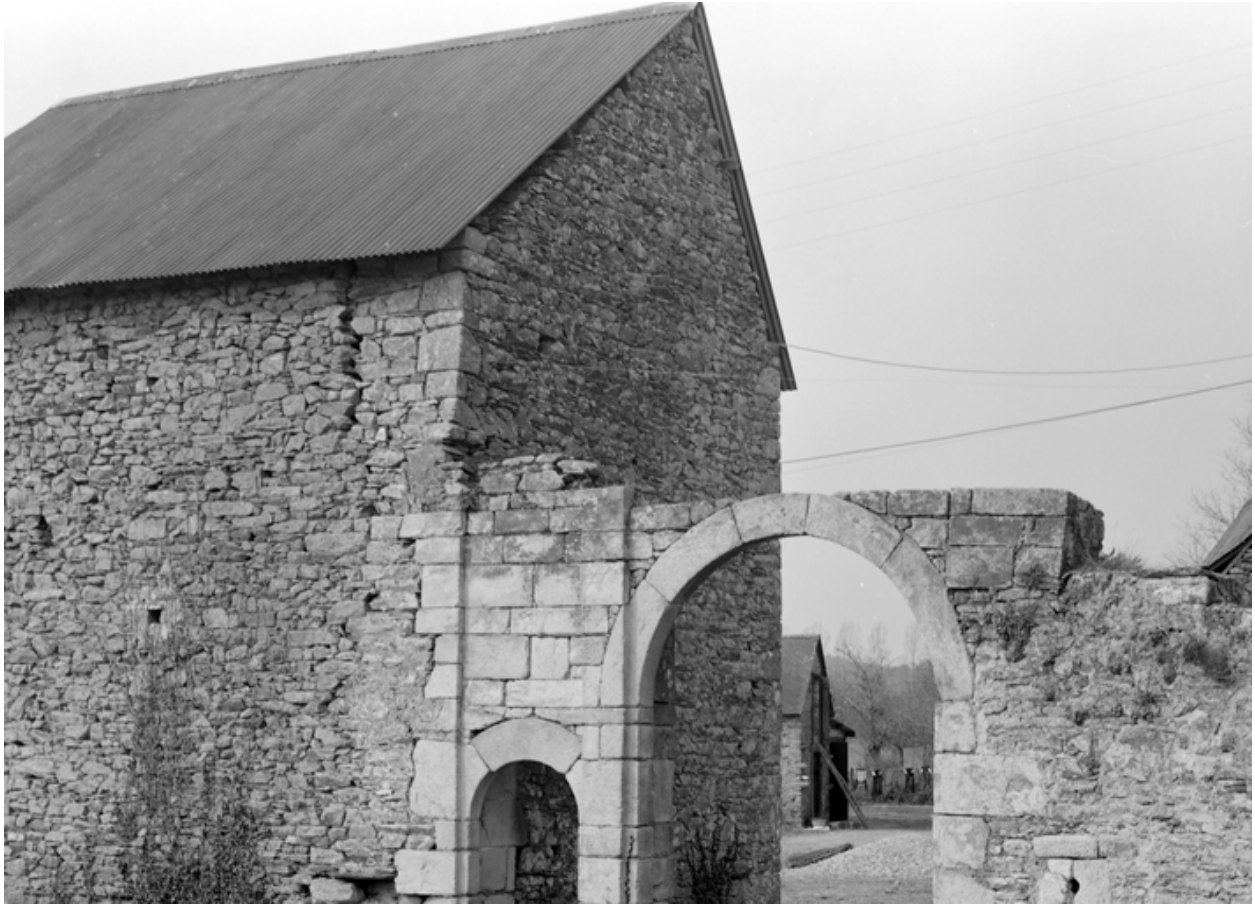
Manoir : le portail (état en 1984)