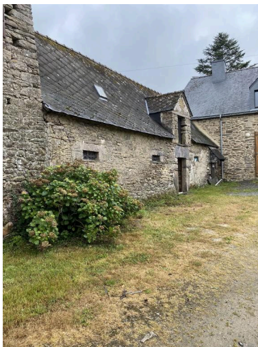
Dépendance, vue nord-est IVR53_20255610606NUCA