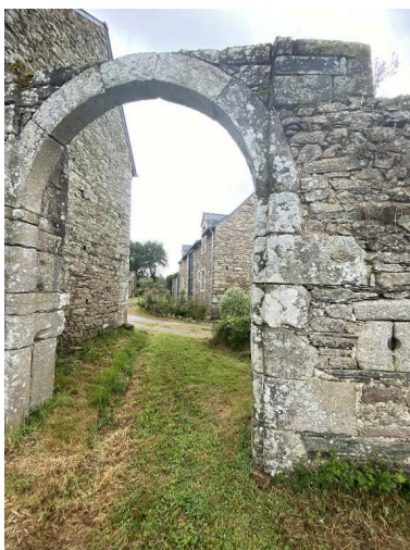
Le portail, vue sud IVR53_20255610613NUCA