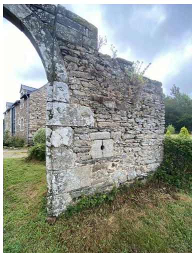
Meurtrière du portail, vue sud-ouest IVR53_20255610612NUCA