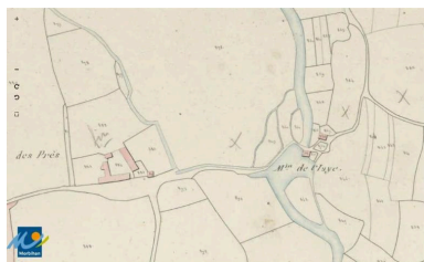
Le manoir sur le cadastre de 1823 (A. D. du Morbihan, 3 P 60/3) IVR53_20125608030NUCA