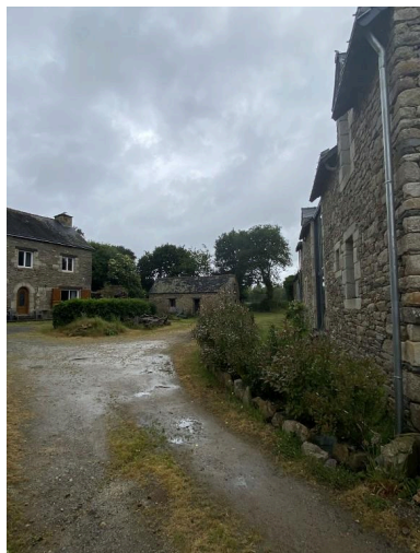
Vue sud-est IVR53_20255610618NUCA