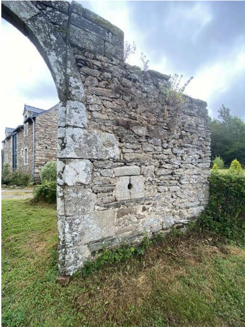
Meurtrière du portail, vue sud-ouest