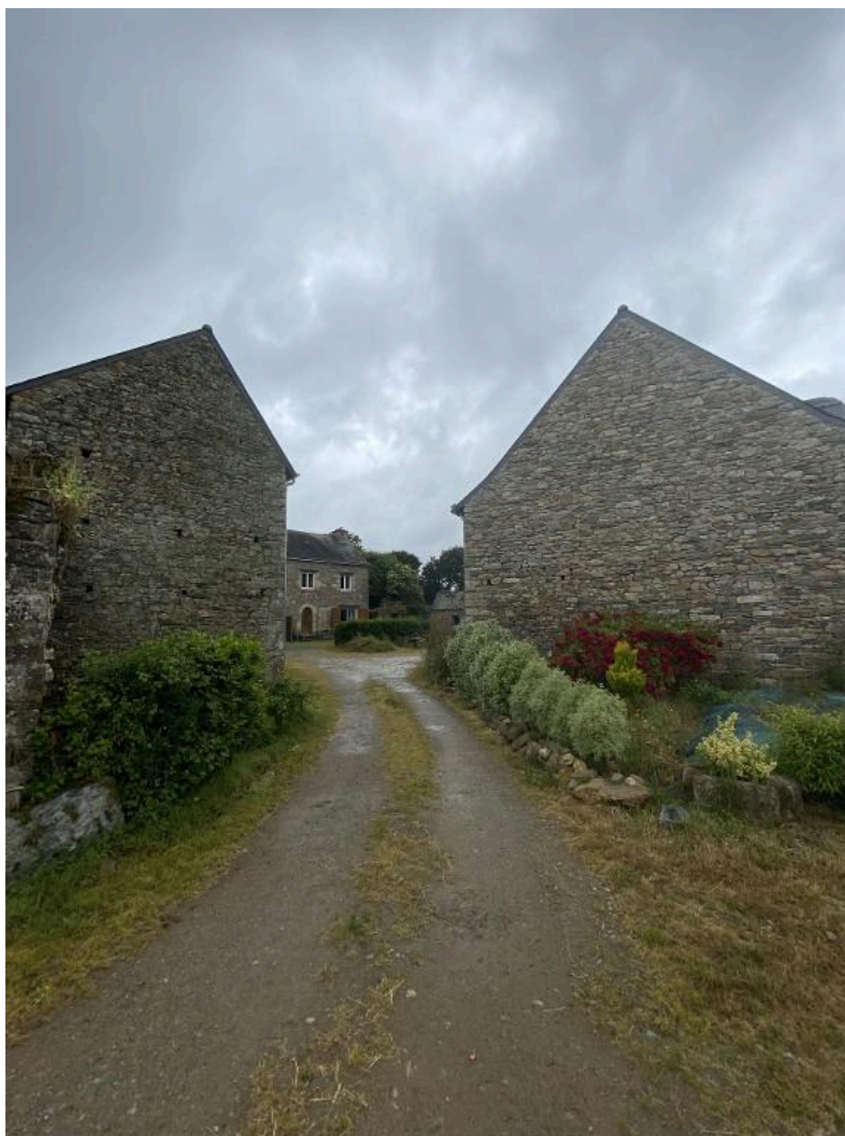
Vue sud-est de l'entrée