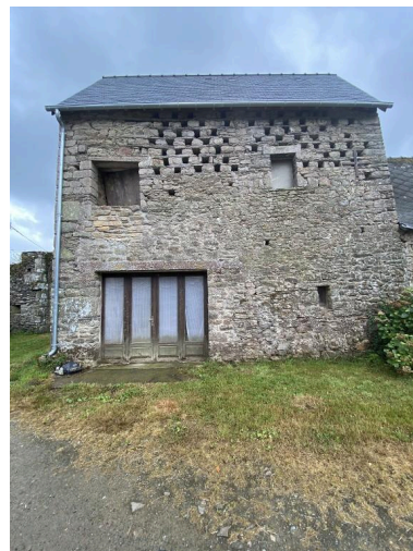
Vue nord, présence de plusieurs rangées de boulines IVR53_20255610607NUCA