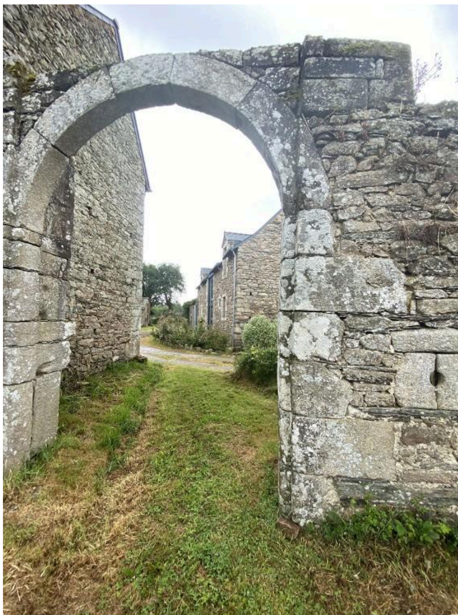
Le portail, vue sud