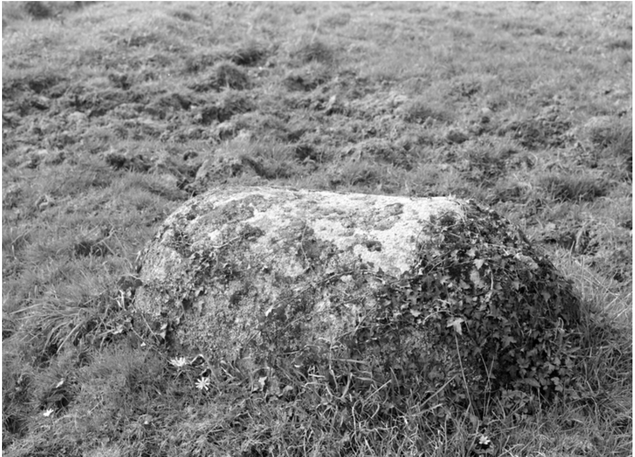
Stèle gauloise (état en 1984)