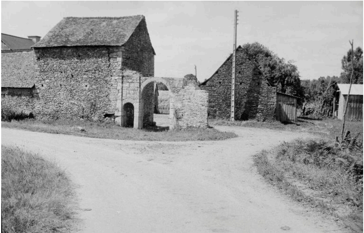
Manoir : vue rapprochée (état en 1969)