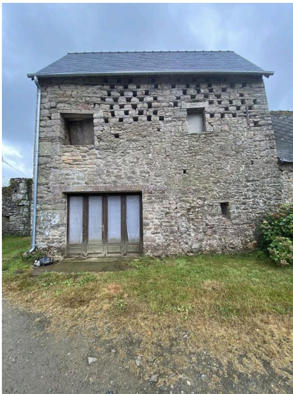
Vue nord, présence de plusieurs rangées de boulins