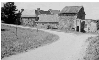
Manoir (état en 1969) IVR53_19895600002Z