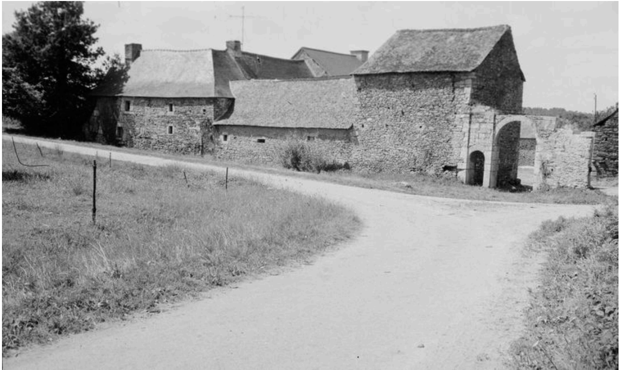
Manoir (état en 1969)