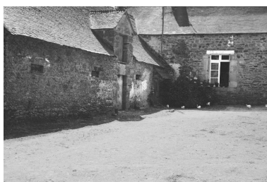
Manoir : dépendance vues depuis le nord-est (état en 1969) IVR53_20115601329Z