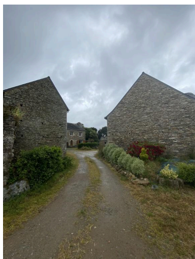
Vue sud-est de l'entrée