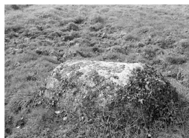
Stèle gauloise (état en 1984)