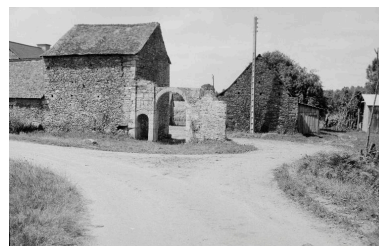
Manoir : vue rapprochée (état en 1969) IVR53_20115601328Z