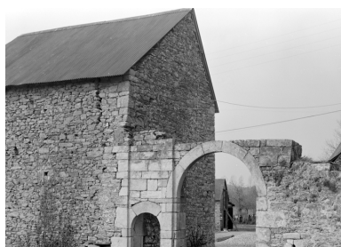
Manoir : le portail (état en 1984)