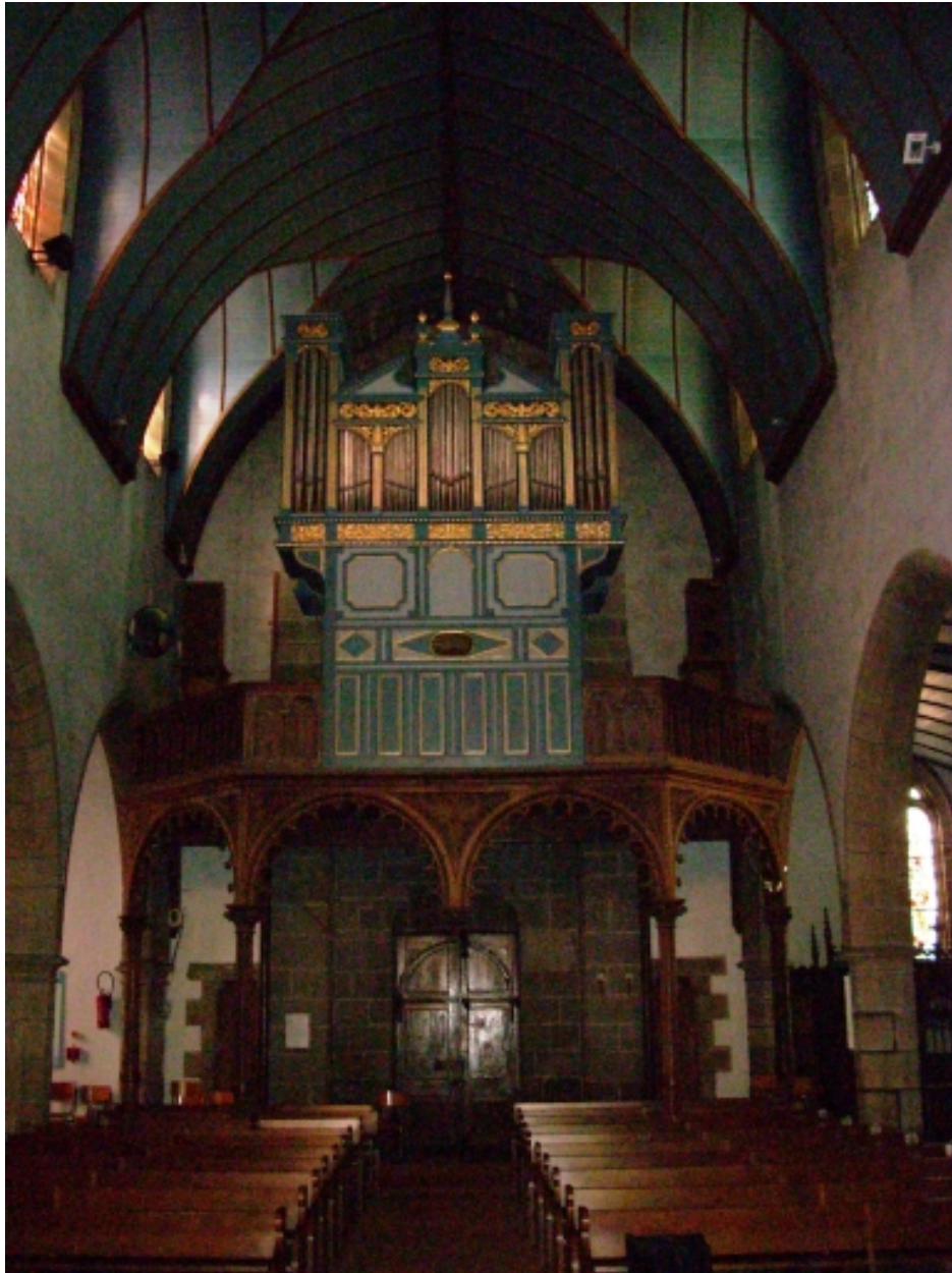
Crozon, église paroissiale Saint-Pierre : tribune et orgue