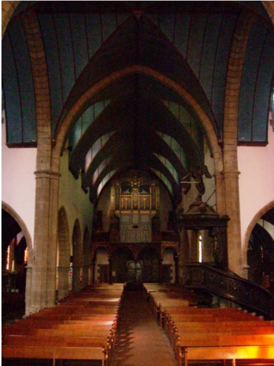
Crozon, église paroissiale Saint-Pierre : vue axiale ouest