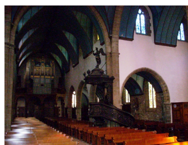
Crozon, église paroissiale Saint-Pierre : vue transversale nord-ouest IVR53_20082905856NUCA