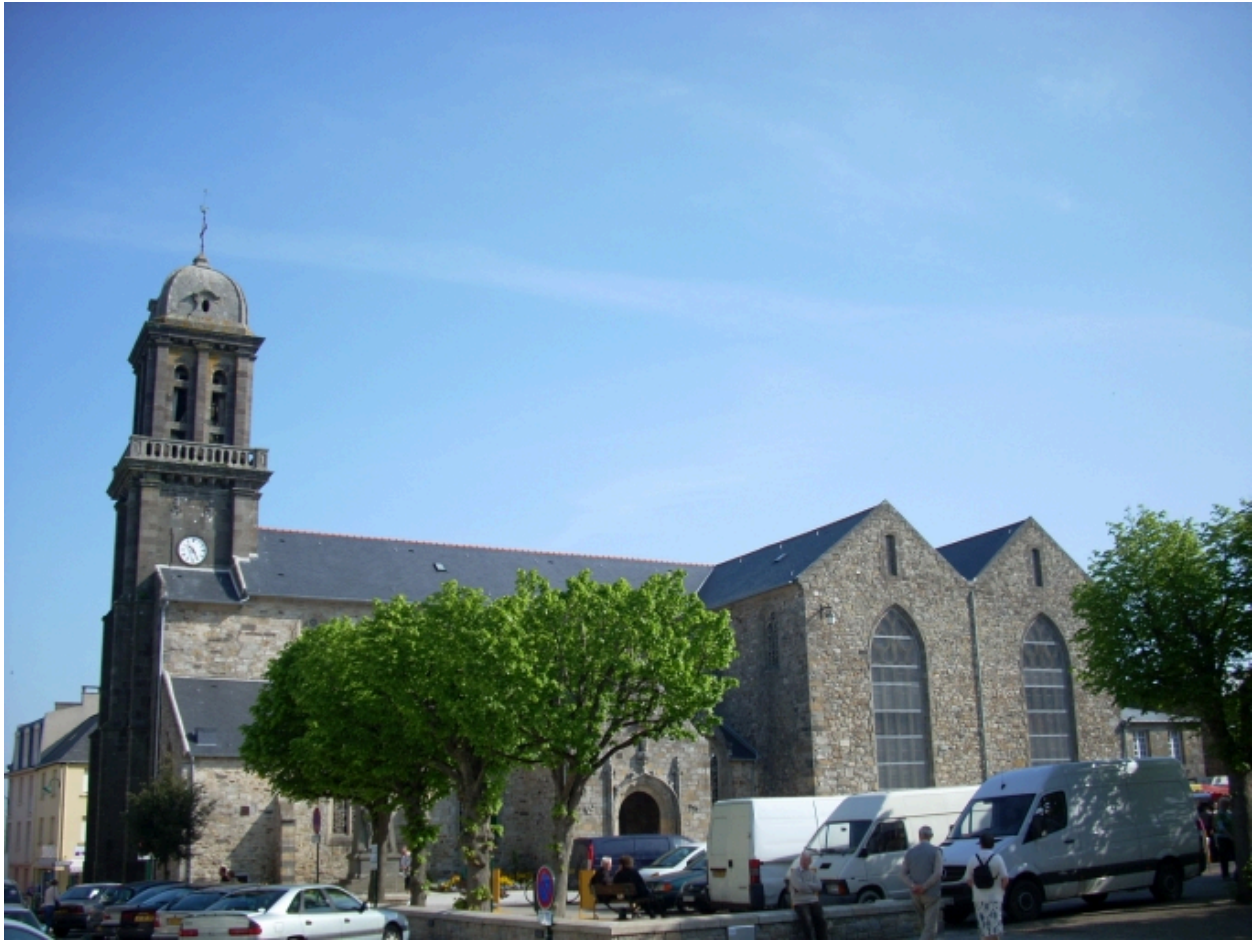
Crozon, église paroissiale Saint-Pierre : vue générale sud-ouest