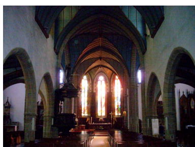
Crozon, église paroissiale Saint-Pierre : vue axiale est IVR53_20082905854NUCA