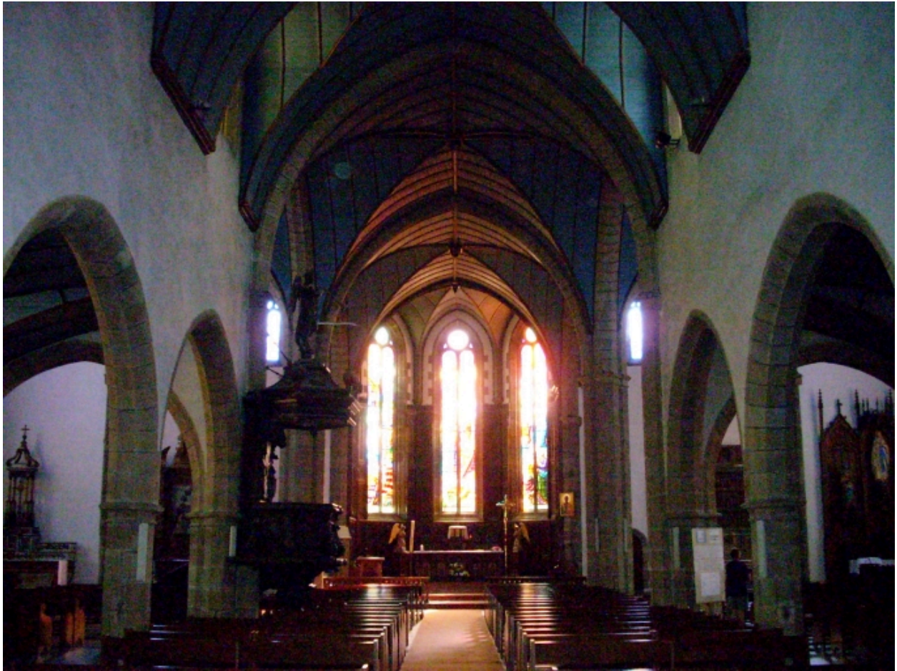
Crozon, église paroissiale Saint-Pierre : vue axiale est