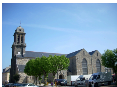
Crozon, église paroissiale Saint-Pierre : vue générale sud-ouest IVR53_20082905851NUCA