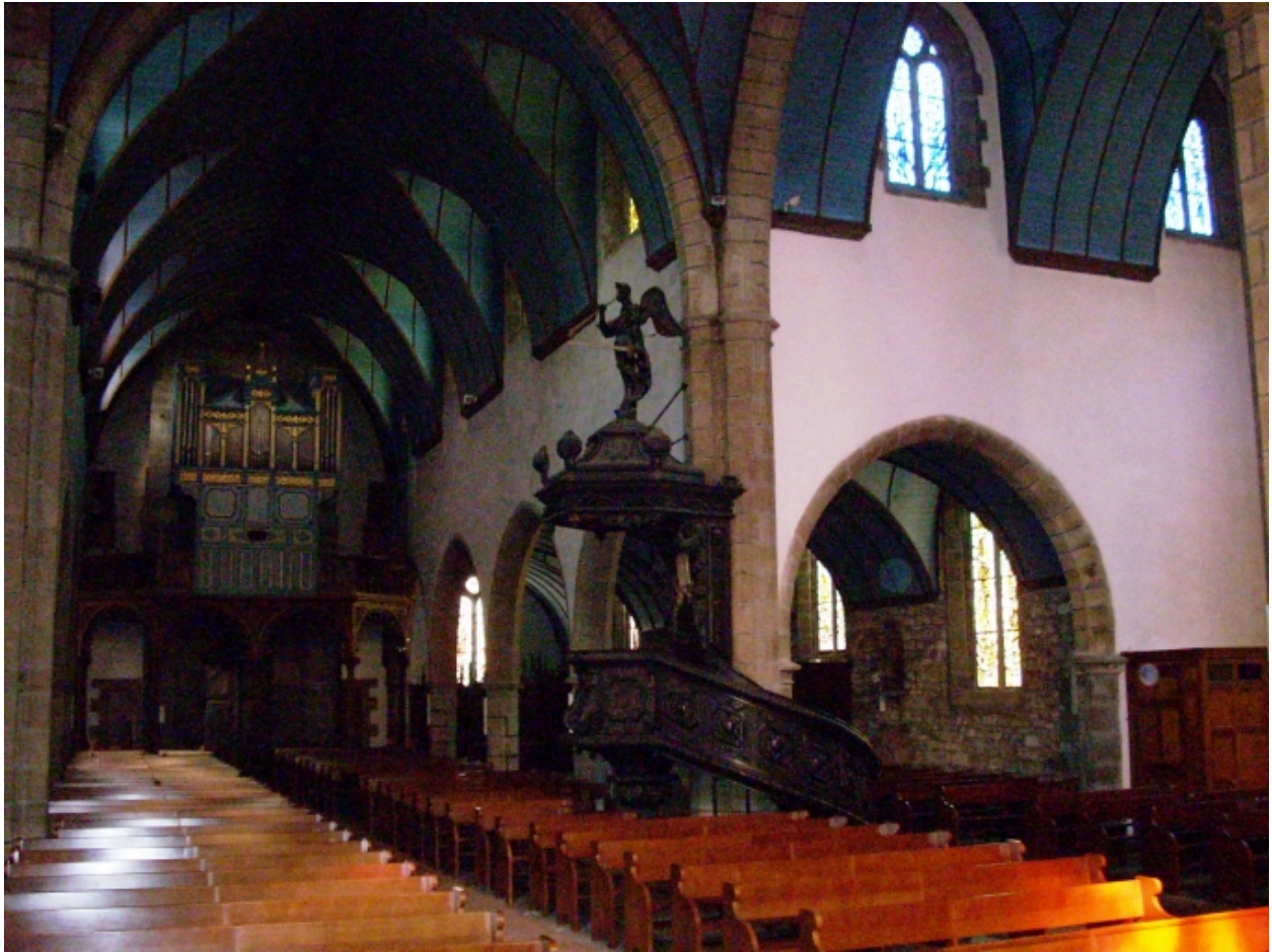
Crozon, église paroissiale Saint-Pierre : vue transversale nord-ouest