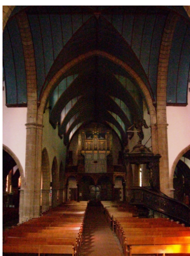
Crozon, église paroissiale Saint-Pierre : vue axiale ouest