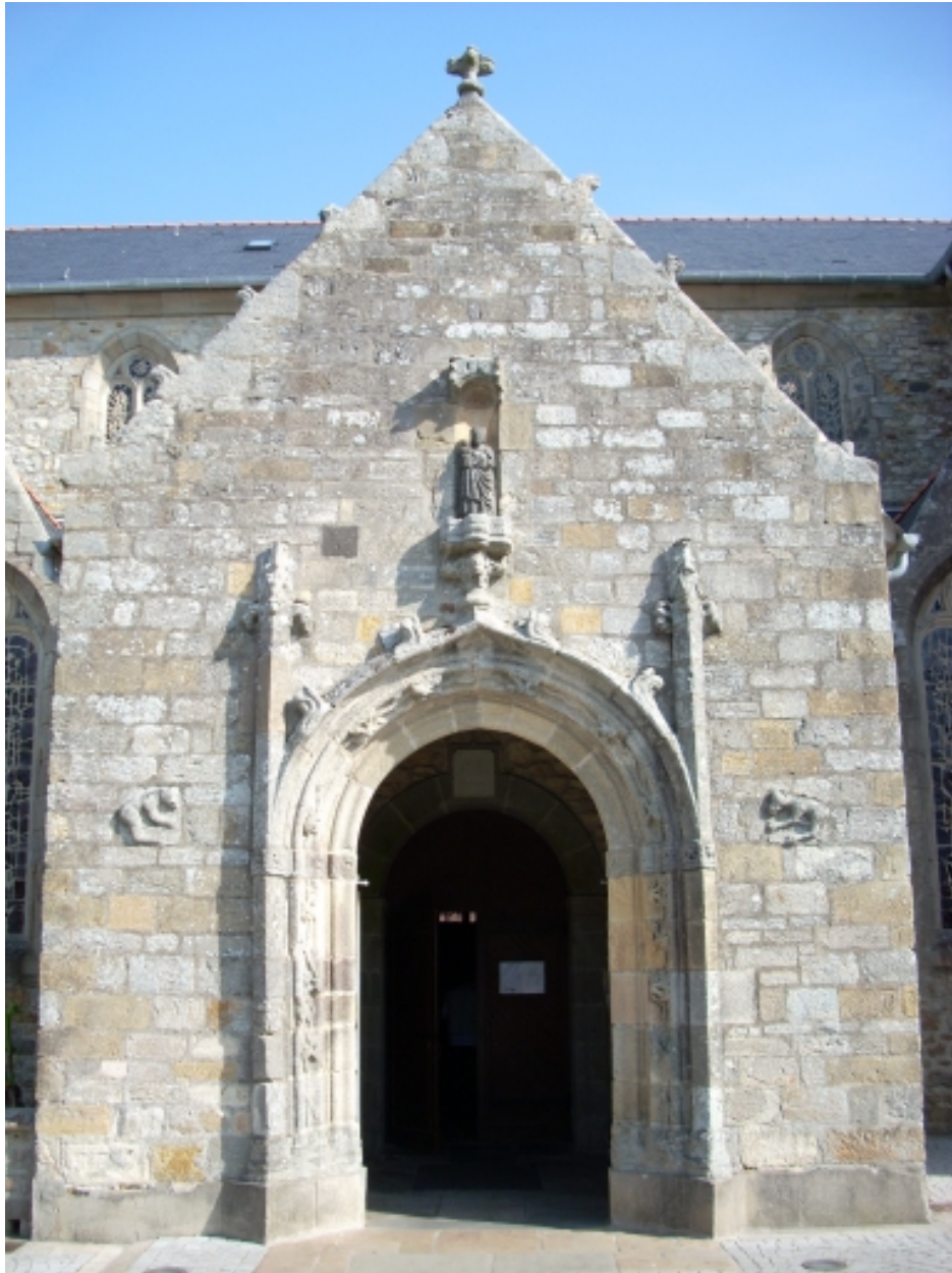
Crozon, église paroissiale Saint-Pierre : porche sud