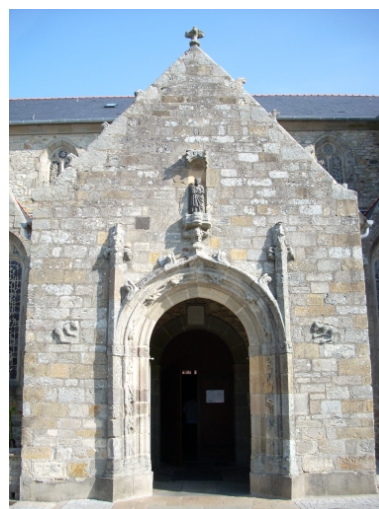
Crozon, église paroissiale Saint-Pierre : porche sud