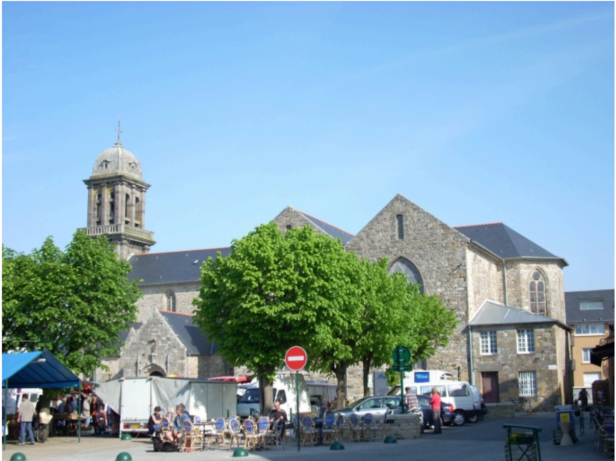
Crozon, église paroissiale Saint-Pierre : vue générale sud-est