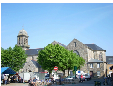
Crozon, église paroissiale Saint-Pierre : vue générale sud-est IVR53_20082905852NUCA