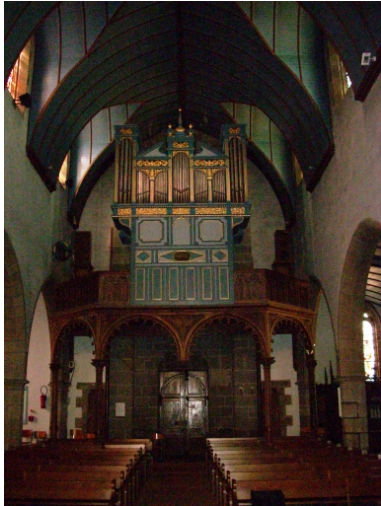
Crozon, église paroissiale Saint-Pierre : tribune et orgue IVR53_20082905857NUCA