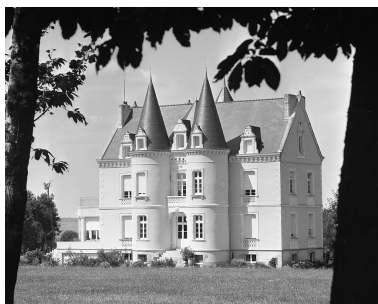
Vue générale sud, IVR53_19935601937X