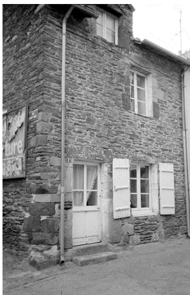
Maison (état en 1969) IVR53_20115600982Z