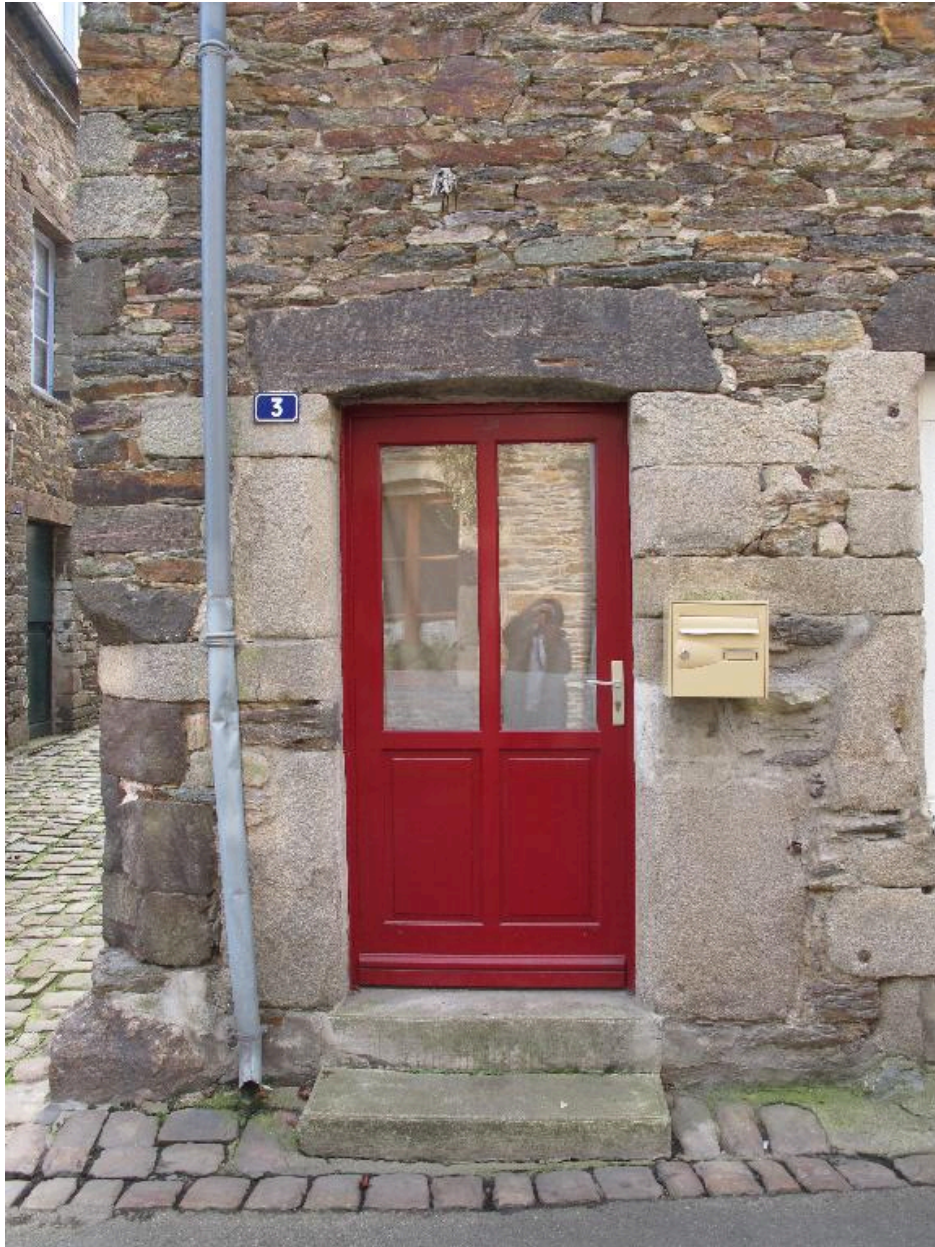
Vue rapprochée de la porte