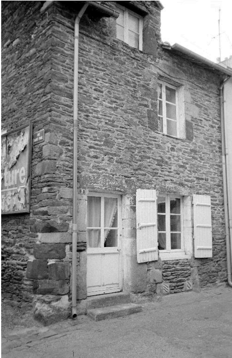
Maison (état en 1969)