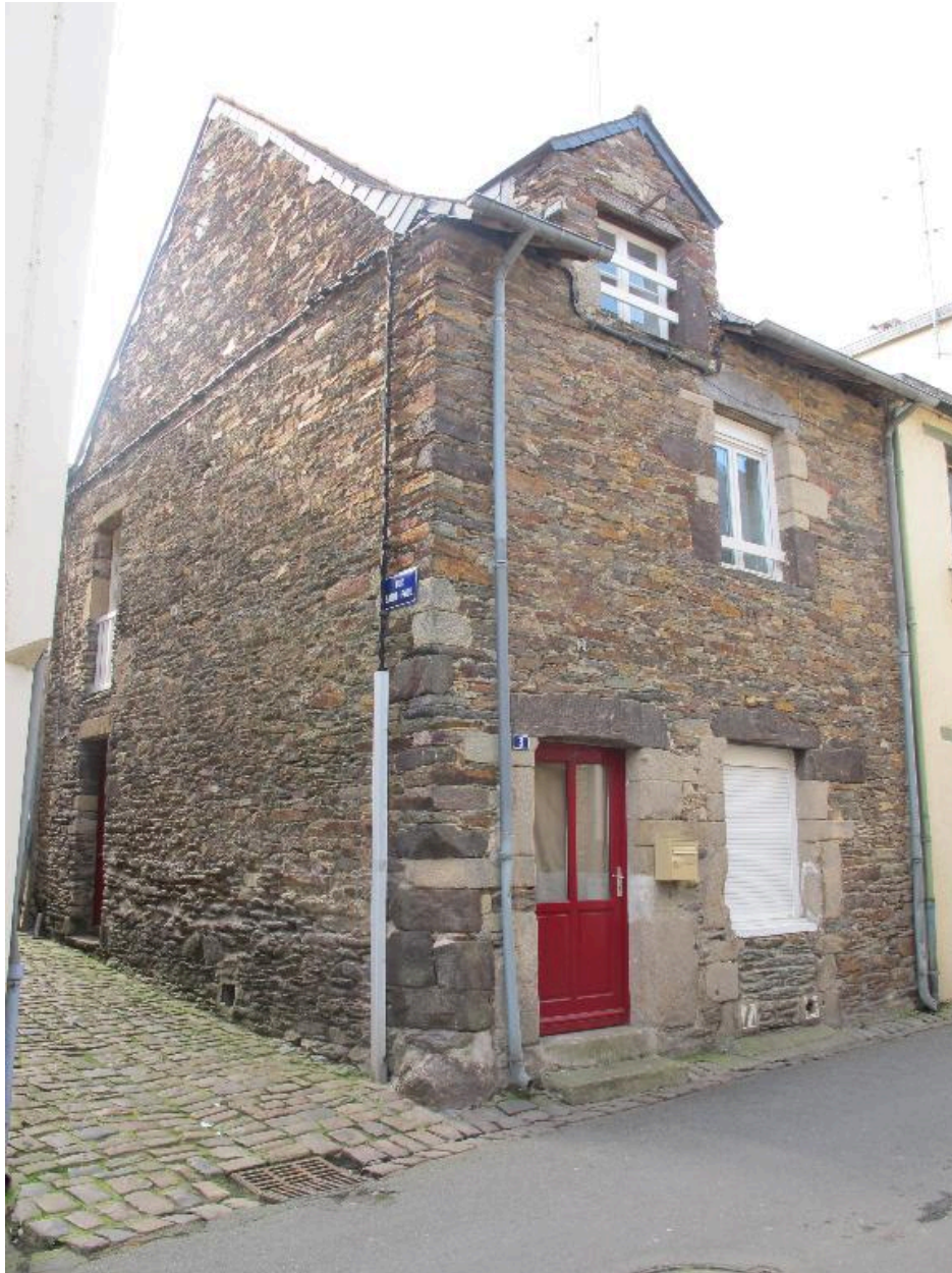
Vue générale de la maison