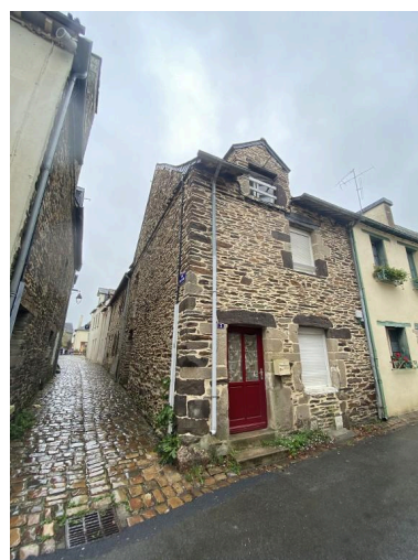
Façade nord IVR53_20265610636NUCA