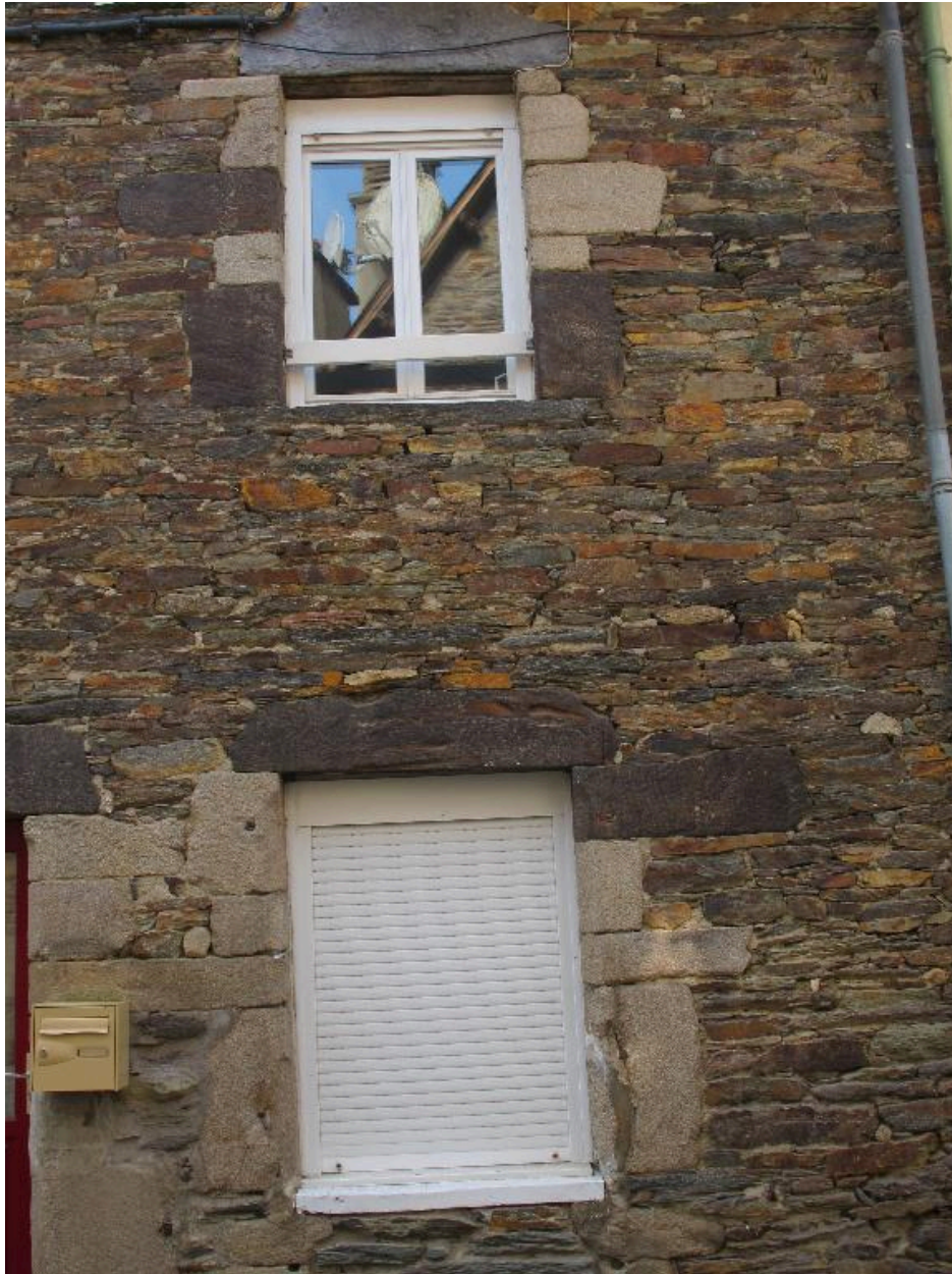
Vue rapprochée de l'élévation de la maison