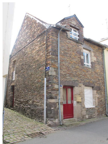
Vue générale de la maison