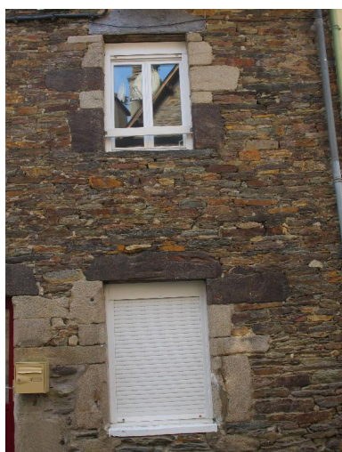
Vue rapprochée de l'élévation de la maison