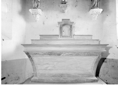
Maître-autel (état en 1984)