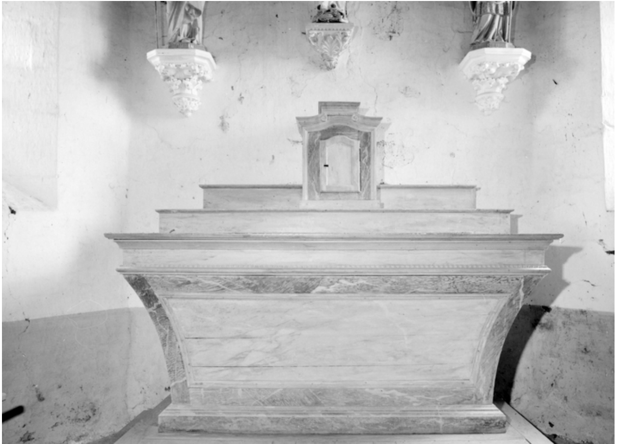
Maître-autel (état en 1984)